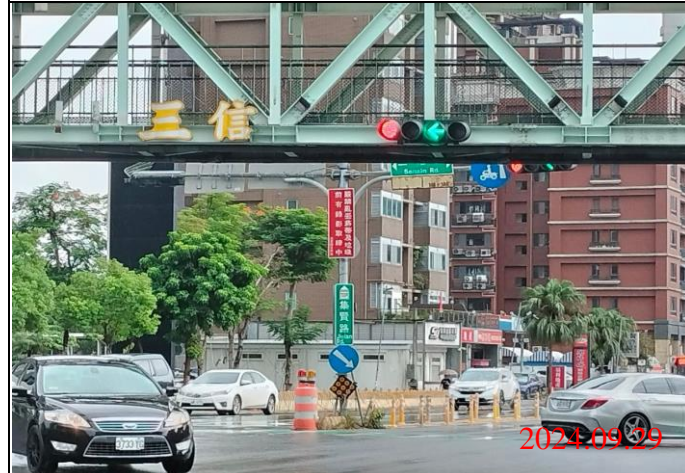
巡查日期地點：113.09.29/ Y23車站 照片說明：牌面設置狀況