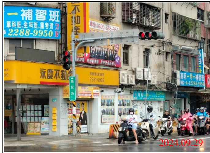
巡查日期地點：113.09.29/ Y21車站 照片說明：牌面設置狀況