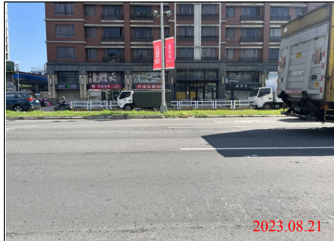
巡查日期地點：112.08.21/ Y23車站 照片說明：路面龜裂狀況