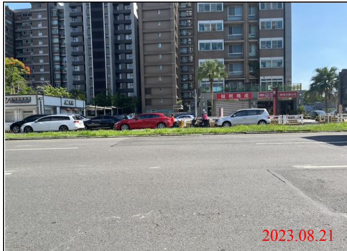
巡查日期地點：112.08.21/ Y23車站 照片說明：路面龜裂狀況