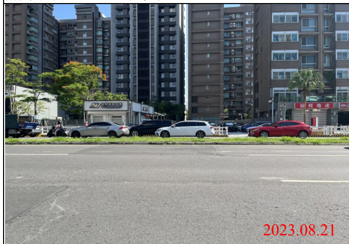
巡查日期地點：112.08.21/ Y23車站 照片說明：路面龜裂狀況