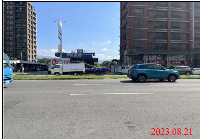
巡查日期地點：112.08.21/ Y23車站 照片說明：路面龜裂狀況