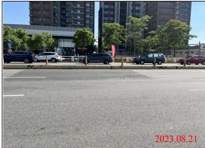
巡查日期地點：112.08.21/ Y23車站 照片說明：路面龜裂狀況