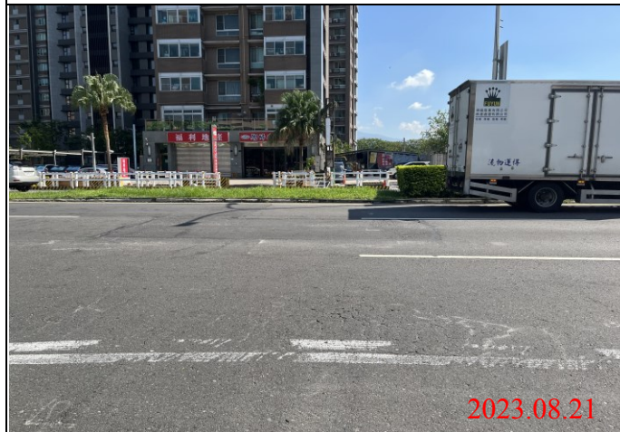
巡查日期地點：112.08.21/ Y23車站 照片說明：路面龜裂狀況