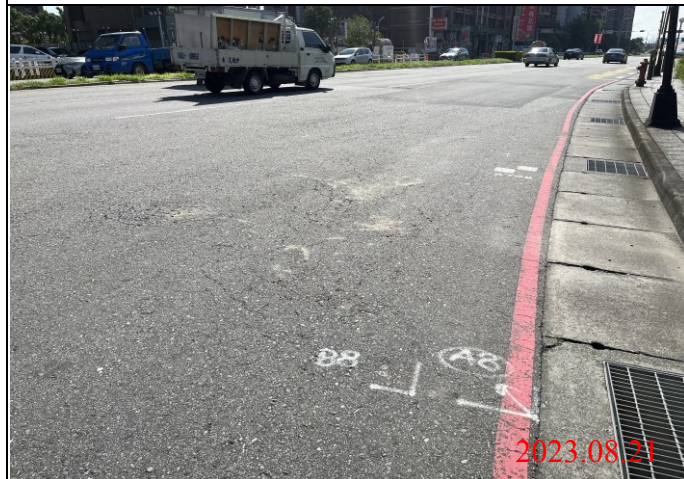
巡查日期地點：112.08.21/ Y23車站 照片說明：路面龜裂狀況