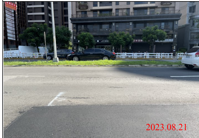
巡查日期地點：112.08.21/ Y23車站 照片說明：路面龜裂狀況