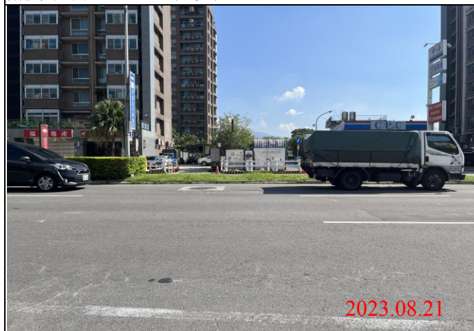
巡查日期地點：112.08.21/ Y23車站 照片說明：路面龜裂狀況