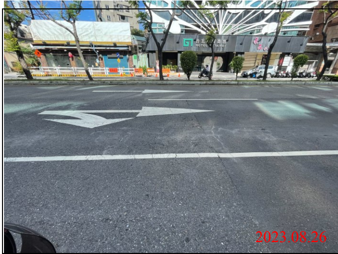
巡查日期地點：112.08.26/ Y21車站 照片說明：路面龜裂狀況