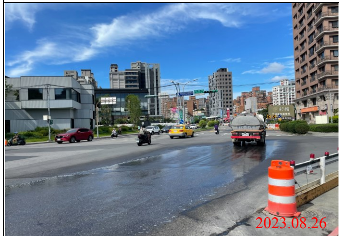
巡查日期地點：112.08.26/ Y22車站 照片說明：牌面設置狀況