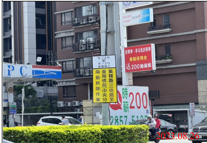
巡查日期地點：112.08.26/ Y23車站 照片說明：牌面設置狀況