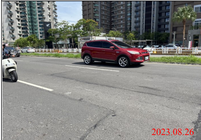
巡查日期地點：112.08.26/ Y23車站 照片說明：路面龜裂狀況