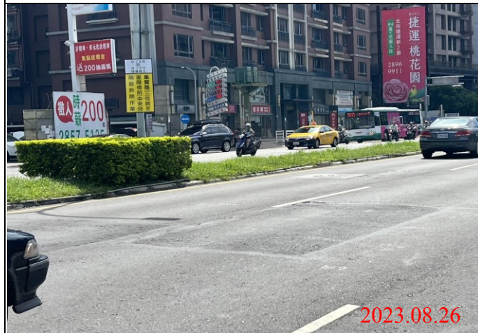
巡查日期地點：112.08.26/ Y23車站 照片說明：路面龜裂狀況