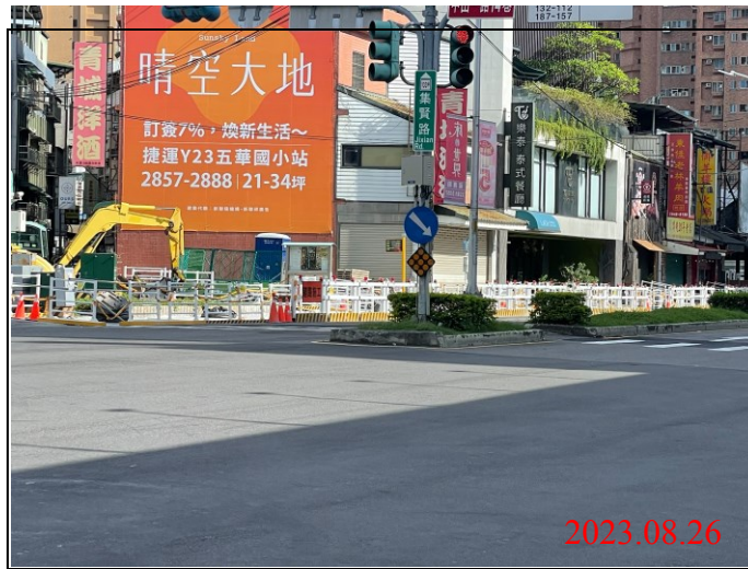
巡查日期地點：112.08.26/ Y21車站 照片說明：牌面設置狀況