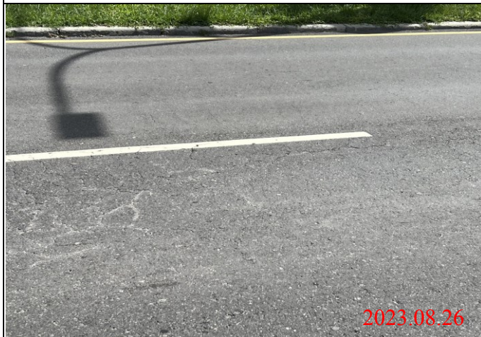
巡查日期地點：112.08.26/ Y23車站 照片說明：路面龜裂狀況