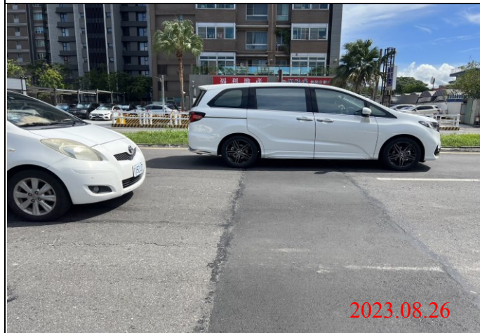
巡查日期地點：112.08.26/ Y23車站 照片說明：路面龜裂狀況