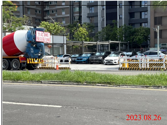
巡查日期地點：112.08.26/ Y23車站 照片說明：路面龜裂狀況