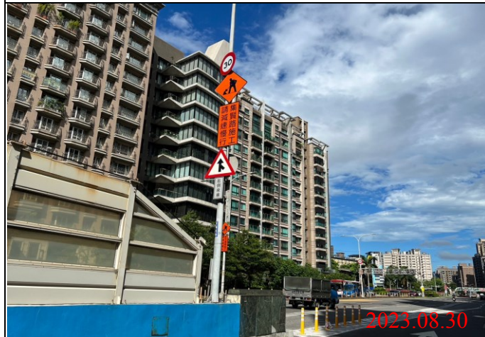
巡查日期地點：112.08.30/ Y23車站 照片說明：牌面設置狀況