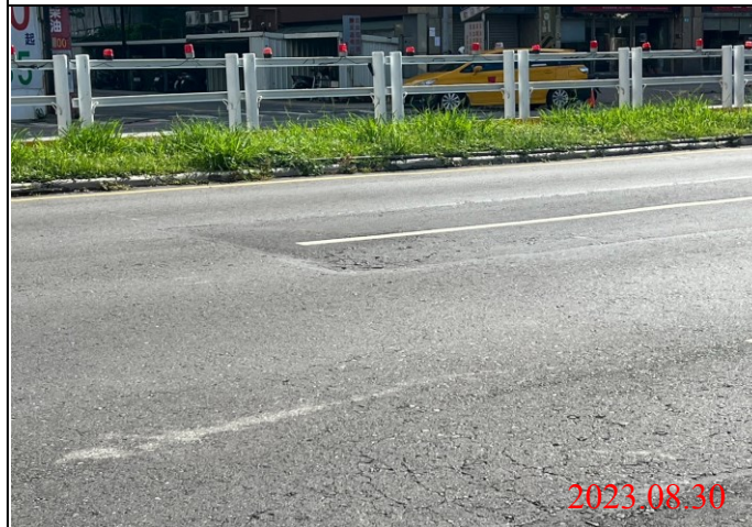
巡查日期地點：112.08.30/ Y23車站 照片說明：路面龜裂狀況