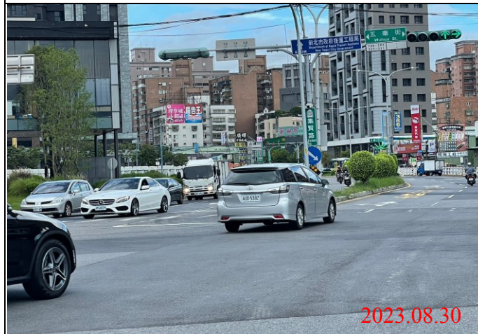
巡查日期地點：112.08.30/ Y22車站 照片說明：牌面設置狀況