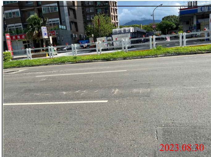
巡查日期地點：112.08.30/ Y23車站 照片說明：路面龜裂狀況