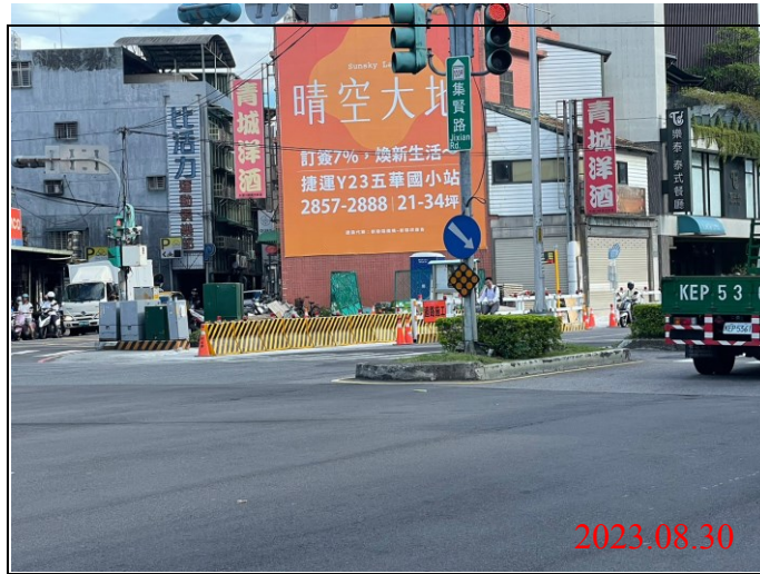
巡查日期地點：112.08.30/ Y21車站 照片說明：牌面設置狀況