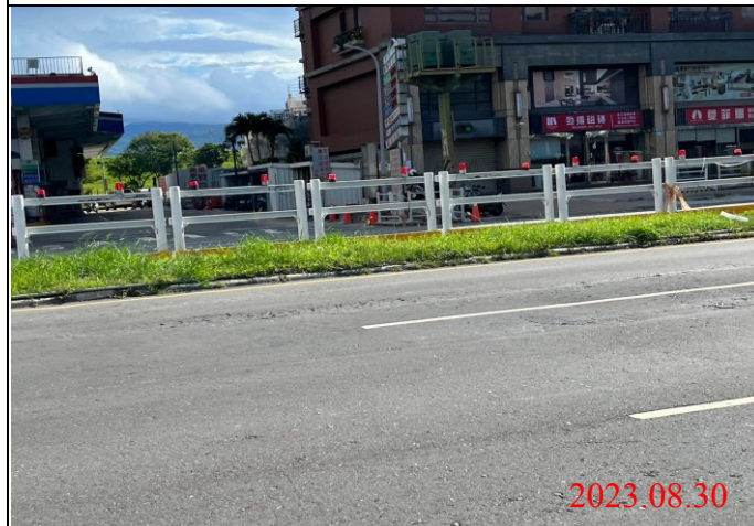
巡查日期地點：112.08.30/ Y23車站 照片說明：路面龜裂狀況