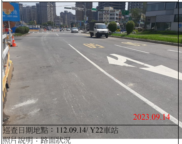
巡查日期地點：112.09.14/ Y22車站 照片說明：路面狀況