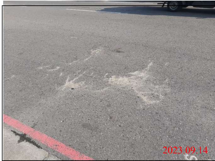
巡查日期地點：112.09.14/ Y23車站 照片說明：路面龜裂狀況