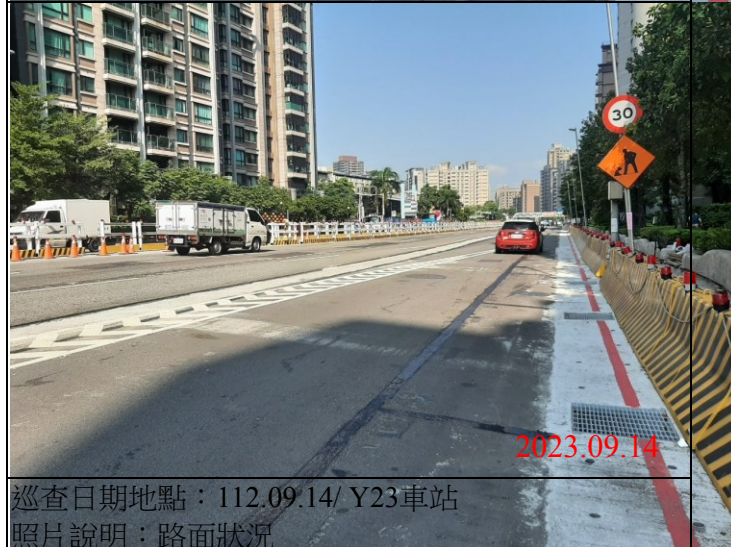
巡查日期地點：112.09.14/ Y23車站 照片說明：路面狀況