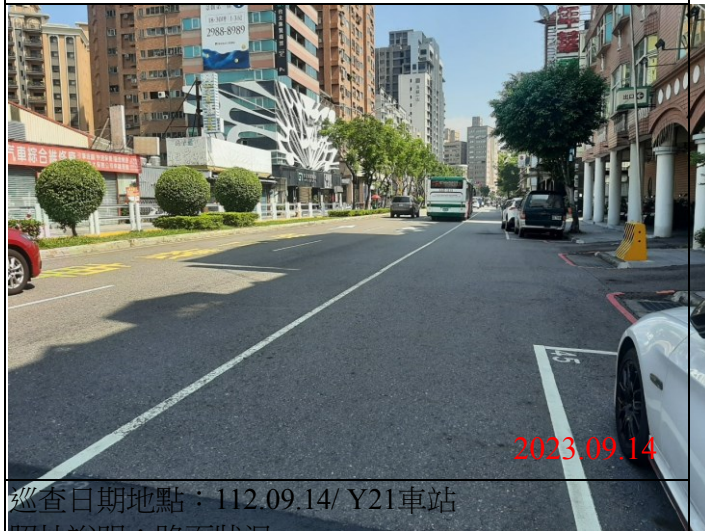
巡查日期地點：112.09.14/ Y21車站 照片說明：路面狀況