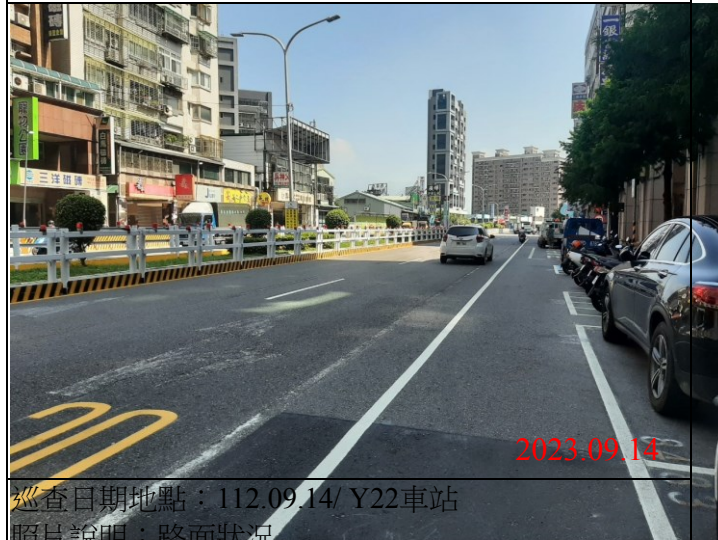
巡查日期地點：112.09.14/ Y22車站 照片說明：路面狀況