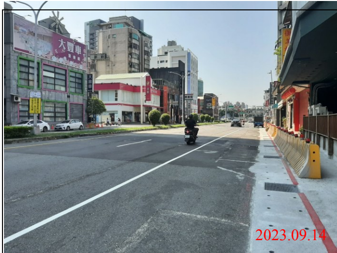
巡查日期地點：112.09.14/ Y21車站 照片說明：路面狀況