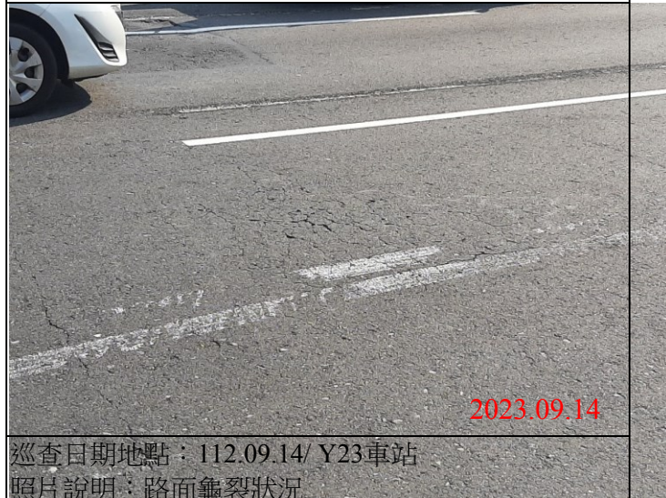
巡查日期地點：112.09.14/ Y23車站 照片說明：路面龜裂狀況