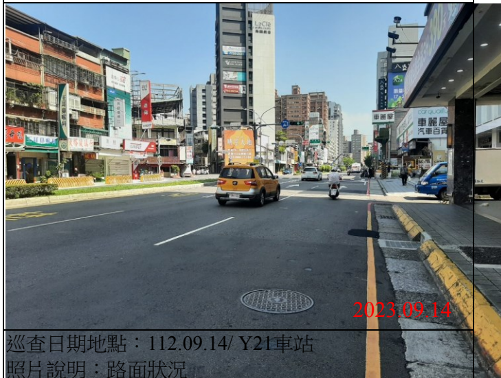
巡查日期地點：112.09.14/ Y21車站 照片說明：路面狀況