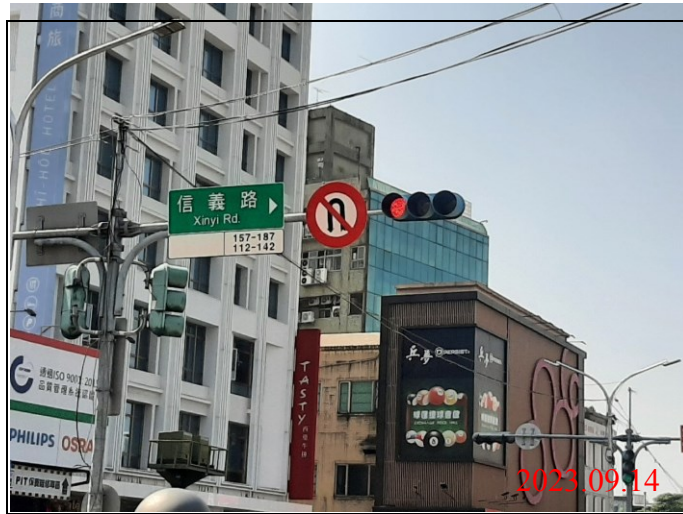
巡查日期地點：112.09.14/ Y21車站 照片說明：牌面設置狀況