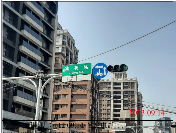
巡查日期地點：112.09.14/ Y22車站 照片說明：牌面設置狀況