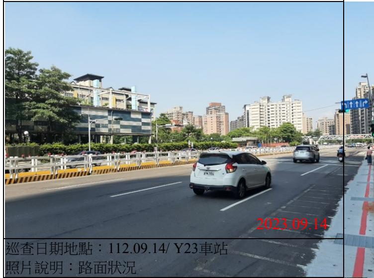
巡查日期地點：112.09.14/ Y23車站 照片說明：路面狀況