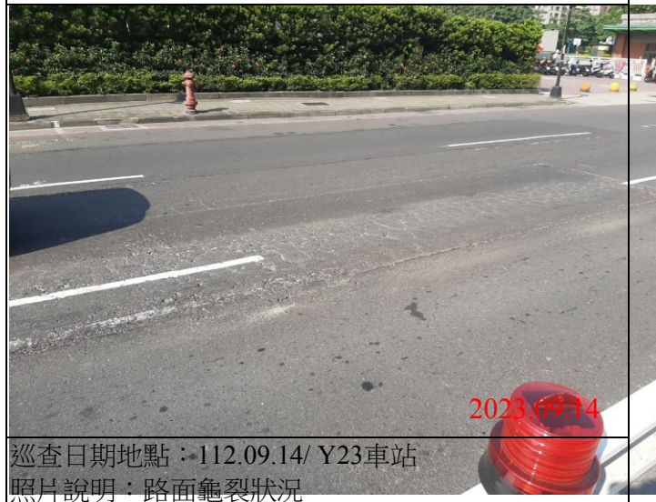
巡查日期地點：112.09.14/ Y23車站 照片說明：路面龜裂狀況