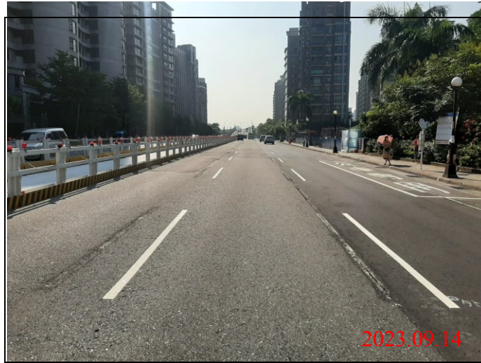
巡查日期地點：112.09.14/ Y23車站 照片說明：路面狀況