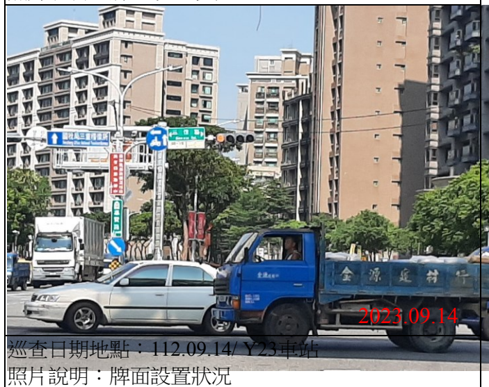
巡查日期地點：112.09.14/ Y23車站 照片說明：牌面設置狀況