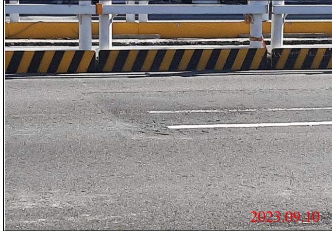
巡查日期地點：112.09.10/ Y23車站 照片說明：路面龜裂狀況