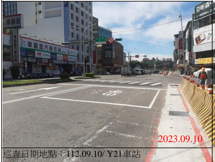
巡查日期地點：112.09.10/ Y21車站 照片說明：路面狀況