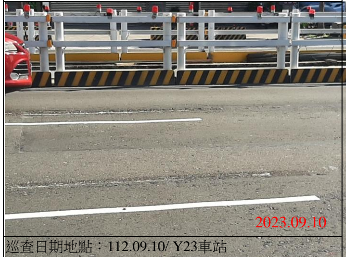
巡查日期地點：112.09.10/ Y23車站 照片說明：路面龜裂狀況