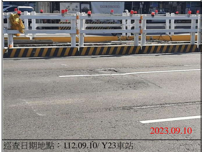
巡查日期地點：112.09.10/ Y23車站 照片說明：路面龜裂狀況