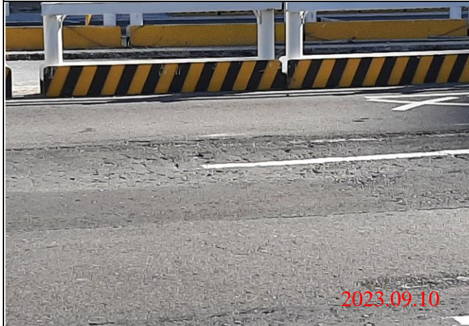
巡查日期地點：112.09.10/ Y23車站 照片說明：路面龜裂狀況