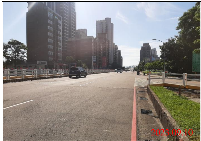
巡查日期地點：112.09.10/ Y23車站 照片說明：路面狀況