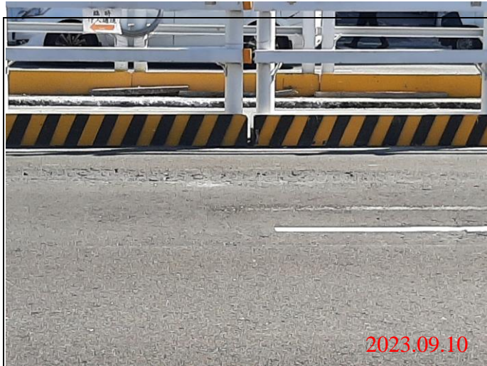
巡查日期地點：112.09.10/ Y23車站 照片說明：路面龜裂狀況