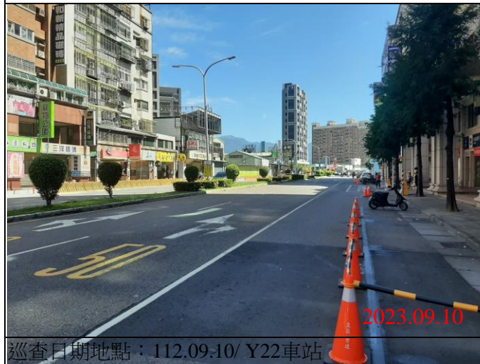
巡查日期地點：112.09.10/ Y22車站 照片說明：路面狀況