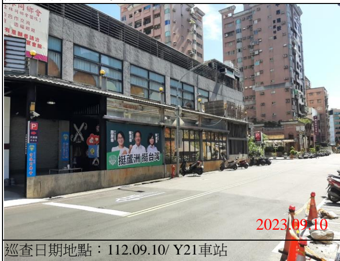
巡查日期地點：112.09.10/ Y21車站 照片說明：路面狀況