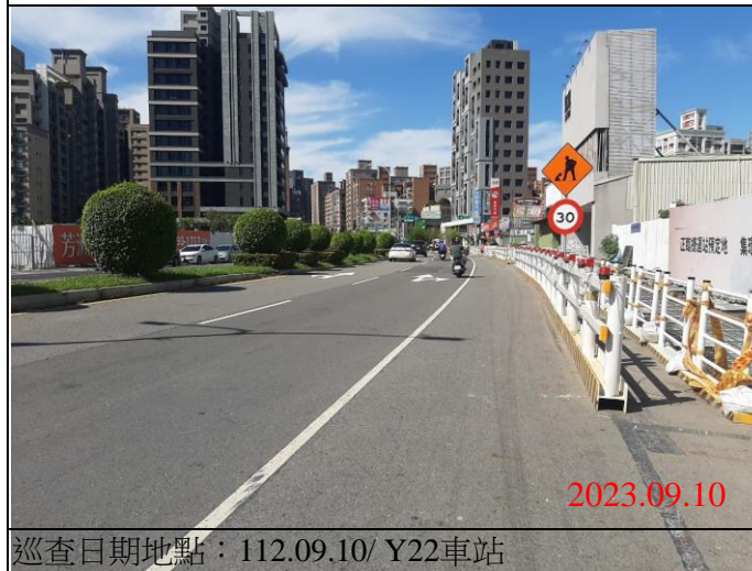
巡查日期地點：112.09.10/ Y22車站 照片說明：路面狀況