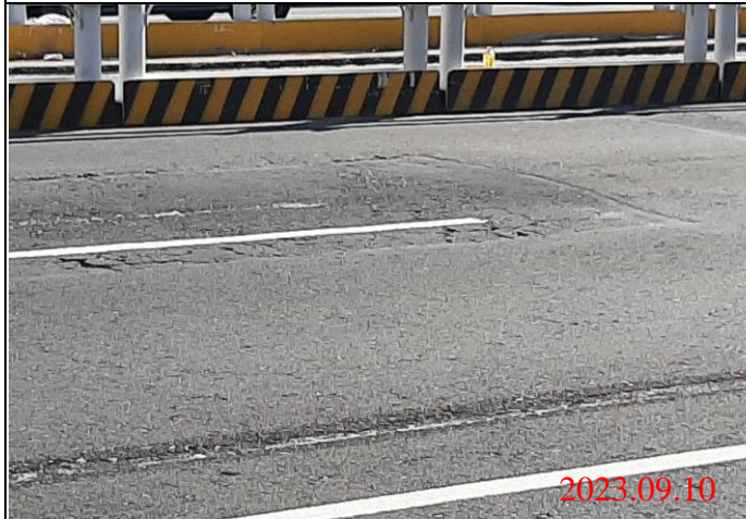
巡查日期地點：112.09.10/ Y23車站 照片說明：路面龜裂狀況