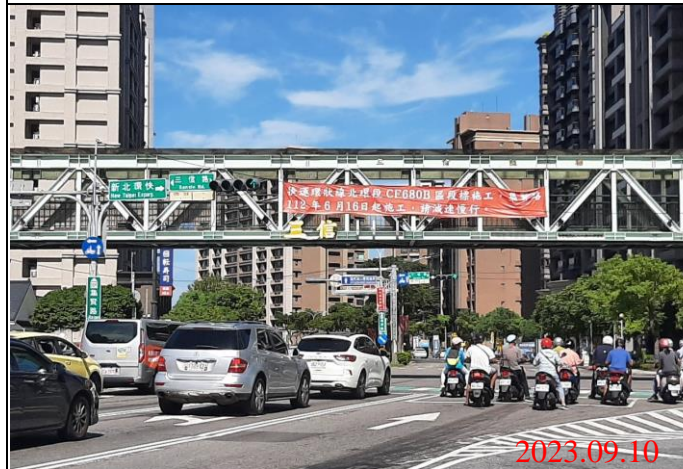
巡查日期地點：112.09.10/ Y23車站 照片說明：牌面設置狀況