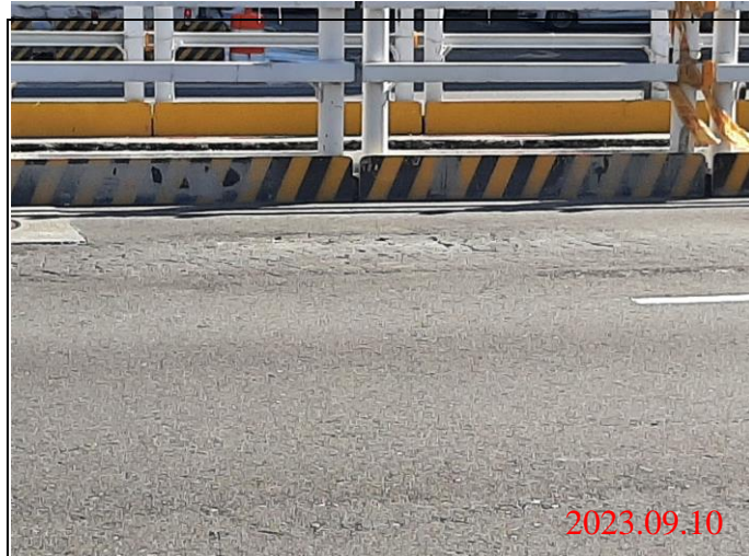
巡查日期地點：112.09.10/ Y23車站 照片說明：路面龜裂狀況