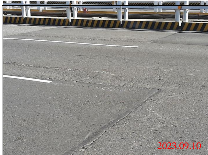
巡查日期地點：112.09.10/ Y23車站 照片說明：路面龜裂狀況