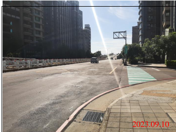
巡查日期地點：112.09.10/ Y23車站 照片說明：路面狀況