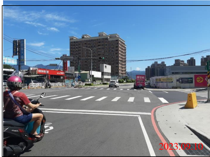
巡查日期地點：112.09.10/ Y22車站 照片說明：路面狀況