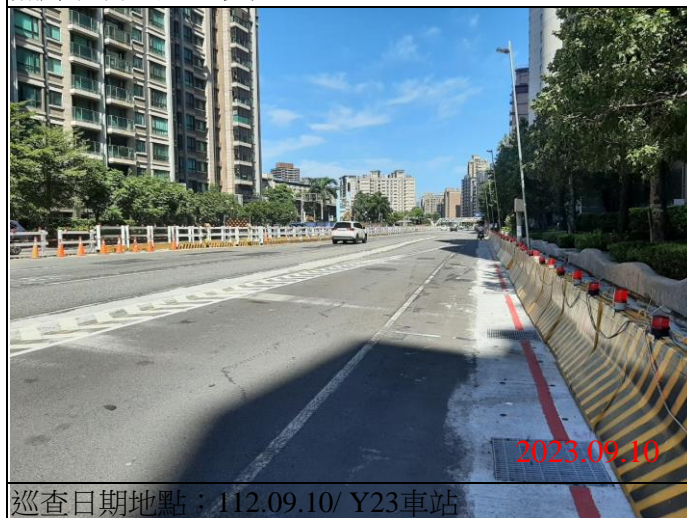
巡查日期地點：112.09.10/ Y23車站 照片說明：路面狀況