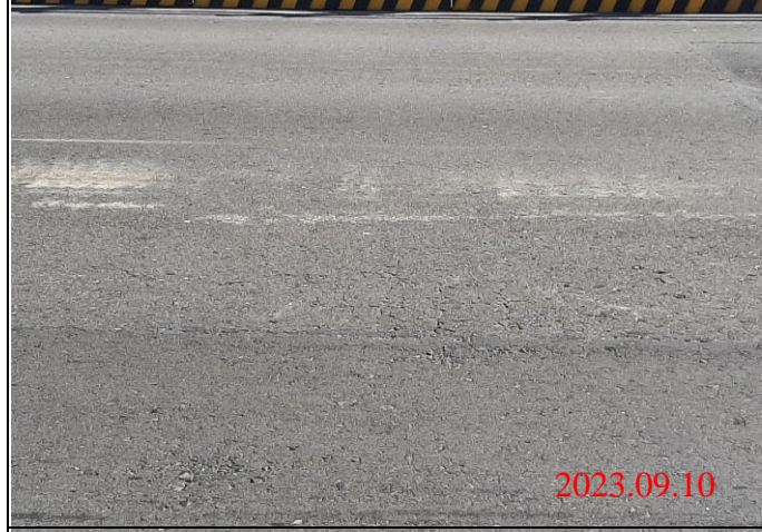
巡查日期地點：112.09.10/ Y23車站 照片說明：路面龜裂狀況