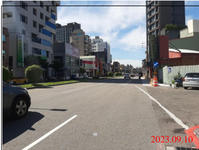
巡查日期地點：112.09.10/ Y21車站 照片說明：路面狀況