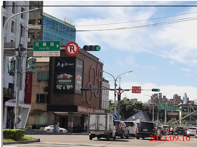
巡查日期地點：112.09.10/ Y21車站 照片說明：牌面設置狀況