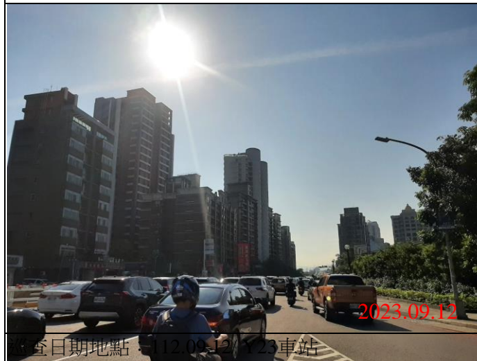
巡查日期地點：112.09.12/ Y23車站 照片說明：路面狀況