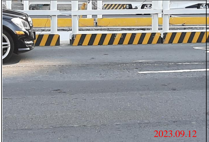
巡查日期地點：112.09.12/ Y23車站 照片說明：路面龜裂狀況