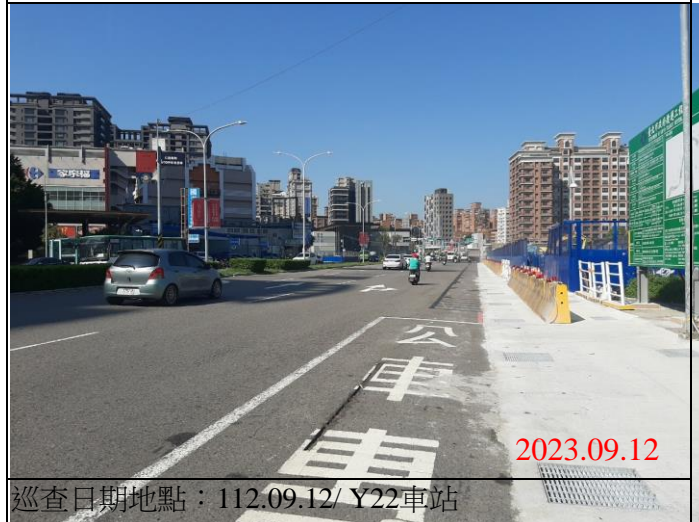
巡查日期地點：112.09.12/ Y22車站 照片說明：路面狀況