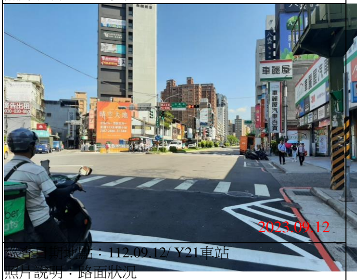
巡查日期地點：112.09.12/ Y21車站 照片說明：路面狀況