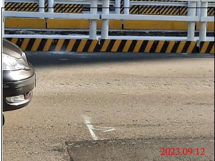
巡查日期地點：112.09.12/ Y23車站 照片說明：路面龜裂狀況