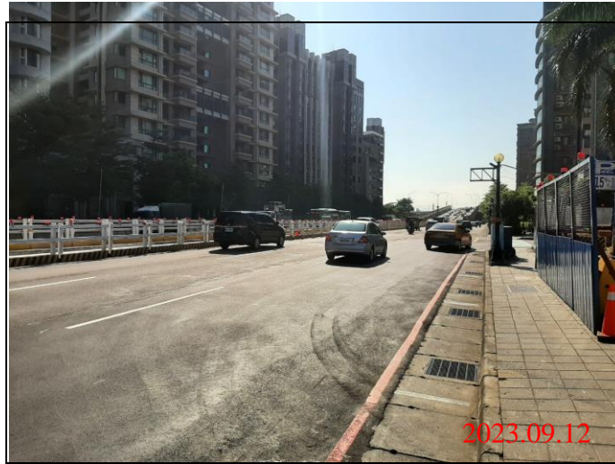
巡查日期地點：112.09.12/ Y23車站 照片說明：路面狀況