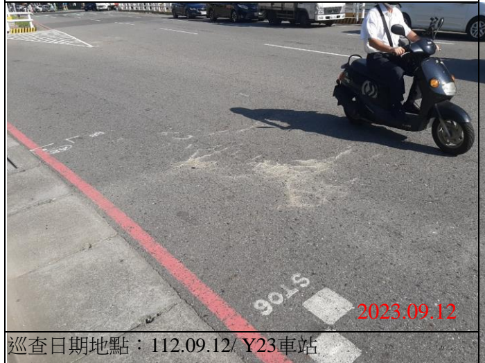
巡查日期地點：112.09.12/ Y23車站 照片說明：路面龜裂狀況