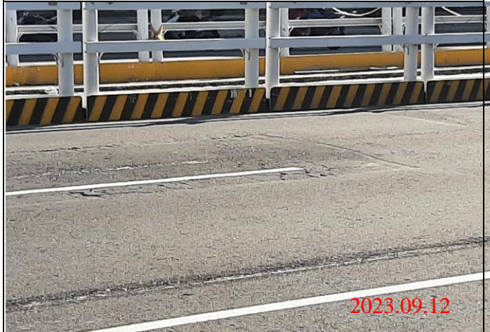
巡查日期地點：112.09.12/ Y23車站 照片說明：路面龜裂狀況