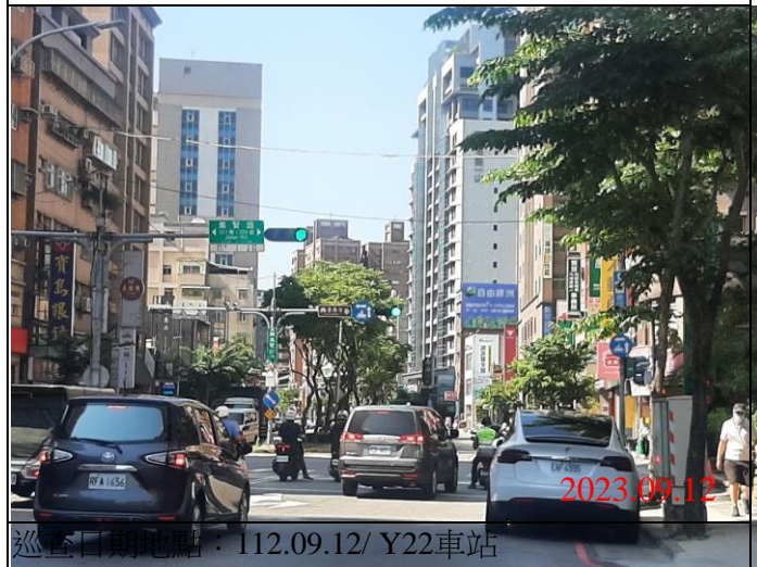
巡查日期地點：112.09.12/ Y22車站 照片說明：牌面設置狀況