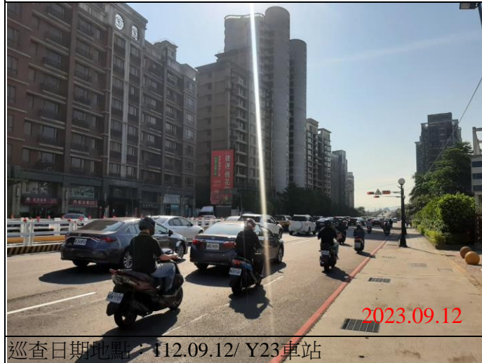
巡查日期地點：112.09.12/ Y23車站 照片說明：路面狀況