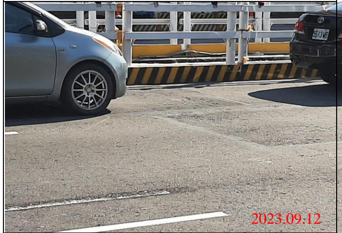
巡查日期地點：112.09.12/ Y23車站 照片說明：路面龜裂狀況