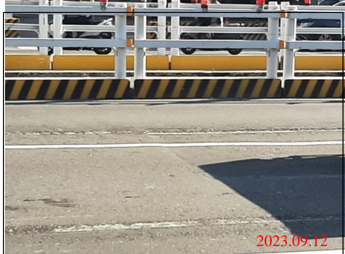
巡查日期地點：112.09.12/ Y23車站 照片說明：路面龜裂狀況