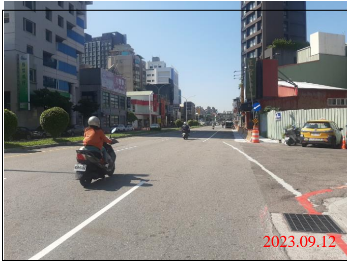
巡查日期地點：112.09.12/ Y21車站 照片說明：路面狀況