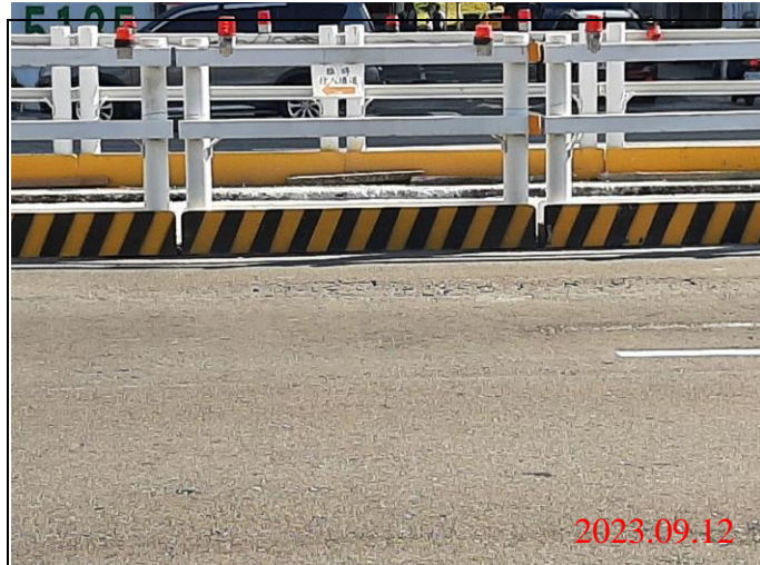
巡查日期地點：112.09.12/ Y23車站 照片說明：路面龜裂狀況