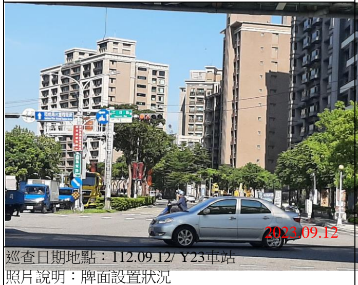
巡查日期地點：112.09.12/ Y23車站 照片說明：牌面設置狀況