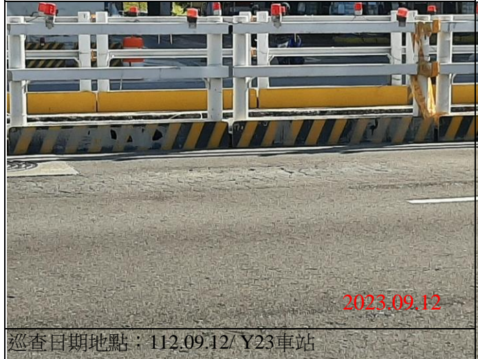
巡查日期地點：112.09.12/ Y23車站 照片說明：路面龜裂狀況