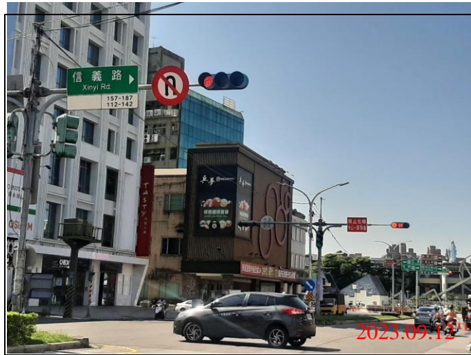
巡查日期地點：112.09.12/ Y21車站 照片說明：牌面設置狀況