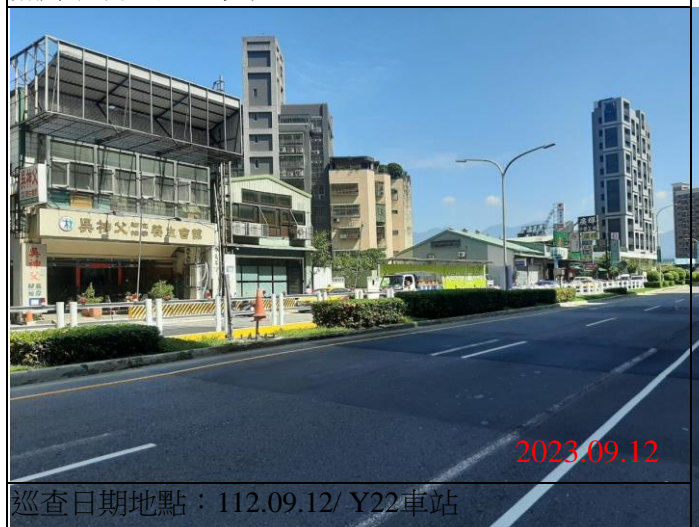
巡查日期地點：112.09.12/ Y22車站 照片說明：路面狀況