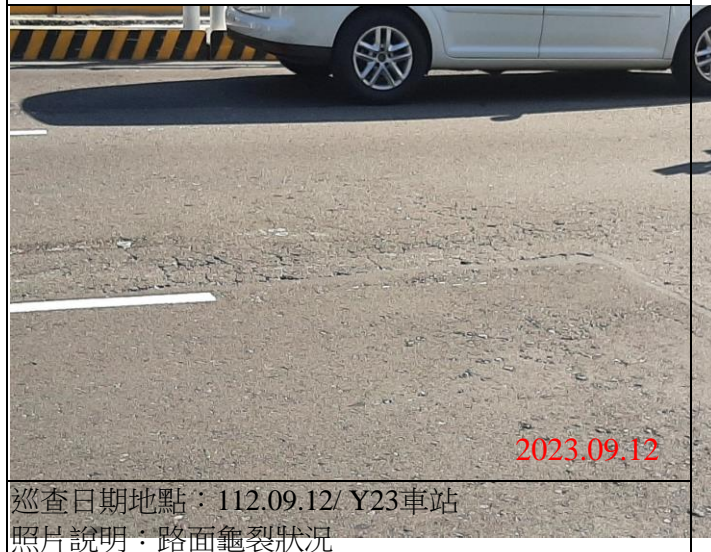
巡查日期地點：112.09.12/ Y23車站 照片說明：路面龜裂狀況