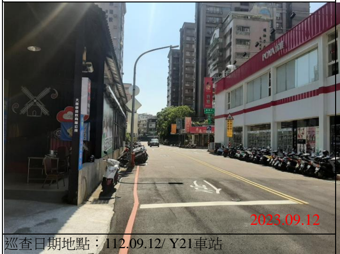
巡查日期地點：112.09.12/ Y21車站 照片說明：路面狀況