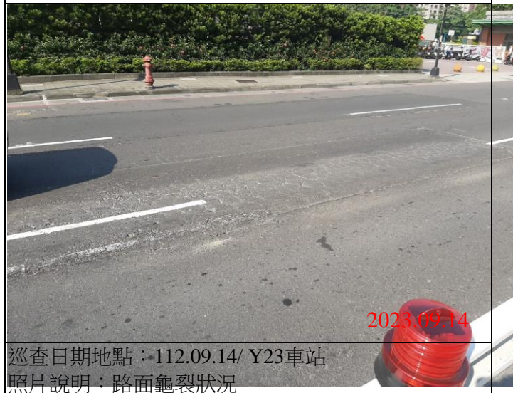
巡查日期地點：112.09.14/ Y23車站 照片說明：路面龜裂狀況