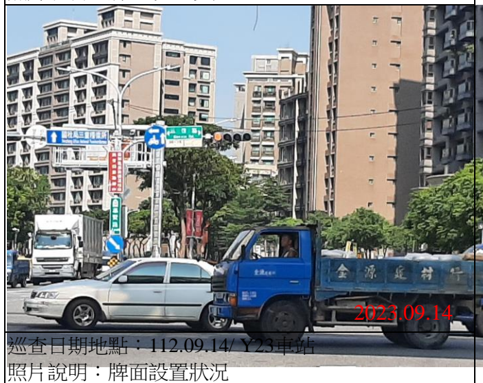
巡查日期地點：112.09.14/ Y23車站 照片說明：牌面設置狀況