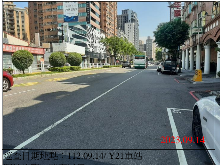
巡查日期地點：112.09.14/ Y21車站 照片說明：路面狀況