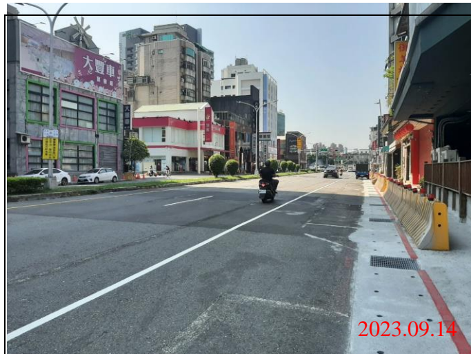
巡查日期地點：112.09.14/ Y21車站 照片說明：路面狀況