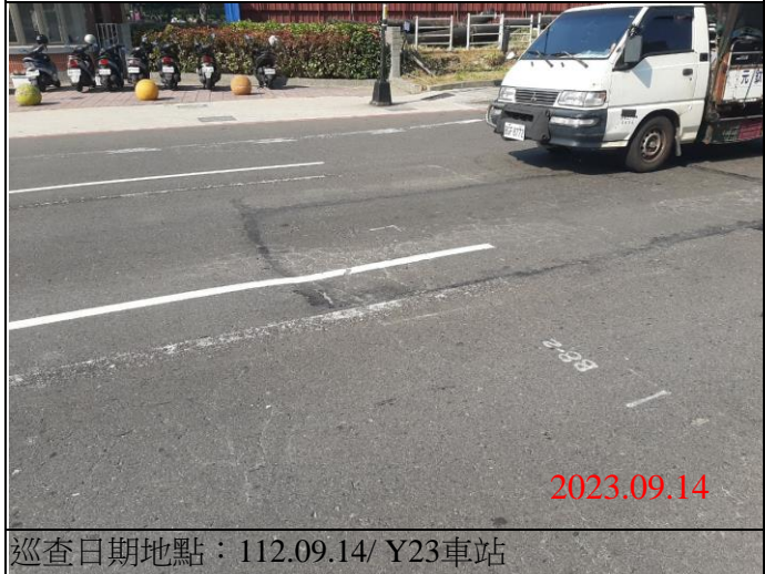
巡查日期地點：112.09.14/ Y23車站 照片說明：路面龜裂狀況