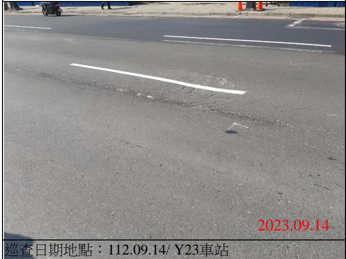
巡查日期地點：112.09.14/ Y23車站 照片說明：路面龜裂狀況