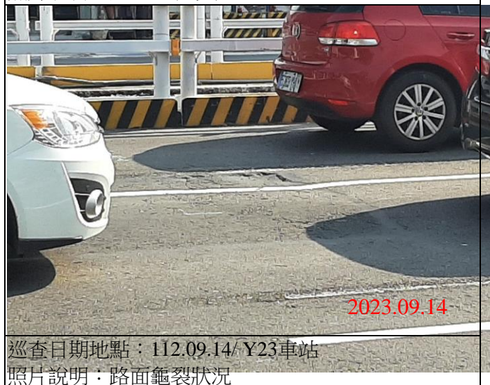
巡查日期地點：112.09.14/ Y23車站 照片說明：路面龜裂狀況