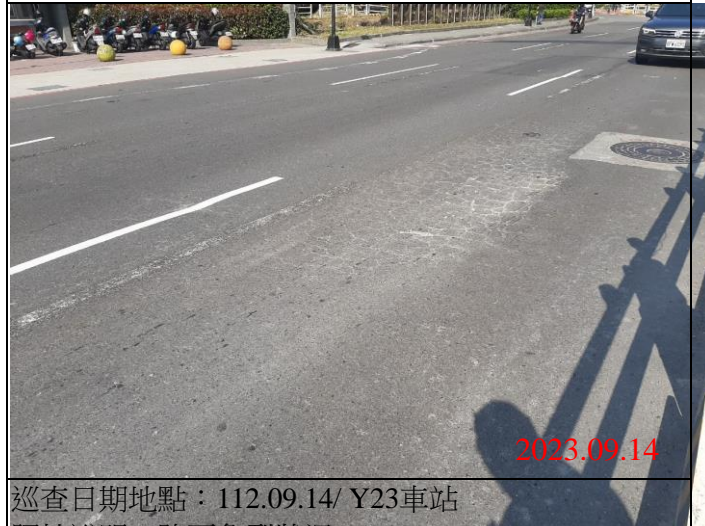
巡查日期地點：112.09.14/ Y23車站 照片說明：路面龜裂狀況