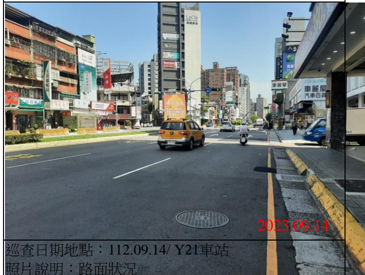
巡查日期地點：112.09.14/ Y21車站 照片說明：路面狀況