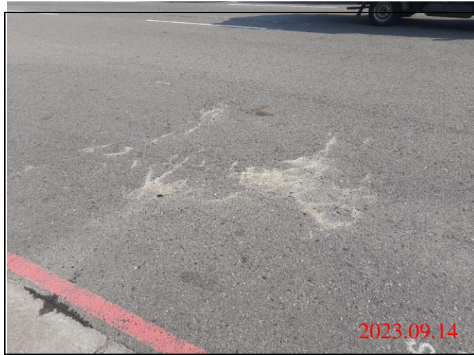
巡查日期地點：112.09.14/ Y23車站 照片說明：路面龜裂狀況