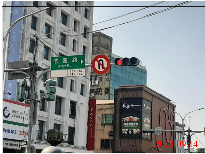
巡查日期地點：112.09.14/ Y21車站 照片說明：牌面設置狀況