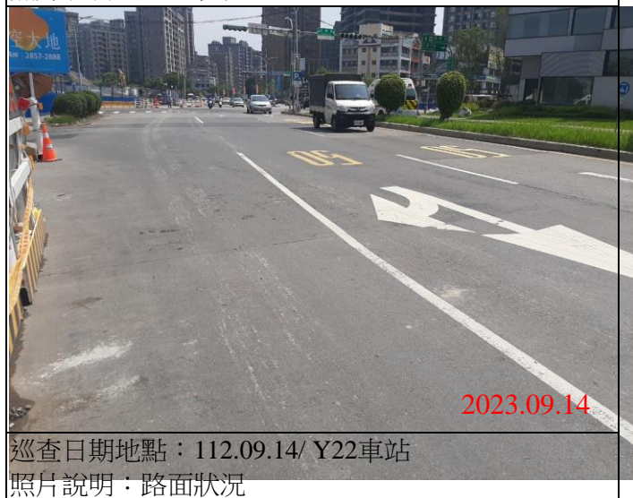
巡查日期地點：112.09.14/ Y22車站 照片說明：路面狀況