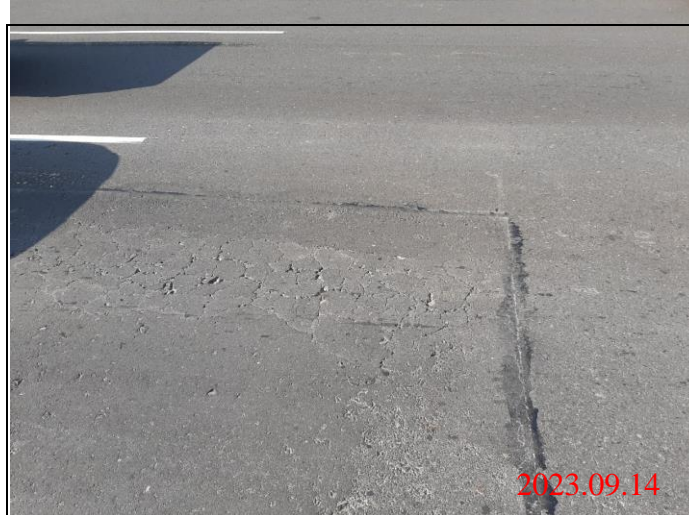
巡查日期地點：112.09.14/ Y23車站 照片說明：路面龜裂狀況