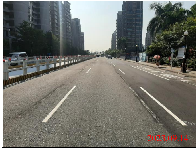
巡查日期地點：112.09.14/ Y23車站 照片說明：路面狀況