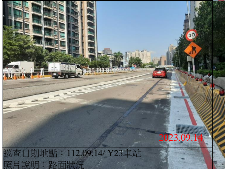
巡查日期地點：112.09.14/ Y23車站 照片說明：路面狀況