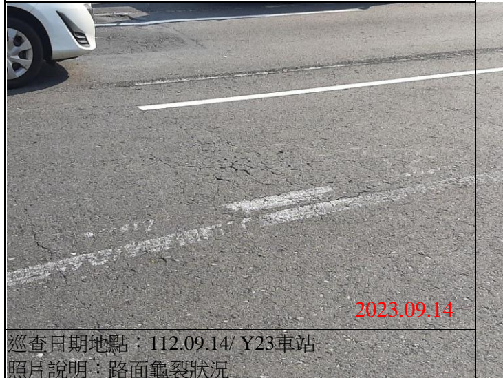
巡查日期地點：112.09.14/ Y23車站 照片說明：路面龜裂狀況