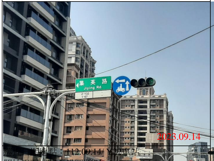
巡查日期地點：112.09.14/ Y22車站 照片說明：牌面設置狀況