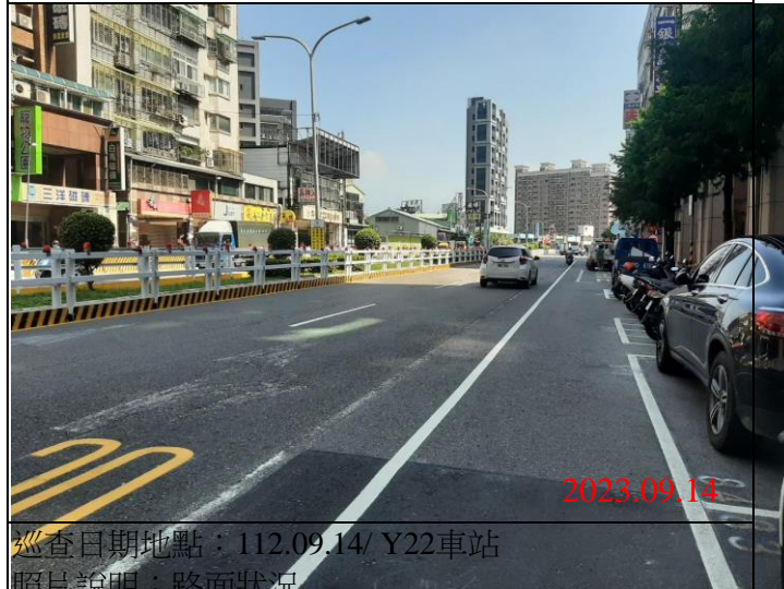
巡查日期地點：112.09.14/ Y22車站 照片說明：路面狀況