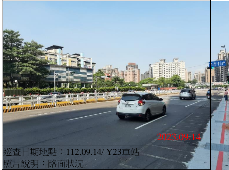
巡查日期地點：112.09.14/ Y23車站 照片說明：路面狀況