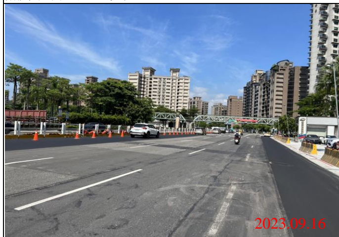
巡查日期地點：112.09.16/ Y23車站 照片說明：路面狀況