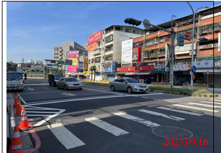
巡查日期地點：112.09.16/ Y21車站 照片說明：路面狀況