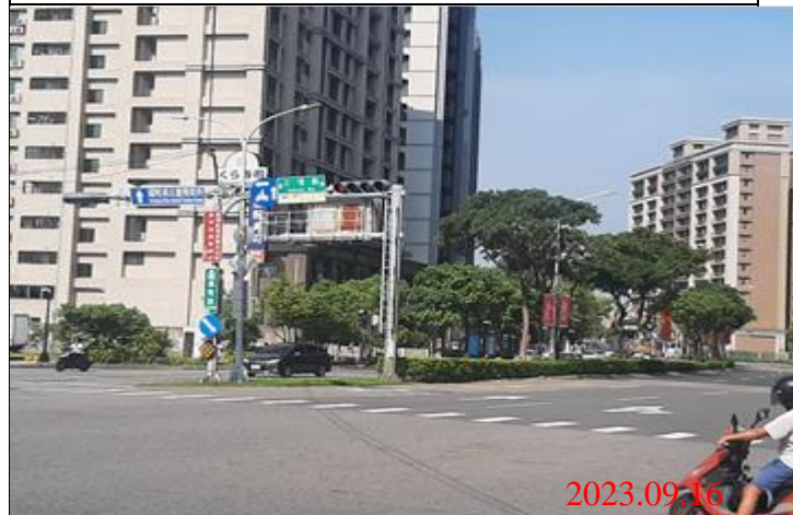
巡查日期地點：112.09.16/ Y23車站 照片說明：牌面設置狀況