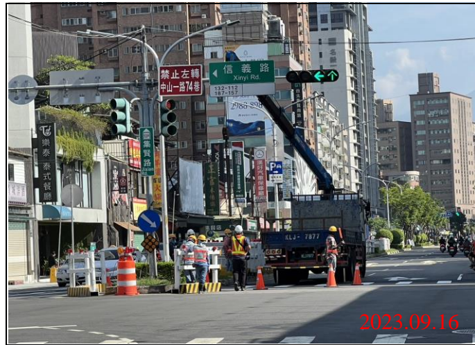
巡查日期地點：112.09.16/ Y21車站 照片說明：牌面設置狀況