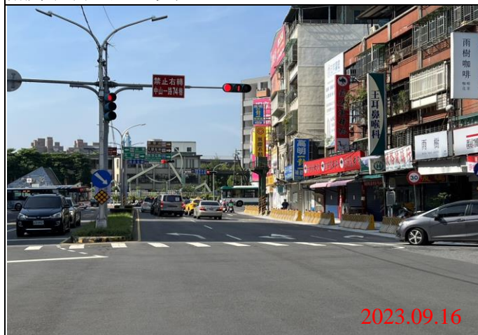
巡查日期地點：112.09.16/ Y21車站 照片說明：路面狀況