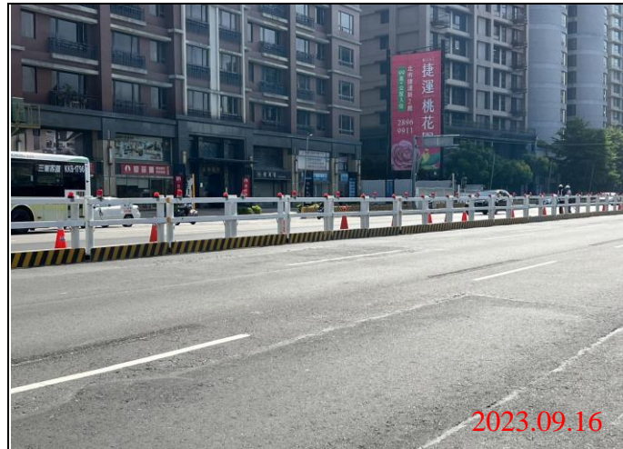
巡查日期地點：112.09.16/ Y23車站 照片說明：路面龜裂狀況