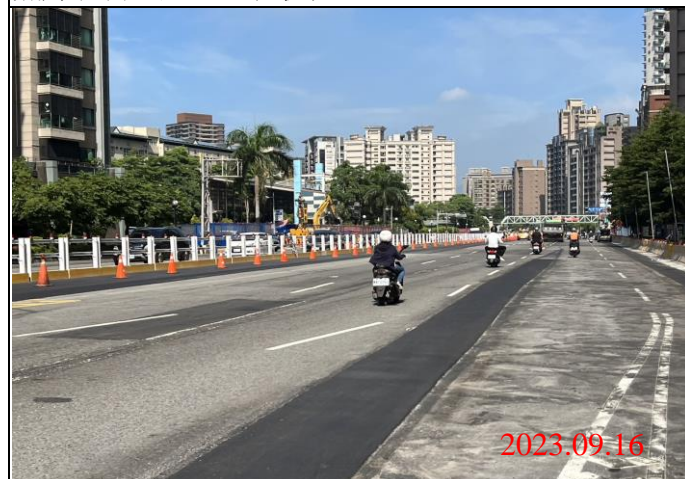
巡查日期地點：112.09.16/ Y23車站 照片說明：路面龜裂狀況