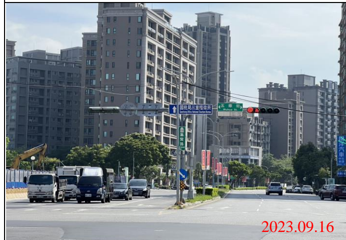
巡查日期地點：112.09.16/ Y22車站 照片說明：牌面設置狀況