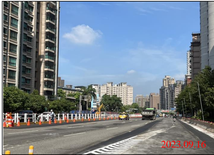
巡查日期地點：112.09.16/ Y23車站 照片說明：路面狀況