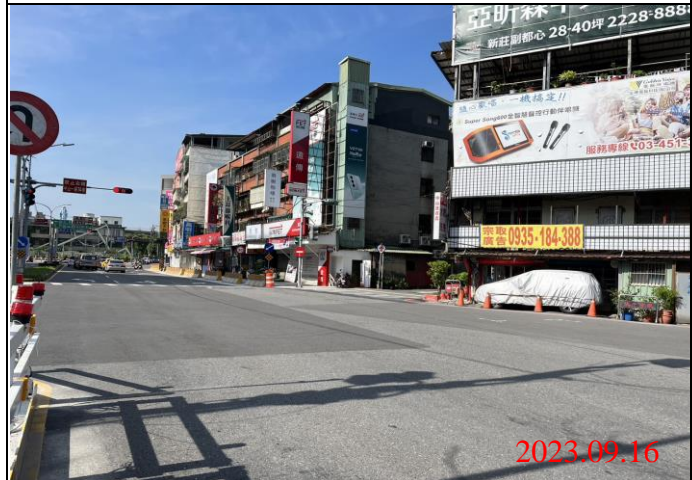
巡查日期地點：112.09.16/ Y21車站 照片說明：路面狀況