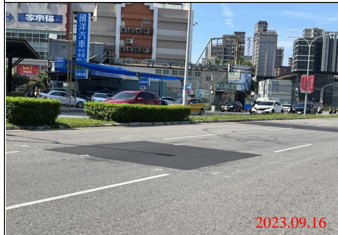
巡查日期地點：112.09.16/ Y22車站 照片說明：路面狀況