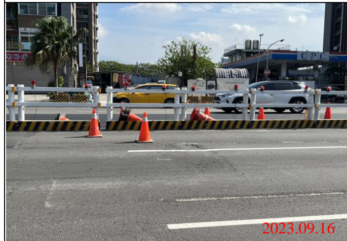
巡查日期地點：112.09.16/ Y23車站 照片說明：路面龜裂狀況