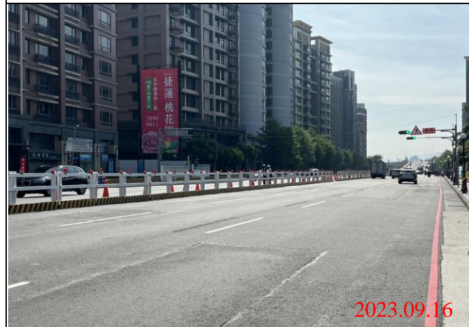
巡查日期地點：112.09.16/ Y23車站 照片說明：路面龜裂狀況