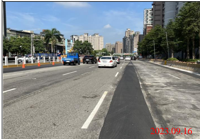
巡查日期地點：112.09.16/ Y23車站 照片說明：路面狀況