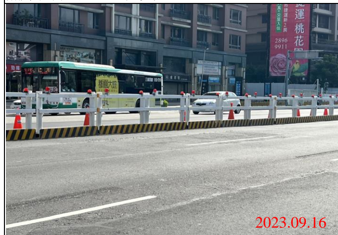
巡查日期地點：112.09.16/ Y23車站 照片說明：路面龜裂狀況