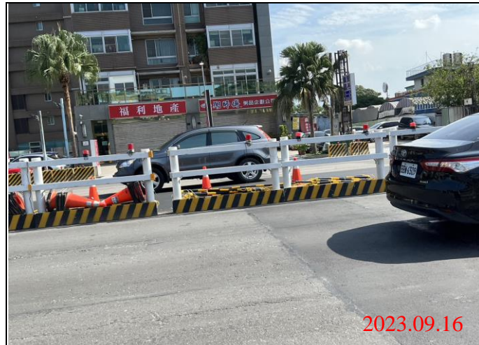
巡查日期地點：112.09.16/ Y23車站 照片說明：路面龜裂狀況