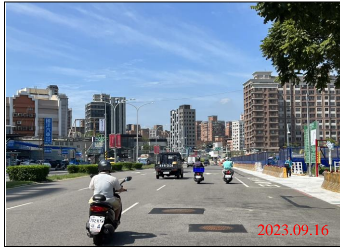
巡查日期地點：112.09.16/ Y22車站 照片說明：路面狀況