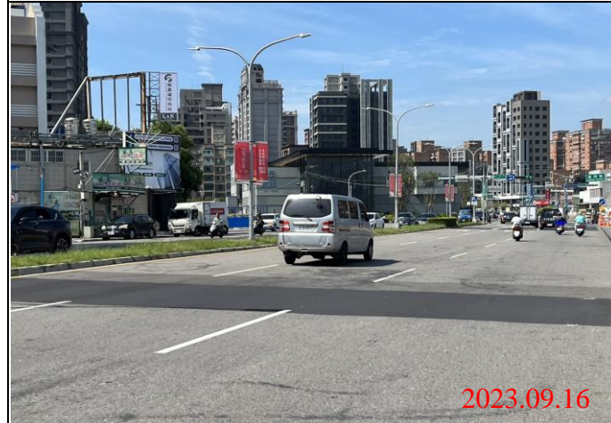
巡查日期地點：112.09.16/ Y22車站 照片說明：路面狀況