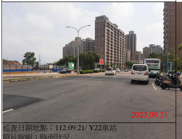
巡查日期地點：112.09.21/ Y22車站 照片說明：路面狀況