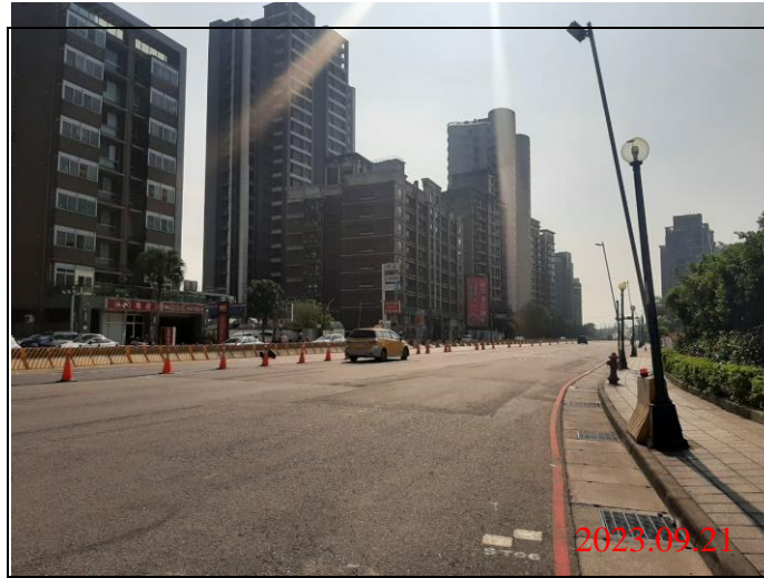
巡查日期地點：112.09.21/ Y23車站 照片說明：路面狀況