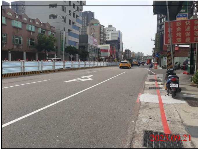
巡查日期地點：112.09.21/ Y21車站 照片說明：路面狀況