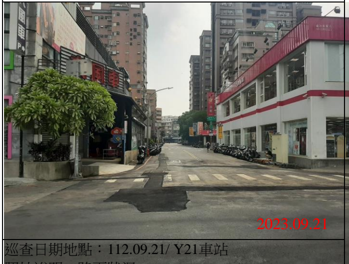
巡查日期地點：112.09.21/ Y21車站 照片說明：路面狀況