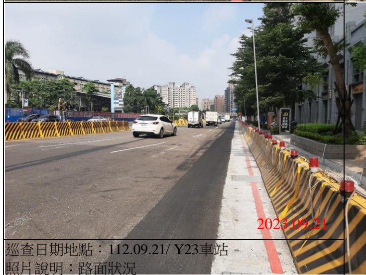
巡查日期地點：112.09.21/ Y23車站 照片說明：路面狀況