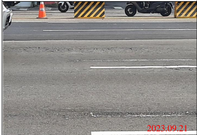
巡查日期地點：112.09.21/ Y23車站 照片說明：路面龜裂狀況