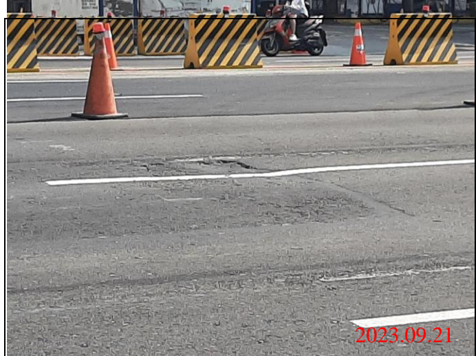
巡查日期地點：112.09.21/ Y23車站 照片說明：路面龜裂狀況