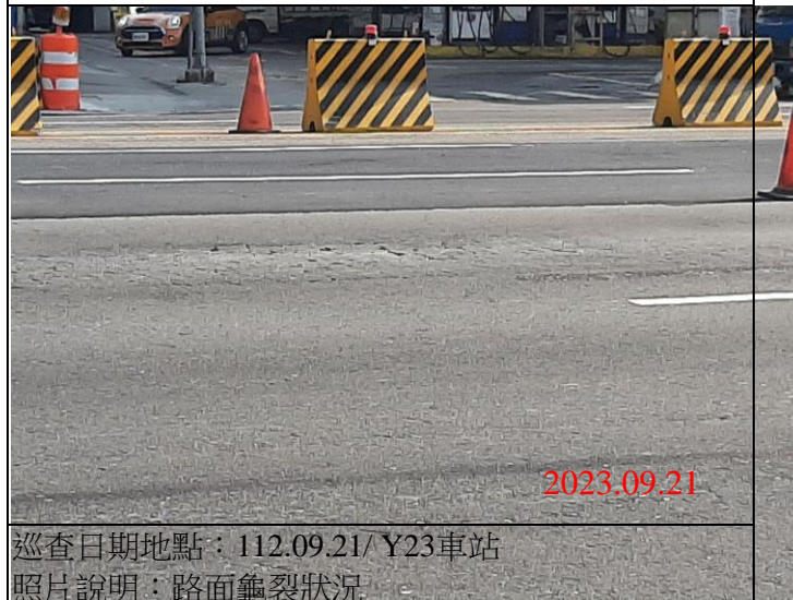
巡查日期地點：112.09.21/ Y23車站 照片說明：路面龜裂狀況