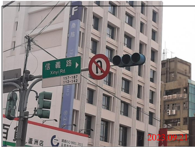
巡查日期地點：112.09.21/ Y21車站 照片說明：牌面設置狀況