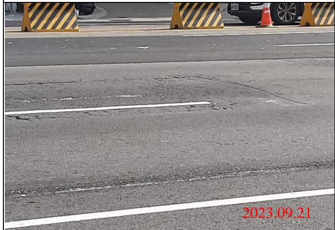
巡查日期地點：112.09.21/ Y23車站 照片說明：路面龜裂狀況