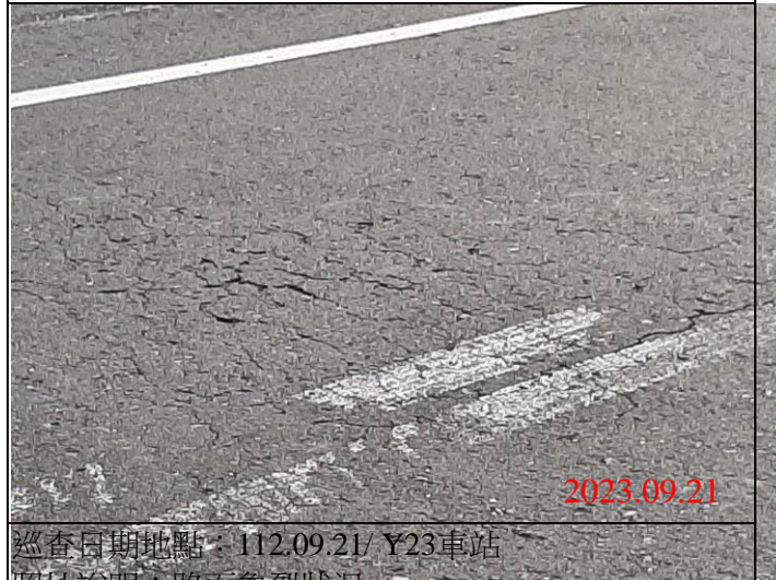
巡查日期地點：112.09.21/ Y23車站 照片說明：路面龜裂狀況