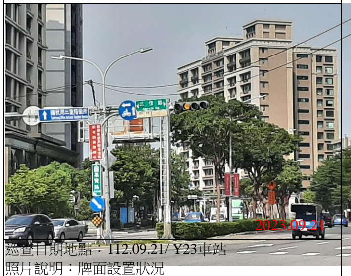
巡查日期地點：112.09.21/ Y23車站 照片說明：牌面設置狀況