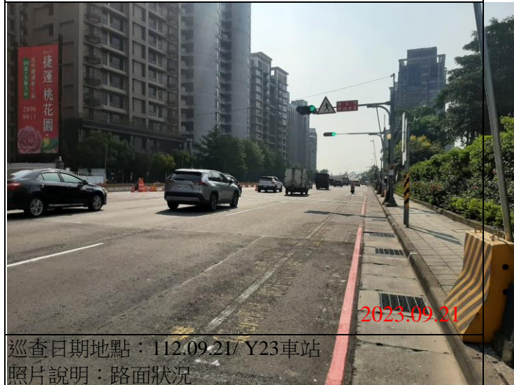
巡查日期地點：112.09.21/ Y23車站 照片說明：路面狀況