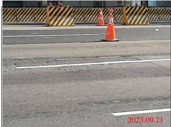
巡查日期地點：112.09.21/ Y23車站 照片說明：路面龜裂狀況