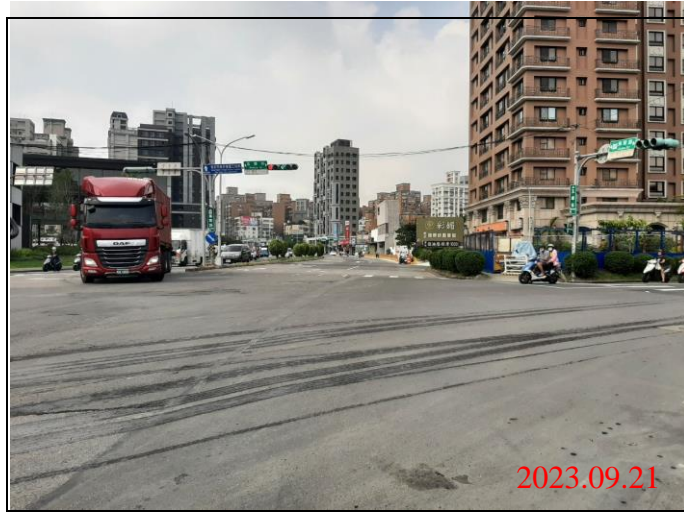
巡查日期地點：112.09.21/ Y22車站 照片說明：路面狀況