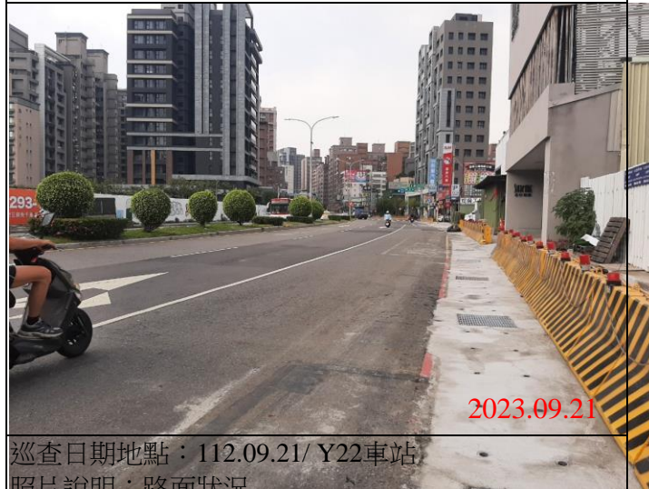
巡查日期地點：112.09.21/ Y22車站 照片說明：路面狀況