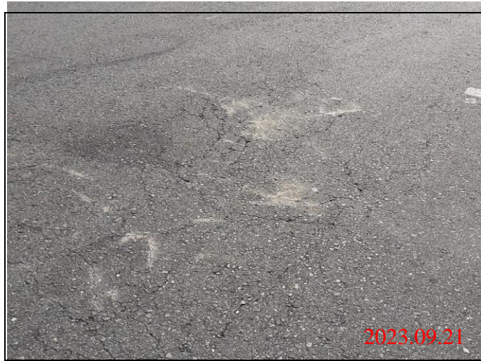
巡查日期地點：112.09.21/ Y23車站 照片說明：路面龜裂狀況