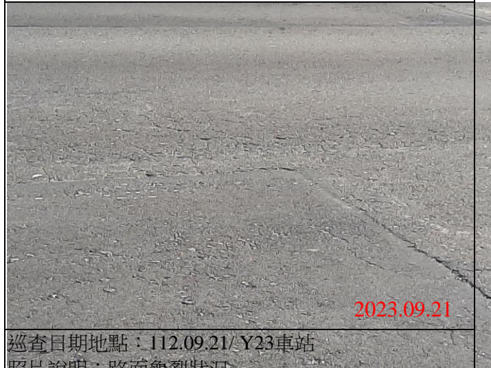
巡查日期地點：112.09.21/ Y23車站 照片說明：路面龜裂狀況