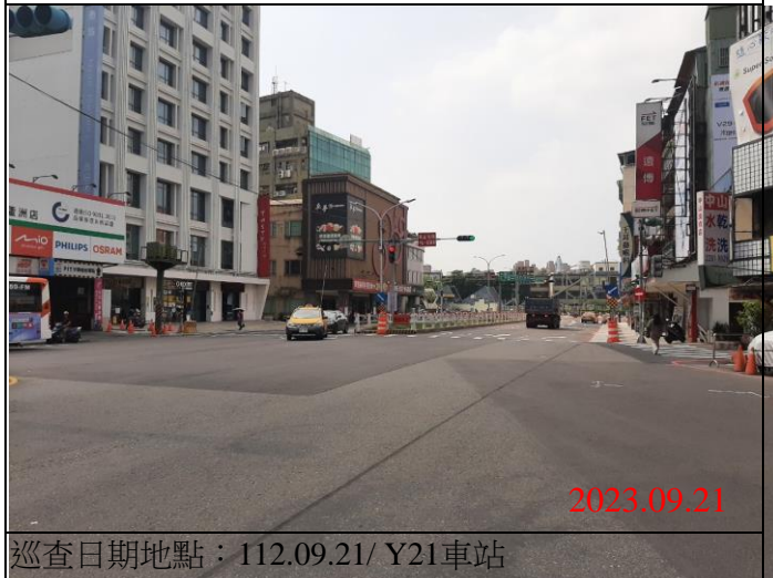
巡查日期地點：112.09.21/ Y21車站 照片說明：路面狀況