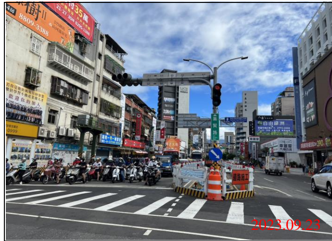
巡查日期地點：112.09.23/ Y21車站 照片說明：牌面設置狀況