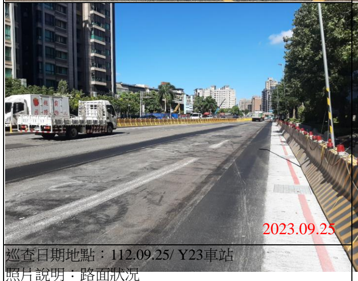
巡查日期地點：112.09.25/ Y23車站 照片說明：路面狀況