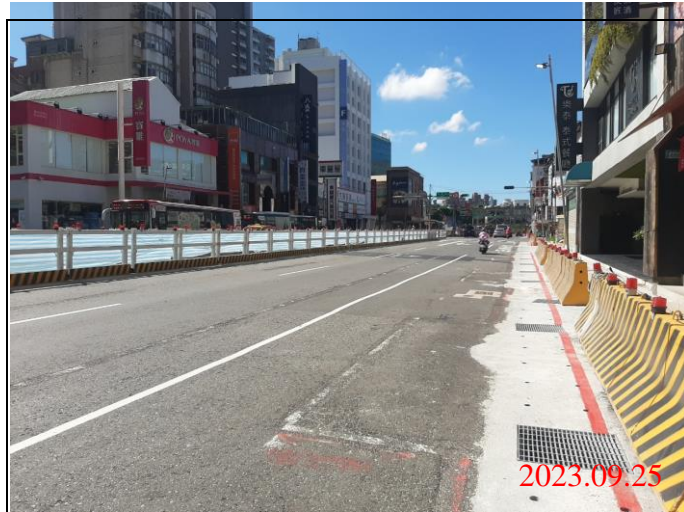
巡查日期地點：112.09.25/ Y21車站 照片說明：路面狀況