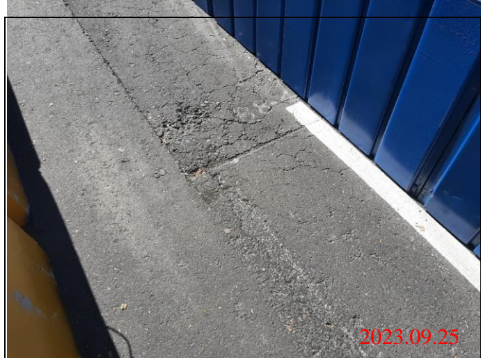
巡查日期地點：112.09.25/ Y23車站 照片說明：路面龜裂狀況