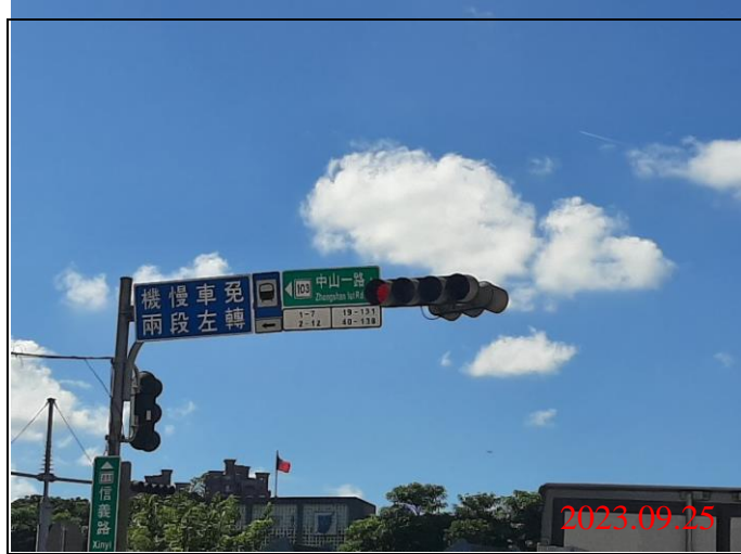
巡查日期地點：112.09.25/ Y21車站 照片說明：牌面設置狀況