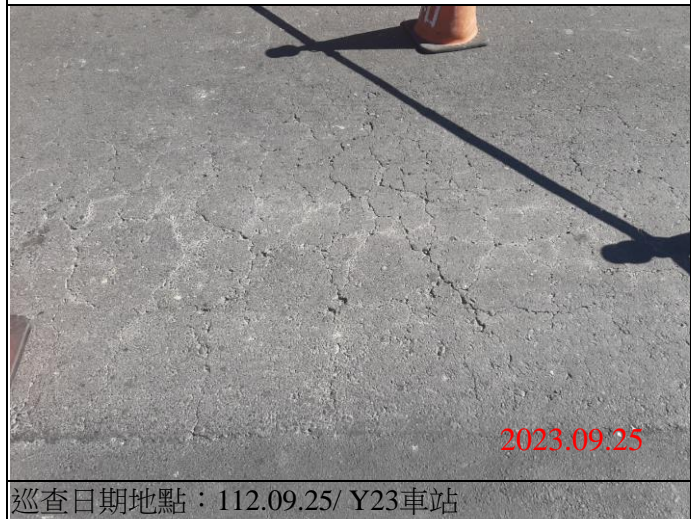
巡查日期地點：112.09.25/ Y23車站 照片說明：路面龜裂狀況