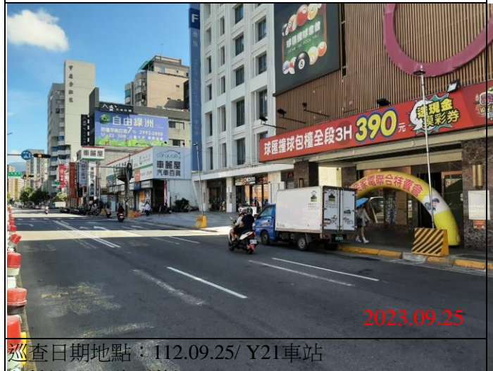
巡查日期地點：112.09.25/ Y21車站 照片說明：路面狀況