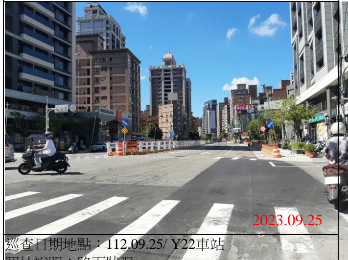
巡查日期地點：112.09.25/ Y22車站 照片說明：路面狀況