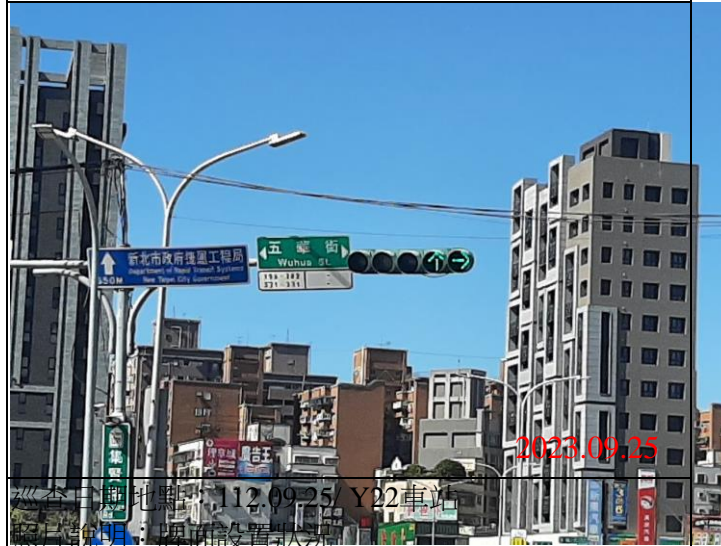
巡查日期地點：112.09.25/ Y22車站 照片說明：牌面設置狀況