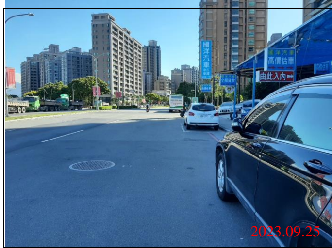
巡查日期地點：112.09.25/ Y22車站 照片說明：路面狀況