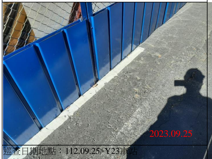
巡查日期地點：112.09.25/ Y23車站 照片說明：路面龜裂狀況