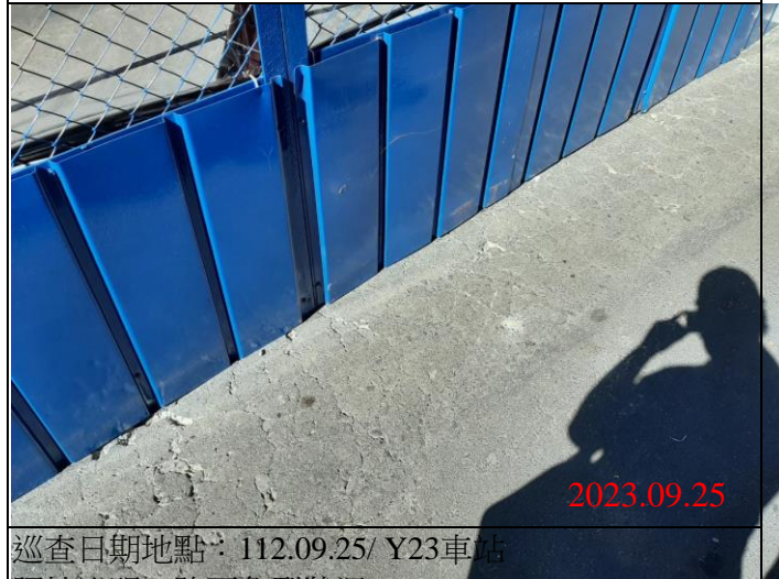
巡查日期地點：112.09.25/ Y23車站 照片說明：路面龜裂狀況