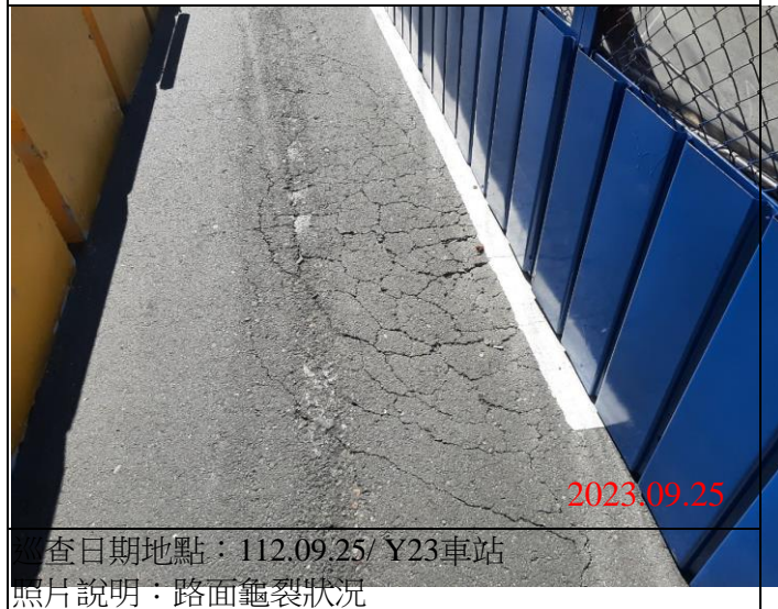
巡查日期地點：112.09.25/ Y23車站 照片說明：路面龜裂狀況