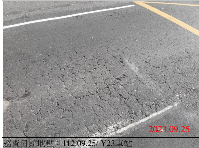
巡查日期地點：112.09.25/ Y23車站 照片說明：路面龜裂狀況