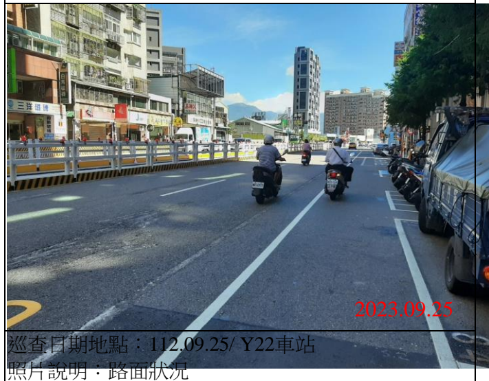
巡查日期地點：112.09.25/ Y22車站 照片說明：路面狀況