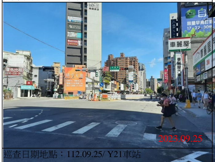
巡查日期地點：112.09.25/ Y21車站 照片說明：路面狀況