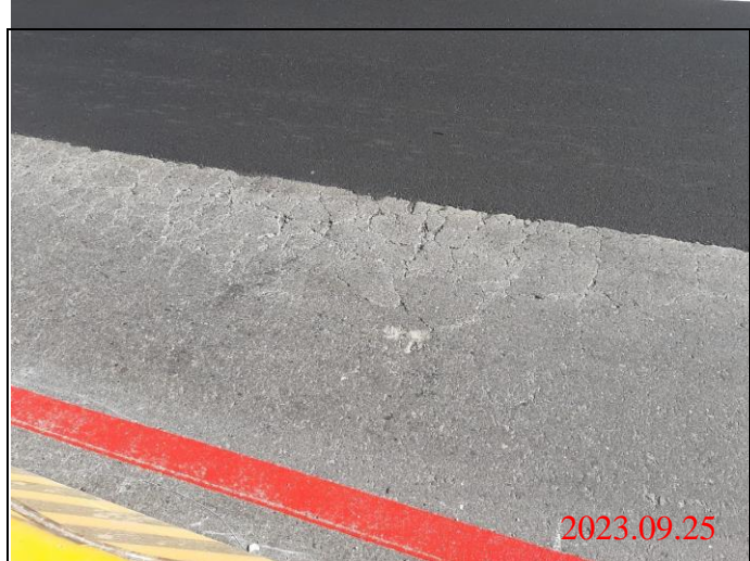
巡查日期地點：112.09.25/ Y23車站 照片說明：路面龜裂狀況