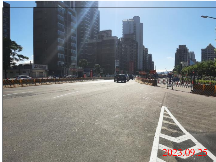
巡查日期地點：112.09.25/ Y23車站 照片說明：路面狀況