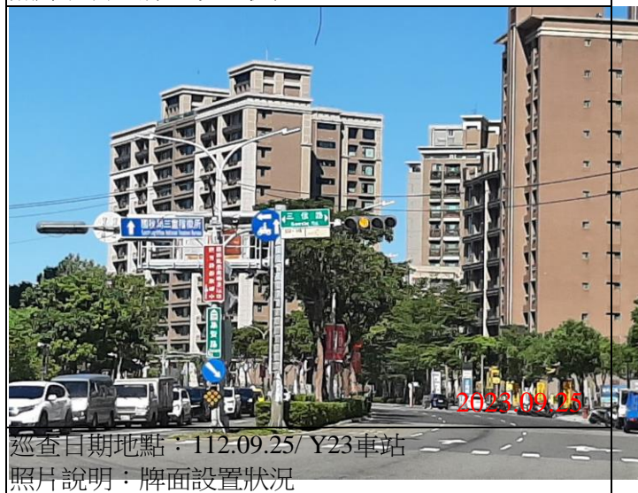
巡查日期地點：112.09.25/ Y23車站 照片說明：牌面設置狀況