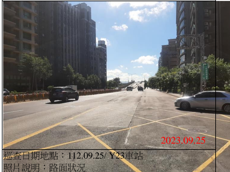
巡查日期地點：112.09.25/ Y23車站 照片說明：路面狀況