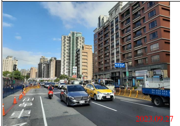
巡查日期地點：112.09.27/ Y23車站 照片說明：路面狀況