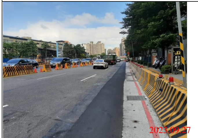
巡查日期地點：112.09.27/ Y23車站 照片說明：路面狀況