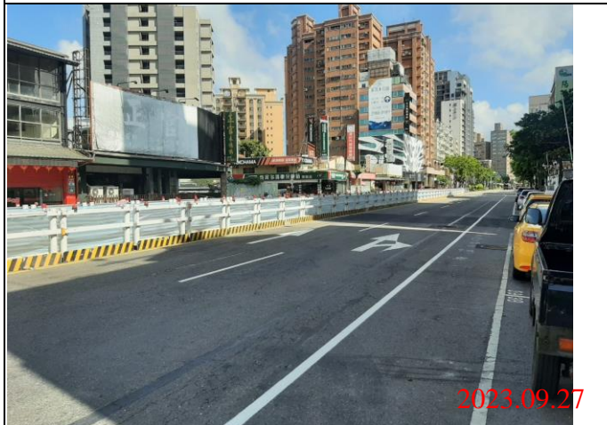
巡查日期地點：112.09.27/ Y21車站 照片說明：路面狀況