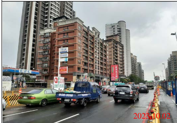
巡查日期地點：112.10.02/ Y23車站 照片說明：路面狀況