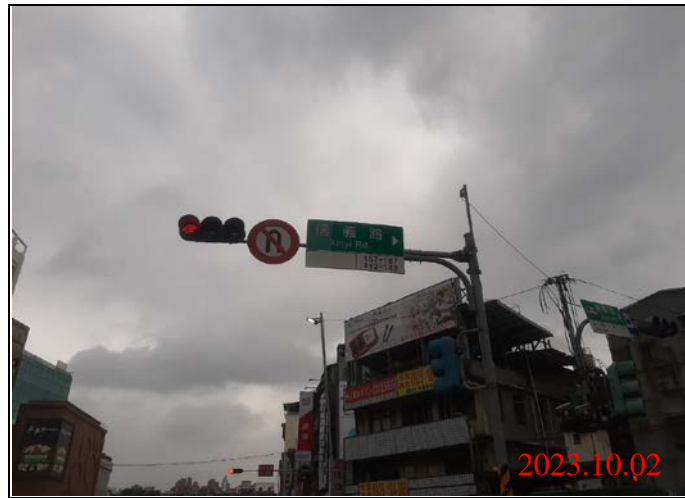
巡查日期地點：112.10.02/ Y21車站 照片說明：牌面設置狀況