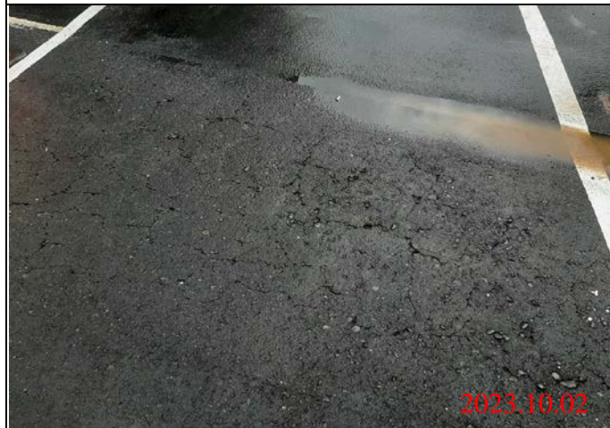
巡查日期地點：112.10.02/ Y23車站 照片說明：路面龜裂狀況