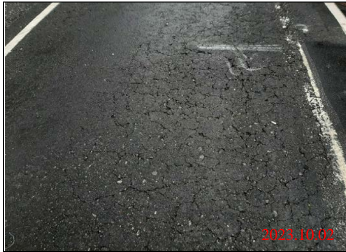
巡查日期地點：112.10.02/ Y23車站 照片說明：路面龜裂狀況