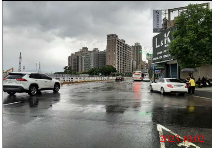
巡查日期地點：112.10.02/ Y22車站 照片說明：路面狀況