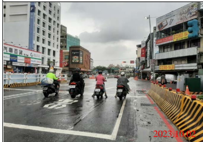
巡查日期地點：112.10.02/ Y21車站 照片說明：路面狀況