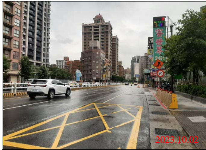
巡查日期地點：112.10.02/ Y22車站 照片說明：路面狀況