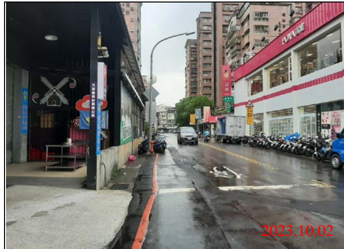
巡查日期地點：112.10.02/ Y21車站 照片說明：路面狀況