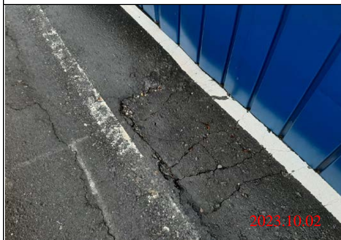
巡查日期地點：112.10.02/ Y23車站 照片說明：路面龜裂狀況