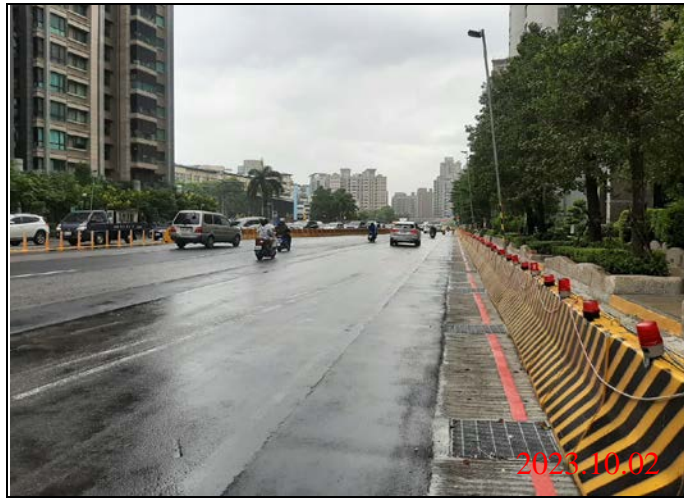
巡查日期地點：112.10.02 Y23車站 照片說明：路面狀況