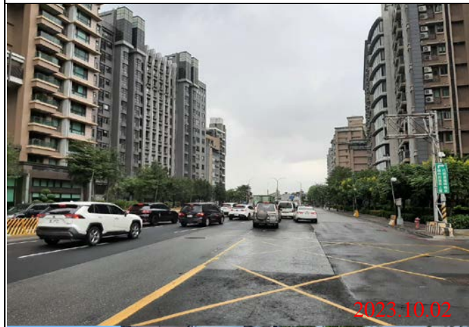
巡查日期地點：112.10.02/ Y23車站 照片說明：路面狀況