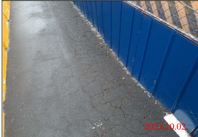
巡查日期地點：112.10.02/ Y23車站 照片說明：路面龜裂狀況