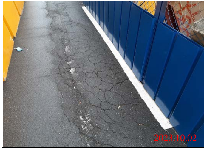
巡查日期地點：112.10.02/ Y23車站 照片說明：路面龜裂狀況