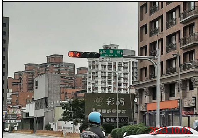
巡查日期地點：112.10.02/ Y22車站 照片說明：牌面設置狀況