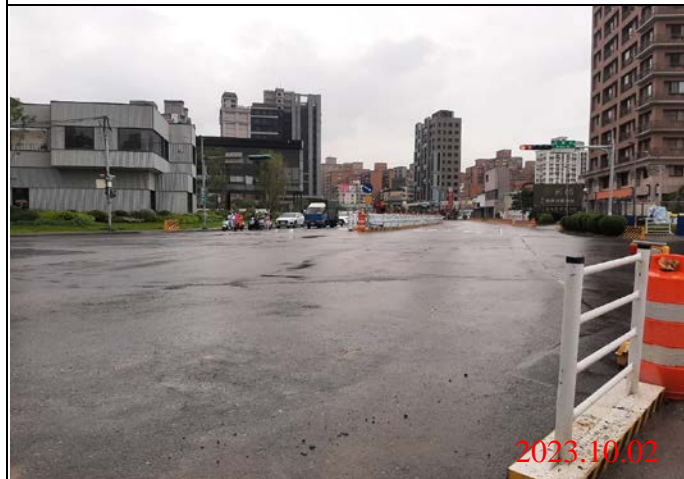
巡查日期地點：112.10.02/ Y22車站 照片說明：路面狀況