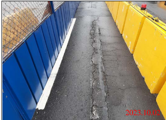
巡查日期地點：112.10.02/ Y23車站 照片說明：路面龜裂狀況