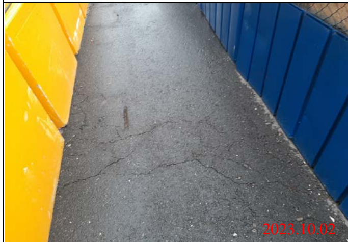
巡查日期地點：112.10.02/ Y23車站 照片說明：路面龜裂狀況