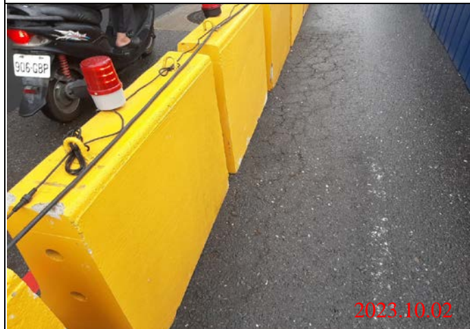
巡查日期地點：112.10.02/ Y23車站 照片說明：路面龜裂狀況