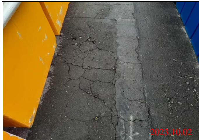
巡查日期地點：112.10.02/ Y23車站 照片說明：路面龜裂狀況