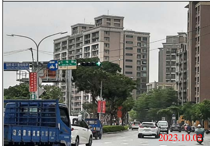
巡查日期地點：112.10.02/ Y23車站 照片說明：牌面設置狀況