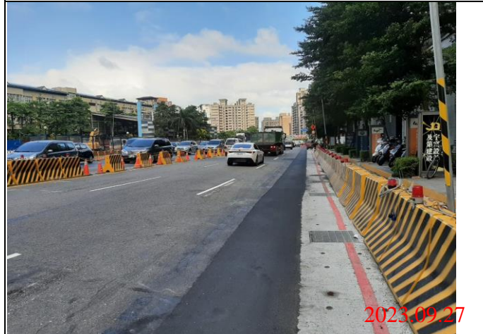
巡查日期地點：112.09.27/ Y23車站 照片說明：路面狀況