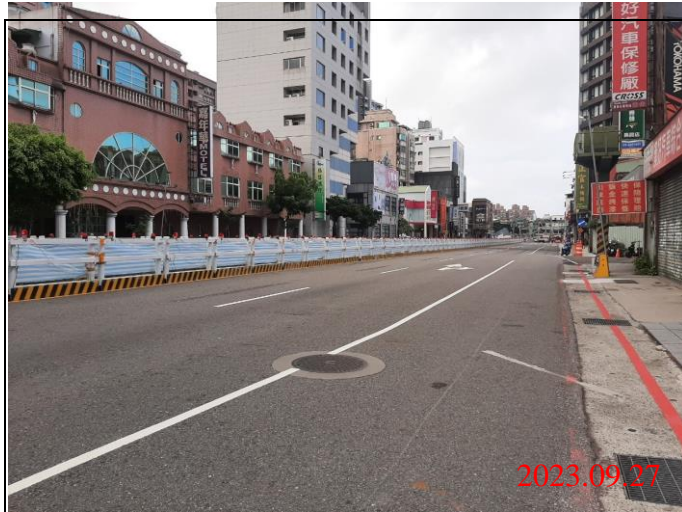
巡查日期地點：112.09.27/ Y21車站 照片說明：路面狀況