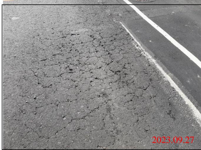
巡查日期地點：112.09.27/ Y23車站 照片說明：路面龜裂狀況