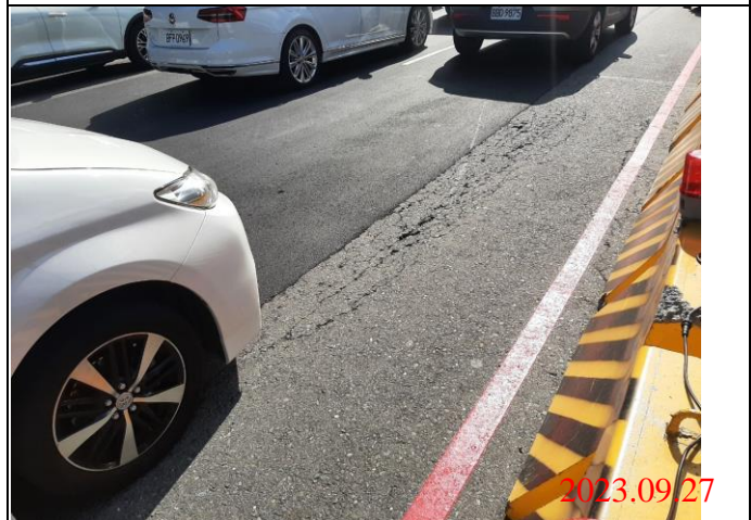
巡查日期地點：112.09.27/ Y23車站 照片說明：路面龜裂狀況