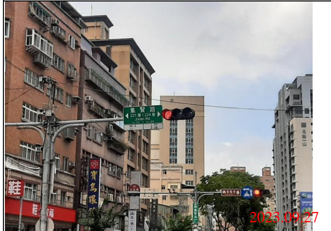
巡查日期地點：112.09.27/ Y22車站 照片說明：牌面設置狀況