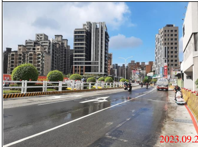
巡查日期地點：112.09.27/ Y22車站 照片說明：路面狀況