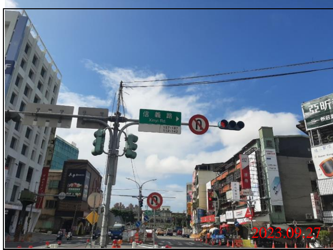
巡查日期地點：112.09.27/ Y21車站 照片說明：牌面設置狀況