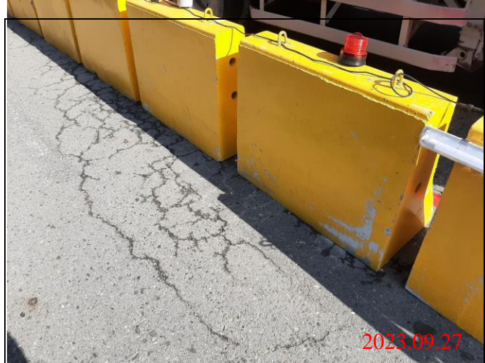
巡查日期地點：112.09.27/ Y23車站 照片說明：路面龜裂狀況