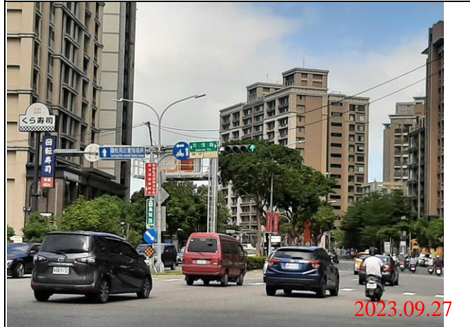
巡查日期地點：112.09.27/ Y23車站 照片說明：牌面設置狀況