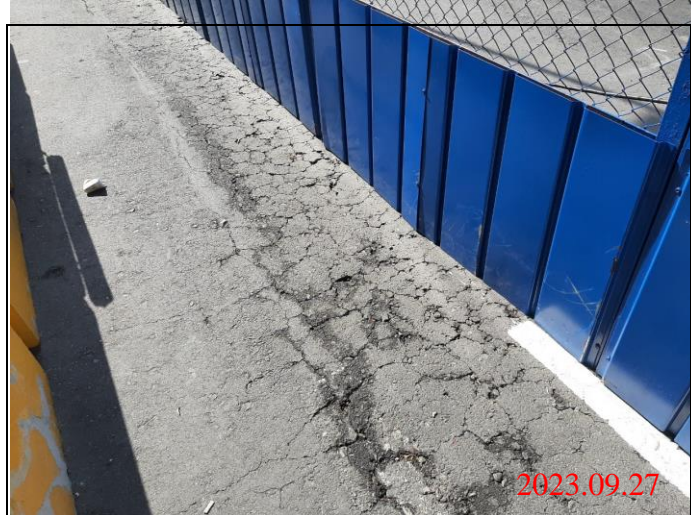
巡查日期地點：112.09.27/ Y23車站 照片說明：路面龜裂狀況