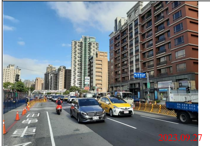
巡查日期地點：112.09.27/ Y23車站 照片說明：路面狀況