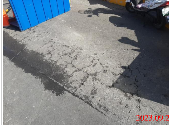
巡查日期地點：112.09.27/ Y23車站 照片說明：路面龜裂狀況