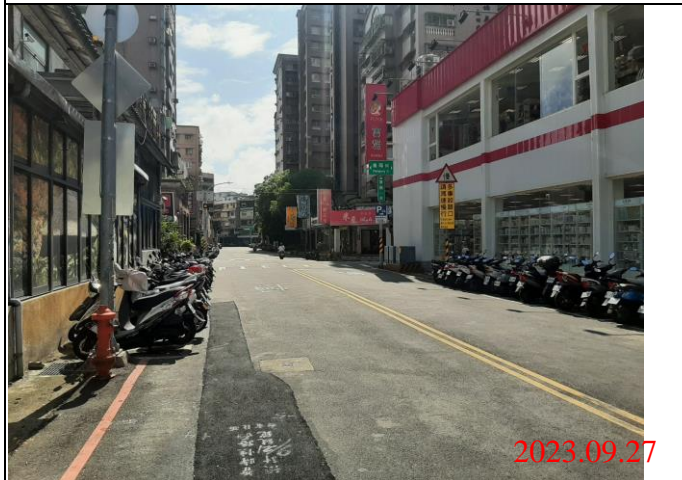
巡查日期地點：112.09.27/ Y21車站 照片說明：路面狀況