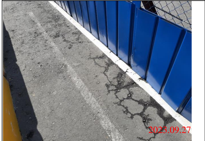
巡查日期地點：112.09.27/ Y23車站 照片說明：路面龜裂狀況