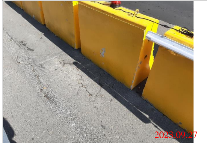
巡查日期地點：112.09.27/ Y23車站 照片說明：路面龜裂狀況