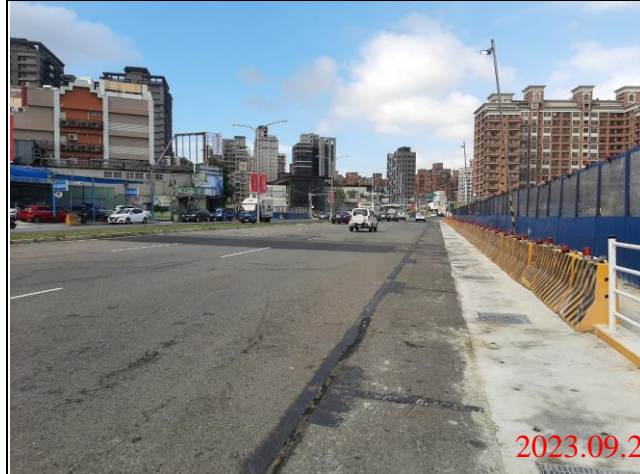
巡查日期地點：112.09.27/ Y22車站 照片說明：路面狀況