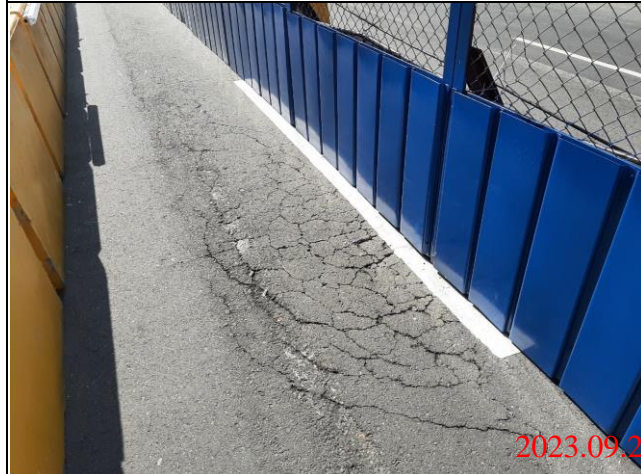
巡查日期地點：112.09.27/ Y23車站 照片說明：路面龜裂狀況