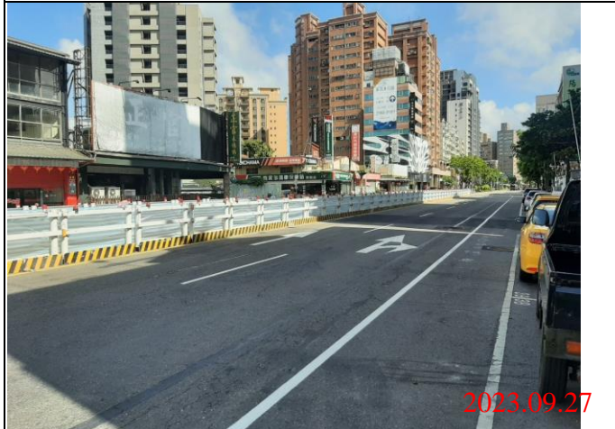
巡查日期地點：112.09.27/ Y21車站 照片說明：路面狀況