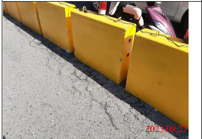
巡查日期地點：112.09.27/ Y23車站 照片說明：路面龜裂狀況