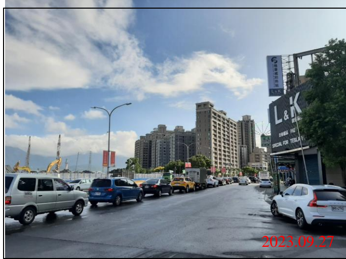
巡查日期地點：112.09.27/ Y22車站 照片說明：路面狀況