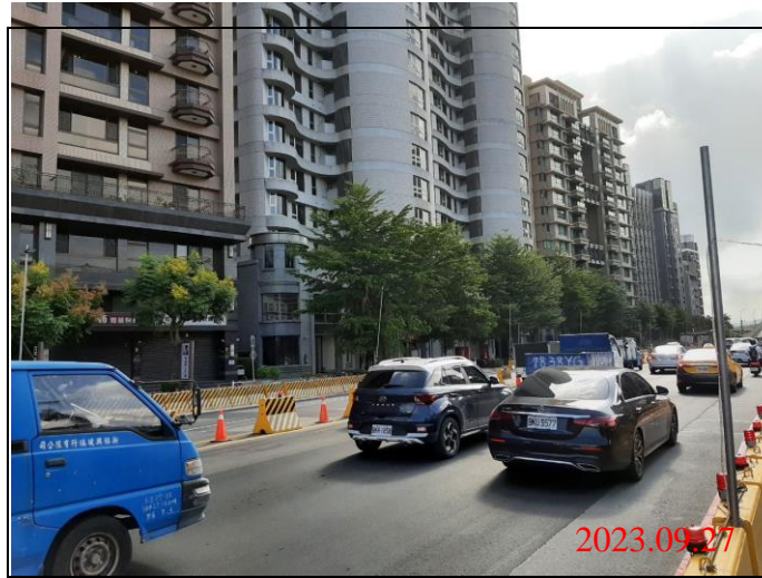
巡查日期地點：112.09.27/ Y23車站 照片說明：路面狀況