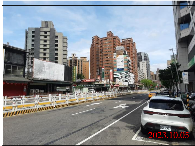
巡查日期地點：112.10.05/ Y21車站 照片說明：路面狀況