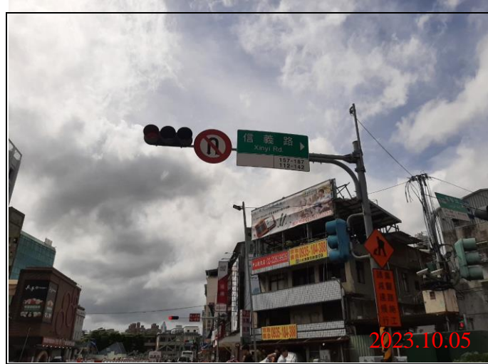
巡查日期地點：112.10.05/ Y21車站 照片說明：牌面設置狀況