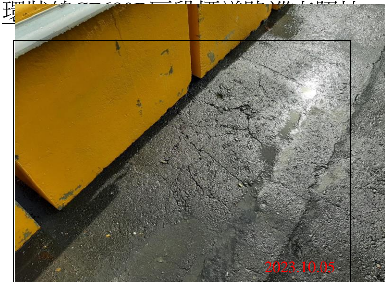
巡查日期地點：112.10.05/ Y23車站 照片說明：路面龜裂狀況