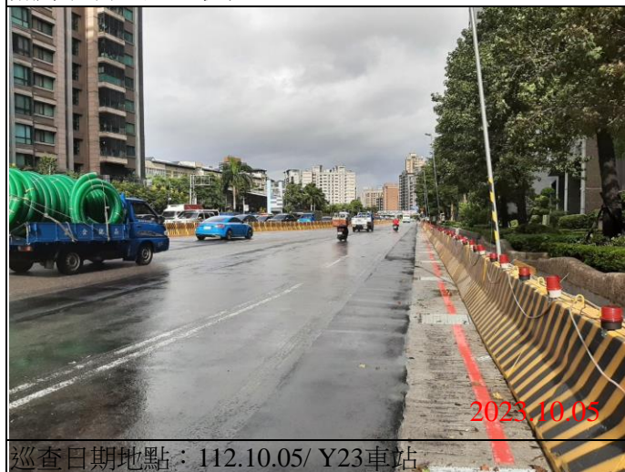
巡查日期地點：112.10.05/ Y23車站 照片說明：路面狀況