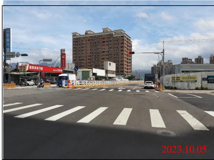
巡查日期地點：112.10.05/ Y22車站 照片說明：路面狀況