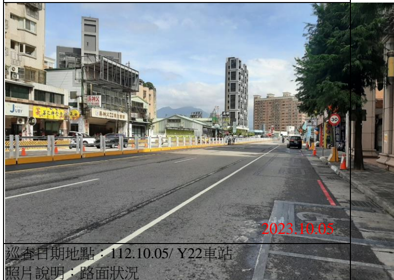
巡查日期地點：112.10.05/ Y22車站 照片說明：路面狀況