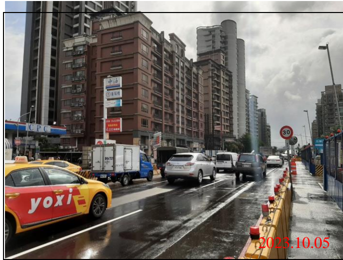
巡查日期地點：112.10.05/ Y23車站 照片說明：路面狀況