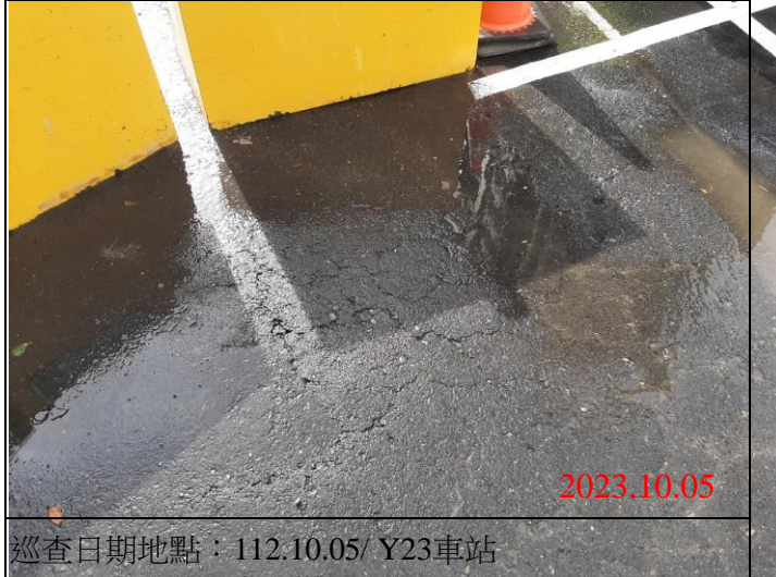
巡查日期地點：112.10.05/ Y23車站 照片說明：路面龜裂狀況