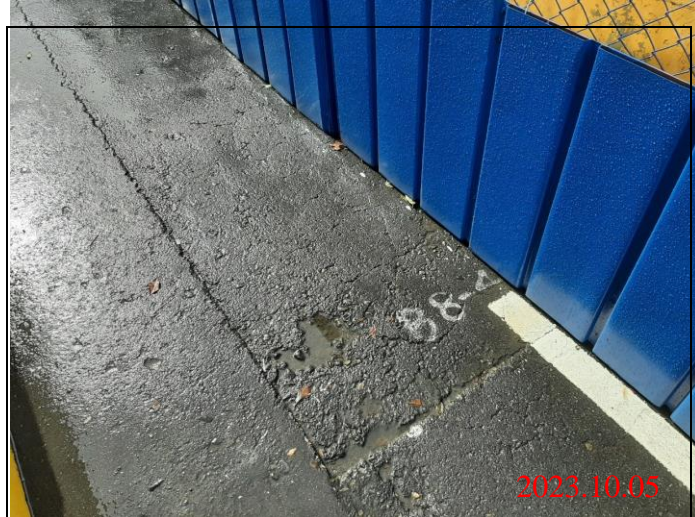
巡查日期地點：112.10.05/ Y23車站 照片說明：路面龜裂狀況