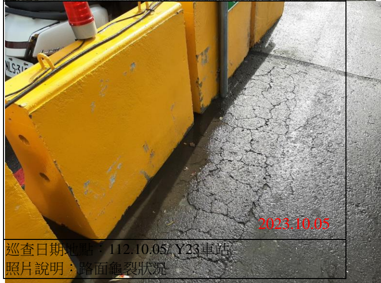
巡查日期地點：112.10.05/ Y23車站 照片說明：路面龜裂狀況