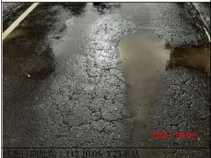
巡查日期地點：112.10.05/ Y23車站 照片說明：路面龜裂狀況