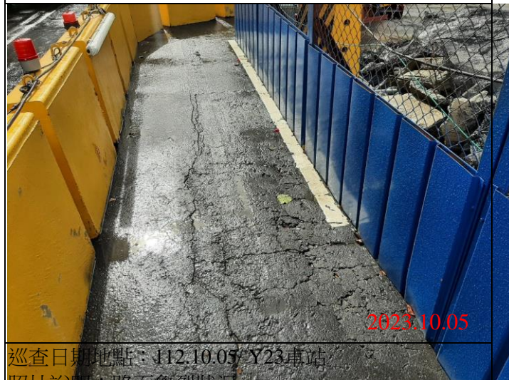
巡查日期地點：112.10.05/ Y23車站 照片說明：路面龜裂狀況