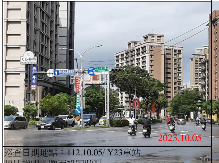
巡查日期地點：112.10.05/ Y23車站 照片說明：牌面設置狀況