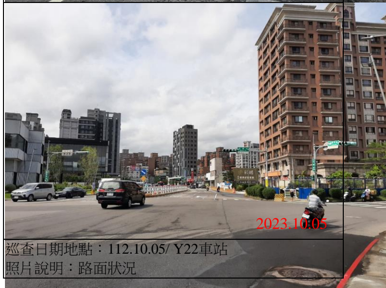
巡查日期地點：112.10.05/ Y22車站 照片說明：路面狀況