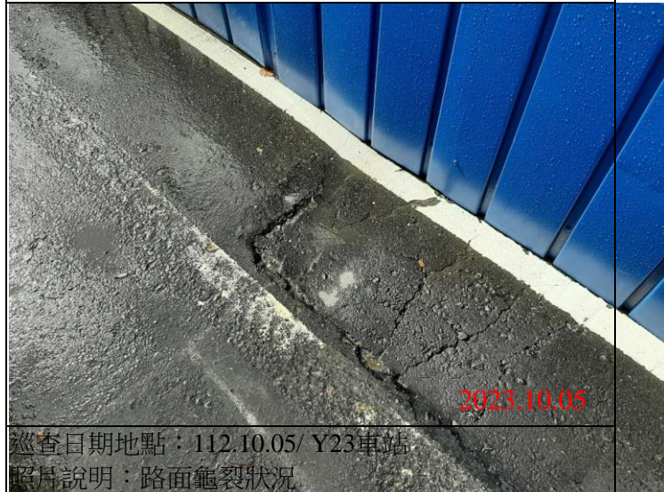
巡查日期地點：112.10.05/ Y23車站 照片說明：路面龜裂狀況