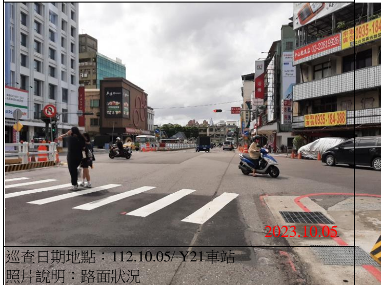
巡查日期地點：112.10.05/ Y21車站 照片說明：路面狀況