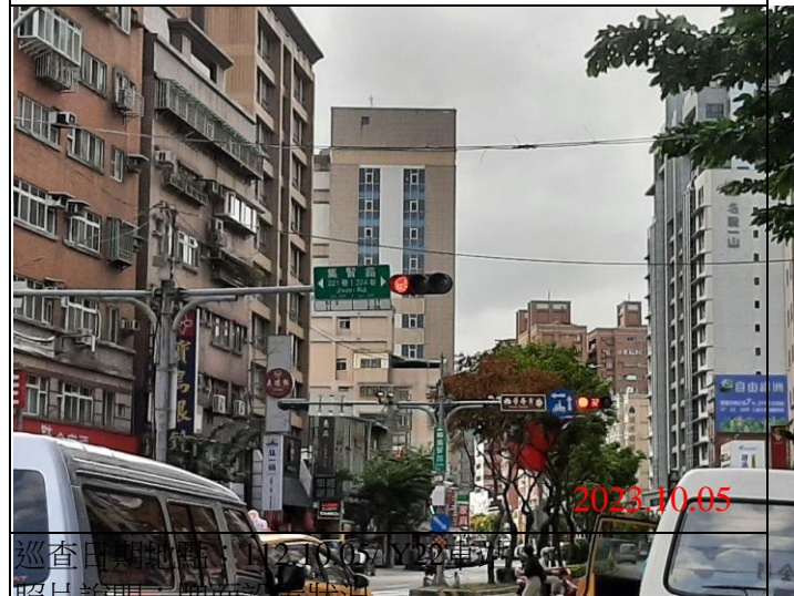
巡查日期地點：112.10.05/ Y21車站 照片說明：牌面設置狀況