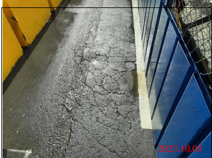
巡查日期地點：112.10.05/ Y23車站 照片說明：路面龜裂狀況