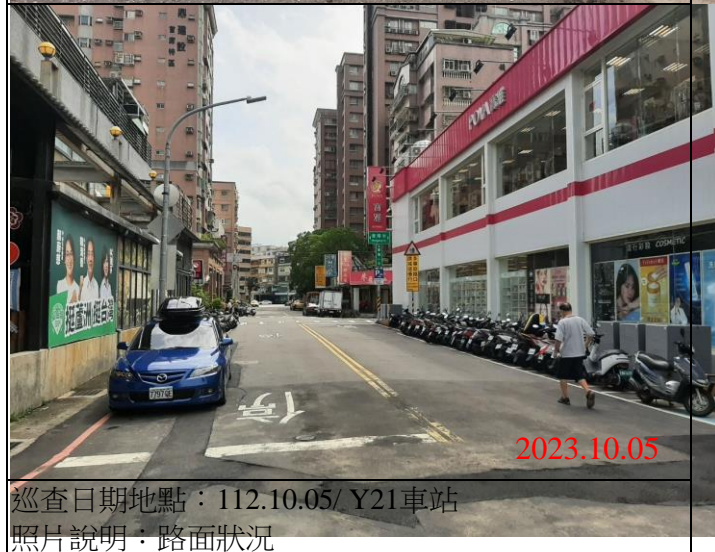
巡查日期地點：112.10.05/ Y21車站 照片說明：路面狀況