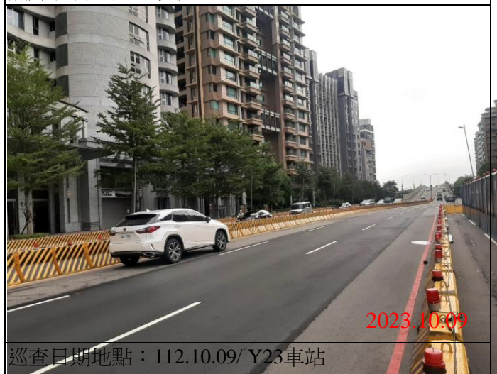
巡查日期地點：112.10.09/ Y23車站 照片說明：路面狀況