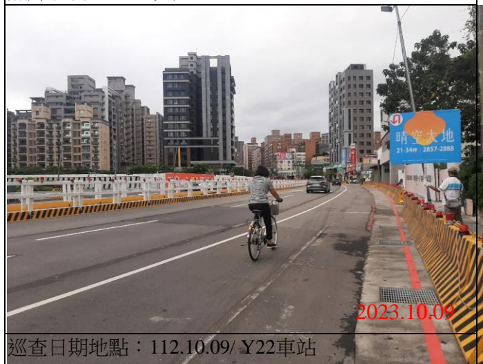
巡查日期地點：112.10.09/ Y22車站 照片說明：路面狀況