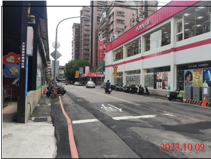
巡查日期地點：112.10.09/ Y21車站 照片說明：路面狀況