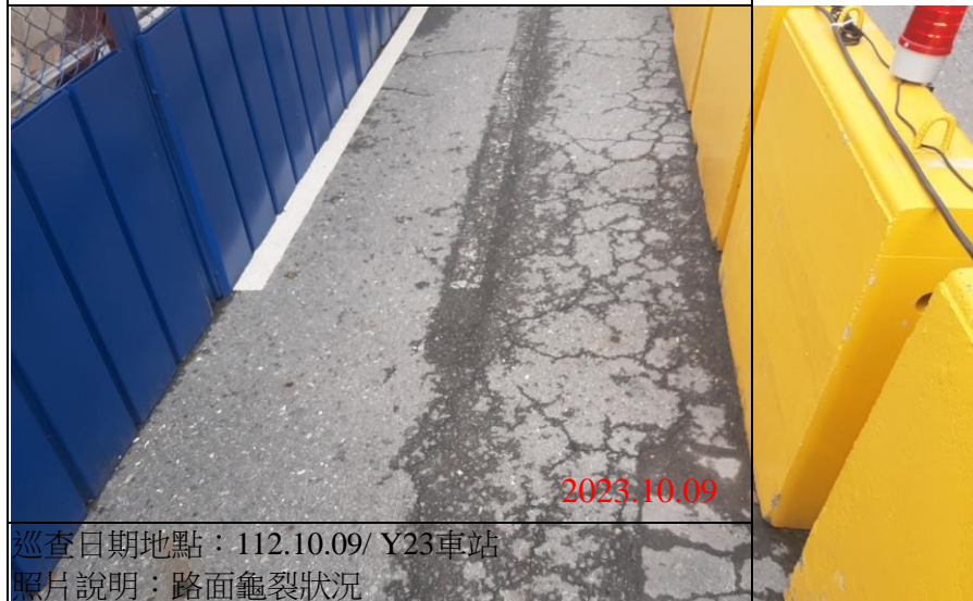
巡查日期地點：112.10.09/ Y23車站 照片說明：路面龜裂狀況