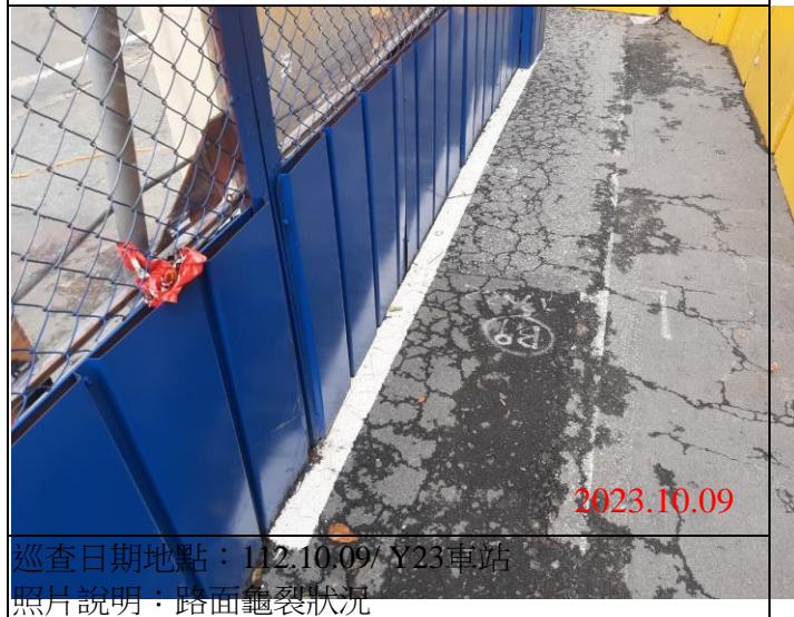
巡查日期地點：112.10.09/ Y23車站 照片說明：路面龜裂狀況