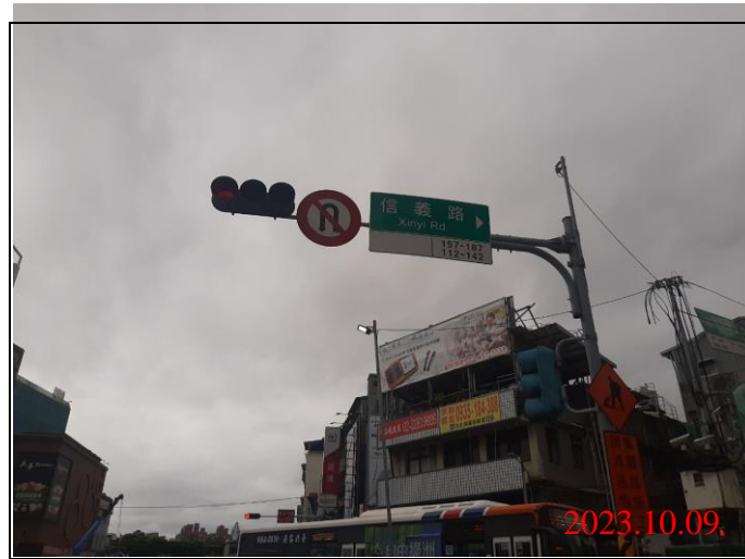
巡查日期地點：112.10.09/ Y21車站 照片說明：牌面設置狀況