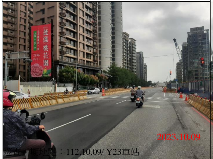
巡查日期地點：112.10.09/ Y23車站 照片說明：路面狀況