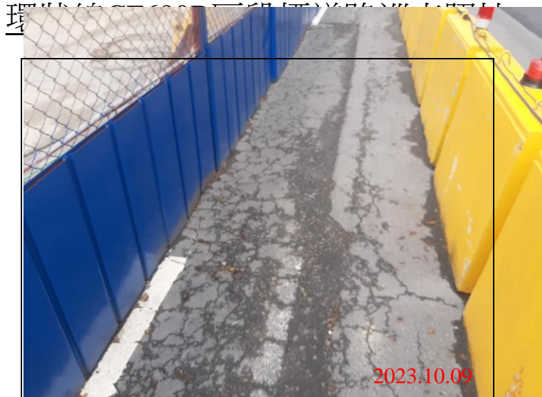
巡查日期地點：112.10.09/ Y23車站 照片說明：路面龜裂狀況