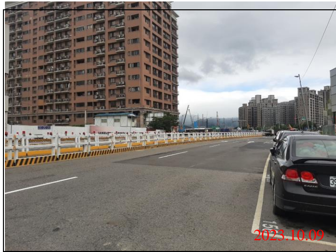
巡查日期地點：112.10.09/ Y22車站 照片說明：路面狀況