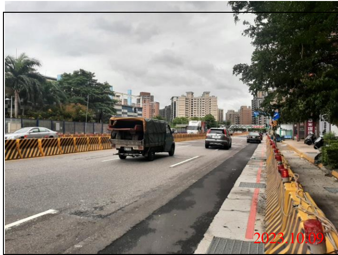
巡查日期地點：112.10.09/ Y23車站 照片說明：路面狀況