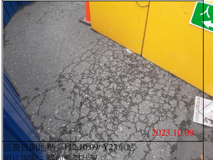
巡查日期地點：112.10.09/ Y23車站 照片說明：路面龜裂狀況