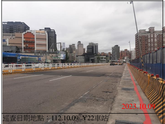
巡查日期地點：112.10.09/ Y22車站 照片說明：路面狀況