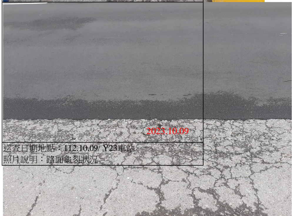
巡查日期地點：112.10.09/ Y23車站 照片說明：路面龜裂狀況