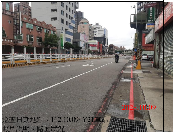
巡查日期地點：112.10.09/ Y21車站 照片說明：路面狀況