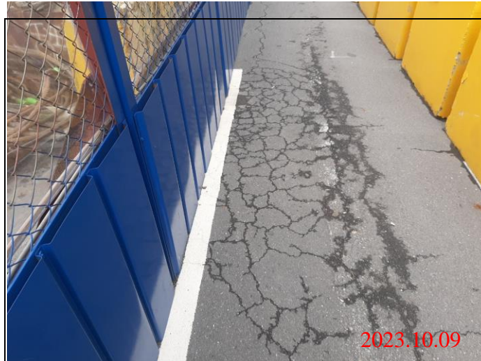
巡查日期地點：112.10.09/ Y23車站 照片說明：路面龜裂狀況