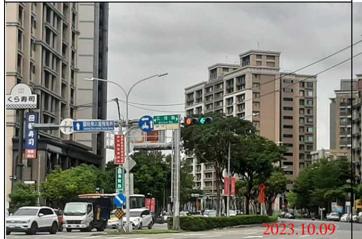
巡查日期地點：112.10.09/ Y23車站 照片說明：牌面設置狀況