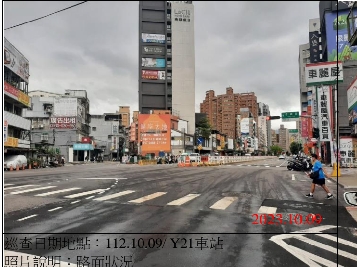
巡查日期地點：112.10.09/ Y21車站 照片說明：路面狀況