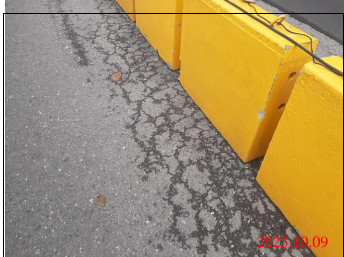
巡查日期地點：112.10.09/ Y23車站 照片說明：路面龜裂狀況