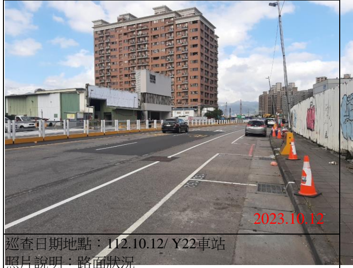
巡查日期地點：112.10.12/ Y22車站 照片說明：路面狀況