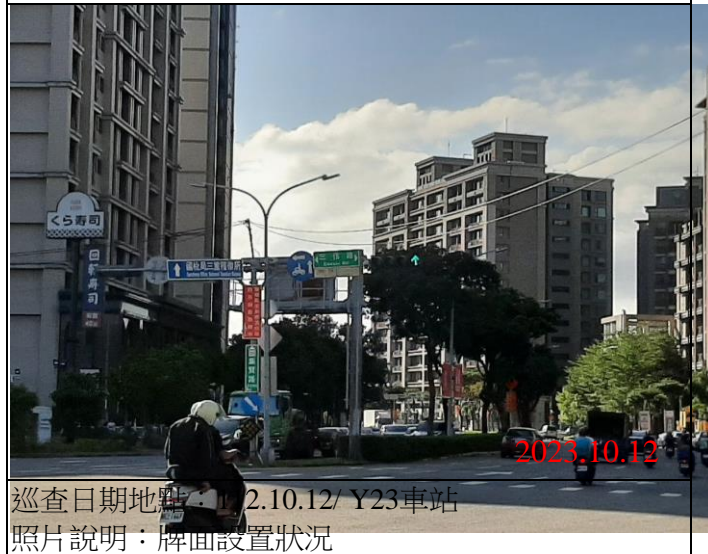
巡查日期地點：112.10.12/ Y23車站 照片說明：牌面設置狀況