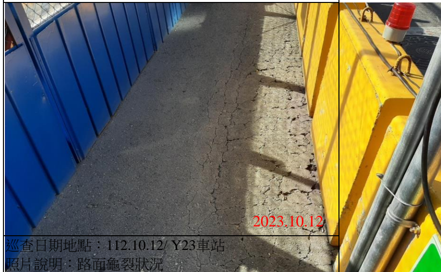
巡查日期地點：112.10.12/ Y23車站 照片說明：路面龜裂狀況