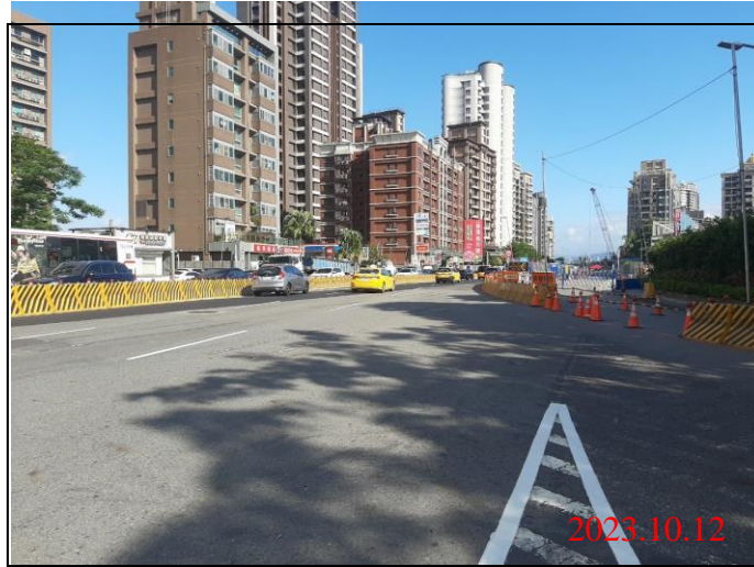
巡查日期地點：112.10.12/ Y23車站 照片說明：路面狀況