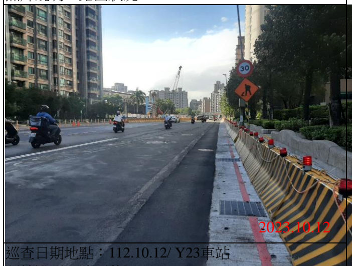
巡查日期地點：112.10.12/ Y23車站 照片說明：路面狀況