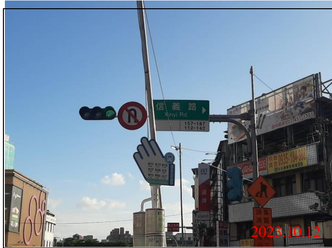
巡查日期地點：112.10.12/ Y21車站 照片說明：牌面設置狀況