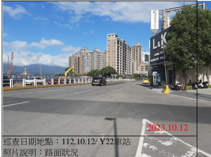
巡查日期地點：112.10.12/ Y22車站 照片說明：路面狀況