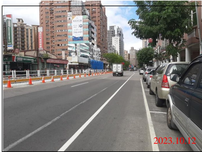
巡查日期地點：112.10.12/ Y21車站 照片說明：路面狀況