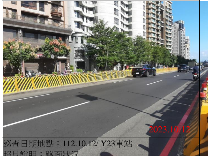
巡查日期地點：112.10.12/ Y23車站 照片說明：路面狀況