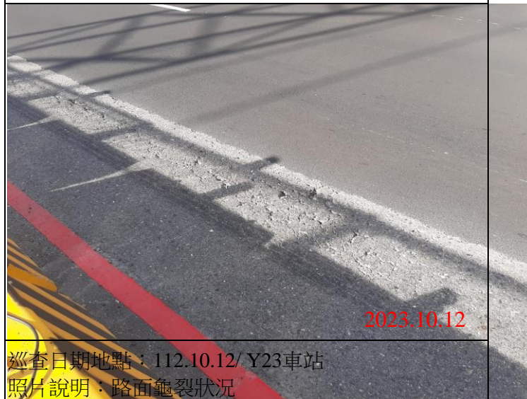
巡查日期地點：112.10.12/ Y23車站 照片說明：路面龜裂狀況