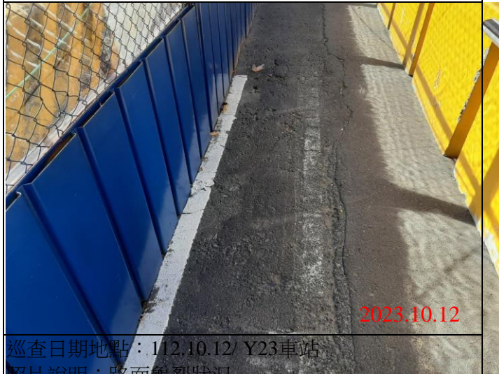
巡查日期地點：112.10.12/ Y23車站 照片說明：路面龜裂狀況