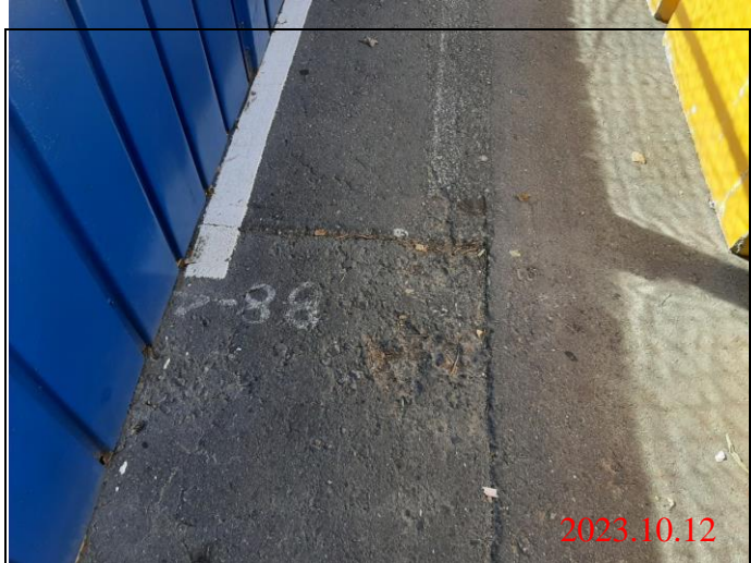
巡查日期地點：112.10.12/ Y23車站 照片說明：路面龜裂狀況