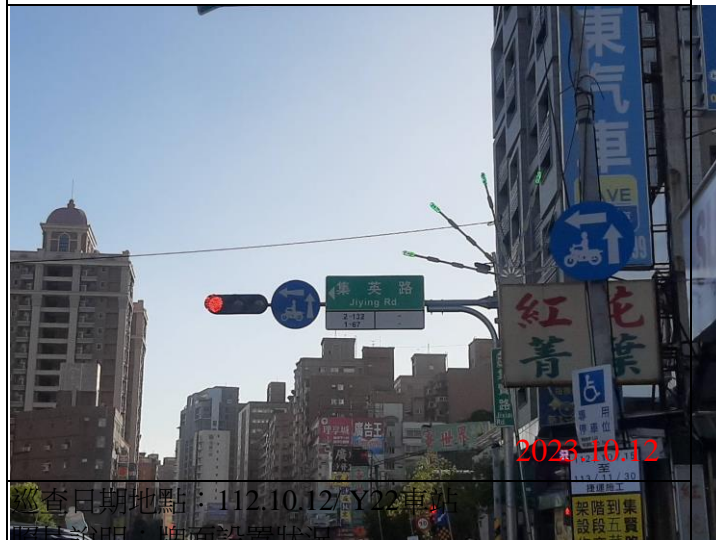
巡查日期地點：112.10.12/ Y22車站 照片說明：牌面設置狀況