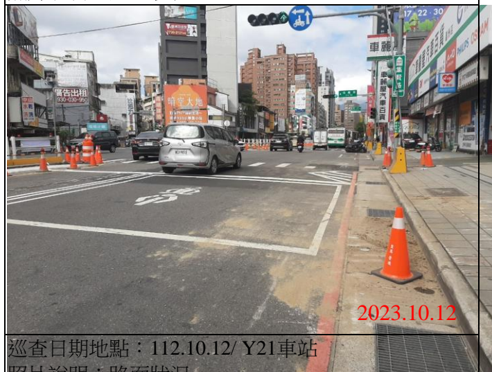
巡查日期地點：112.10.12/ Y21車站 照片說明：路面狀況