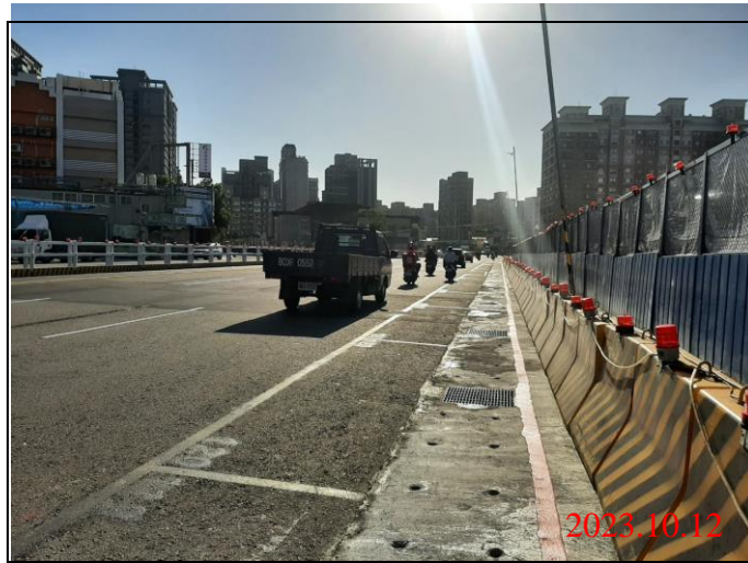
巡查日期地點：112.10.12/ Y22車站 照片說明：路面狀況