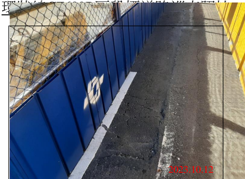
巡查日期地點：112.10.12/ Y23車站 照片說明：路面龜裂狀況