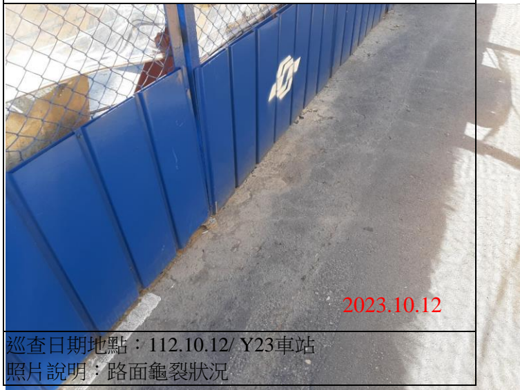
巡查日期地點：112.10.12/ Y23車站 照片說明：路面龜裂狀況