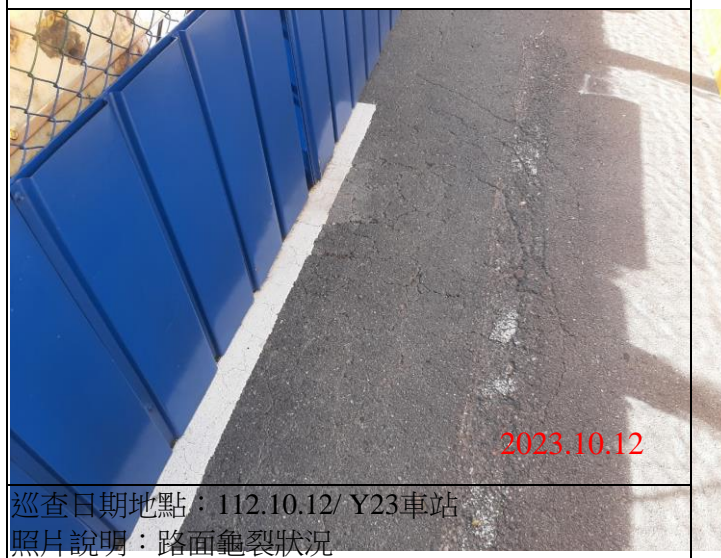
巡查日期地點：112.10.12/ Y23車站 照片說明：路面龜裂狀況