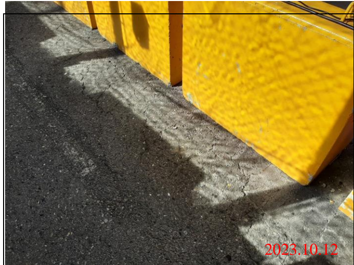
巡查日期地點：112.10.12/ Y23車站 照片說明：路面龜裂狀況