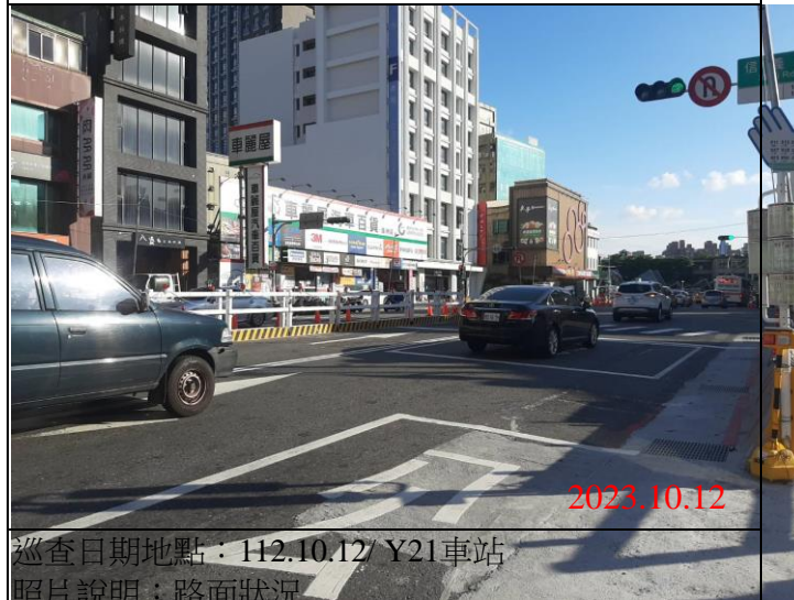
巡查日期地點：112.10.12/ Y21車站 照片說明：路面狀況