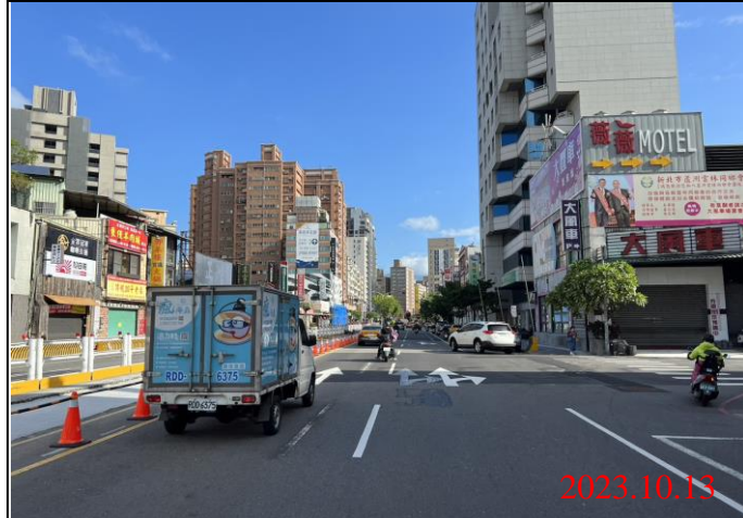
巡查日期地點：112.10.13/ Y21車站 照片說明：路面狀況