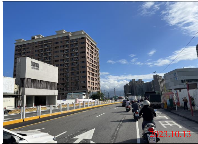
巡查日期地點：112.10.13/ Y22車站 照片說明：路面狀況