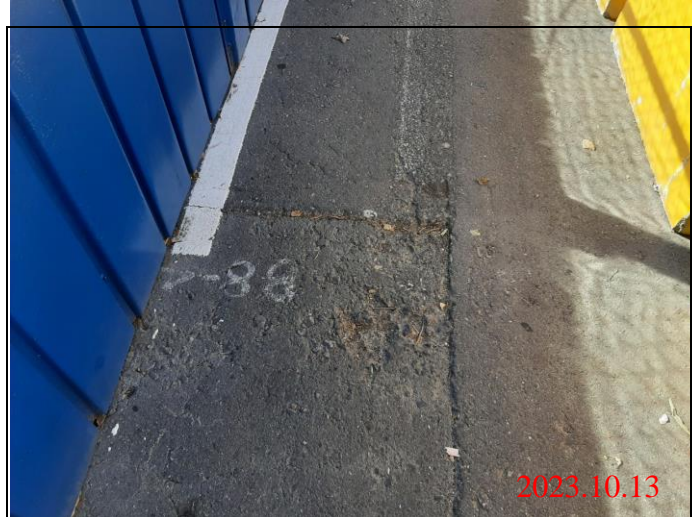
巡查日期地點：112.10.13/ Y23車站 照片說明：路面龜裂狀況