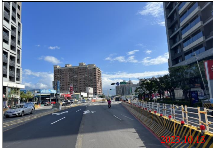
巡查日期地點：112.10.13/ Y22車站 照片說明：路面狀況