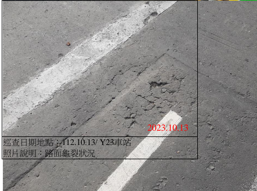
巡查日期地點：112.10.13/ Y23車站 照片說明：路面龜裂狀況