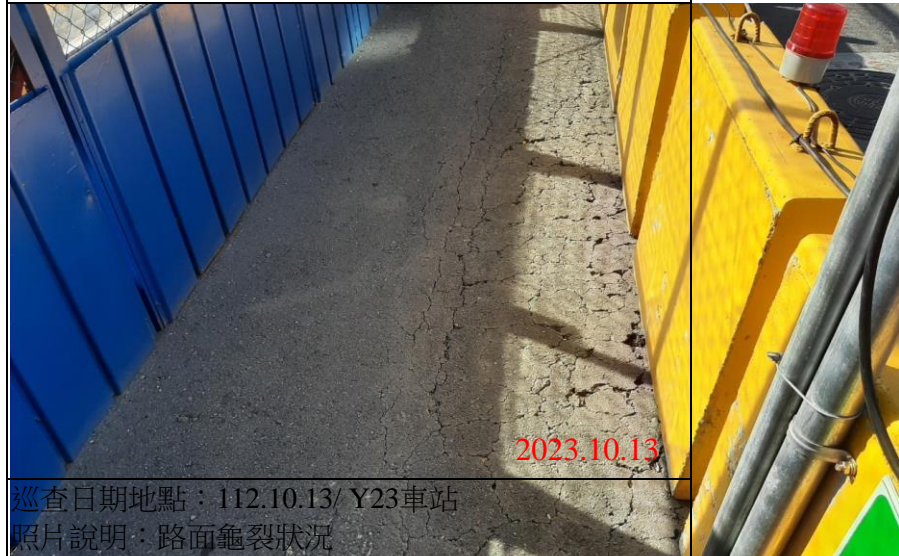
巡查日期地點：112.10.13/ Y23車站 照片說明：路面龜裂狀況