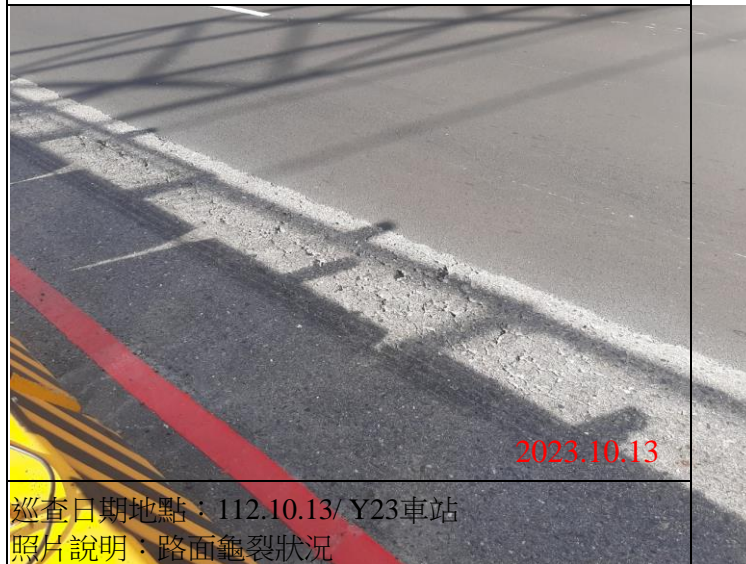
巡查日期地點：112.10.13/ Y23車站 照片說明：路面龜裂狀況