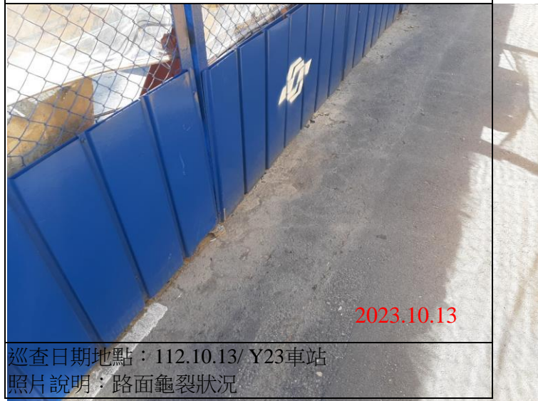
巡查日期地點：112.10.13/ Y23車站 照片說明：路面龜裂狀況