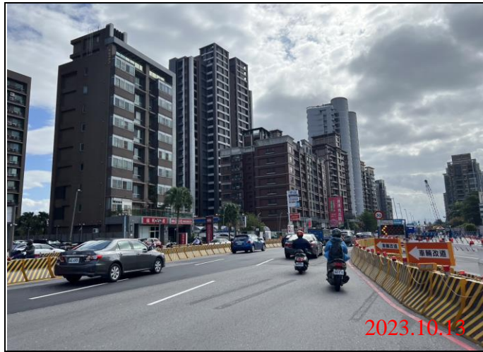
巡查日期地點：112.10.13/ Y23車站 照片說明：路面狀況