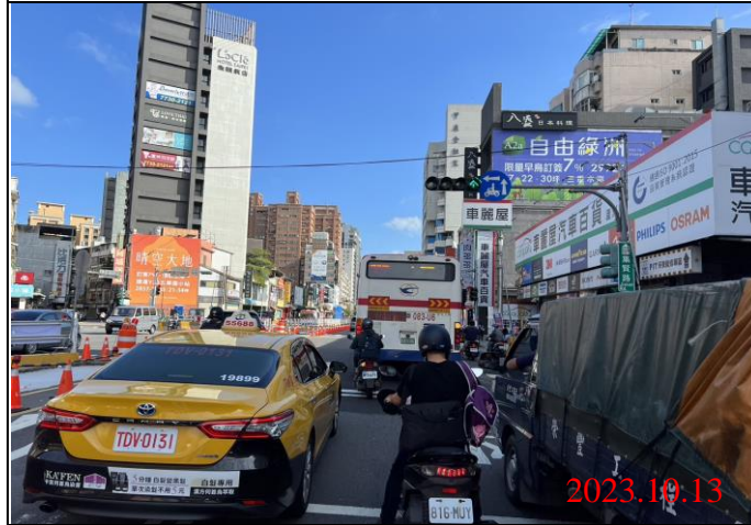
巡查日期地點：112.10.13/ Y21車站 照片說明：路面狀況