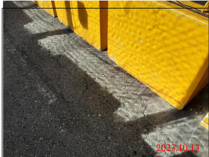
巡查日期地點：112.10.13/ Y23車站 照片說明：路面龜裂狀況