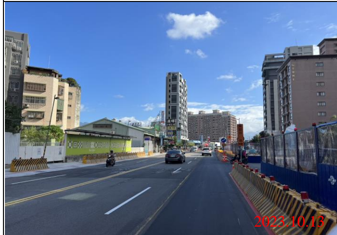
巡查日期地點：112.10.13/ Y22車站 照片說明：路面狀況