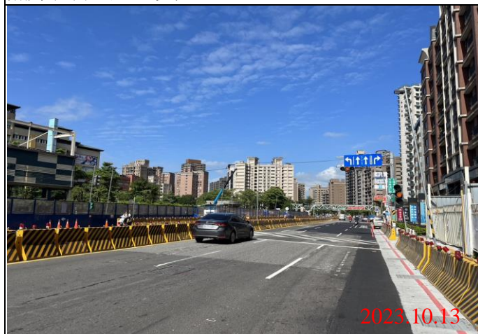
巡查日期地點：112.10.13/ Y23車站 照片說明：路面狀況