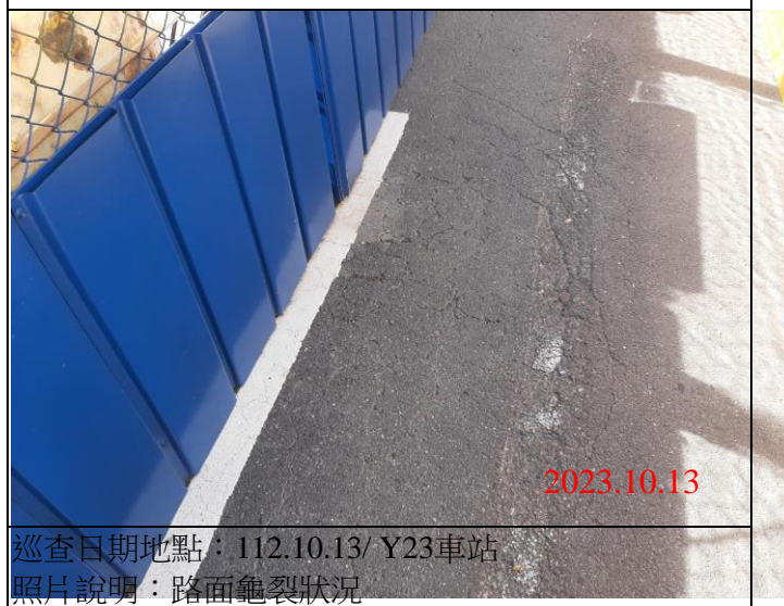
巡查日期地點：112.10.13/ Y23車站 照片說明：路面龜裂狀況