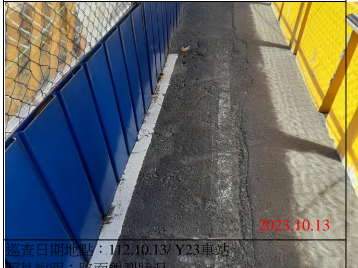
巡查日期地點：112.10.13/ Y23車站 照片說明：路面龜裂狀況