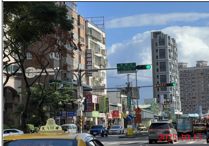
巡查日期地點：112.10.13/ Y22車站 照片說明：牌面設置狀況