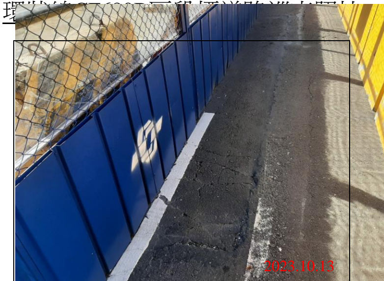
巡查日期地點：112.10.13/ Y23車站 照片說明：路面龜裂狀況