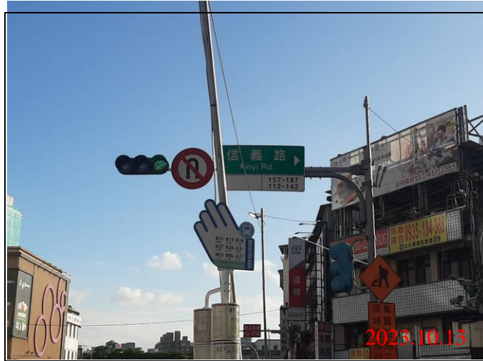
巡查日期地點：112.10.13/ Y21車站 照片說明：牌面設置狀況