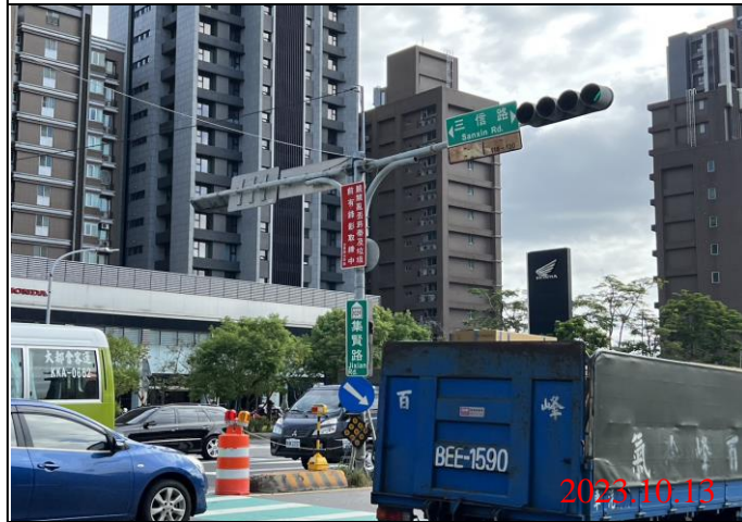
巡查日期地點：112.10.13/ Y23車站 照片說明：牌面設置狀況