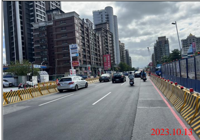
巡查日期地點：112.10.13/ Y23車站 照片說明：路面狀況