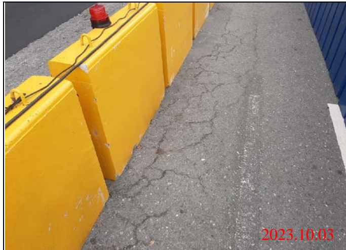
巡查日期地點：112.10.03/ Y23車站 照片說明：路面龜裂狀況