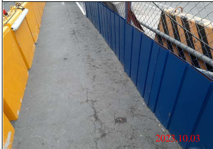
巡查日期地點：112.10.03/ Y23車站 照片說明：路面龜裂狀況