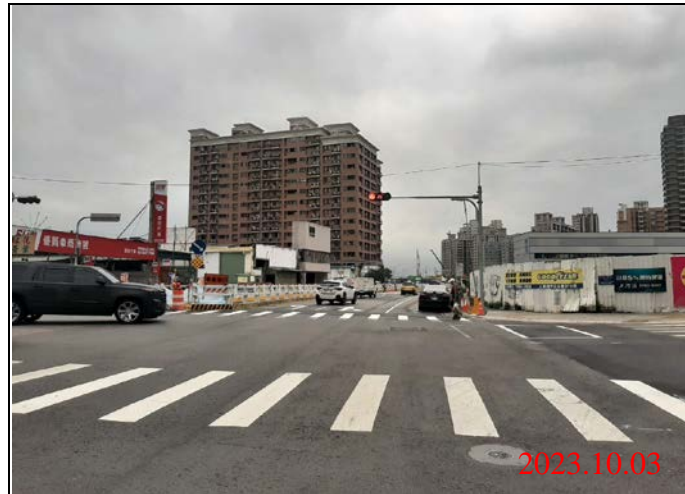
巡查日期地點：112.10.03/ Y22車站 照片說明：路面狀況