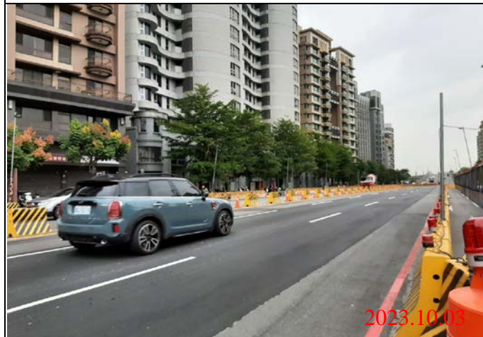
巡查日期地點：112.10.03/ Y23車站 照片說明：路面狀況