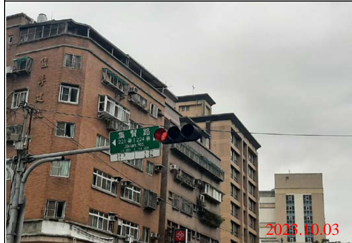
巡查日期地點：112.10.03/ Y22車站 照片說明：牌面設置狀況