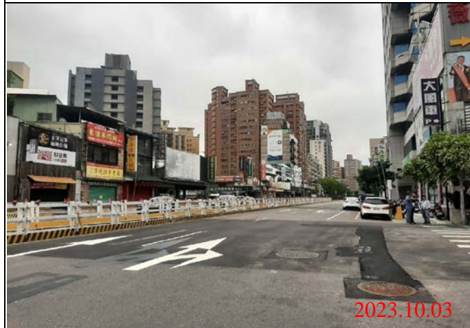
巡查日期地點：112.10.03/ Y21車站 照片說明：路面狀況