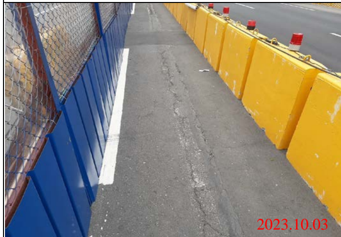
巡查日期地點：112.10.03/ Y23車站 照片說明：路面龜裂狀況