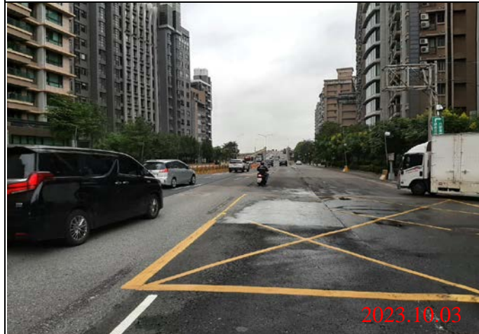
巡查日期地點：112.10.03/ Y23車站 照片說明：路面狀況