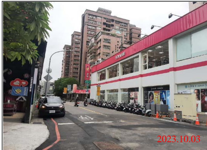
巡查日期地點：112.10.03/ Y21車站 照片說明：路面狀況