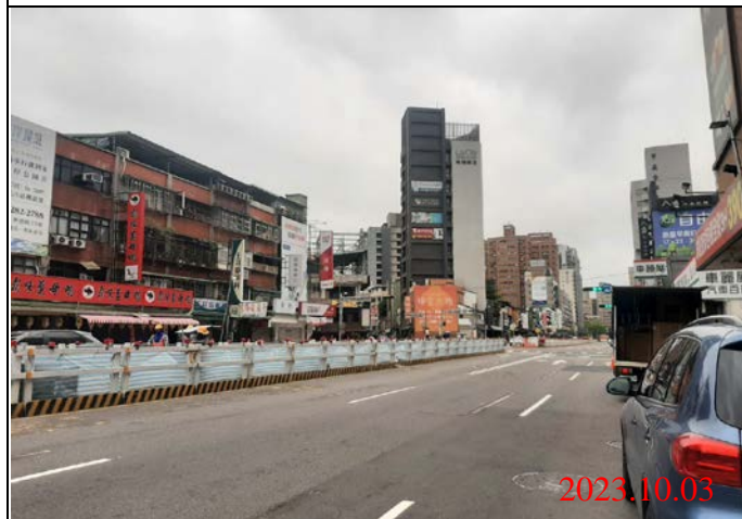
巡查日期地點：112.10.03/ Y21車站 照片說明：路面狀況