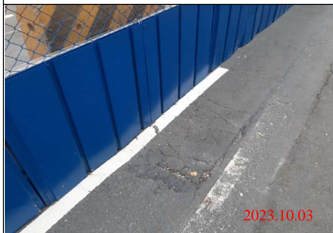
巡查日期地點：112.10.03/ Y23車站 照片說明：路面龜裂狀況