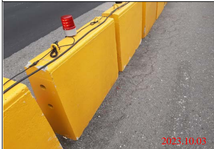
巡查日期地點：112.10.03/ Y23車站 照片說明：路面龜裂狀況