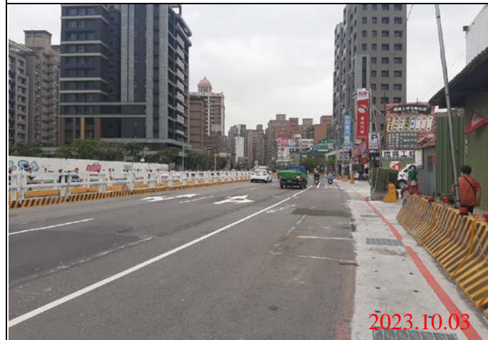
巡查日期地點：112.10.03/ Y22車站 照片說明：路面狀況