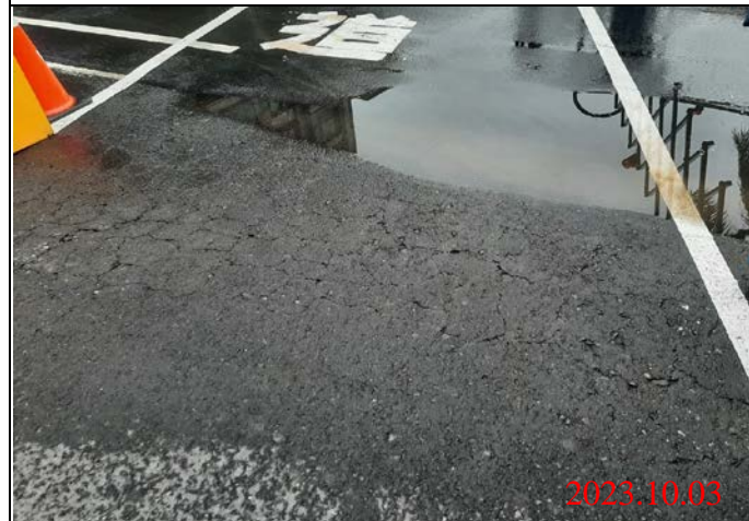
巡查日期地點：112.10.03/ Y23車站 照片說明：路面龜裂狀況