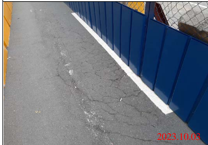
巡查日期地點：112.10.03/ Y23車站 照片說明：路面龜裂狀況