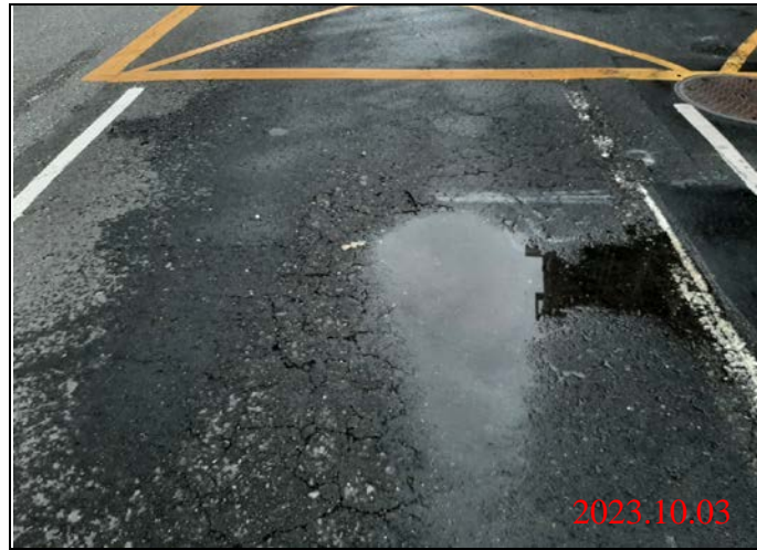
巡查日期地點：112.10.03/ Y23車站 照片說明：路面龜裂狀況