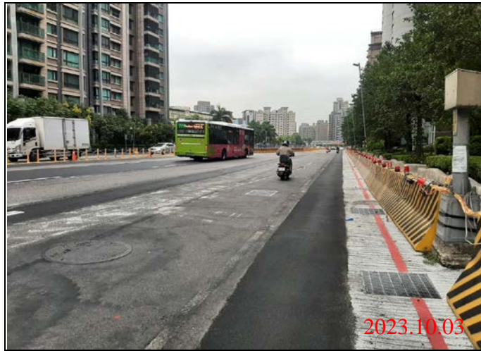
巡查日期地點：112.10.03 Y23車站 照片說明：路面狀況