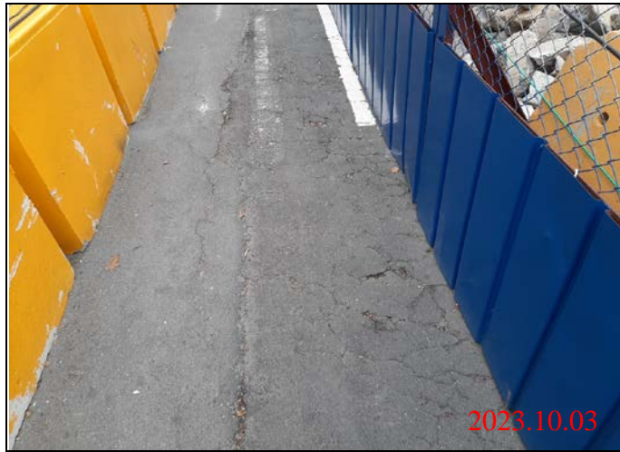
巡查日期地點：112.10.03 Y23車站 照片說明：路面龜裂狀況