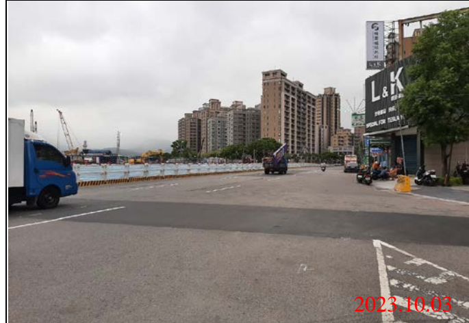
巡查日期地點：112.10.03/ Y22車站 照片說明：路面狀況