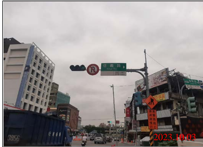
巡查日期地點：112.10.03/ Y21車站 照片說明：牌面設置狀況