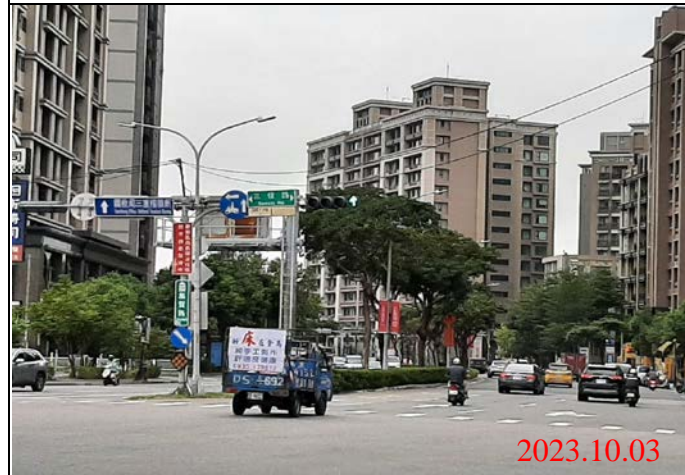
巡查日期地點：112.10.03/ Y23車站 照片說明：牌面設置狀況