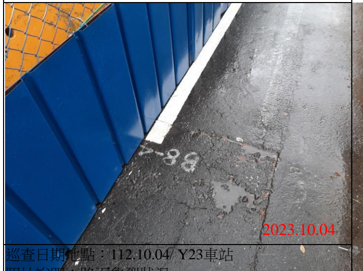
巡查日期地點：112.10.04/ Y23車站 照片說明：路面龜裂狀況