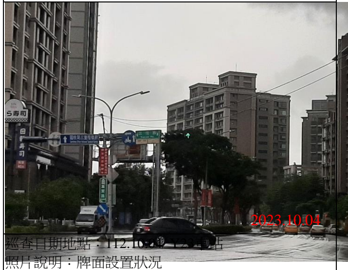
巡查日期地點：112.10.04/ Y23車站 照片說明：牌面設置狀況