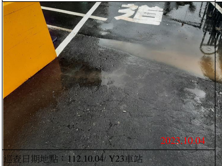
巡查日期地點：112.10.04/ Y23車站 照片說明：路面龜裂狀況