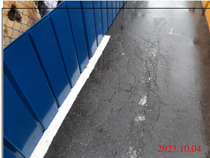
巡查日期地點：112.10.04 Y23車站 照片說明：路面龜裂狀況