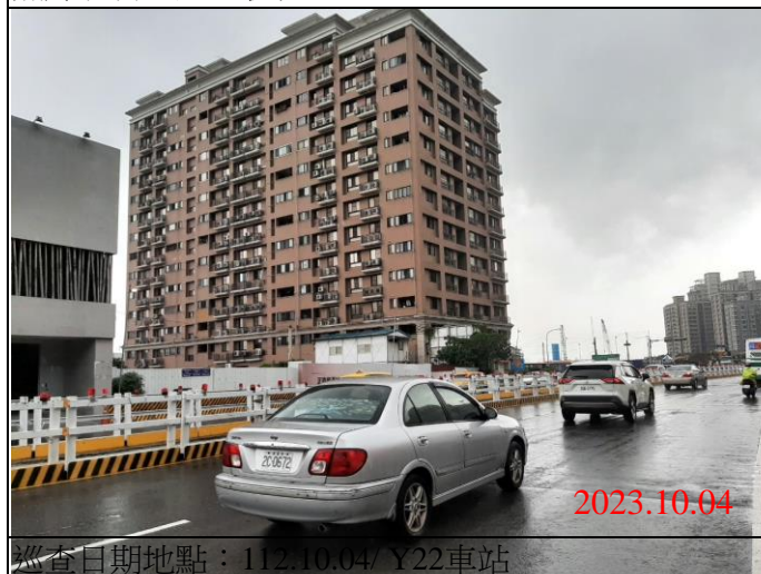
巡查日期地點：112.10.04/ Y22車站 照片說明：路面狀況