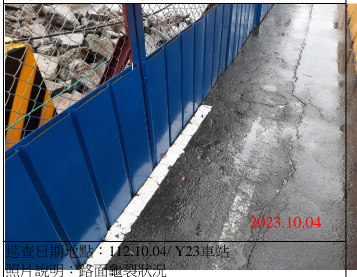
巡查日期地點：112.10.04/ Y23車站 照片說明：路面龜裂狀況