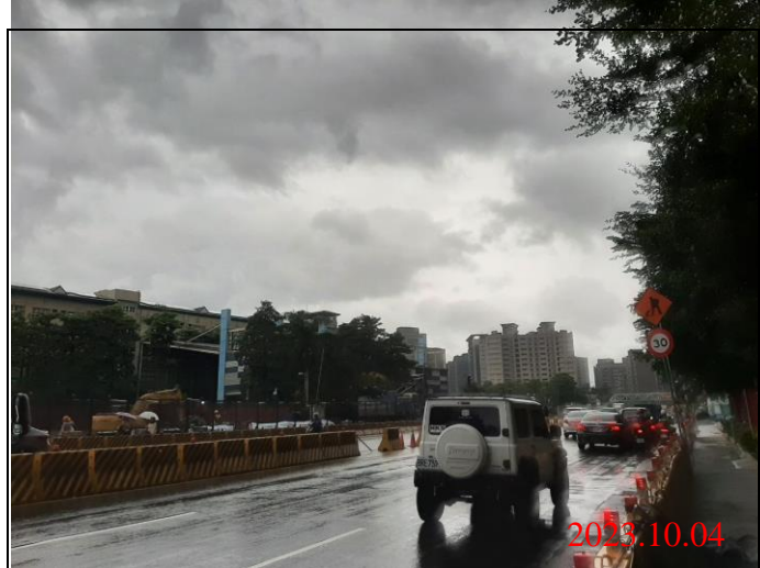
巡查日期地點：112.10.04 Y23車站 照片說明：路面狀況