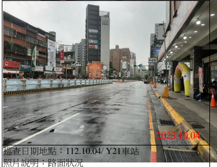
巡查日期地點：112.10.04/ Y21車站 照片說明：路面狀況