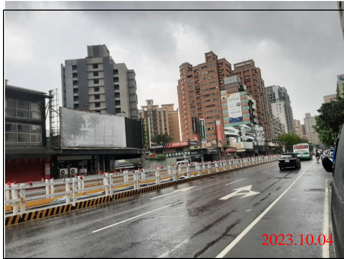
巡查日期地點：112.10.04/ Y21車站 照片說明：路面狀況