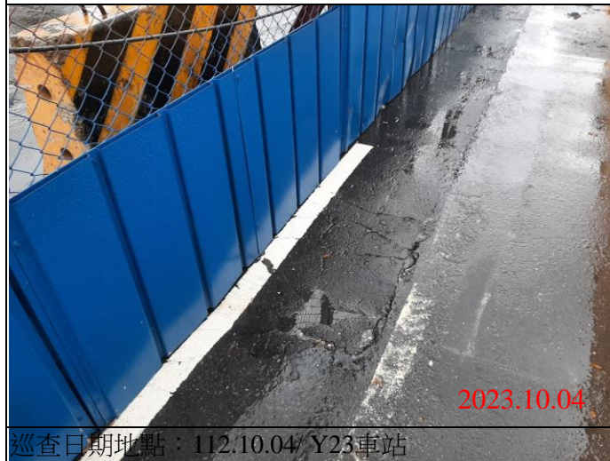
巡查日期地點：112.10.04/ Y23車站 照片說明：路面龜裂狀況