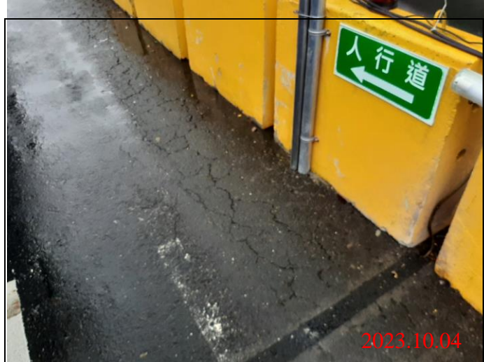
巡查日期地點：112.10.04/ Y23車站 照片說明：路面龜裂狀況