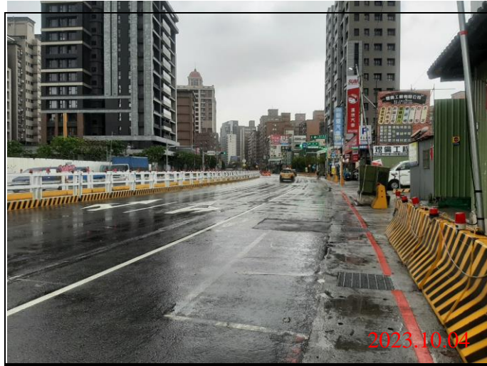
巡查日期地點：112.10.04/ Y22車站 照片說明：路面狀況