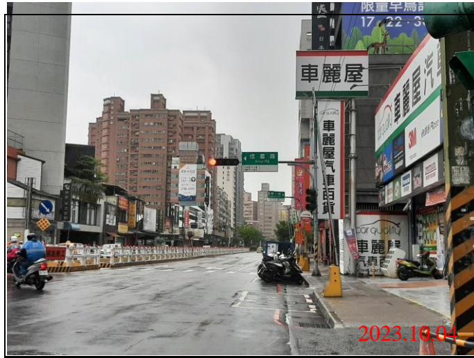
巡查日期地點：112.10.04/ Y21車站 照片說明：牌面設置狀況