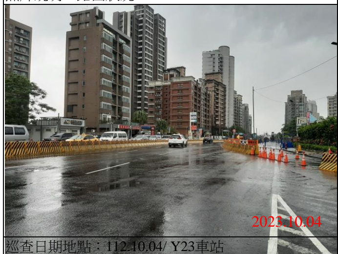
巡查日期地點：112.10.04/ Y23車站 照片說明：路面狀況