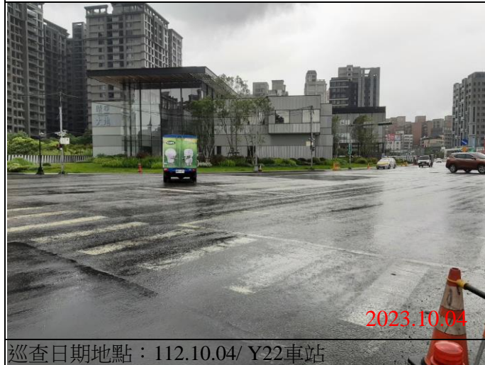
巡查日期地點：112.10.04/ Y22車站 照片說明：路面狀況