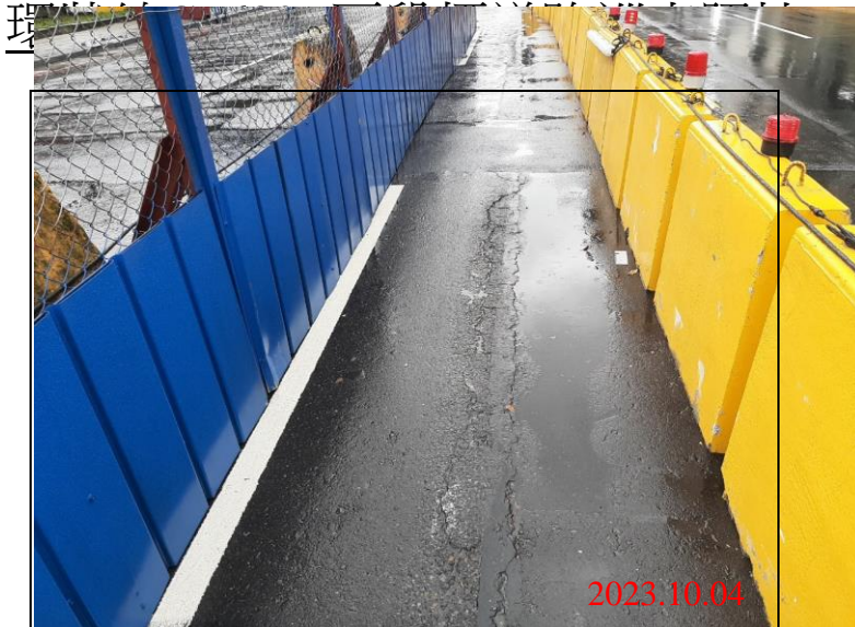
巡查日期地點：112.10.04/ Y23車站 照片說明：路面龜裂狀況