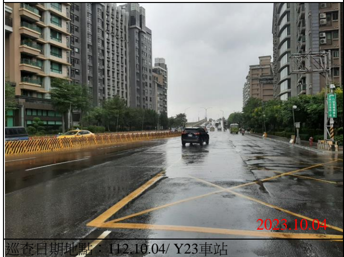
巡查日期地點：112.10.04/ Y23車站 照片說明：路面狀況