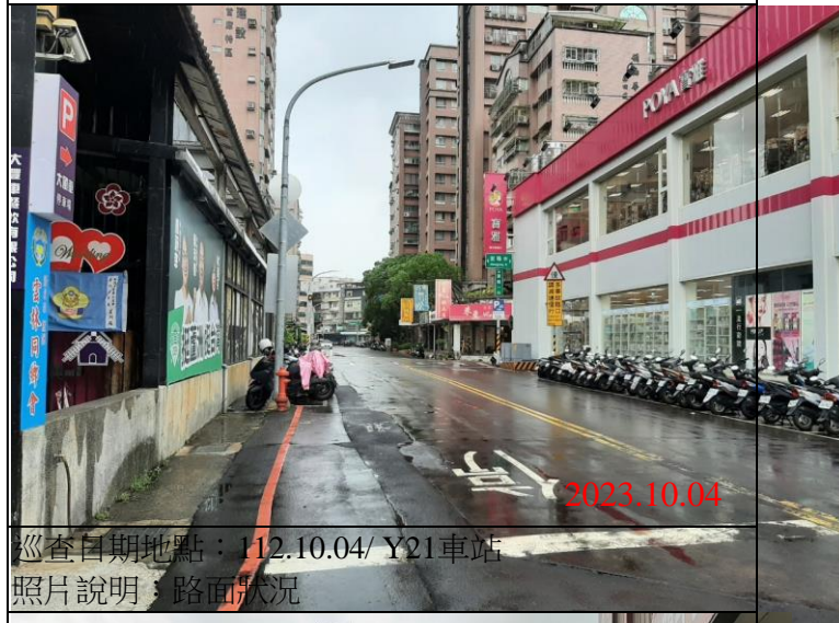
巡查日期地點：112.10.04/ Y21車站 照片說明：路面狀況