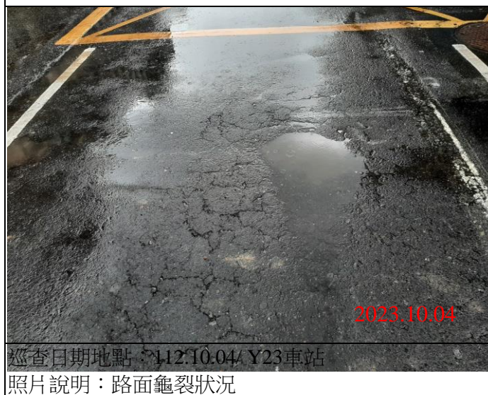
巡查日期地點：112.10.04/ Y23車站 照片說明：路面龜裂狀況