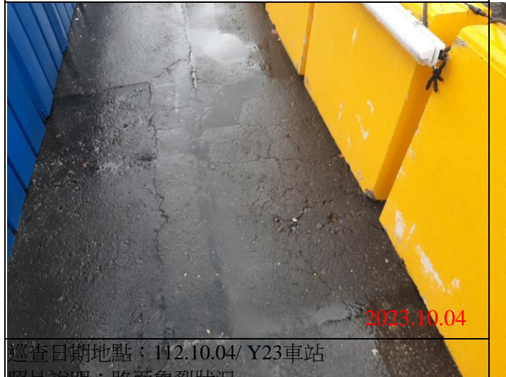
巡查日期地點：112.10.04/ Y23車站 照片說明：路面龜裂狀況