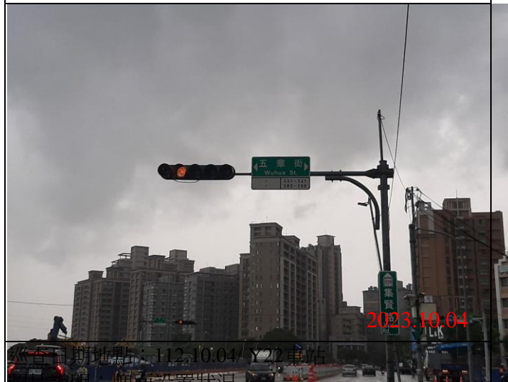
巡查日期地點：112.10.04/ Y22車站 照片說明：牌面設置狀況