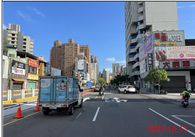
巡查日期地點：112.10.13/ Y21車站 照片說明：路面狀況