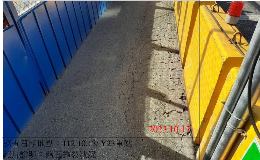
巡查日期地點：112.10.13/ Y23車站 照片說明：路面龜裂狀況