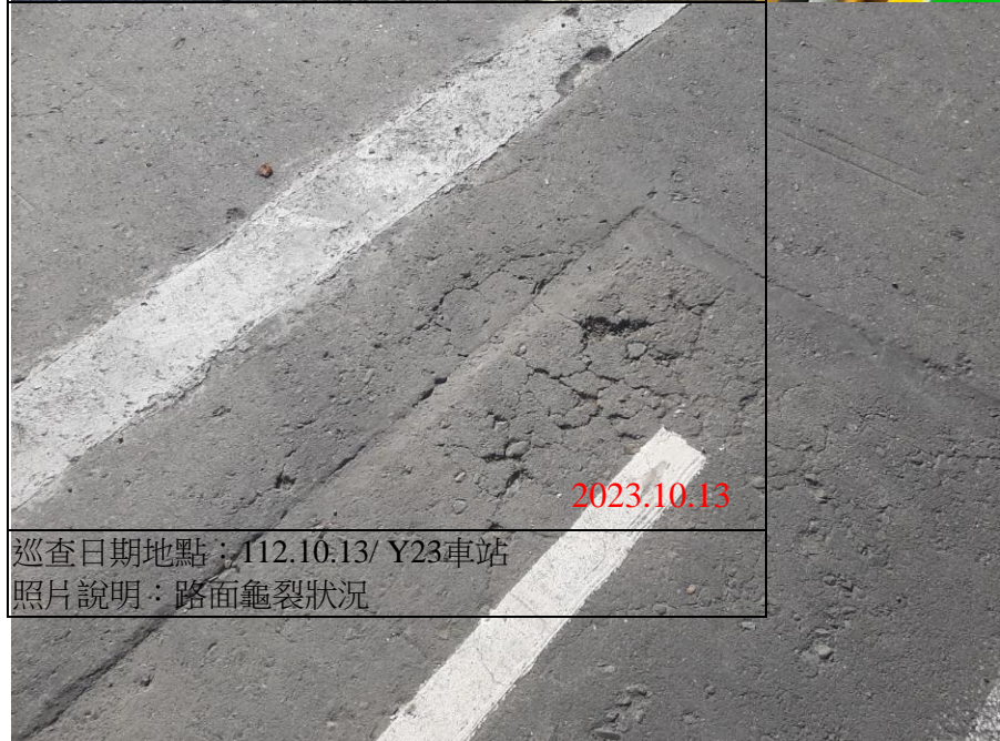
巡查日期地點：112.10.13/ Y23車站 照片說明：路面龜裂狀況