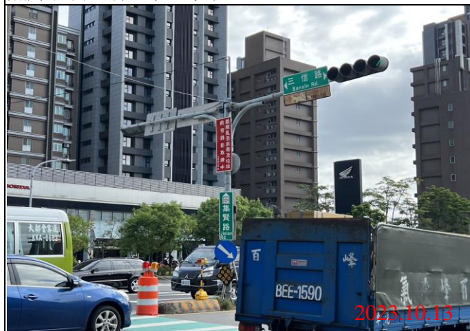
巡查日期地點：112.10.13/ Y23車站 照片說明：牌面設置狀況