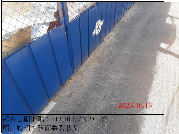
巡查日期地點：112.10.13/ Y23車站 照片說明：路面龜裂狀況