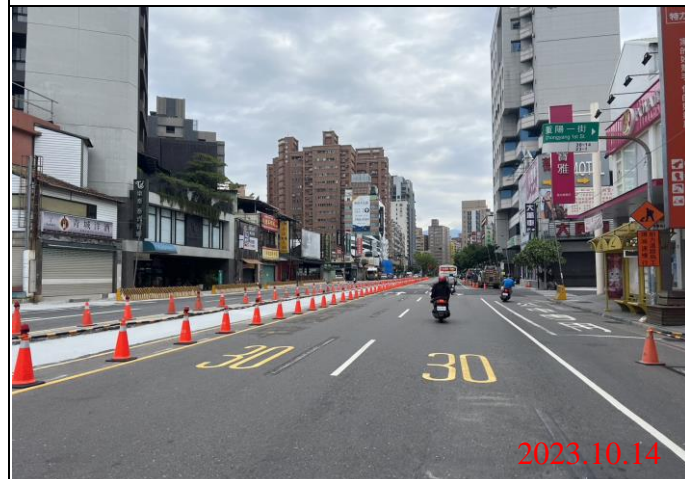
巡查日期地點：112.10.14/ Y21車站 照片說明：路面狀況