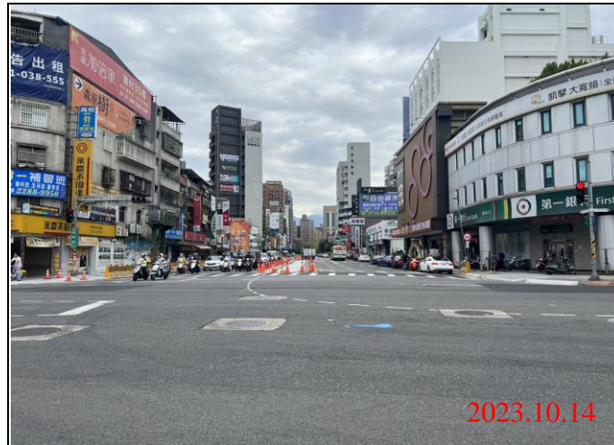
巡查日期地點：112.10.14/ Y21車站 照片說明：路面狀況