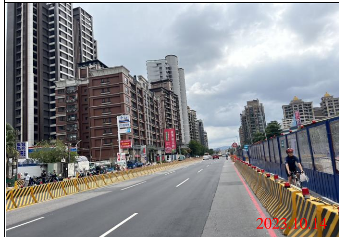
巡查日期地點：112.10.14/ Y23車站 照片說明：路面狀況