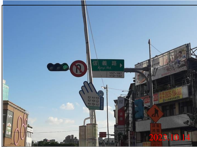
巡查日期地點：112.10.14/ Y21車站 照片說明：牌面設置狀況