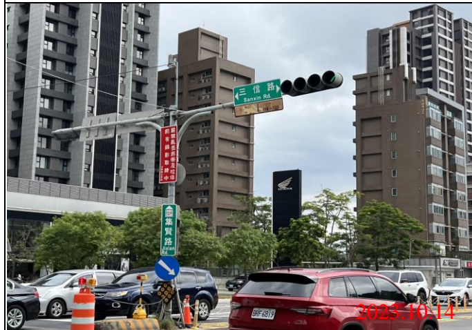
巡查日期地點：112.10.14/ Y23車站 照片說明：牌面設置狀況