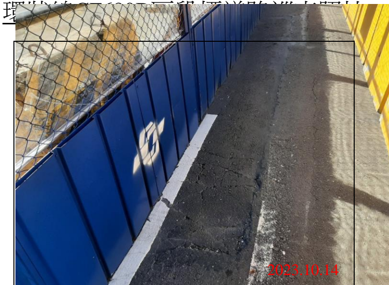
巡查日期地點：112.10.14/ Y23車站 照片說明：路面龜裂狀況