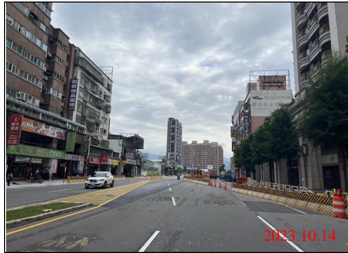
巡查日期地點：112.10.14/ Y22車站 照片說明：路面狀況