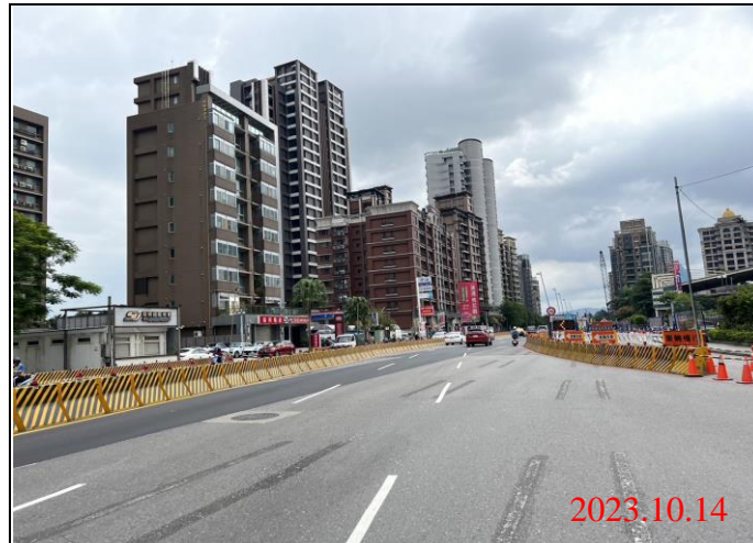
巡查日期地點：112.10.14/ Y23車站 照片說明：路面狀況