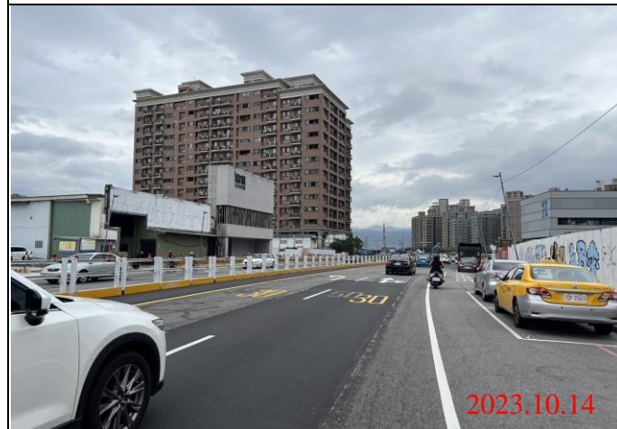
巡查日期地點：112.10.14/ Y22車站 照片說明：路面狀況