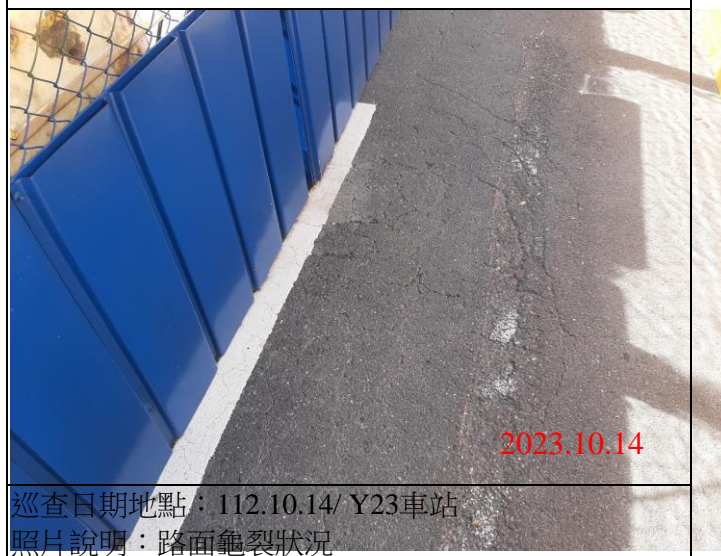
巡查日期地點：112.10.14/ Y23車站 照片說明：路面龜裂狀況