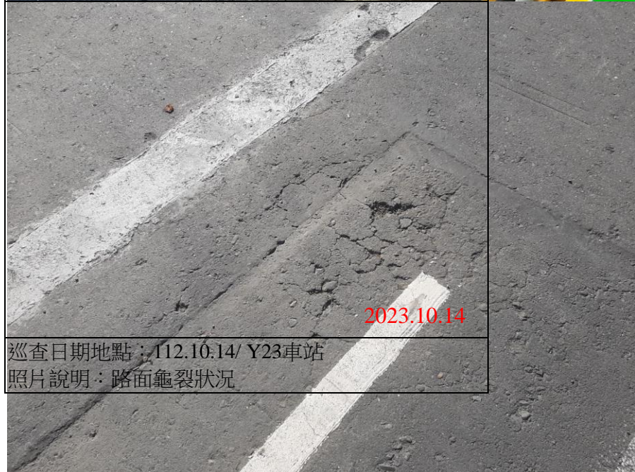
巡查日期地點：112.10.14/ Y23車站 照片說明：路面龜裂狀況