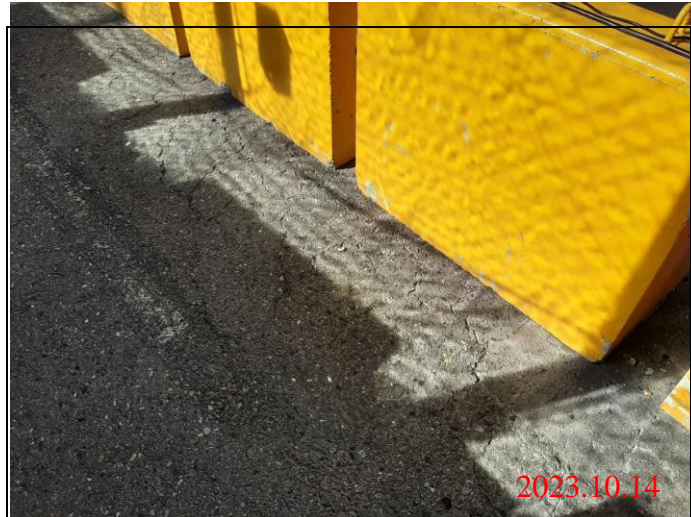
巡查日期地點：112.10.14/ Y23車站 照片說明：路面龜裂狀況