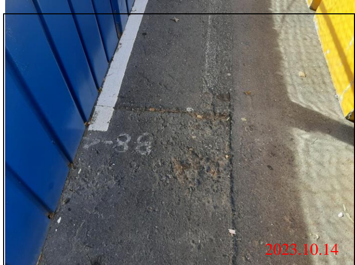
巡查日期地點：112.10.14/ Y23車站 照片說明：路面龜裂狀況