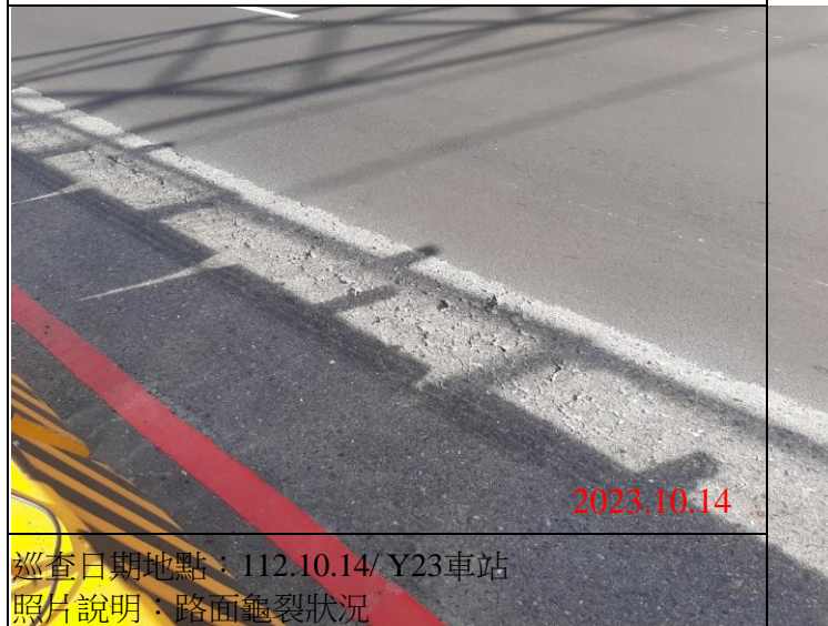
巡查日期地點：112.10.14/ Y23車站 照片說明：路面龜裂狀況