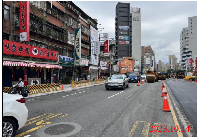
巡查日期地點：112.10.14/ Y21車站 照片說明：路面狀況