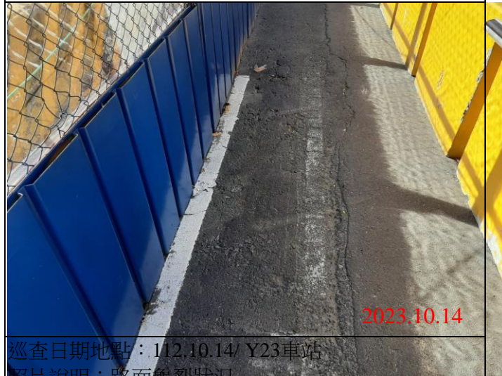
巡查日期地點：112.10.14/ Y23車站 照片說明：路面龜裂狀況