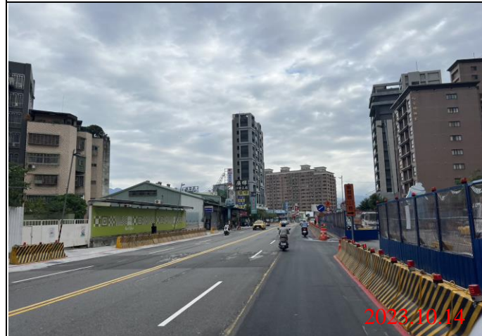
巡查日期地點：112.10.14/ Y22車站 照片說明：路面狀況