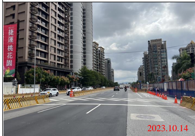
巡查日期地點：112.10.14/ Y23車站 照片說明：路面狀況