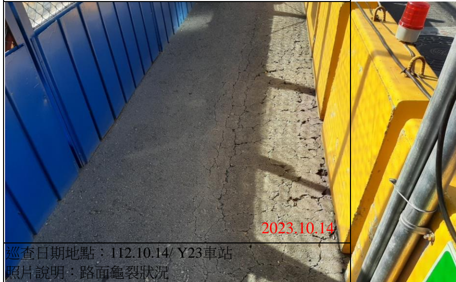
巡查日期地點：112.10.14/ Y23車站 照片說明：路面龜裂狀況