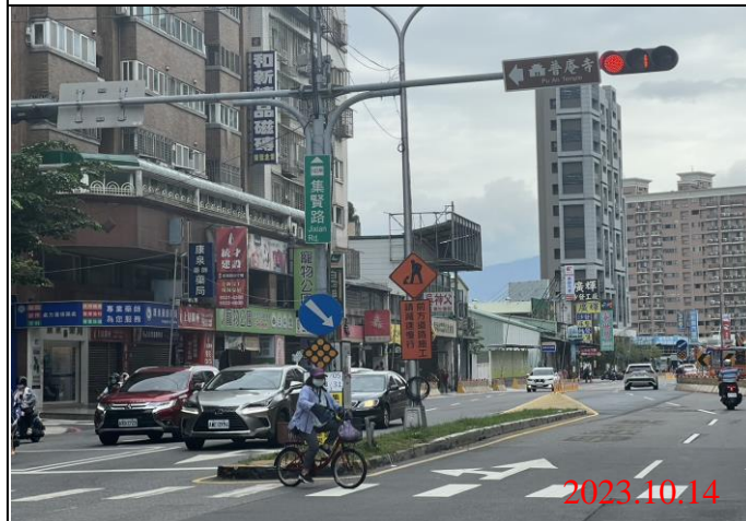
巡查日期地點：112.10.14/ Y22車站 照片說明：牌面設置狀況