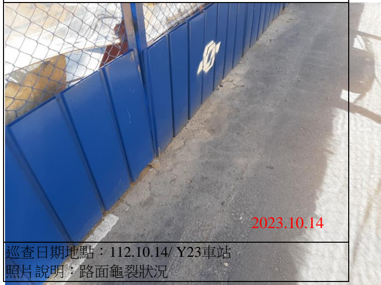
巡查日期地點：112.10.14/ Y23車站 照片說明：路面龜裂狀況