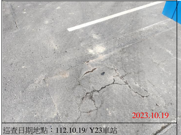
巡查日期地點：112.10.19/ Y23車站 照片說明：路面龜裂狀況