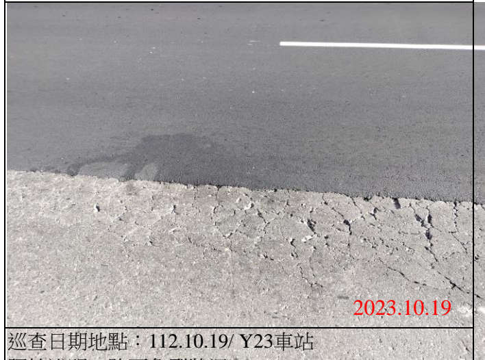
巡查日期地點：112.10.19/ Y23車站 照片說明：路面龜裂狀況