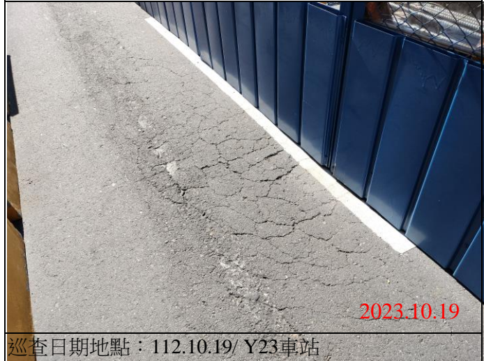
巡查日期地點：112.10.19/ Y23車站 照片說明：路面龜裂狀況