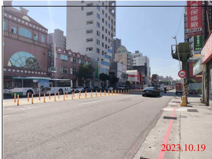
巡查日期地點：112.10.19/ Y21車站 照片說明：路面狀況