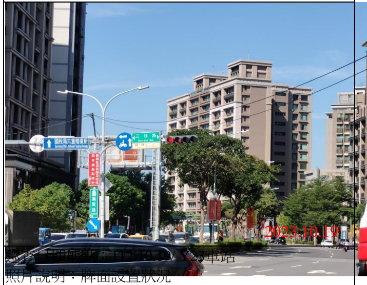
巡查日期地點：112.10.19/ Y21車站 照片說明：牌面設置狀況