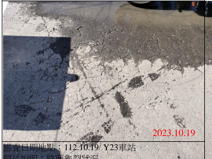
巡查日期地點：112.10.19/ Y23車站 照片說明：路面龜裂狀況