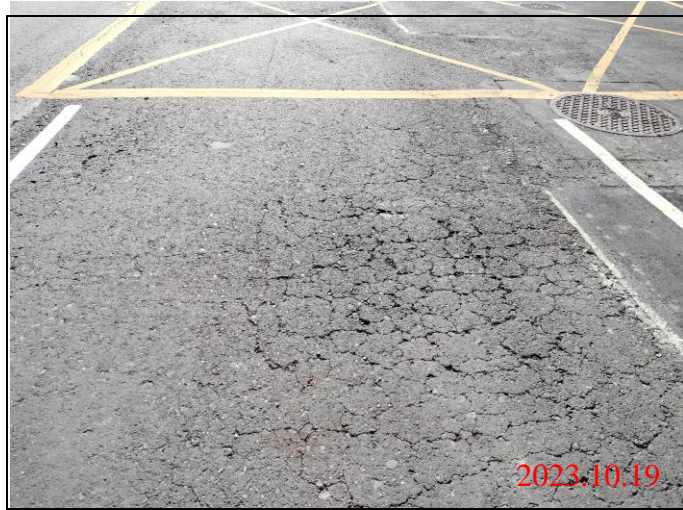
巡查日期地點：112.10.19/ Y23車站 照片說明：路面龜裂狀況