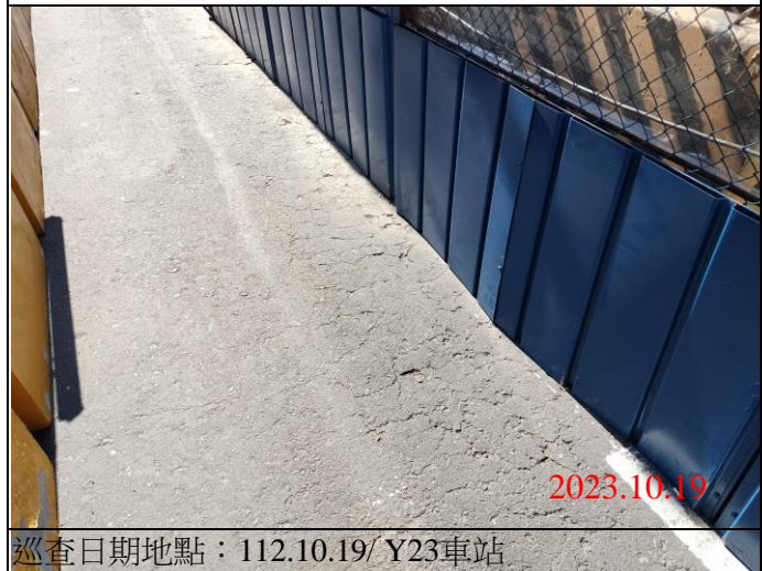
巡查日期地點：112.10.19/ Y23車站 照片說明：路面龜裂狀況