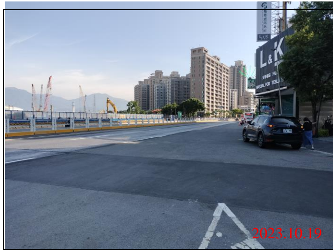
巡查日期地點：112.10.19/ Y22車站 照片說明：路面狀況