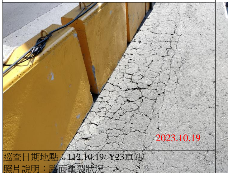
巡查日期地點：112.10.19/ Y23車站 照片說明：路面龜裂狀況