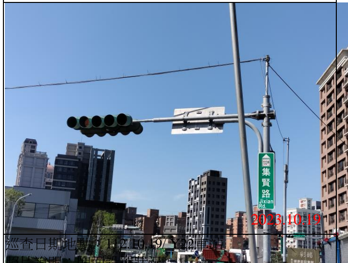
巡查日期地點：112.10.19/ Y21車站 照片說明：牌面設置狀況