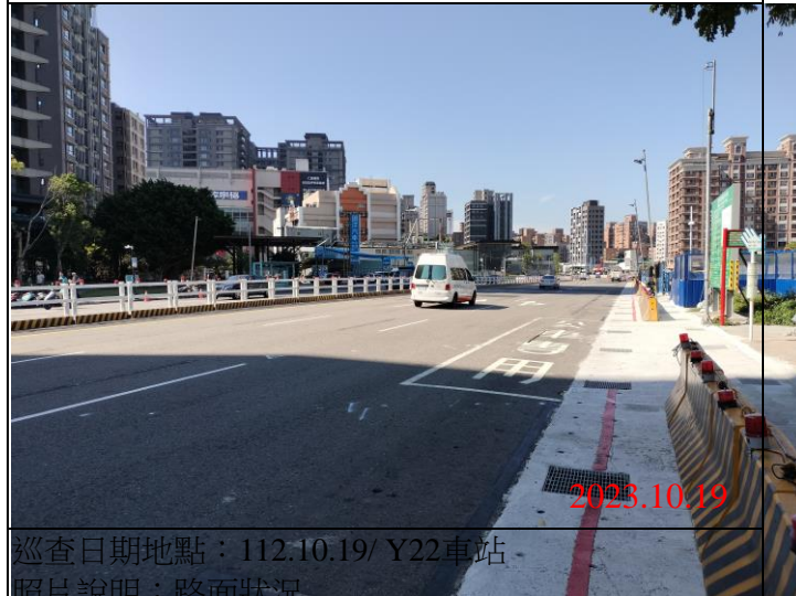
巡查日期地點：112.10.19/ Y22車站 照片說明：路面狀況