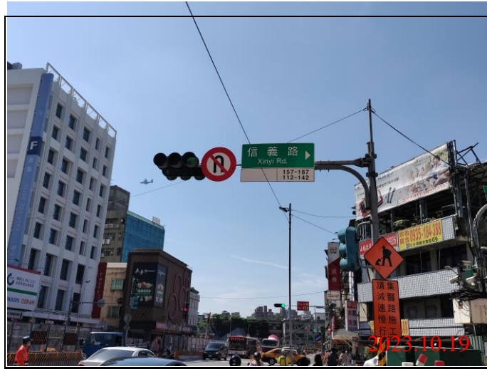
巡查日期地點：112.10.19/ Y21車站 照片說明：牌面設置狀況