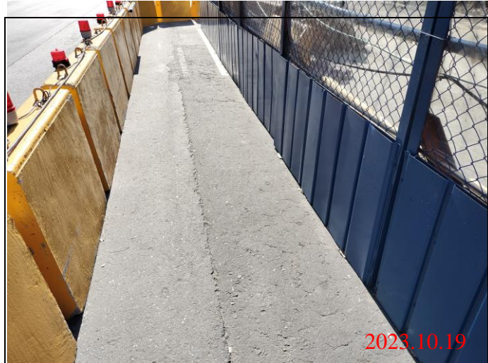
巡查日期地點：112.10.19/ Y23車站 照片說明：路面龜裂狀況