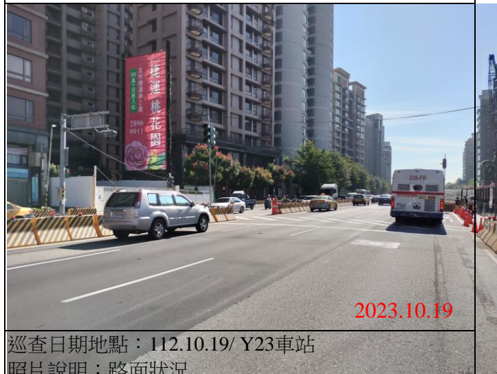
巡查日期地點：112.10.19/ Y23車站 照片說明：路面狀況