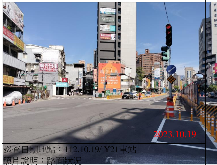
巡查日期地點：112.10.19/ Y21車站 照片說明：路面狀況