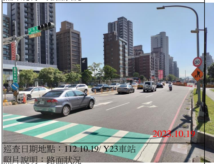
巡查日期地點：112.10.19/ Y23車站 照片說明：路面狀況