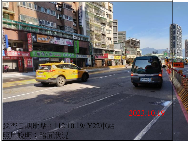
巡查日期地點：112.10.19/ Y22車站 照片說明：路面狀況