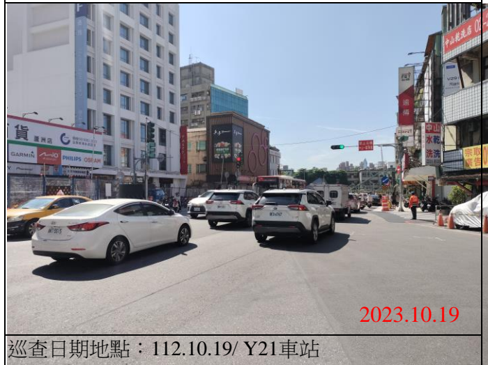
巡查日期地點：112.10.19/ Y21車站 照片說明：路面狀況