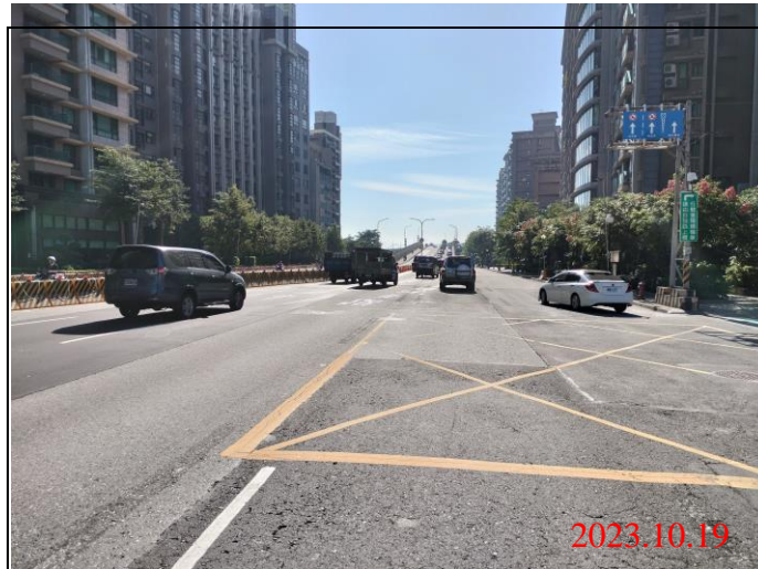
巡查日期地點：112.10.19/ Y23車站 照片說明：路面狀況