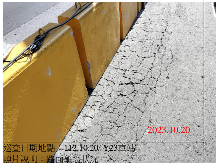
巡查日期地點：112.10.20/ Y23車站 照片說明：路面龜裂狀況