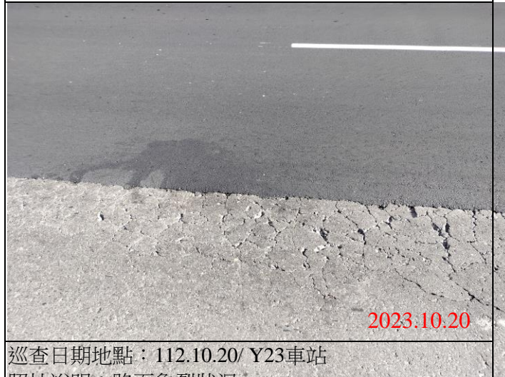
巡查日期地點：112.10.20/ Y23車站 照片說明：路面龜裂狀況