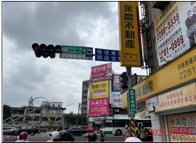
巡查日期地點：112.10.20/ Y21車站 照片說明：牌面設置狀況