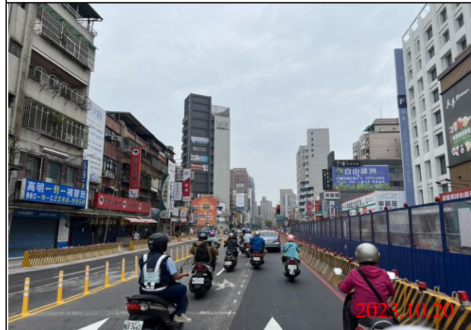
巡查日期地點：112.10.20/ Y21車站 照片說明：路面狀況