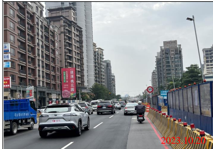
巡查日期地點：112.10.20/ Y23車站 照片說明：路面狀況