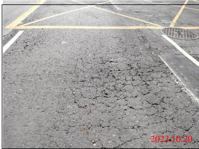
巡查日期地點：112.10.20/ Y23車站 照片說明：路面龜裂狀況