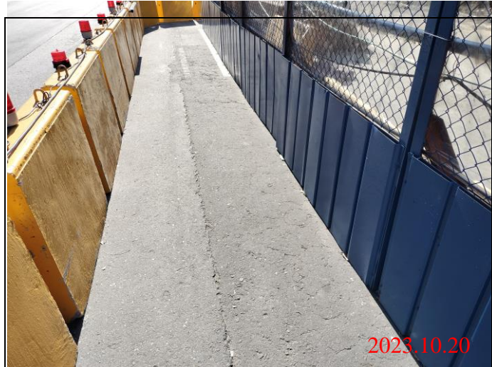
巡查日期地點：112.10.20/ Y23車站 照片說明：路面龜裂狀況