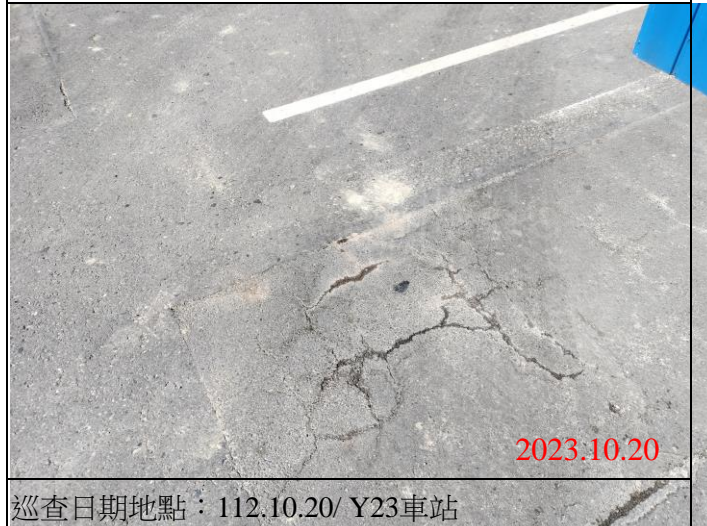
巡查日期地點：112.10.20/ Y23車站 照片說明：路面龜裂狀況