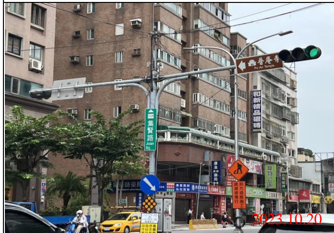
巡查日期地點：112.10.20/ Y22車站 照片說明：牌面設置狀況