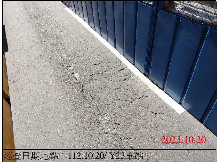
巡查日期地點：112.10.20/ Y23車站 照片說明：路面龜裂狀況