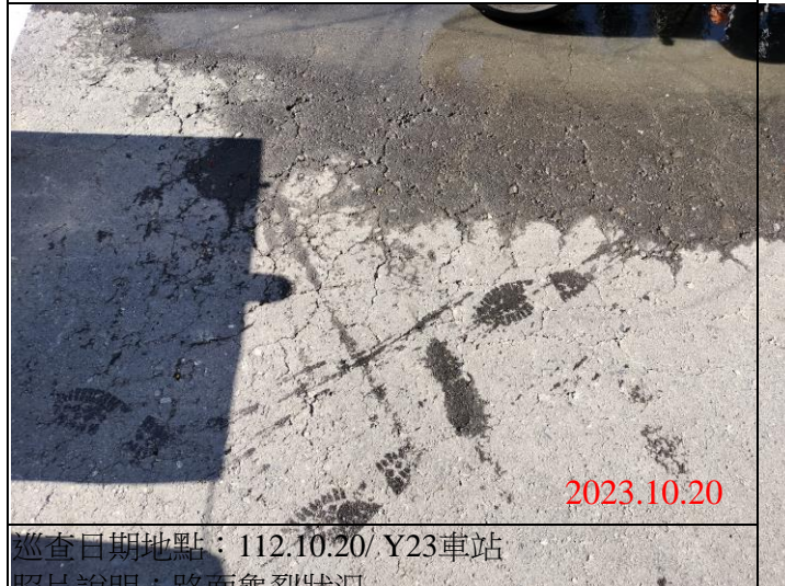
巡查日期地點：112.10.20/ Y23車站 照片說明：路面龜裂狀況