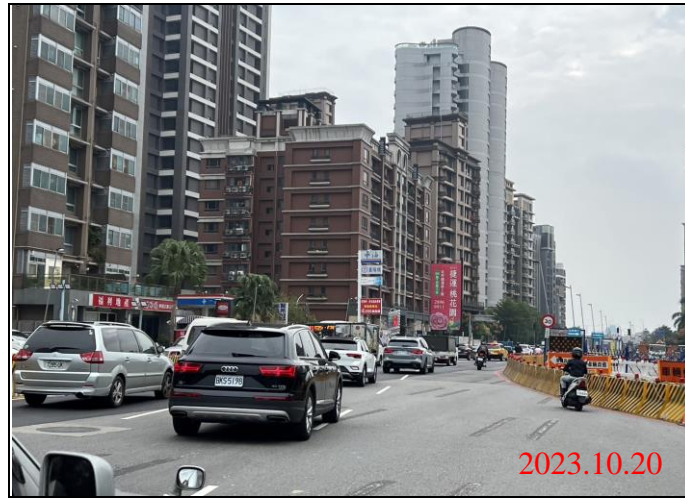
巡查日期地點：112.10.20/ Y23車站 照片說明：路面狀況