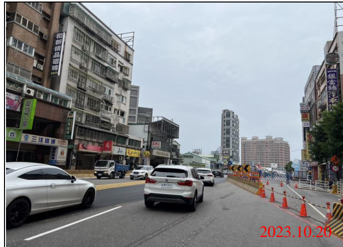
巡查日期地點：112.10.20/ Y22車站 照片說明：路面狀況