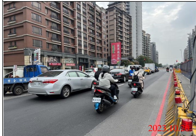
巡查日期地點：112.10.20/ Y23車站 照片說明：路面狀況