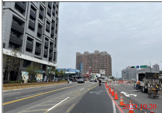
巡查日期地點：112.10.20/ Y22車站 照片說明：路面狀況