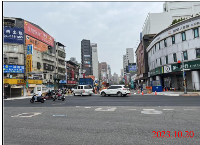
巡查日期地點：112.10.20/ Y21車站 照片說明：路面狀況