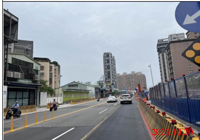
巡查日期地點：112.10.20/ Y22車站 照片說明：路面狀況