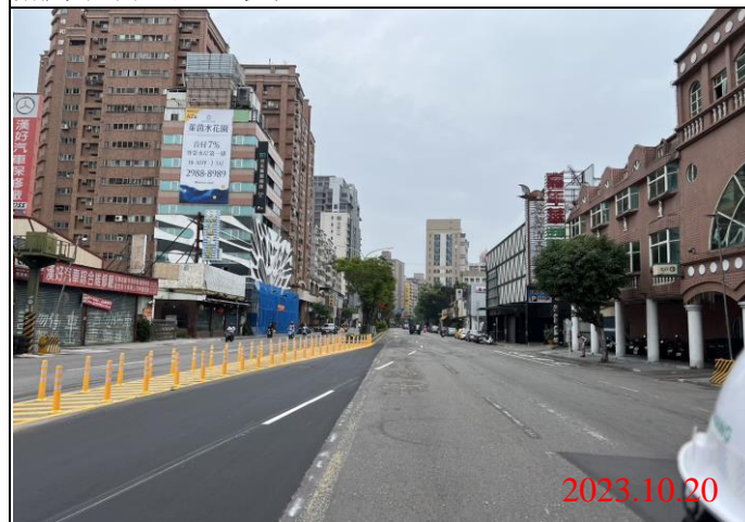
巡查日期地點：112.10.20/ Y21車站 照片說明：路面狀況