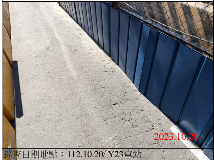
巡查日期地點：112.10.20/ Y23車站 照片說明：路面龜裂狀況