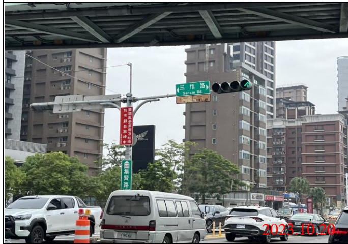
巡查日期地點：112.10.20/ Y23車站 照片說明：牌面設置狀況