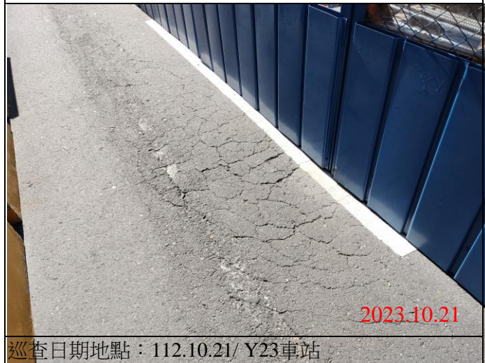
巡查日期地點：112.10.21/ Y23車站 照片說明：路面龜裂狀況