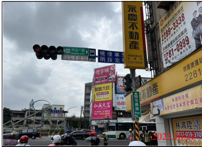
巡查日期地點：112.10.21/ Y21車站 照片說明：牌面設置狀況