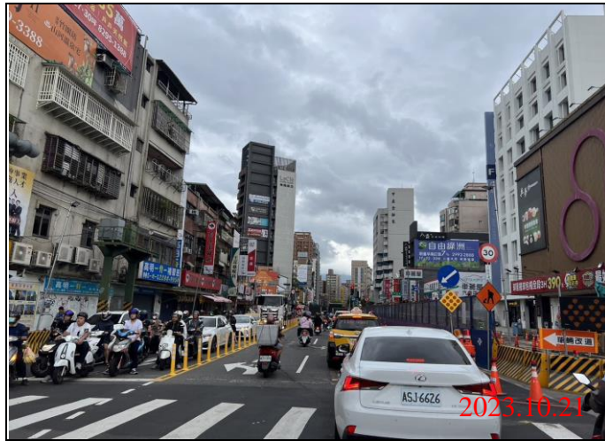
巡查日期地點：112.10.21/ Y21車站 照片說明：路面狀況