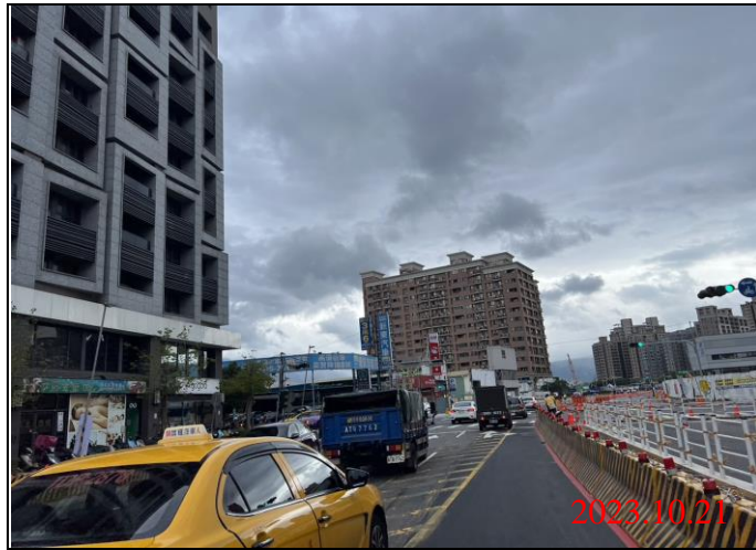
巡查日期地點：112.10.21/ Y22車站 照片說明：路面狀況