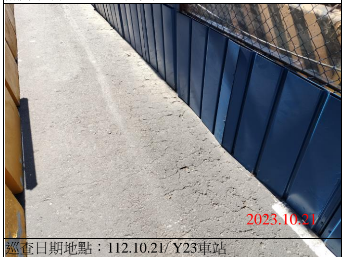
巡查日期地點：112.10.21/ Y23車站 照片說明：路面龜裂狀況