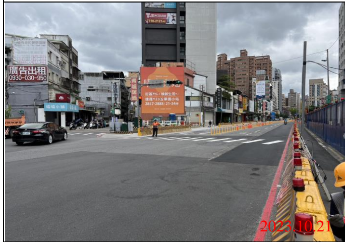
巡查日期地點：112.10.21/ Y21車站 照片說明：路面狀況