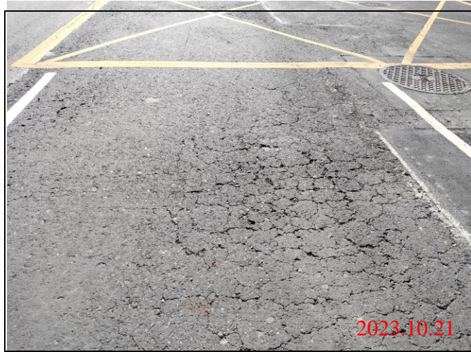
巡查日期地點：112.10.21/ Y23車站 照片說明：路面龜裂狀況