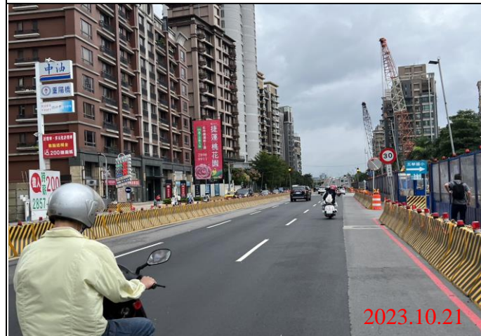
巡查日期地點：112.10.21/ Y23車站 照片說明：路面狀況