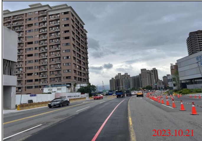
巡查日期地點：112.10.21/ Y22車站 照片說明：路面狀況