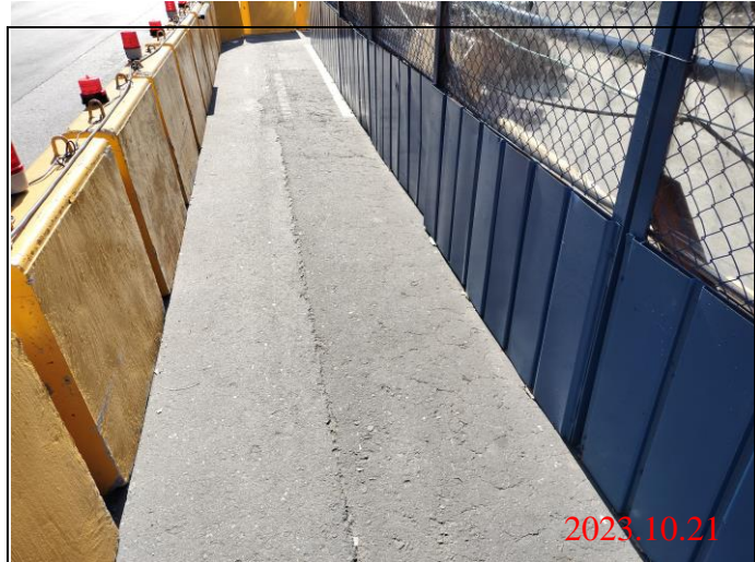
巡查日期地點：112.10.21/ Y23車站 照片說明：路面龜裂狀況