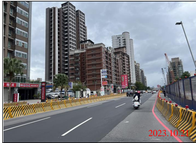
巡查日期地點：112.10.21/ Y23車站 照片說明：路面狀況