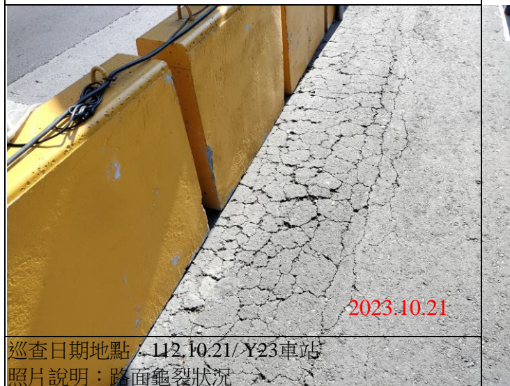
巡查日期地點：112.10.21/ Y23車站 照片說明：路面龜裂狀況