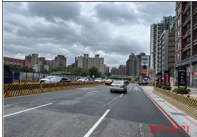
巡查日期地點：112.10.21/ Y23車站 照片說明：路面狀況