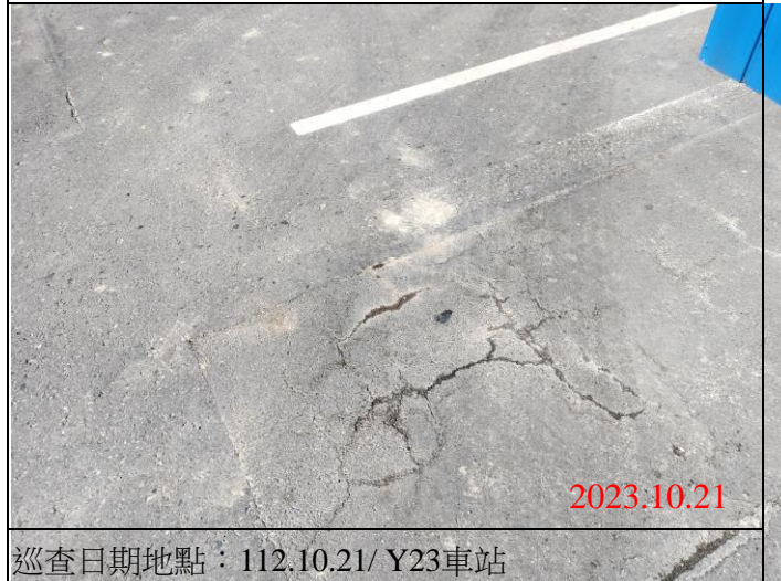
巡查日期地點：112.10.21/ Y23車站 照片說明：路面龜裂狀況