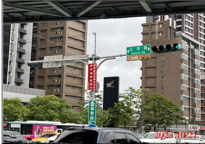
巡查日期地點：112.10.21/ Y23車站 照片說明：牌面設置狀況