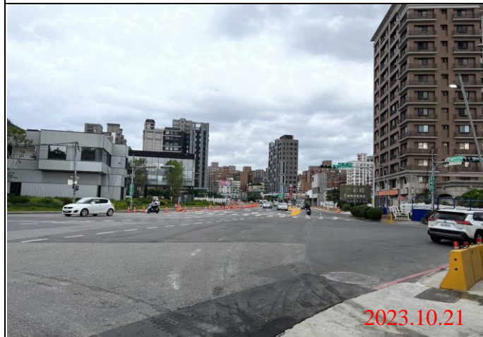
巡查日期地點：112.10.21/ Y22車站 照片說明：路面狀況