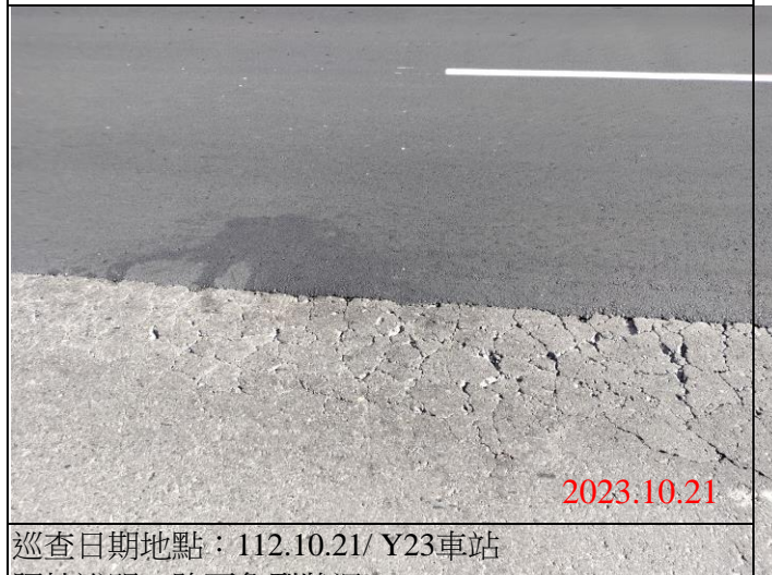
巡查日期地點：112.10.21/ Y23車站 照片說明：路面龜裂狀況