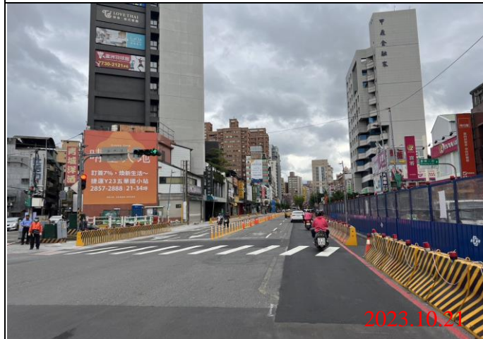
巡查日期地點：112.10.21/ Y21車站 照片說明：路面狀況