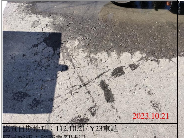
巡查日期地點：112.10.21/ Y23車站 照片說明：路面龜裂狀況