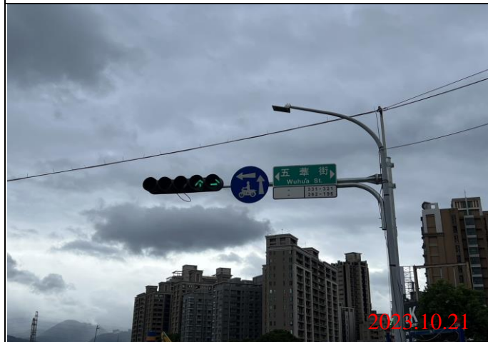
巡查日期地點：112.10.21/ Y22車站 照片說明：牌面設置狀況