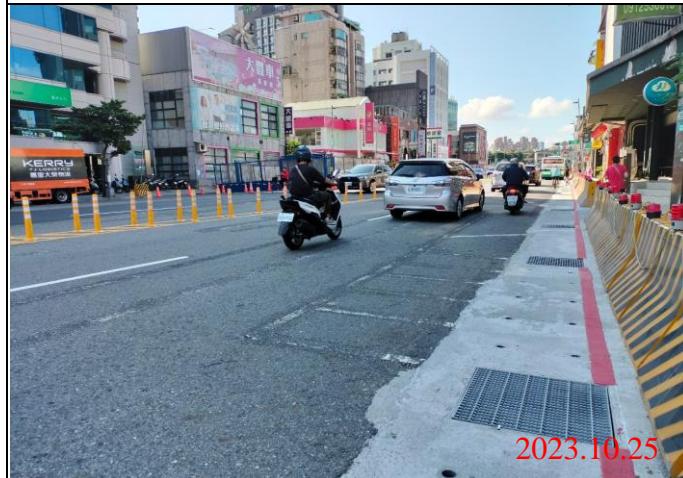
巡查日期地點：112.10.25/ Y21車站 照片說明：路面狀況