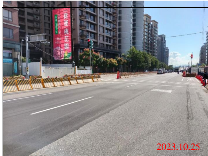
巡查日期地點：112.10.25/ Y23車站 照片說明：路面狀況