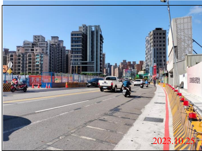
巡查日期地點：112.10.25/ Y22車站 照片說明：路面狀況