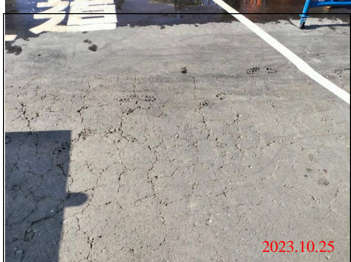
巡查日期地點：112.10.25/ Y23車站 照片說明：路面龜裂狀況