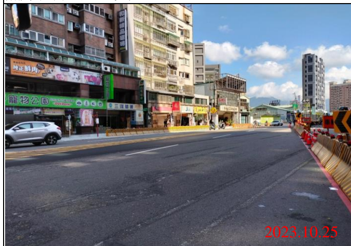
巡查日期地點：112.10.25/ Y22車站 照片說明：路面狀況