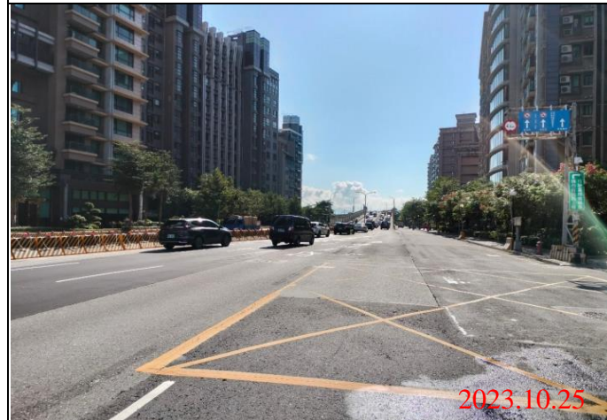
巡查日期地點：112.10.25/ Y23車站 照片說明：牌面設置狀況