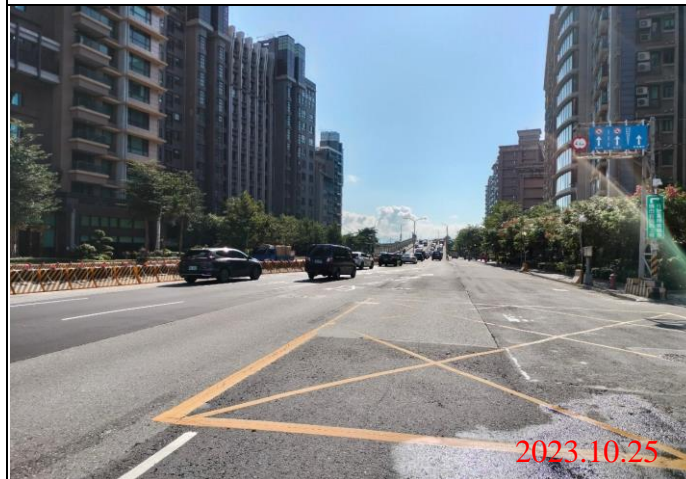
巡查日期地點：112.10.25/ Y23車站 照片說明：路面狀況