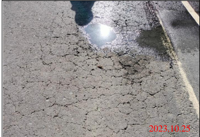
巡查日期地點：112.10.25/ Y23車站 照片說明：路面龜裂狀況