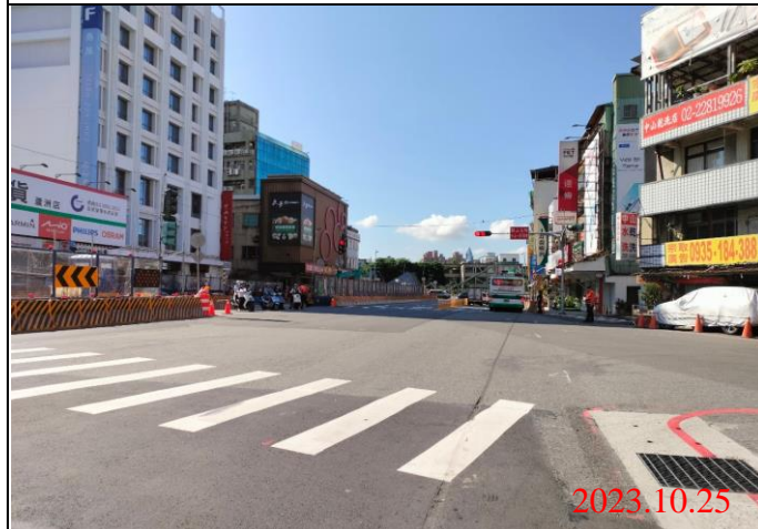
巡查日期地點：112.10.25/ Y21車站 照片說明：路面狀況