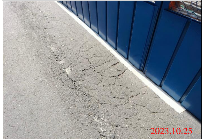
巡查日期地點：112.10.25/ Y23車站 照片說明：路面龜裂狀況