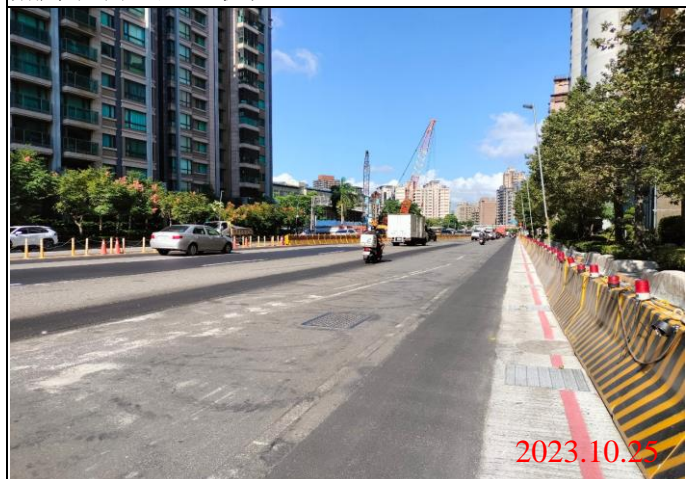
巡查日期地點：112.10.25/ Y23車站 照片說明：路面狀況