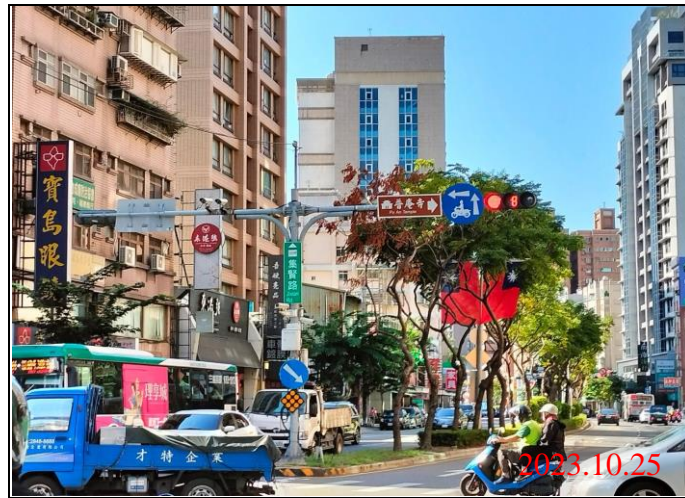
巡查日期地點：112.10.25/ Y21車站 照片說明：牌面設置狀況