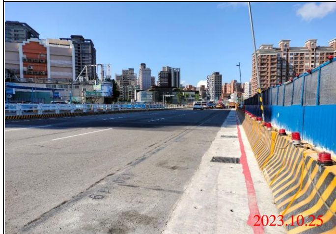
巡查日期地點：112.10.25/ Y22車站 照片說明：路面狀況