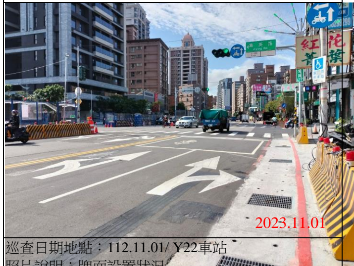
巡查日期地點：112.11.01/ Y22車站 照片說明：牌面設置狀況