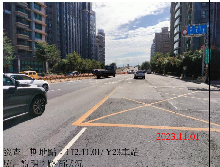
巡查日期地點：112.11.01/ Y23車站 照片說明：路面狀況