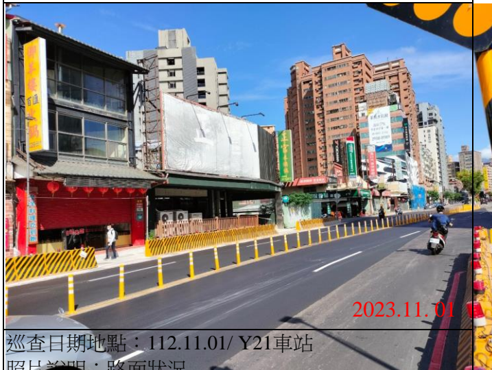
巡查日期地點：112.11.01/ Y21車站 照片說明：路面狀況