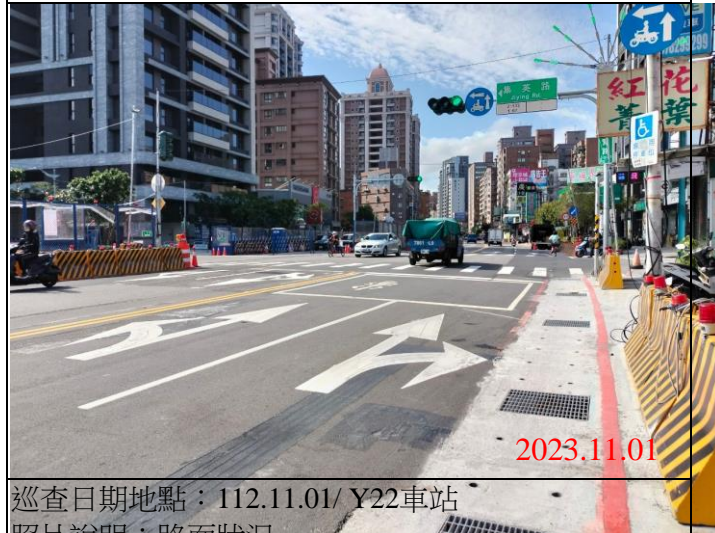
巡查日期地點：112.11.01/ Y22車站 照片說明：路面狀況