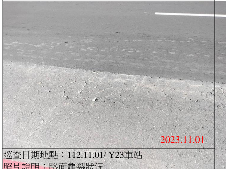
巡查日期地點：112.11.01/ Y23車站 照片說明：路面龜裂狀況