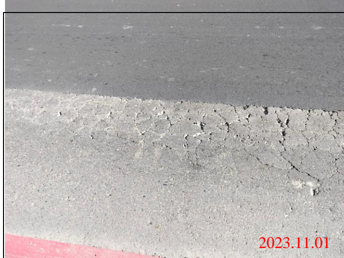
巡查日期地點：112.11.01/ Y23車站 照片說明：路面龜裂狀況