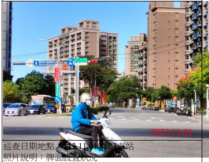
巡查日期地點：112.11.01/ Y23車站 照片說明：牌面設置狀況