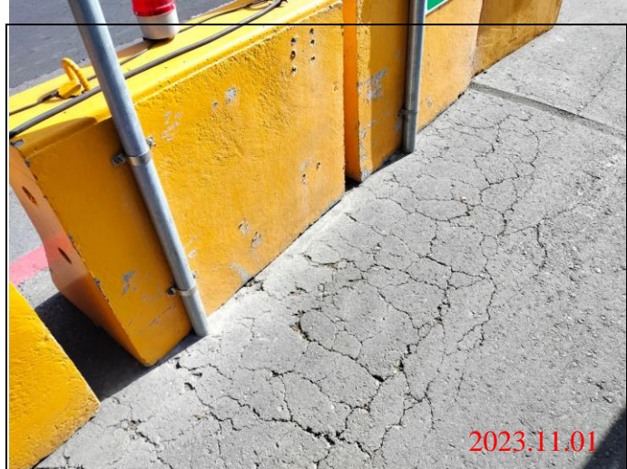
巡查日期地點：112.11.01/ Y23車站 照片說明：路面龜裂狀況