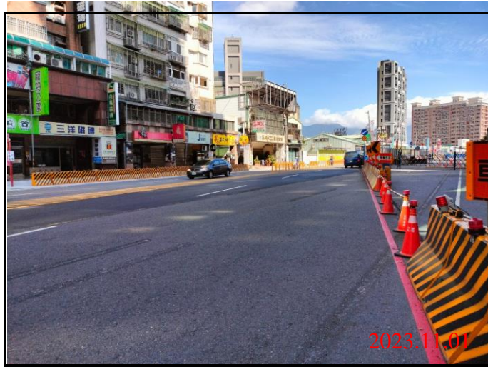
巡查日期地點：112.11.01/ Y22車站 照片說明：路面狀況