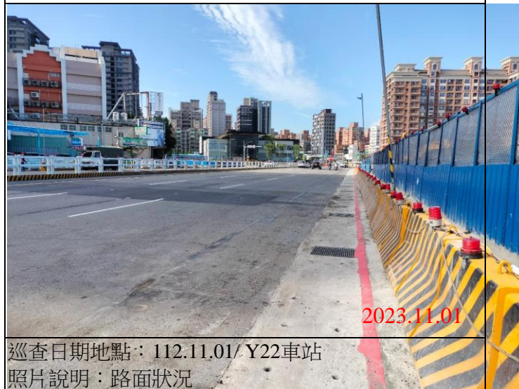
巡查日期地點：112.11.01/ Y22車站 照片說明：路面狀況