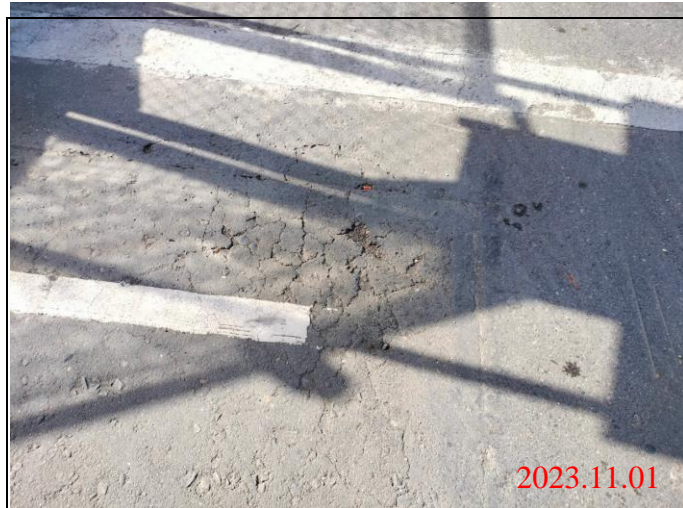
巡查日期地點：112.11.01/ Y23車站 照片說明：路面龜裂狀況