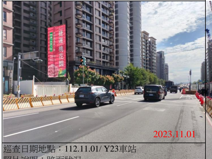
巡查日期地點：112.11.01/ Y23車站 照片說明：路面狀況