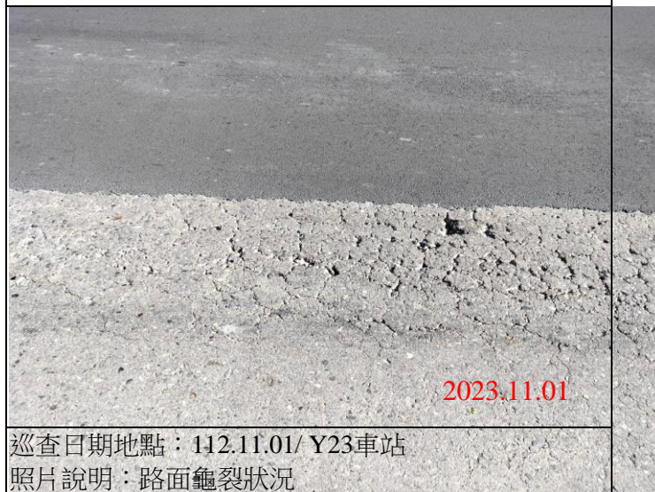
巡查日期地點：112.11.01/ Y23車站 照片說明：路面龜裂狀況