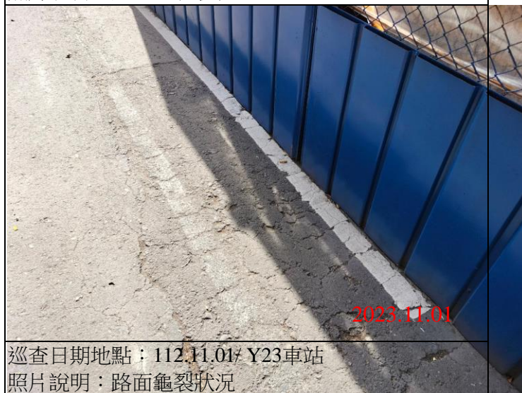
巡查日期地點：112.11.01/ Y23車站 照片說明：路面龜裂狀況