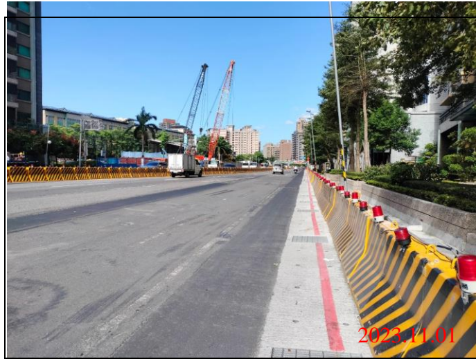
巡查日期地點：112.11.01 Y23車站 照片說明：路面狀況