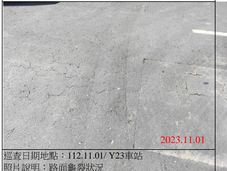
巡查日期地點：112.11.01/ Y23車站 照片說明：路面龜裂狀況