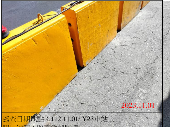
巡查日期地點：112.11.01/ Y23車站 照片說明：路面龜裂狀況