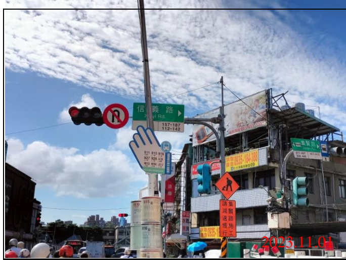
巡查日期地點：112.11.01/ Y21車站 照片說明：牌面設置狀況