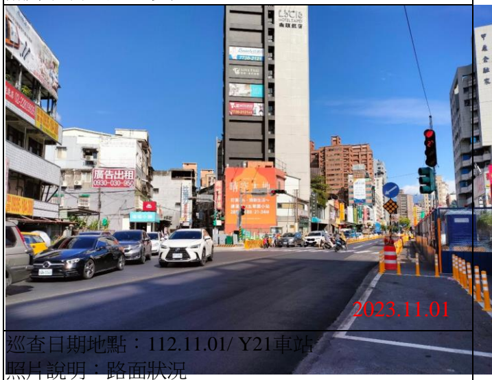
巡查日期地點：112.11.01/ Y21車站 照片說明：路面狀況