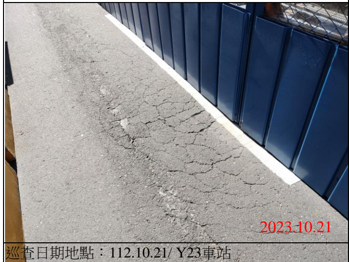
巡查日期地點：112.10.21/ Y23車站 照片說明：路面龜裂狀況