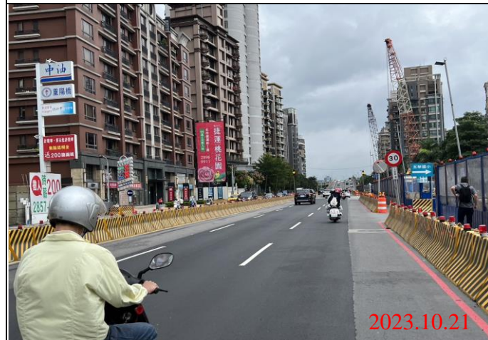
巡查日期地點：112.10.21/ Y23車站 照片說明：路面狀況