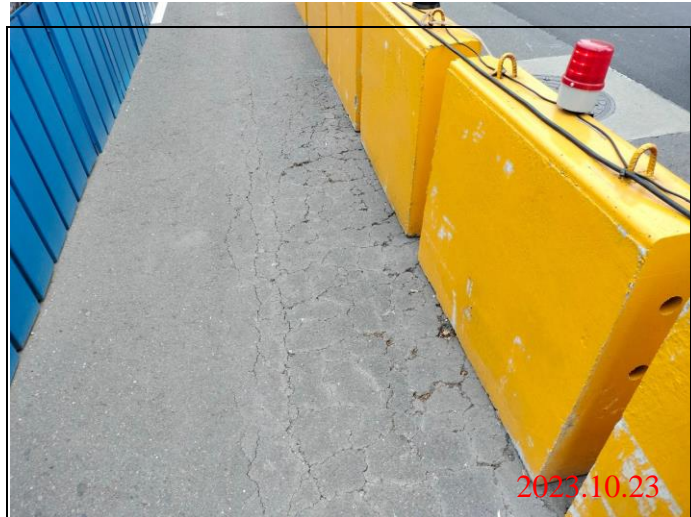
巡查日期地點：112.10.23/ Y23車站 照片說明：路面龜裂狀況