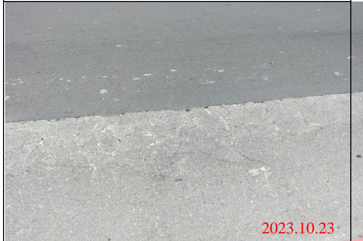
巡查日期地點：112.10.23/ Y23車站 照片說明：路面龜裂狀況