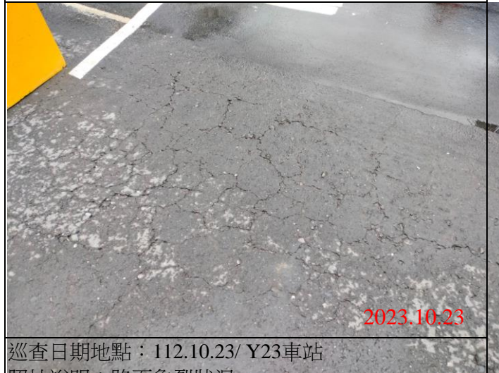
巡查日期地點：112.10.23/ Y23車站 照片說明：路面龜裂狀況