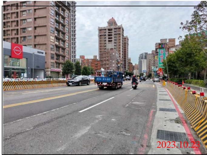
巡查日期地點：112.10.23/ Y22車站 照片說明：路面狀況