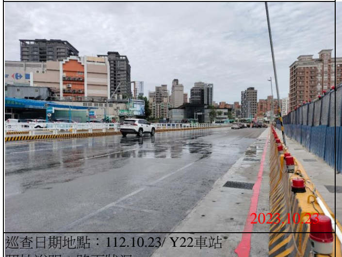
巡查日期地點：112.10.23/ Y22車站 照片說明：路面狀況