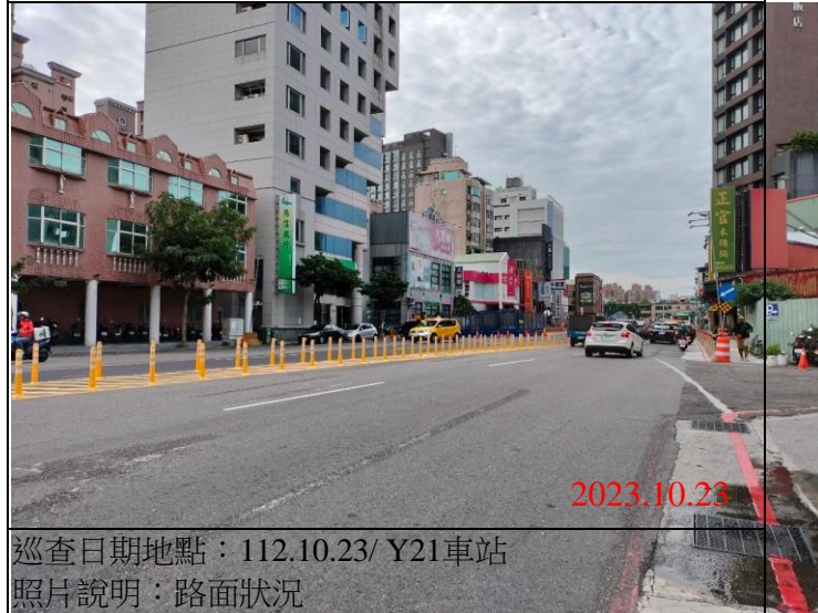
巡查日期地點：112.10.23/ Y21車站 照片說明：路面狀況