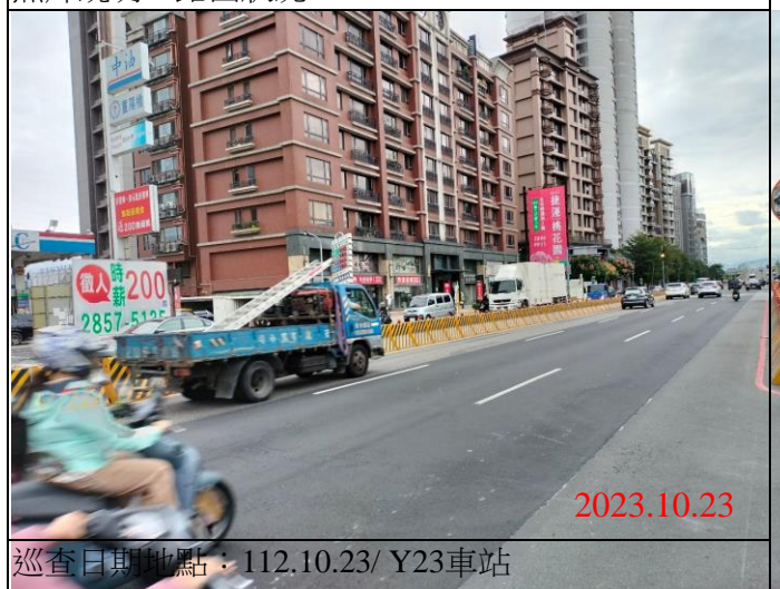
巡查日期地點：112.10.23/ Y23車站 照片說明：路面狀況