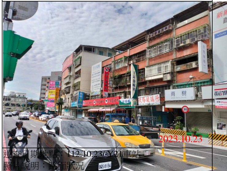
巡查日期地點：112.10.23/ Y21車站 照片說明：路面狀況