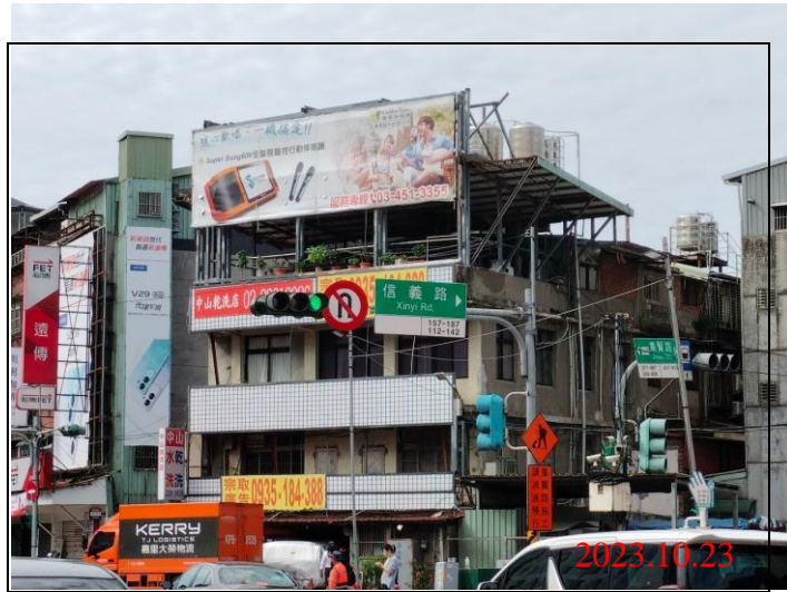
巡查日期地點：112.10.23/ Y21車站 照片說明：牌面設置狀況