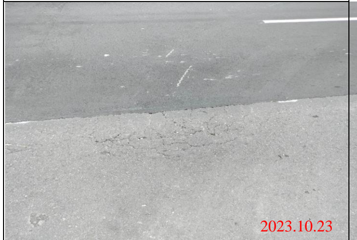
巡查日期地點：112.10.23/ Y23車站 照片說明：路面龜裂狀況