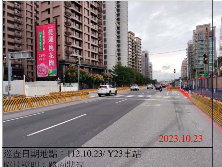
巡查日期地點：112.10.23/ Y23車站 照片說明：路面狀況