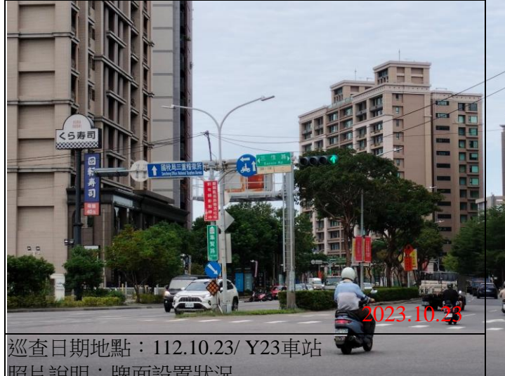
巡查日期地點：112.10.23/ Y23車站 照片說明：牌面設置狀況