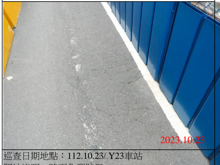
巡查日期地點：112.10.23/ Y23車站 照片說明：路面龜裂狀況