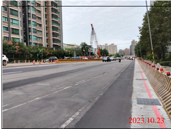
巡查日期地點：112.10.23/ Y23車站 照片說明：路面狀況