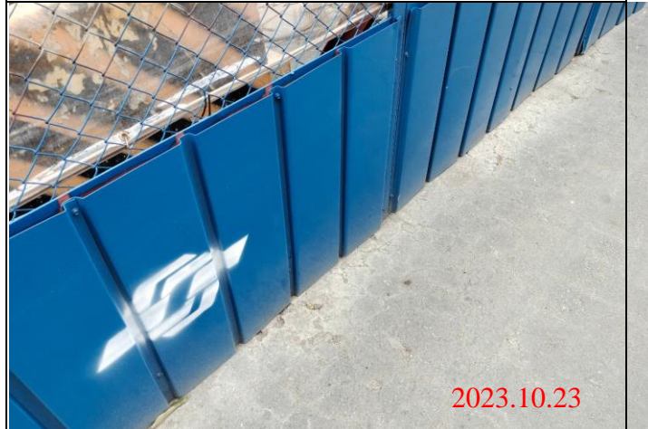
巡查日期地點：112.10.23/ Y23車站 照片說明：路面龜裂狀況