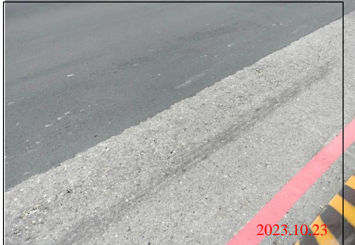
巡查日期地點：112.10.23/ Y23車站 照片說明：路面龜裂狀況