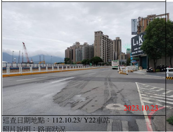
巡查日期地點：112.10.23/ Y22車站 照片說明：路面狀況