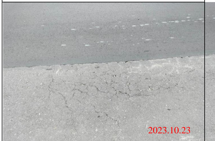
巡查日期地點：112.10.23/ Y23車站 照片說明：路面龜裂狀況