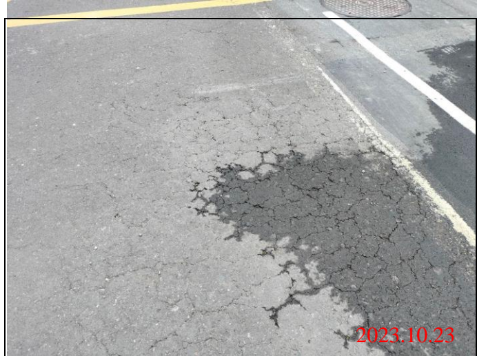
巡查日期地點：112.10.23/ Y23車站 照片說明：路面龜裂狀況