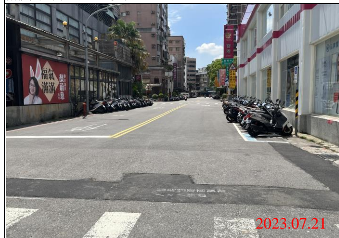
巡查日期地點：112.07.21/ Y21車站 照片說明：路面狀況