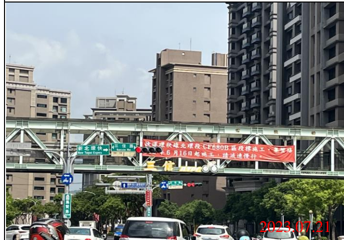
巡查日期地點：112.07.21/ Y23車站 照片說明：牌面設置狀況