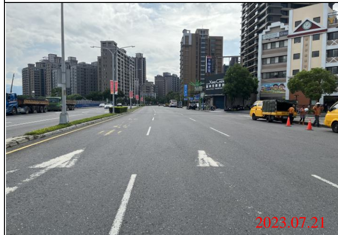
巡查日期地點：112.07.21/ Y22車站 照片說明：路面狀況