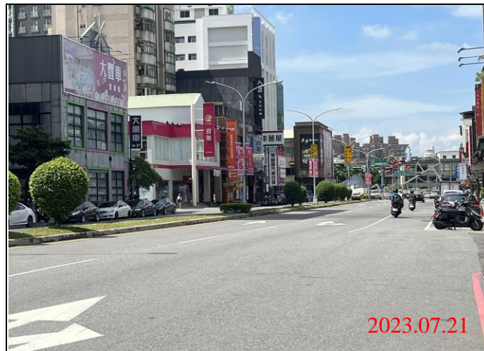
巡查日期地點：112.07.21/ Y21車站 照片說明：路面狀況