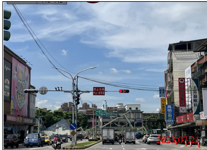
巡查日期地點：112.07.21/ Y21車站 照片說明：牌面設置狀況