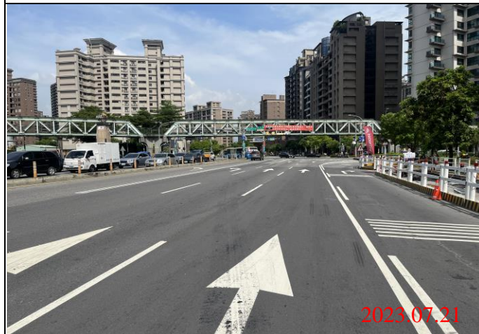
巡查日期地點：112.07.21/ Y23車站 照片說明：路面狀況