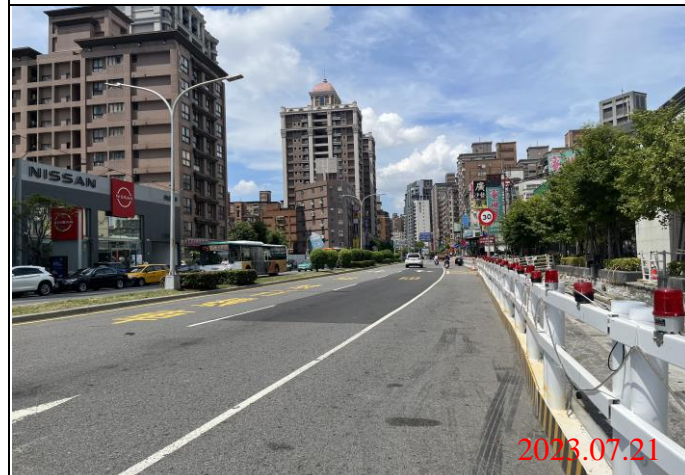
巡查日期地點：112.07.21/ Y22車站 照片說明：路面狀況