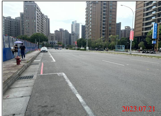
巡查日期地點：112.07.21/ Y22車站 照片說明：路面狀況