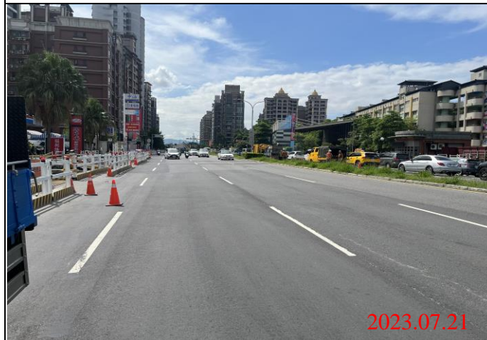
巡查日期地點：112.07.21/ Y23車站 照片說明：路面狀況