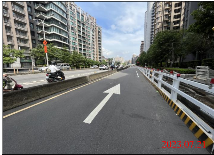
巡查日期地點：112.07.21/ Y23車站 照片說明：路面狀況