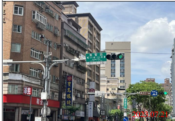
巡查日期地點：112.07.21/ Y22車站 照片說明：牌面設置狀況