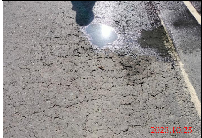
巡查日期地點：112.10.25/ Y23車站 照片說明：路面龜裂狀況