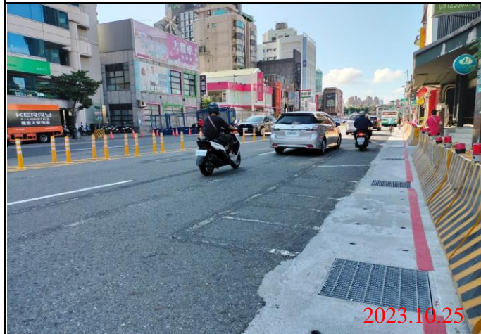
巡查日期地點：112.10.25/ Y21車站 照片說明：路面狀況