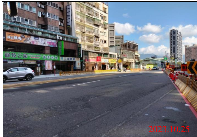
巡查日期地點：112.10.25/ Y22車站 照片說明：路面狀況