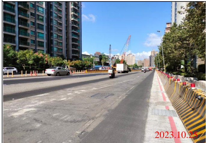
巡查日期地點：112.10.25/ Y23車站 照片說明：路面狀況