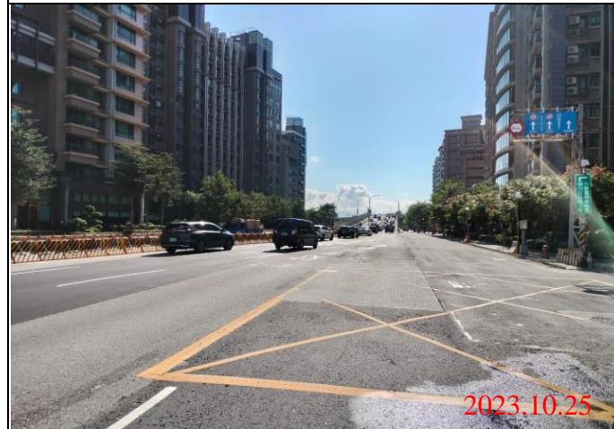
巡查日期地點：112.10.25/ Y23車站 照片說明：牌面設置狀況