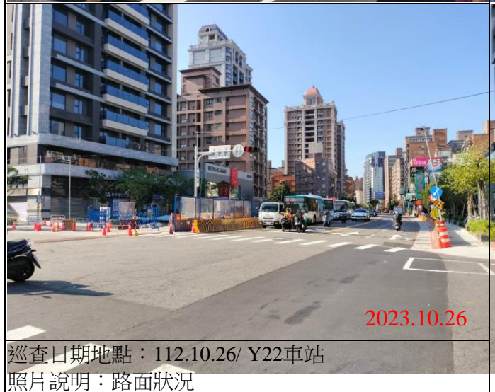
巡查日期地點：112.10.26/ Y22車站 照片說明：路面狀況