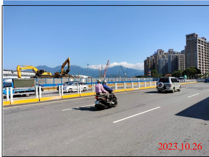
巡查日期地點：112.10.26/ Y22車站 照片說明：路面狀況