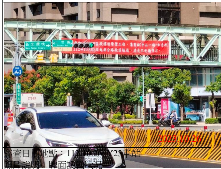
巡查日期地點：112.10.26/ Y23車站 照片說明：牌面設置狀況