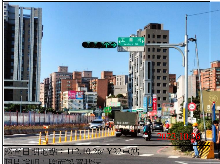
巡查日期地點：112.10.26/ Y22車站 照片說明：牌面設置狀況