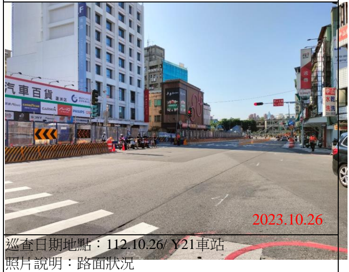
巡查日期地點：112.10.26/ Y21車站 照片說明：路面狀況