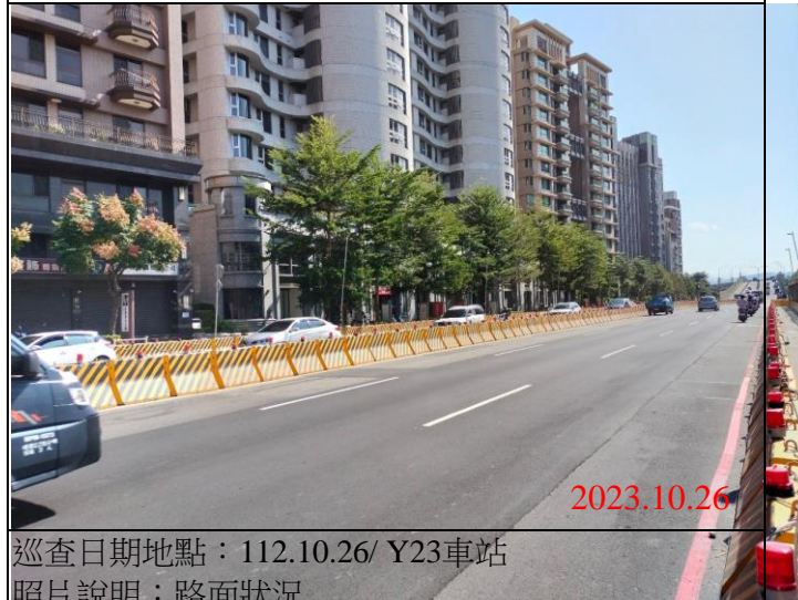
巡查日期地點：112.10.26/ Y23車站 照片說明：路面狀況