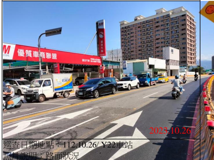
巡查日期地點：112.10.26/ Y22車站 照片說明：路面狀況