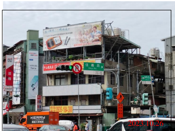
巡查日期地點：112.10.26/ Y21車站 照片說明：牌面設置狀況