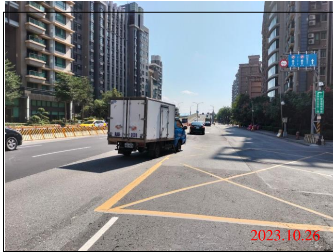
巡查日期地點：112.10.26/ Y23車站 照片說明：路面狀況