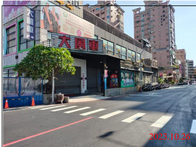
巡查日期地點：112.10.26/ Y21車站 照片說明：路面狀況