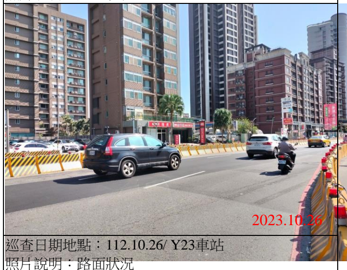
巡查日期地點：112.10.26/ Y23車站 照片說明：路面狀況