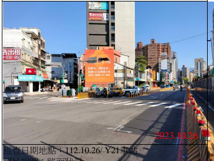
巡查日期地點：112.10.26/ Y21車站 照片說明：路面狀況