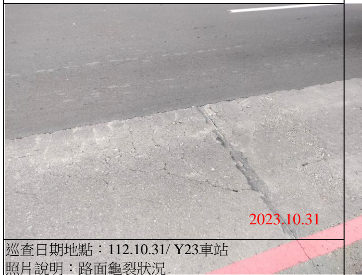
巡查日期地點：112.10.31/ Y23車站 照片說明：路面龜裂狀況