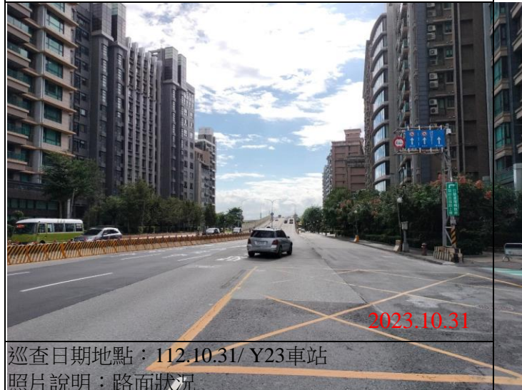
巡查日期地點：112.10.31/ Y23車站 照片說明：路面狀況