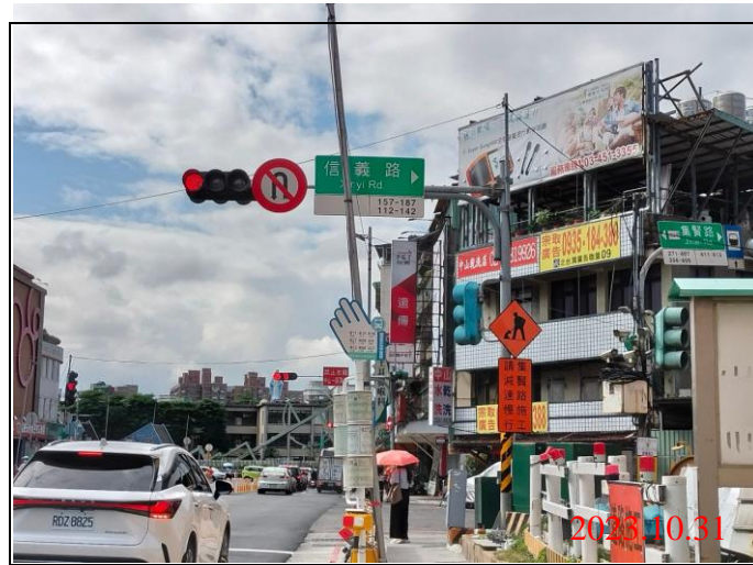
巡查日期地點：112.10.31/ Y21車站 照片說明：牌面設置狀況