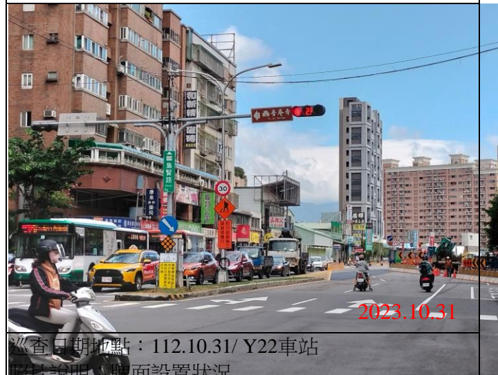
巡查日期地點：112.10.31/ Y22車站 照片說明：牌面設置狀況