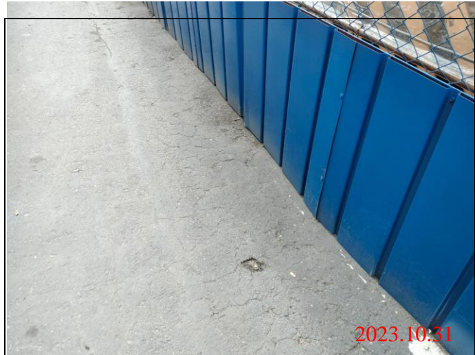
巡查日期地點：112.10.31/ Y23車站 照片說明：路面龜裂狀況