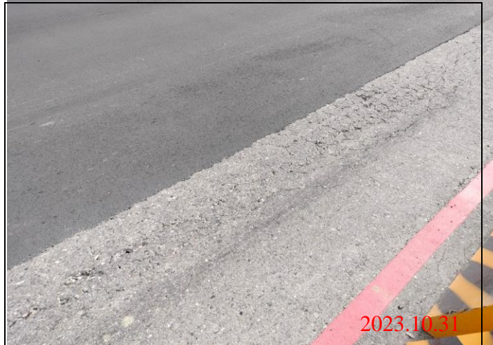
巡查日期地點：112.10.31/ Y23車站 照片說明：路面龜裂狀況