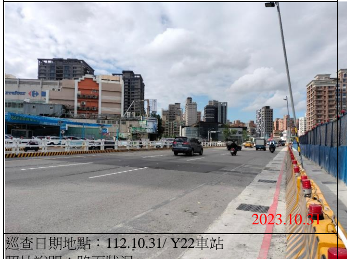
巡查日期地點：112.10.31/ Y22車站 照片說明：路面狀況