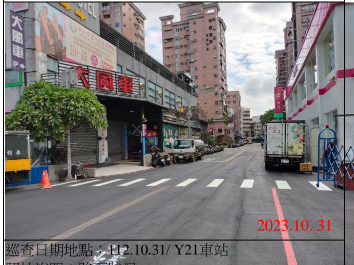
巡查日期地點：112.10.31/ Y21車站 照片說明：路面狀況