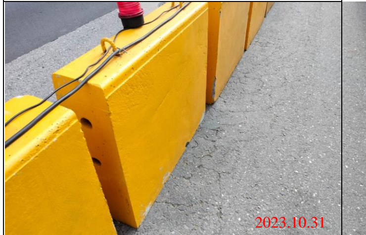
巡查日期地點：112.10.31/ Y23車站 照片說明：路面龜裂狀況