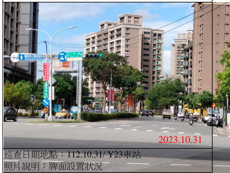
巡查日期地點：112.10.31/ Y23車站 照片說明：牌面設置狀況