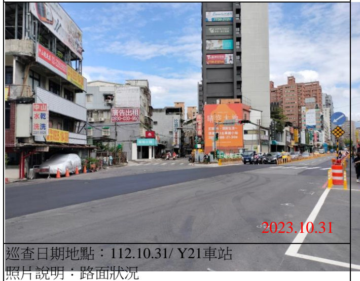
巡查日期地點：112.10.31/ Y21車站 照片說明：路面狀況