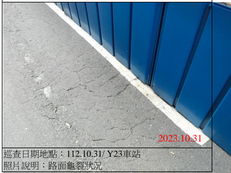
巡查日期地點：112.10.31/ Y23車站 照片說明：路面龜裂狀況