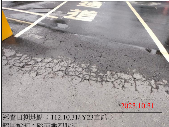
巡查日期地點：112.10.31/ Y23車站 照片說明：路面龜裂狀況