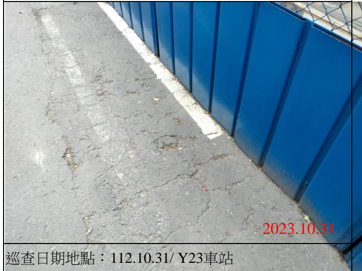
巡查日期地點：112.10.31/ Y23車站 照片說明：路面龜裂狀況