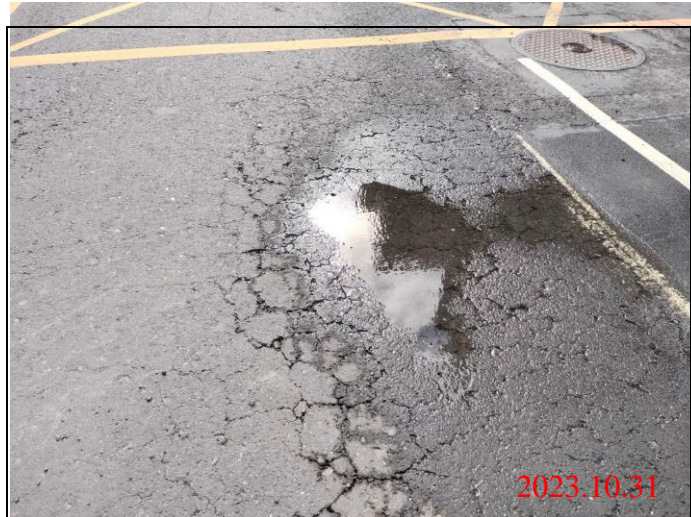
巡查日期地點：112.10.31/ Y23車站 照片說明：路面龜裂狀況