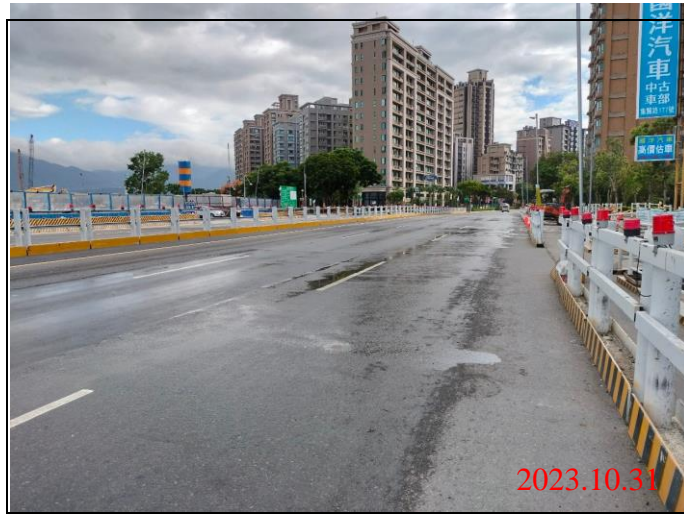
巡查日期地點：112.10.31/ Y22車站 照片說明：路面狀況