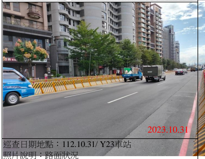
巡查日期地點：112.10.31/ Y23車站 照片說明：路面狀況