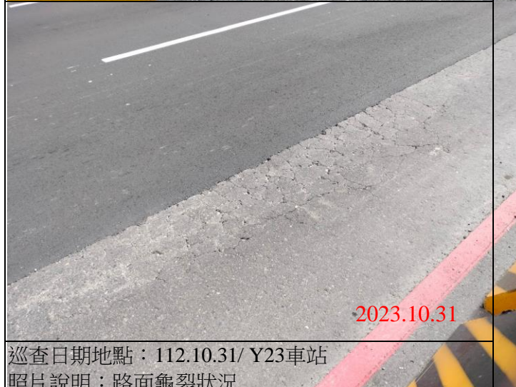
巡查日期地點：112.10.31/ Y23車站 照片說明：路面龜裂狀況