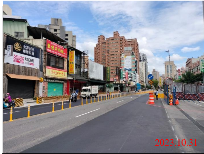
巡查日期地點：112.10.31/ Y21車站 照片說明：路面狀況