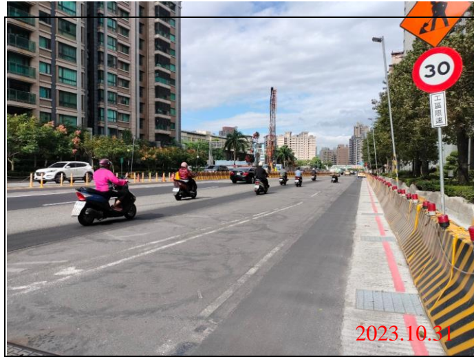
巡查日期地點：112.10.31 Y23車站 照片說明：路面狀況