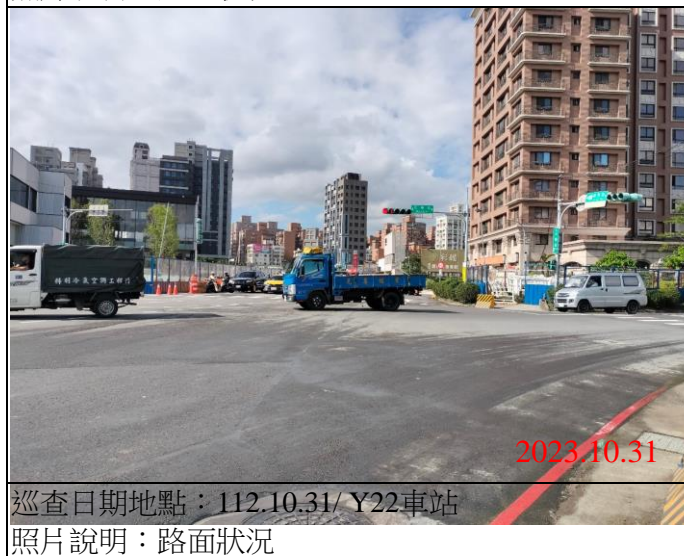
巡查日期地點：112.10.31/ Y22車站 照片說明：路面狀況