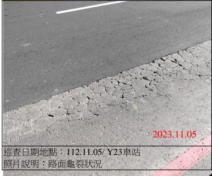
巡查日期地點：112.11.05/ Y23車站 照片說明：路面龜裂狀況