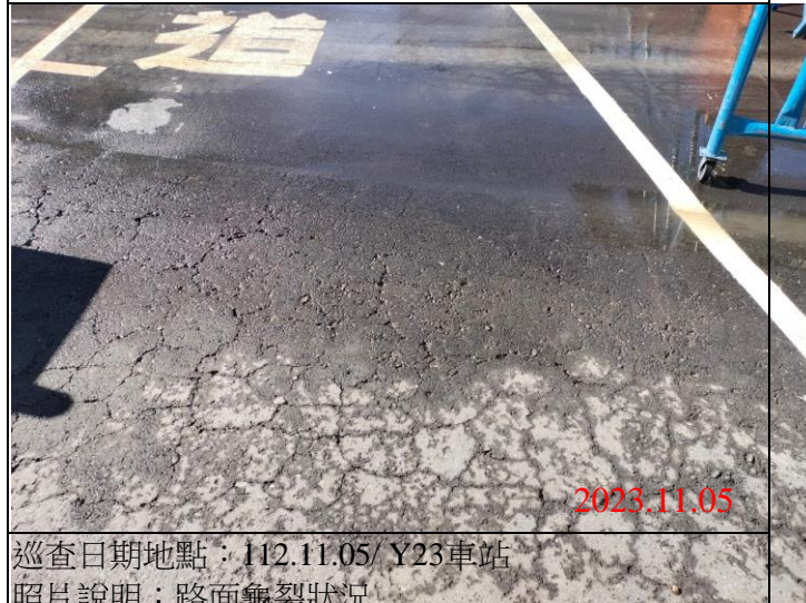
巡查日期地點：112.11.05/ Y23車站 照片說明：路面龜裂狀況