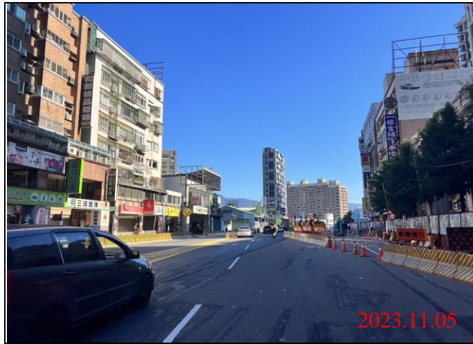
巡查日期地點：112.11.05 Y22車站 照片說明：路面狀況