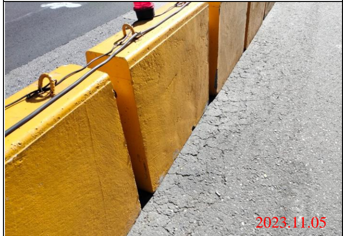
巡查日期地點：112.11.05/ Y23車站 照片說明：路面龜裂狀況