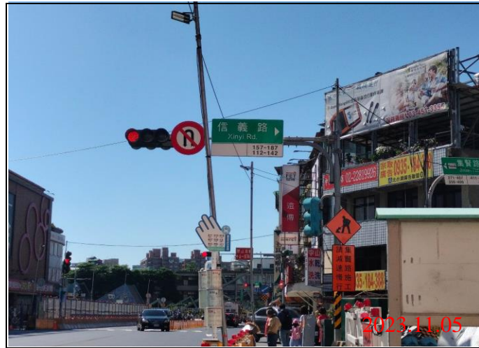
巡查日期地點：112.11.05/ Y21車站 照片說明：牌面設置狀況