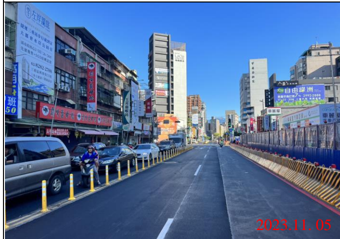
巡查日期地點：112.11.05 Y21車站 照片說明：路面狀況