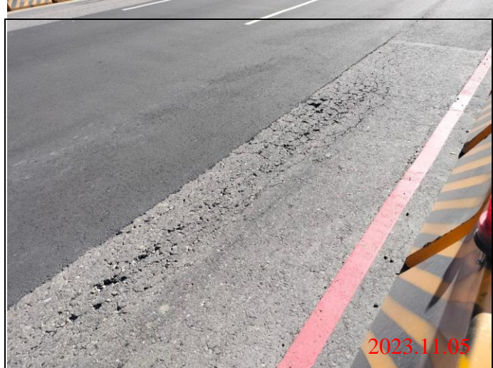
巡查日期地點：112.11.05/ Y23車站 照片說明：路面龜裂狀況