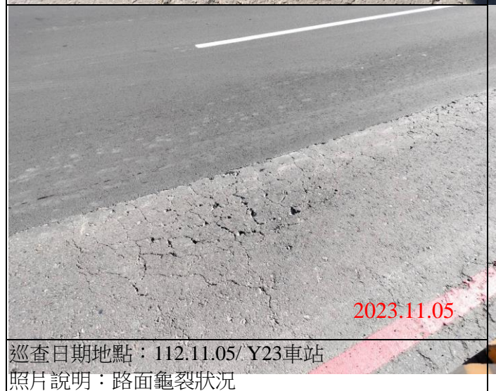
巡查日期地點：112.11.05/ Y23車站 照片說明：路面龜裂狀況