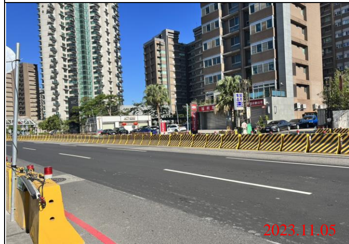
巡查日期地點：112.11.05/ Y23車站 照片說明：路面狀況