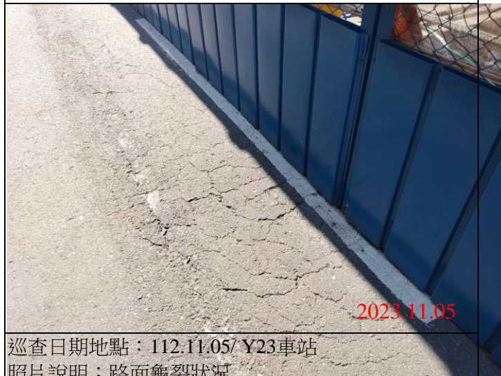
巡查日期地點：112.11.05/ Y23車站 照片說明：路面龜裂狀況