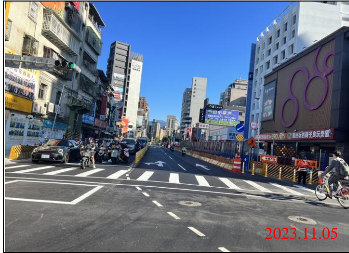
巡查日期地點：112.11.05 Y21車站 照片說明：路面狀況