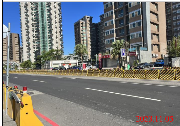
巡查日期地點：112.11.05/ Y23車站 照片說明：路面狀況