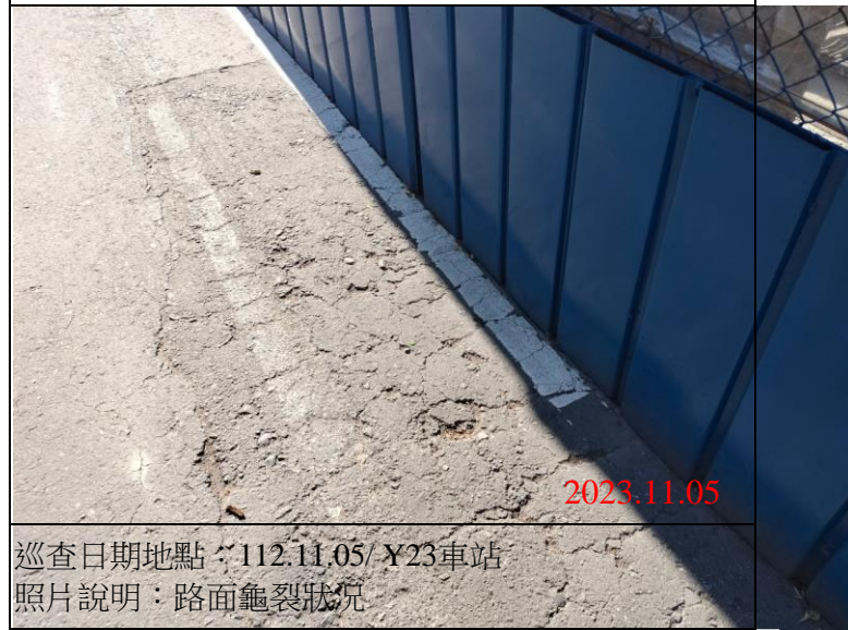
巡查日期地點：112.11.05/ Y23車站 照片說明：路面龜裂狀況