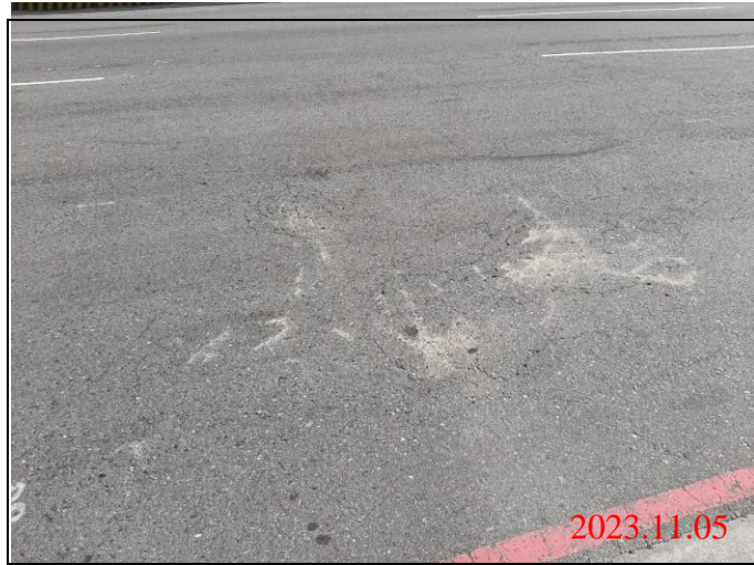
巡查日期地點：112.11.05/ Y23車站 照片說明：路面龜裂狀況