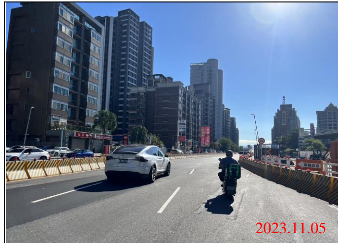
巡查日期地點：112.11.05/ Y23車站 照片說明：路面狀況