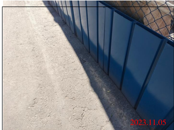
巡查日期地點：112.11.05/ Y23車站 照片說明：路面龜裂狀況