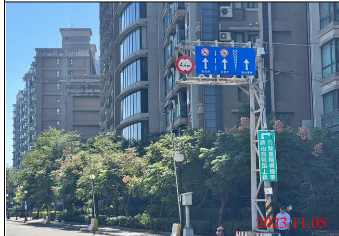
巡查日期地點：112.11.05/ Y23車站 照片說明：牌面設置狀況