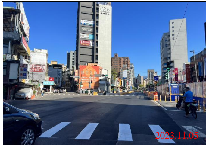
巡查日期地點：112.11.05 Y21車站 照片說明：路面狀況