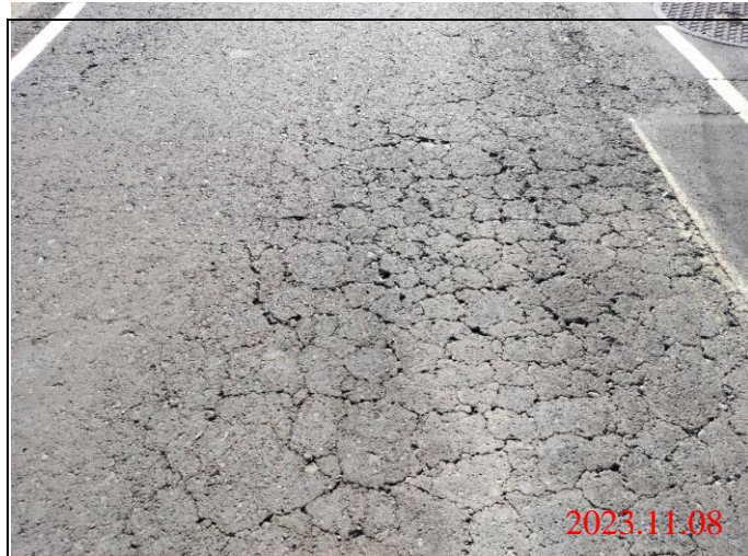
巡查日期地點：112.11.08/ Y23車站 照片說明：路面龜裂狀況