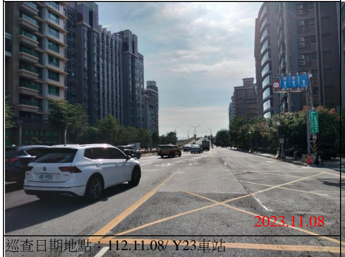
巡查日期地點：112.11.08/ Y23車站 照片說明：路面狀況