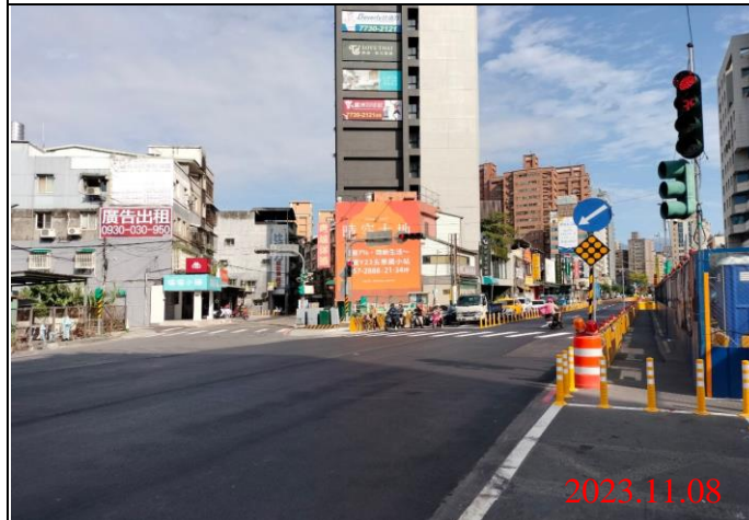
巡查日期地點：112.11.08/ Y21車站 照片說明：路面狀況