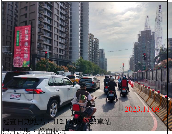
巡查日期地點：112.11.08/ Y23車站 照片說明：路面狀況