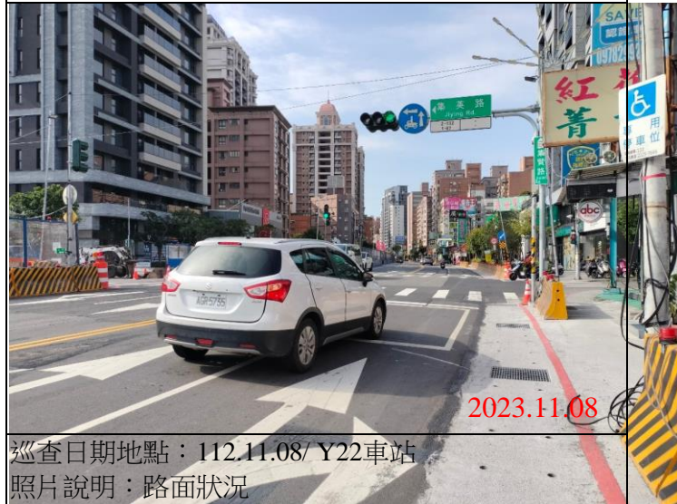
巡查日期地點：112.11.08/ Y22車站 照片說明：路面狀況