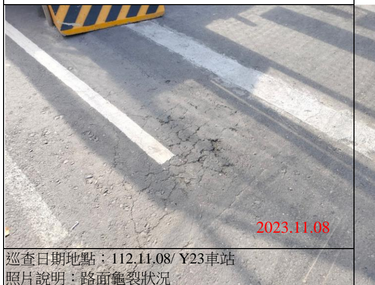
巡查日期地點：112.11.08/ Y23車站 照片說明：路面龜裂狀況