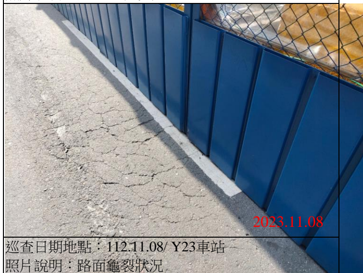
巡查日期地點：112.11.08/ Y23車站 照片說明：路面龜裂狀況