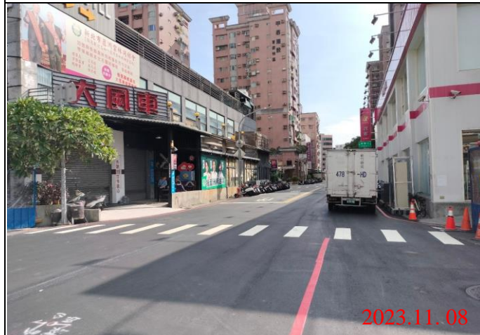
巡查日期地點：112.11.08/ Y21車站 照片說明：路面狀況