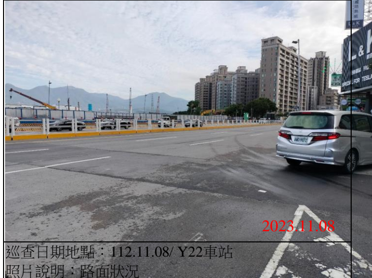
巡查日期地點：112.11.08/ Y22車站 照片說明：路面狀況