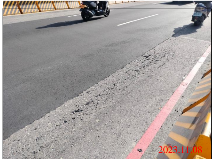
巡查日期地點：112.11.08/ Y23車站 照片說明：路面龜裂狀況