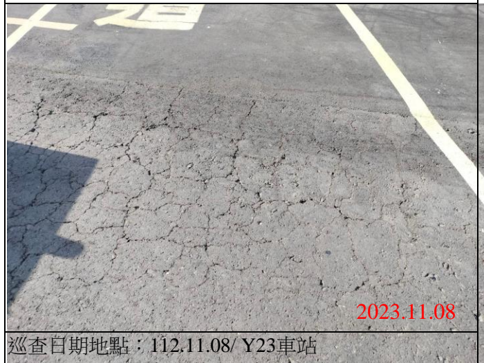
巡查日期地點：112.11.08/ Y23車站 照片說明：路面龜裂狀況