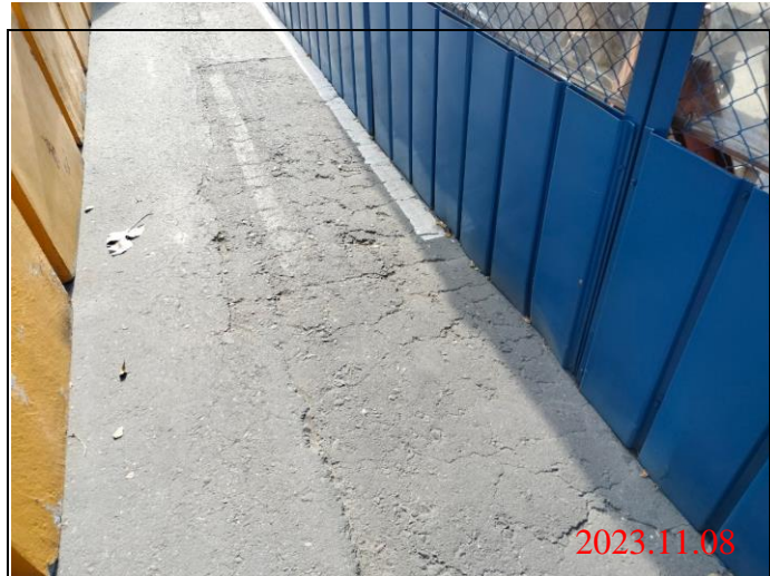
巡查日期地點：112.11.08/ Y23車站 照片說明：路面龜裂狀況