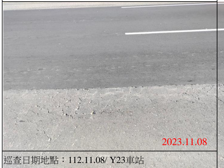
巡查日期地點：112.11.08/ Y23車站 照片說明：路面龜裂狀況