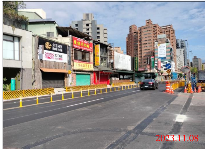
巡查日期地點：112.11.08/ Y21車站 照片說明：路面狀況