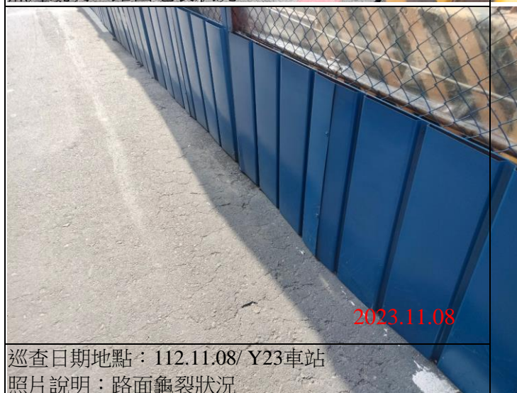
巡查日期地點：112.11.08/ Y23車站 照片說明：路面龜裂狀況