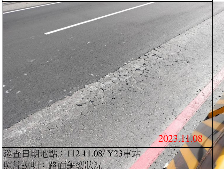
巡查日期地點：112.11.08/ Y23車站 照片說明：路面龜裂狀況