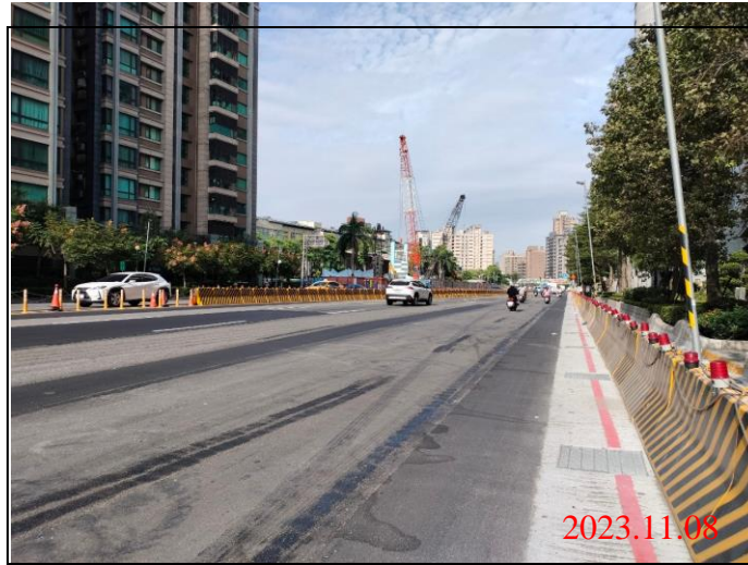
巡查日期地點：112.11.08/ Y23車站 照片說明：路面狀況