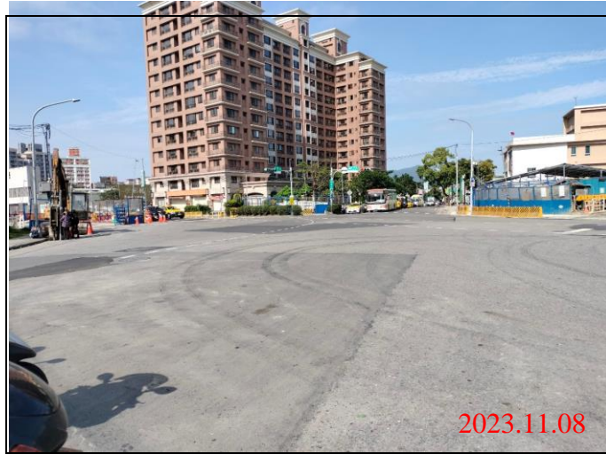
巡查日期地點：112.11.08/ Y22車站 照片說明：路面狀況