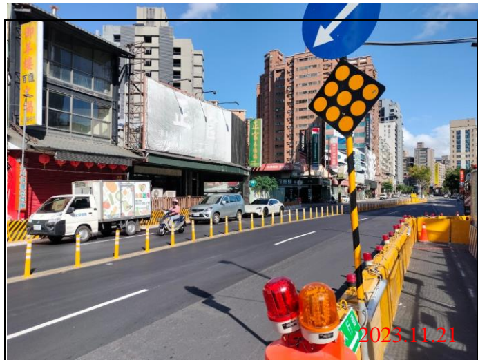
巡查日期地點：112.11.21/ Y21車站 照片說明：路面狀況