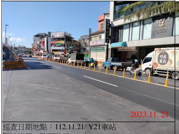
巡查日期地點：112.11.21/ Y21車站 照片說明：路面狀況