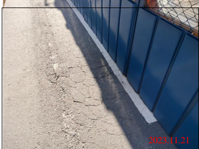
巡查日期地點：112.11.21/ Y23車站 照片說明：路面龜裂狀況