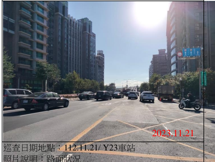
巡查日期地點：112.11.21/ Y23車站 照片說明：路面狀況