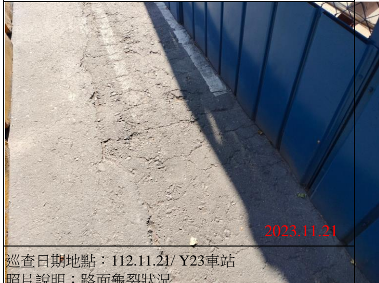
巡查日期地點：112.11.21/ Y23車站 照片說明：路面龜裂狀況