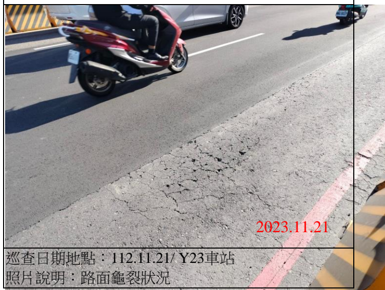
巡查日期地點：112.11.21/ Y23車站 照片說明：路面龜裂狀況