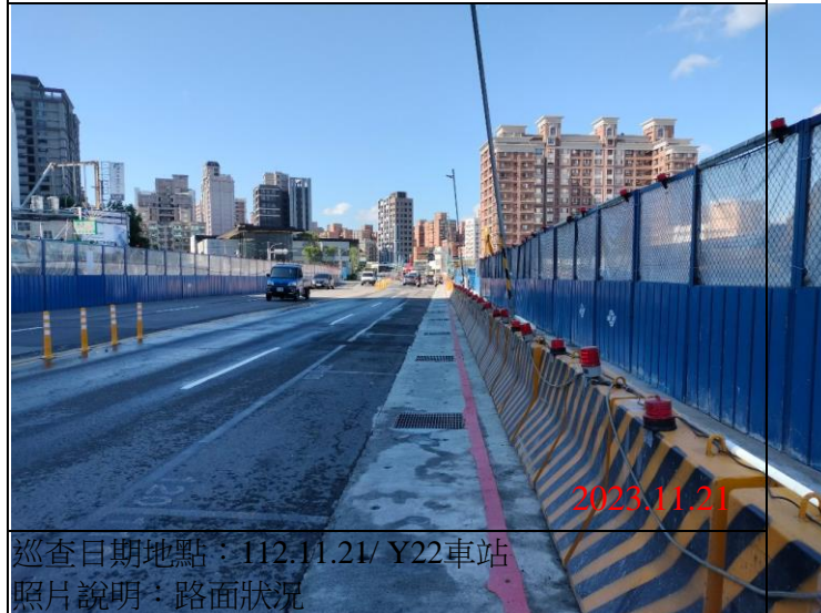
巡查日期地點：112.11.21/ Y22車站 照片說明：路面狀況