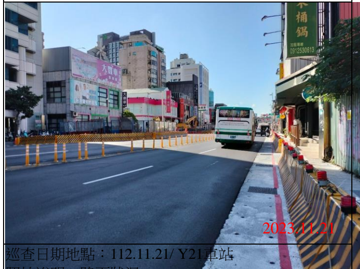
巡查日期地點：112.11.21/ Y21車站 照片說明：路面狀況