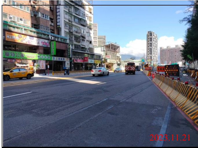
巡查日期地點：112.11.21/ Y22車站 照片說明：路面狀況