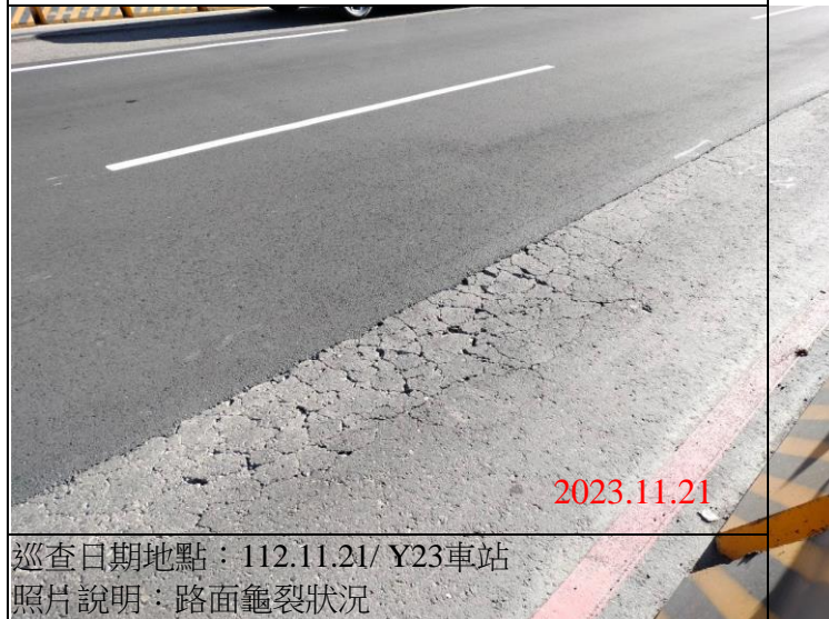
巡查日期地點：112.11.21/ Y23車站 照片說明：路面龜裂狀況