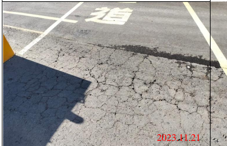
巡查日期地點：112.11.21/ Y23車站 照片說明：路面龜裂狀況