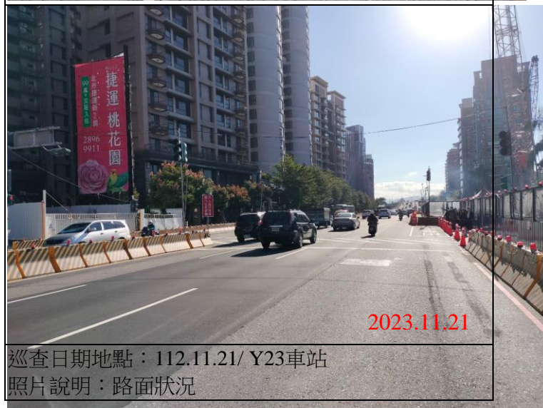
巡查日期地點：112.11.21/ Y23車站 照片說明：路面狀況