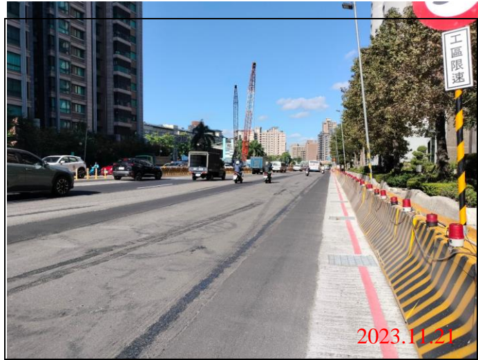
巡查日期地點：112.11.21/ Y23車站 照片說明：路面狀況