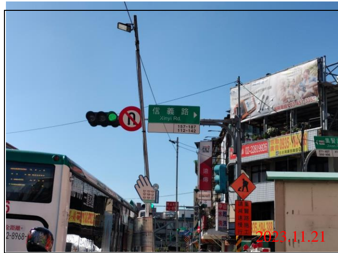
巡查日期地點：112.11.21/ Y21車站 照片說明：牌面設置狀況