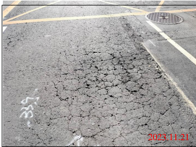
巡查日期地點：112.11.21/ Y23車站 照片說明：路面龜裂狀況