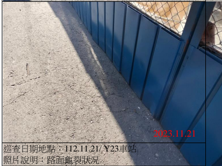
巡查日期地點：112.11.21/ Y23車站 照片說明：路面龜裂狀況