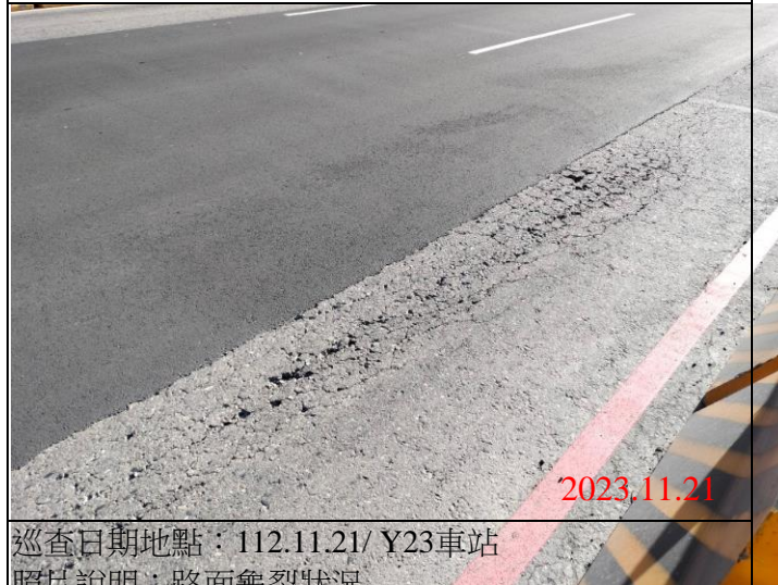
巡查日期地點：112.11.21/ Y23車站 照片說明：路面龜裂狀況