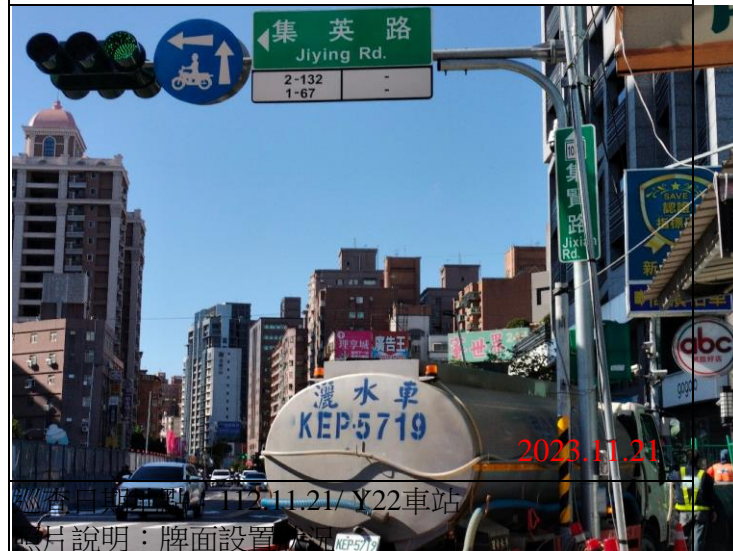
巡查日期地點：112.11.21/ Y22車站 照片說明：牌面設置