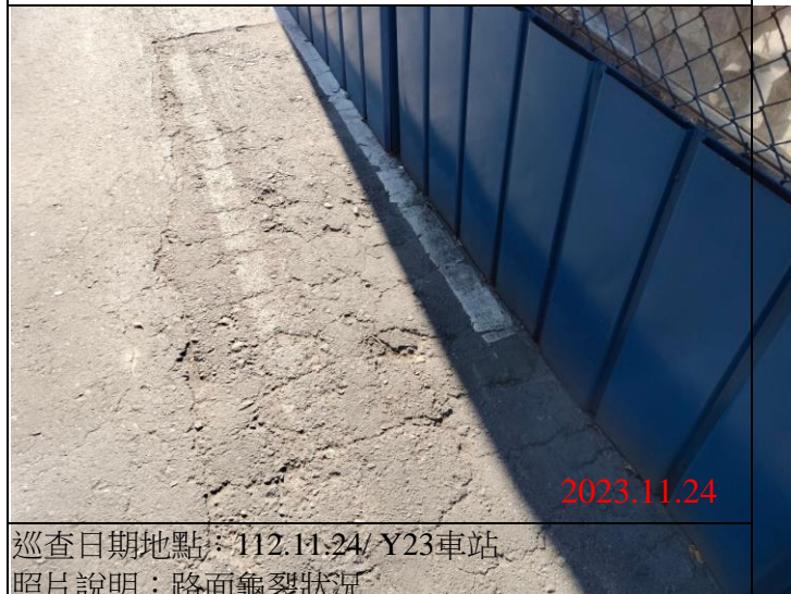
巡查日期地點：112.11.24/ Y23車站 照片說明：路面龜裂狀況