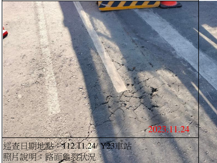
巡查日期地點：112.11.24/ Y23車站 照片說明：路面龜裂狀況