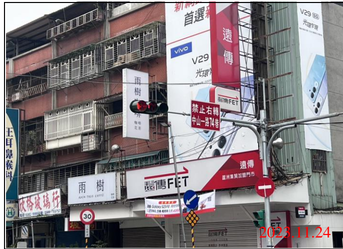
巡查日期地點：112.11.24/ Y21車站 照片說明：牌面設置狀況