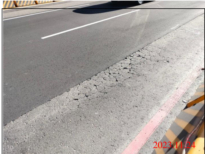
巡查日期地點：112.11.24/ Y23車站 照片說明：路面龜裂狀況