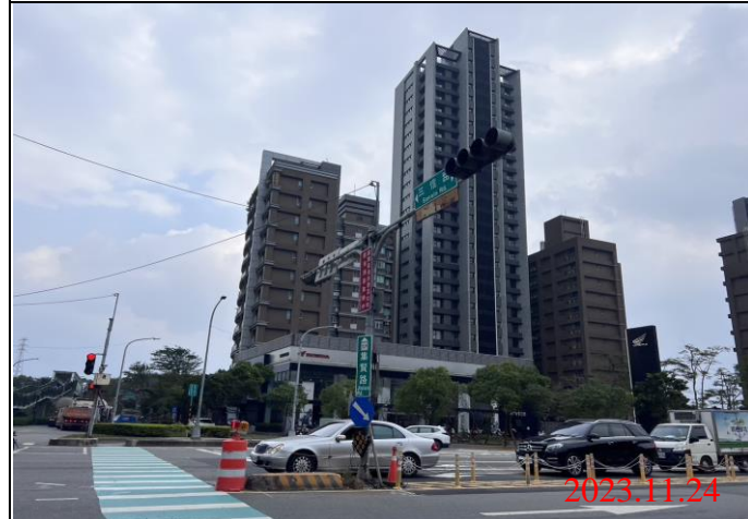
巡查日期地點：112.11.24/ Y23車站 照片說明：牌面設置狀況