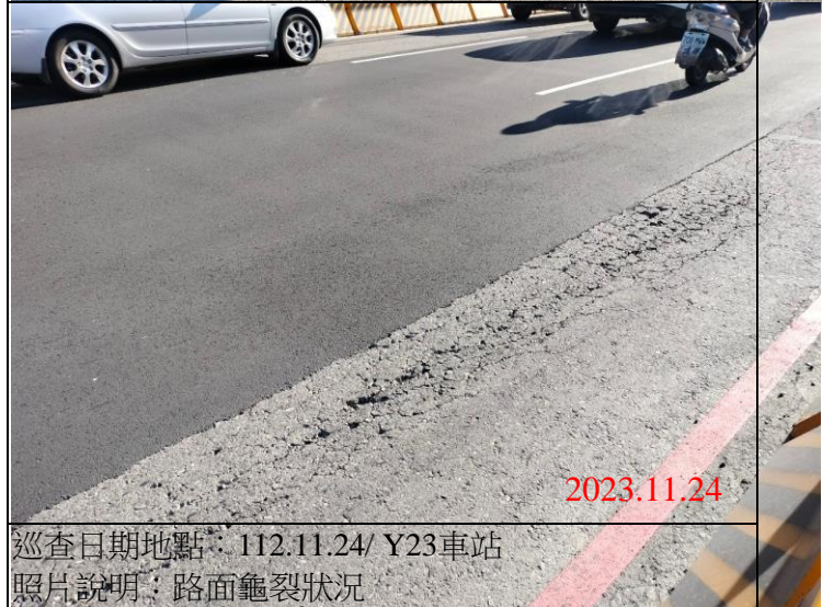
巡查日期地點：112.11.24/ Y23車站 照片說明：路面龜裂狀況