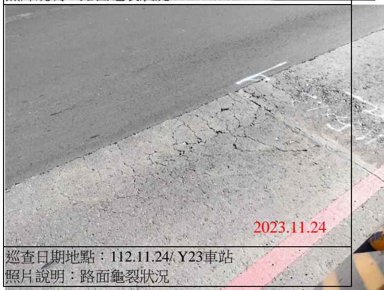
巡查日期地點：112.11.24/ Y23車站 照片說明：路面龜裂狀況