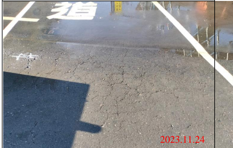
巡查日期地點：112.11.24/ Y23車站 照片說明：路面龜裂狀況