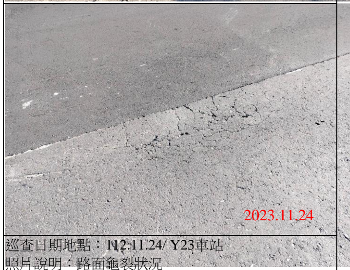
巡查日期地點：112.11.24/ Y23車站 照片說明：路面龜裂狀況