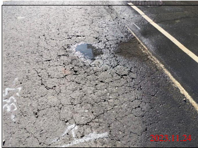
巡查日期地點：112.11.24/ Y23車站 照片說明：路面龜裂狀況