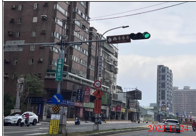
巡查日期地點：112.11.24/ Y22車站 照片說明：牌面設置狀況