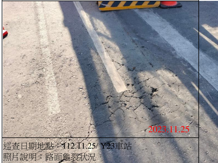
巡查日期地點：112.11.25/ Y23車站 照片說明：路面龜裂狀況