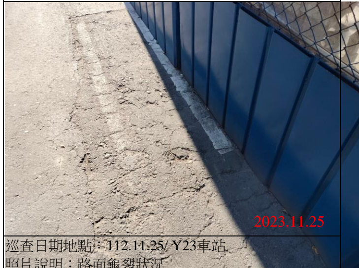
巡查日期地點：112.11.25/ Y23車站 照片說明：路面龜裂狀況