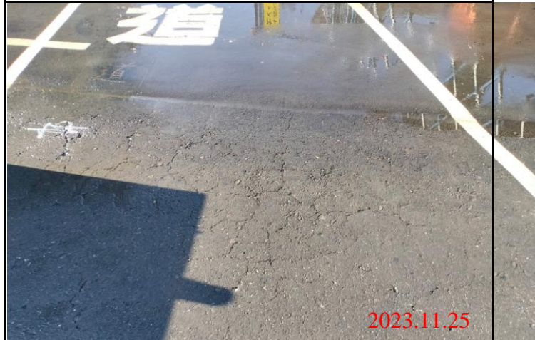
巡查日期地點：112.11.25/ Y23車站 照片說明：路面龜裂狀況