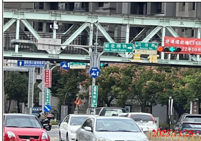
巡查日期地點：112.11.25/ Y23車站 照片說明：牌面設置狀況