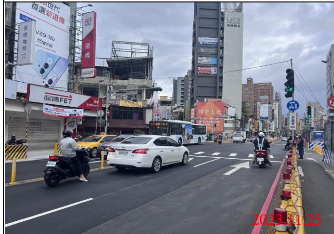
巡查日期地點：112.11.25/ Y21車站 照片說明：路面狀況