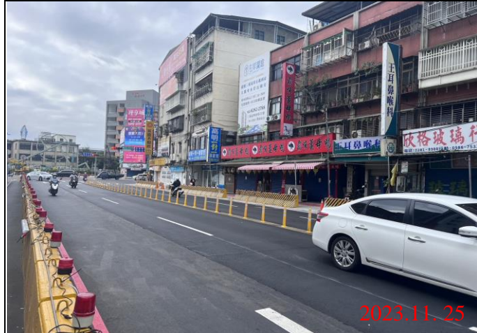
巡查日期地點：112.11.25/ Y21車站 照片說明：路面狀況