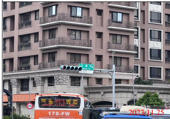
巡查日期地點：112.11.25/ Y22車站 照片說明：牌面設置狀況