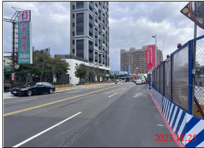
巡查日期地點：112.11.25/ Y22車站 照片說明：路面狀況