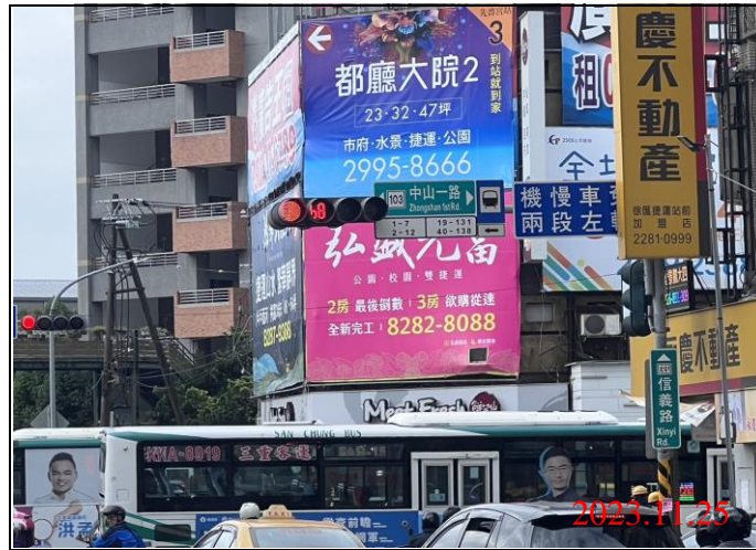
巡查日期地點：112.11.25/ Y21車站 照片說明：牌面設置狀況