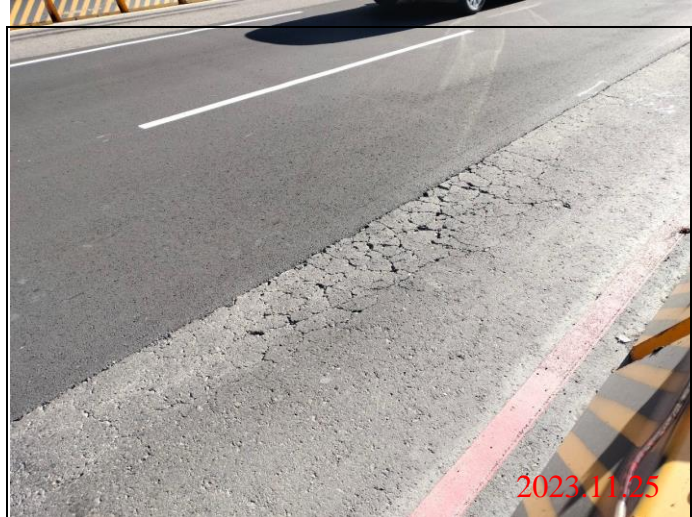
巡查日期地點：112.11.25/ Y23車站 照片說明：路面龜裂狀況