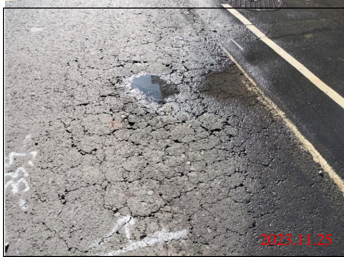
巡查日期地點：112.11.25/ Y23車站 照片說明：路面龜裂狀況