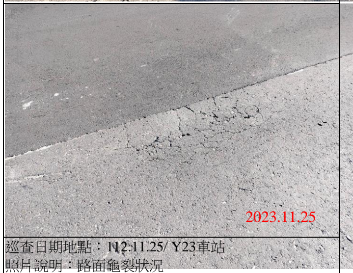
巡查日期地點：112.11.25/ Y23車站 照片說明：路面龜裂狀況