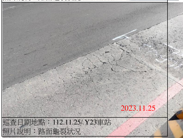
巡查日期地點：112.11.25/ Y23車站 照片說明：路面龜裂狀況