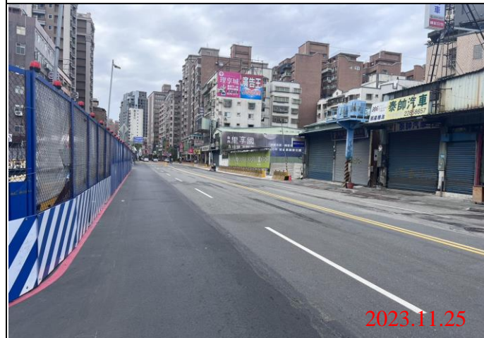
巡查日期地點：112.11.25/ Y22車站 照片說明：路面狀況