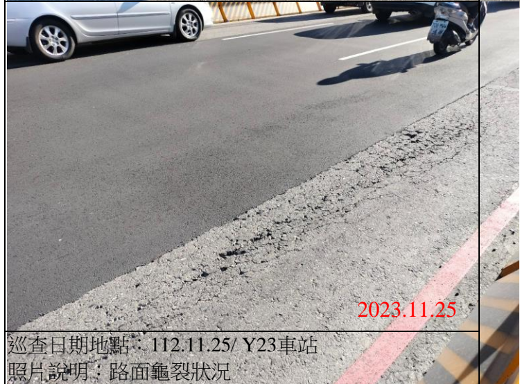
巡查日期地點：112.11.25/ Y23車站 照片說明：路面龜裂狀況