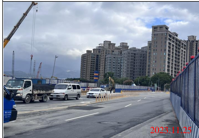
巡查日期地點：112.11.25/ Y22車站 照片說明：路面狀況