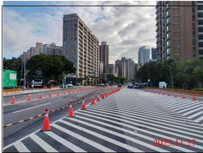
巡查日期地點：112.11.27/ Y22車站 照片說明：路面狀況