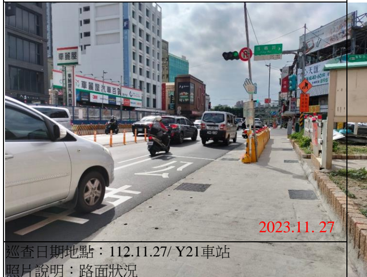
巡查日期地點：112.11.27/ Y21車站 照片說明：路面狀況