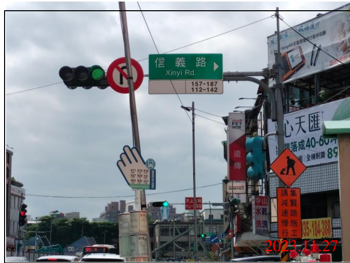
巡查日期地點：112.11.27/ Y21車站 照片說明：牌面設置狀況