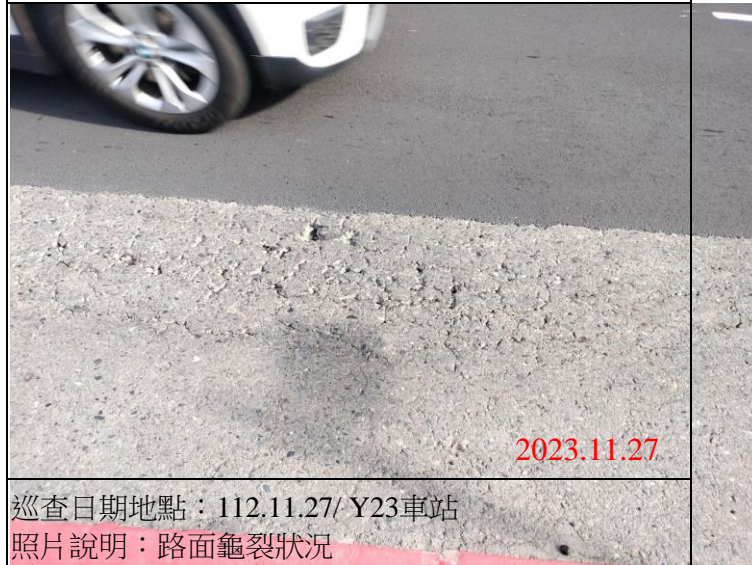
巡查日期地點：112.11.27/ Y23車站 照片說明：路面龜裂狀況