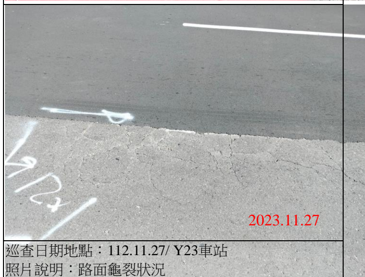
巡查日期地點：112.11.27/ Y23車站 照片說明：路面龜裂狀況