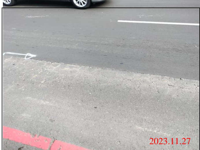
巡查日期地點：112.11.27/ Y23車站 照片說明：路面龜裂狀況