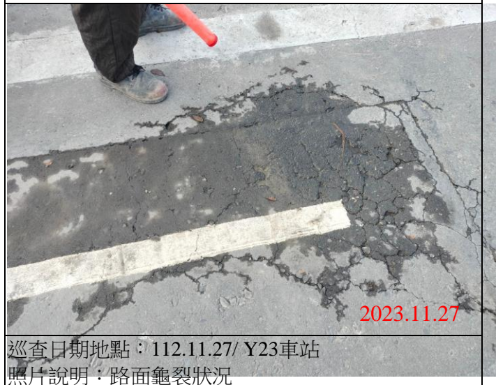
巡查日期地點：112.11.27/ Y23車站 照片說明：路面龜裂狀況