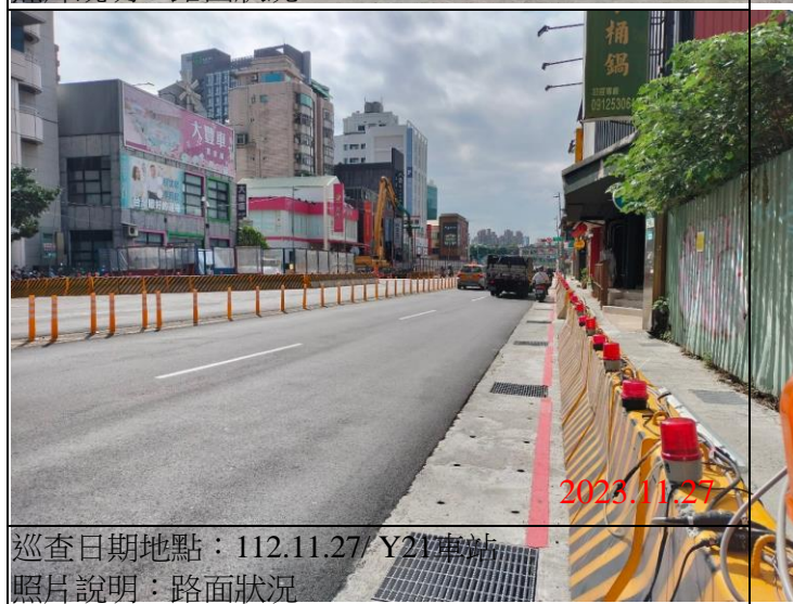
巡查日期地點：112.11.27/ Y21車站 照片說明：路面狀況