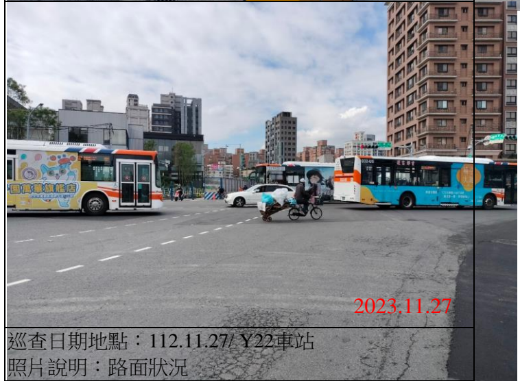
巡查日期地點：112.11.27/ Y22車站 照片說明：路面狀況