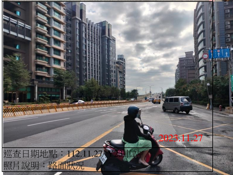
巡查日期地點：112.11.27/ Y23車站 照片說明：路面狀況