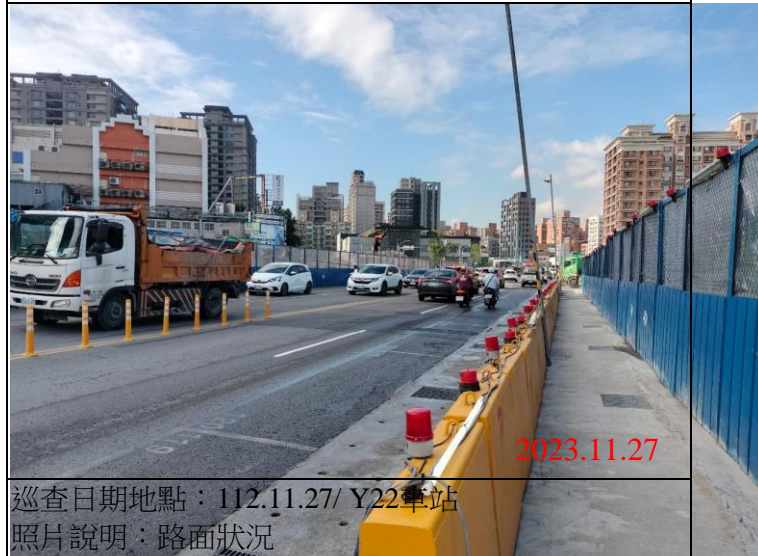
巡查日期地點：112.11.27/ Y22車站 照片說明：路面狀況