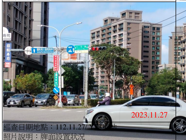
巡查日期地點：112.11.27/ Y21車站 照片說明：牌面設置狀況