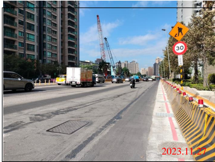
巡查日期地點：112.11.27/ Y23車站 照片說明：路面狀況