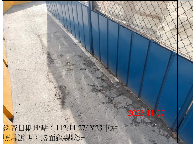
巡查日期地點：112.11.27/ Y23車站 照片說明：路面龜裂狀況