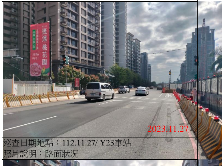
巡查日期地點：112.11.27/ Y23車站 照片說明：路面狀況