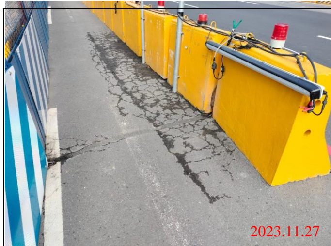
巡查日期地點：112.11.27/ Y23車站 照片說明：路面龜裂狀況