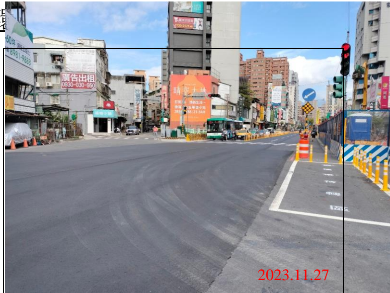
巡查日期地點：112.11.27/ Y21車站 照片說明：路面狀況