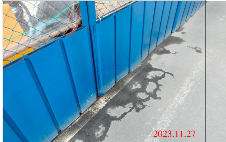
巡查日期地點：112.11.27/ Y23車站 照片說明：路面龜裂狀況