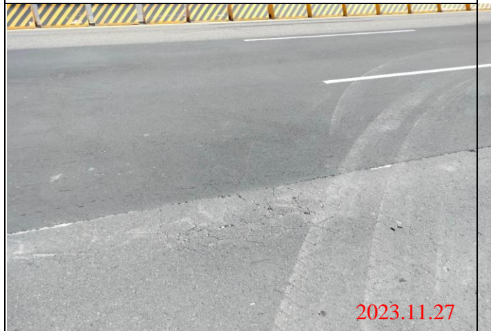
巡查日期地點：112.11.27/ Y23車站 照片說明：路面龜裂狀況