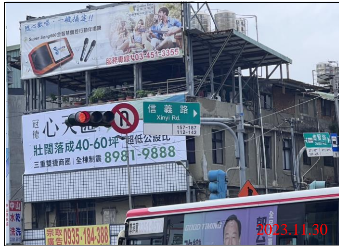
巡查日期地點：112.11.29/ Y21車站 照片說明：牌面設置狀況