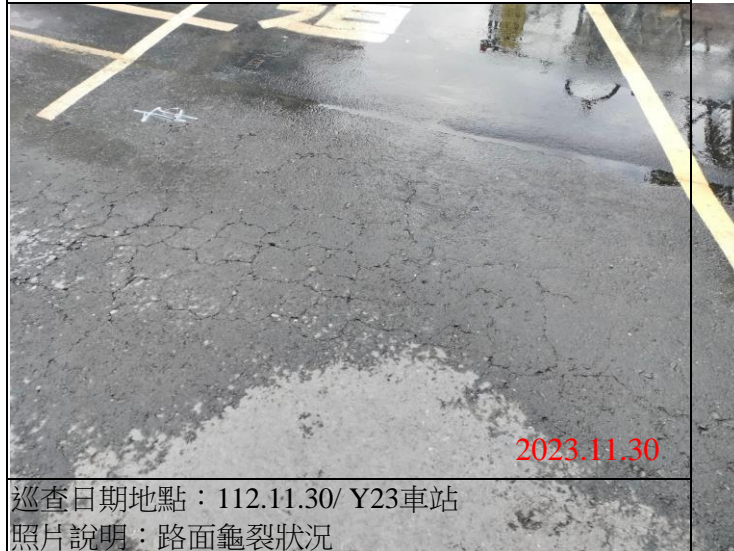
巡查日期地點：112.11.30/ Y23車站 照片說明：路面龜裂狀況