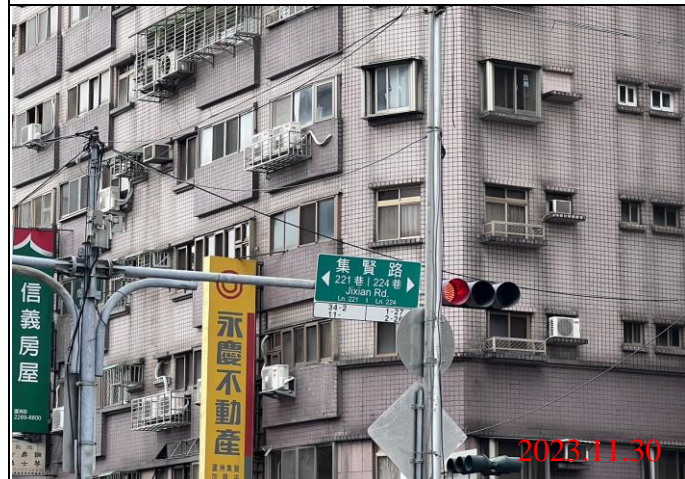
巡查日期地點：112.11.30/ Y22車站 照片說明：牌面設置狀況