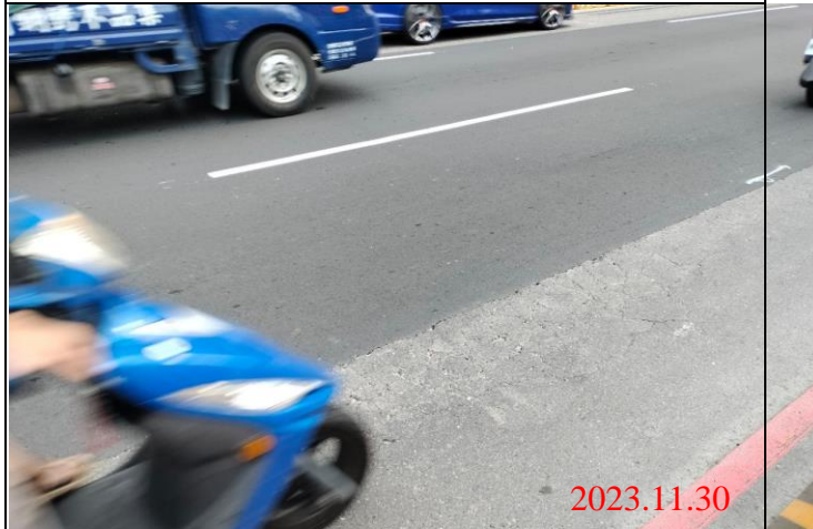
巡查日期地點：112.11.30/ Y23車站 照片說明：路面龜裂狀況