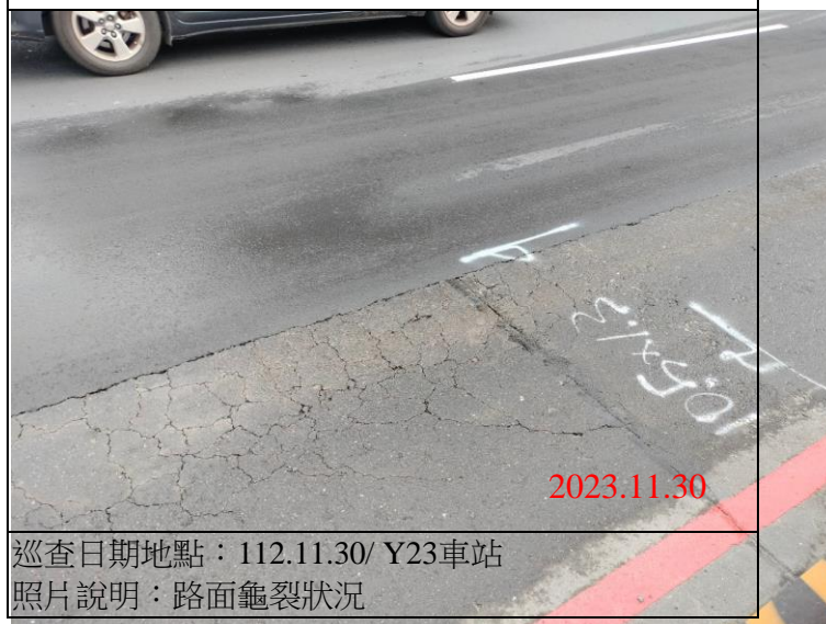
巡查日期地點：112.11.30/ Y23車站 照片說明：路面龜裂狀況