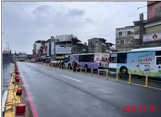
巡查日期地點：112.11.30/ Y21車站 照片說明：路面狀況