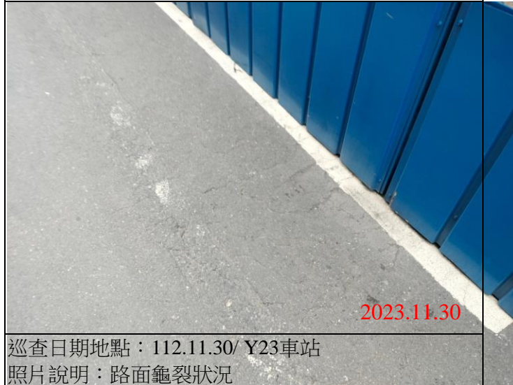
巡查日期地點：112.11.30/ Y23車站 照片說明：路面龜裂狀況