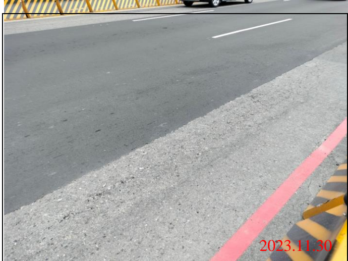
巡查日期地點：112.11.30/ Y23車站 照片說明：路面龜裂狀況