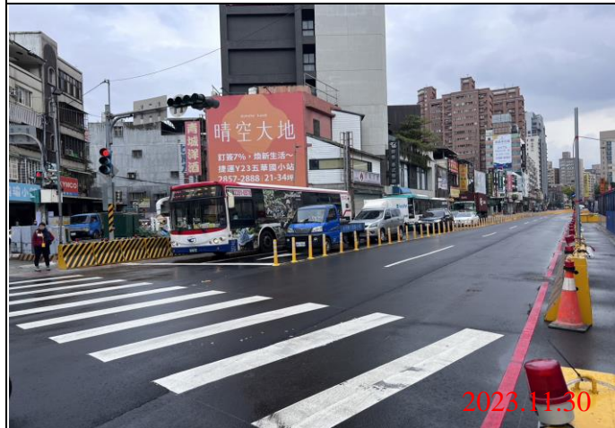
巡查日期地點：112.11.30/ Y21車站 照片說明：路面狀況