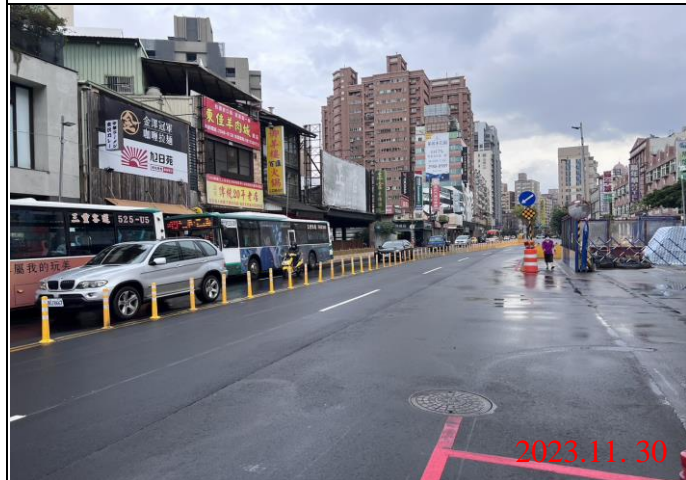
巡查日期地點：112.11.30/ Y21車站 照片說明：路面狀況