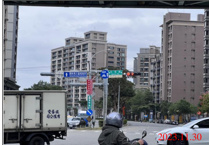
巡查日期地點：112.11.30/ Y23車站 照片說明：牌面設置狀況