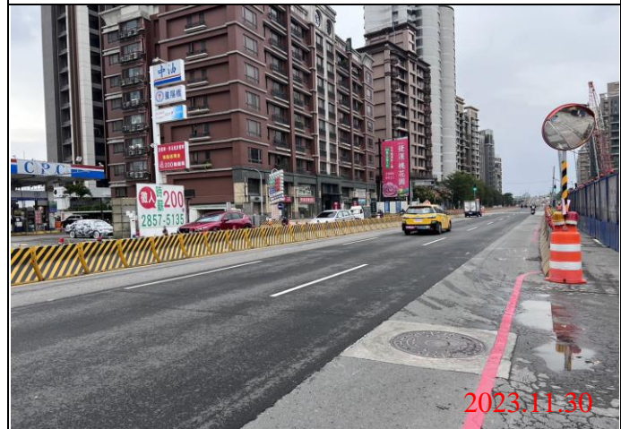
巡查日期地點：112.11.30/ Y23車站 照片說明：路面狀況