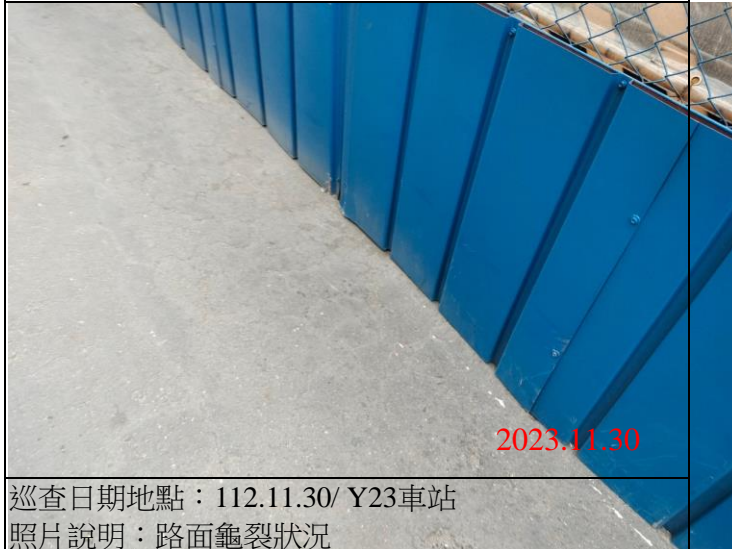
巡查日期地點：112.11.30/ Y23車站 照片說明：路面龜裂狀況