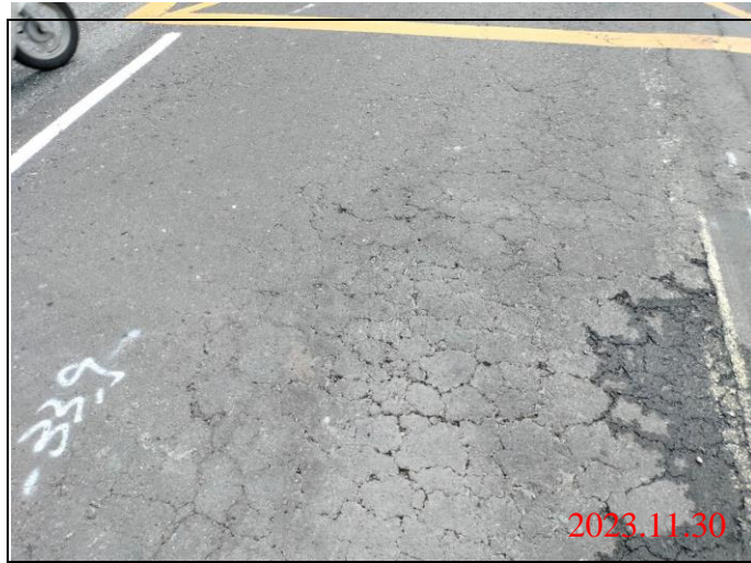
巡查日期地點：112.11.30/ Y23車站 照片說明：路面龜裂狀況