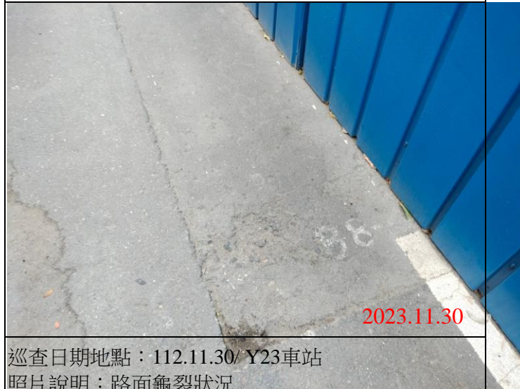
巡查日期地點：112.11.30/ Y23車站 照片說明：路面龜裂狀況