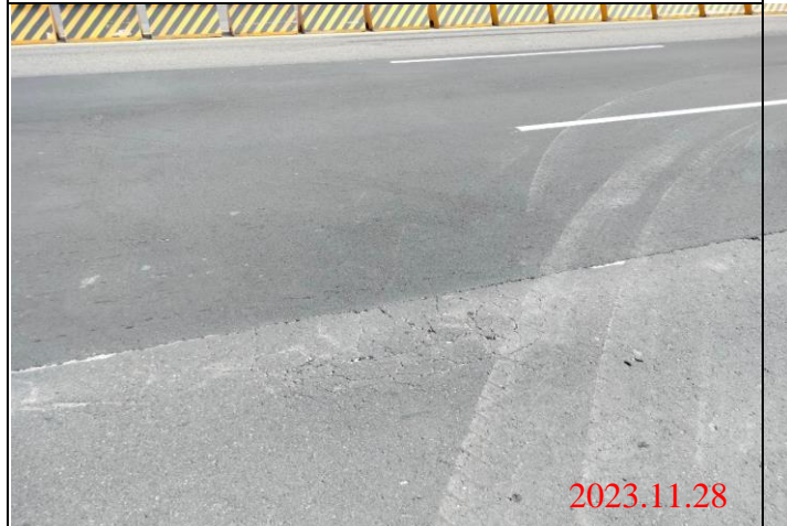
巡查日期地點：112.11.28/ Y23車站 照片說明：路面龜裂狀況