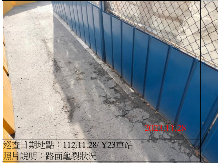
巡查日期地點：112.11.28/ Y23車站 照片說明：路面龜裂狀況