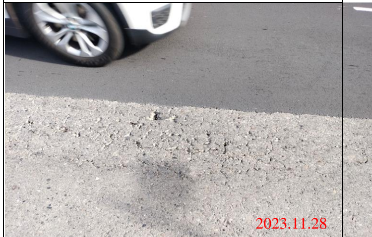
巡查日期地點：112.11.28/ Y23車站 照片說明：路面龜裂狀況