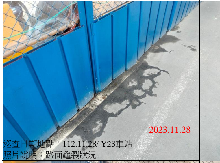
巡查日期地點：112.11.28/ Y23車站 照片說明：路面龜裂狀況