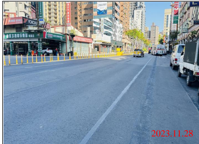
巡查日期地點：112.11.28/ Y21車站 照片說明：路面狀況