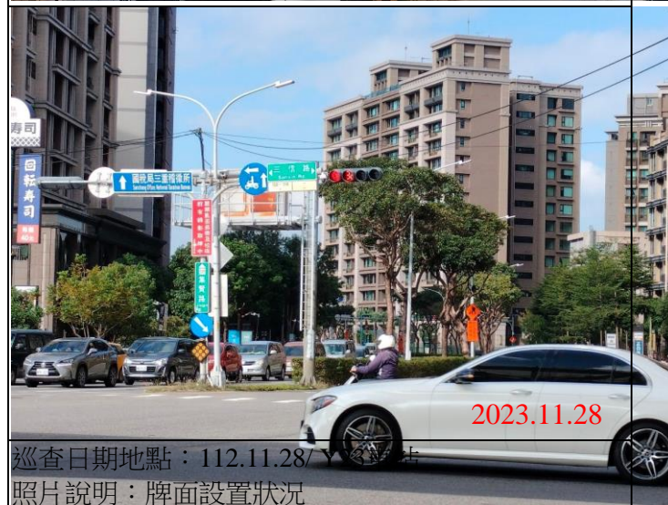
巡查日期地點：112.11.28/ Y21車站 照片說明：牌面設置狀況