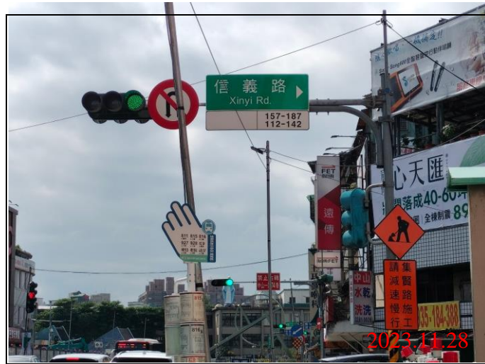
巡查日期地點：112.11.28/ Y21車站 照片說明：牌面設置狀況