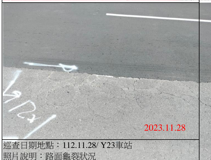
巡查日期地點：112.11.28/ Y23車站 照片說明：路面龜裂狀況