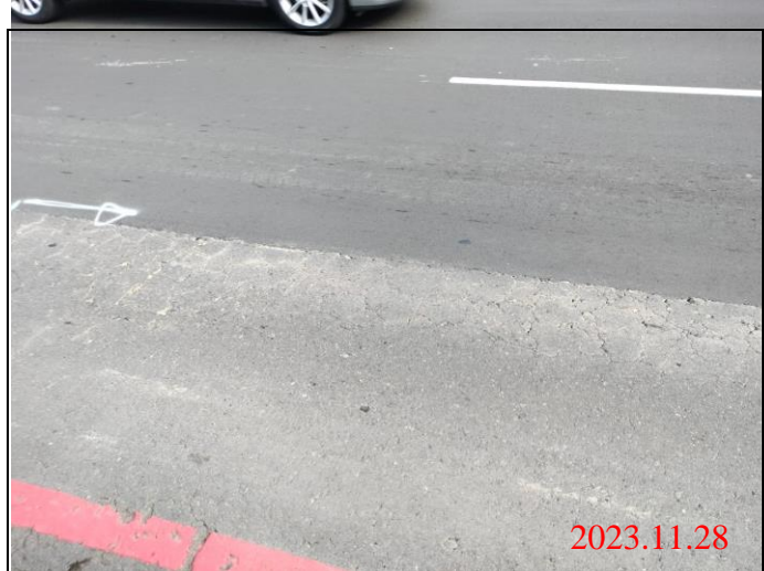
巡查日期地點：112.11.28/ Y23車站 照片說明：路面龜裂狀況