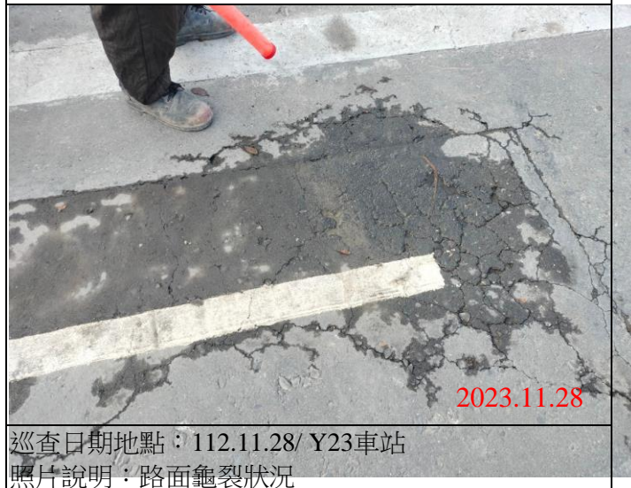
巡查日期地點：112.11.28/ Y23車站 照片說明：路面龜裂狀況