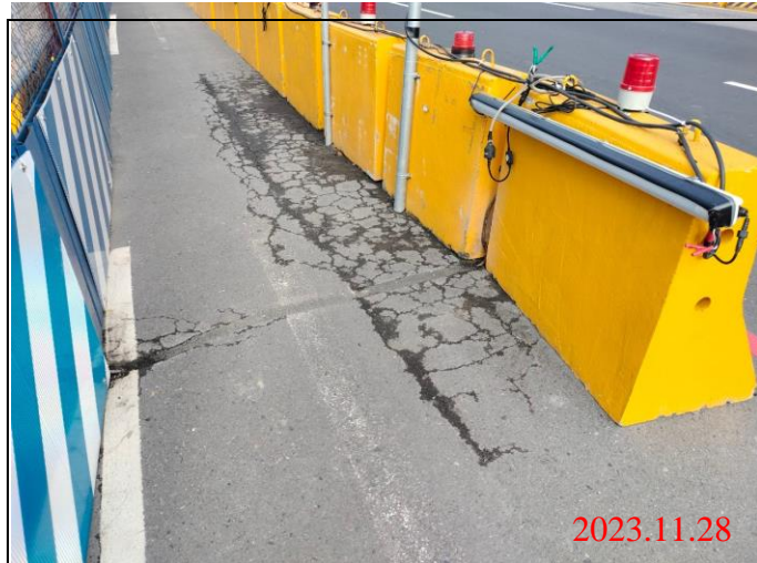
巡查日期地點：112.11.28/ Y23車站 照片說明：路面龜裂狀況