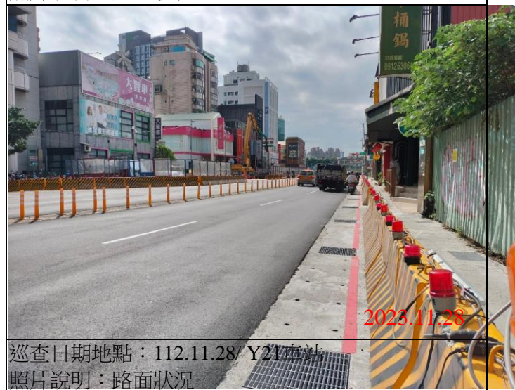
巡查日期地點：112.11.28/ Y21車站 照片說明：路面狀況