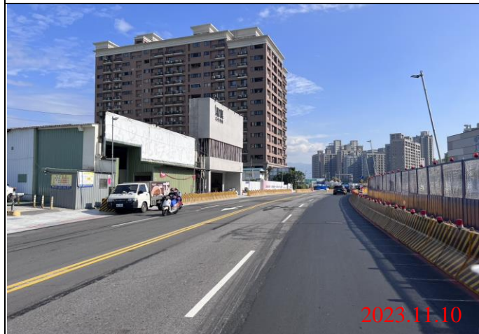
巡查日期地點：112.11.10/ Y22車站 照片說明：路面狀況