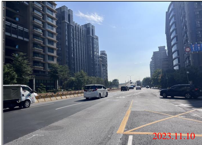
巡查日期地點：112.11.10/ Y23車站 照片說明：路面狀況