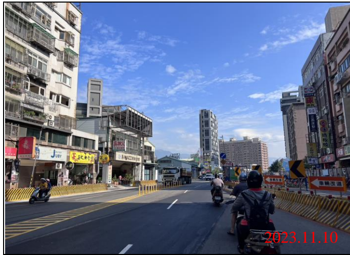
巡查日期地點：112.11.10/ Y22車站 照片說明：路面狀況