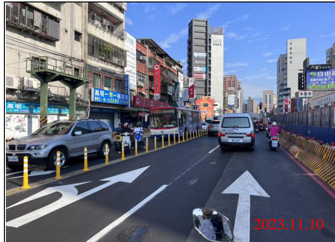
巡查日期地點：112.11.10/ Y21車站 照片說明：路面狀況