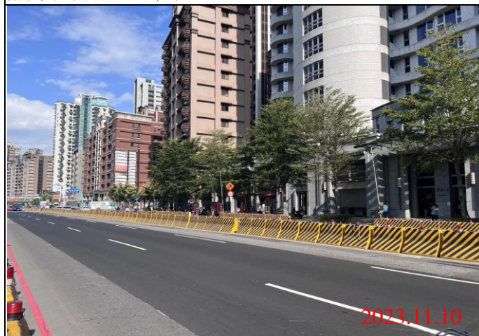
巡查日期地點：112.11.10/ Y23車站 照片說明：路面狀況