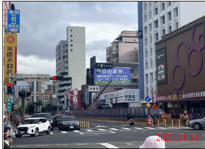
巡查日期地點：112.11.11/ Y21車站 照片說明：路面狀況