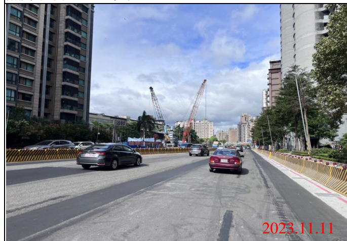
巡查日期地點：112.11.11/ Y23車站 照片說明：路面狀況