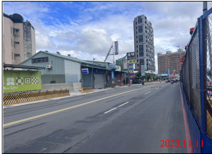
巡查日期地點：112.11.11/ Y22車站 照片說明：路面狀況