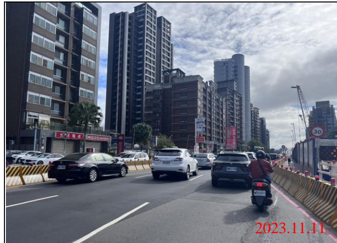
巡查日期地點：112.11.11/ Y23車站 照片說明：路面狀況