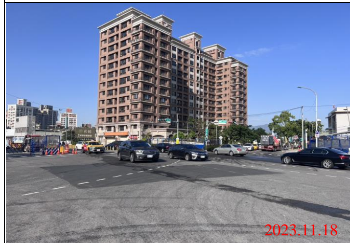
巡查日期地點：112.11.18/ Y22車站 照片說明：路面狀況