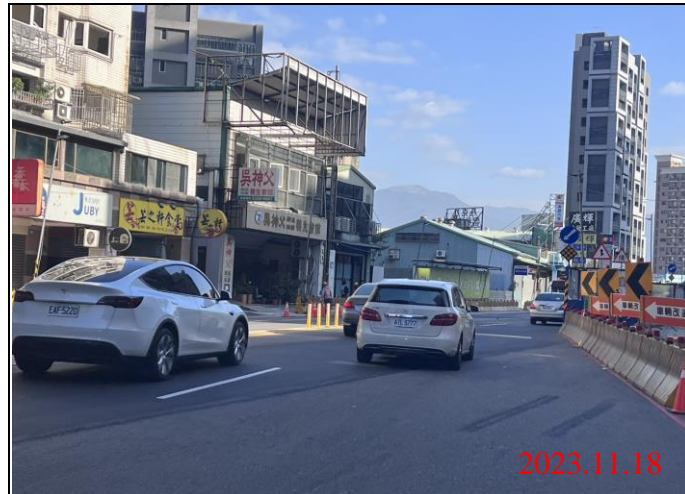
巡查日期地點：112.11.18/ Y22車站 照片說明：路面狀況