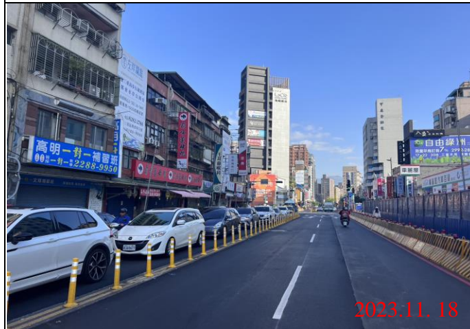
巡查日期地點：112.11.18/ Y21車站 照片說明：路面狀況