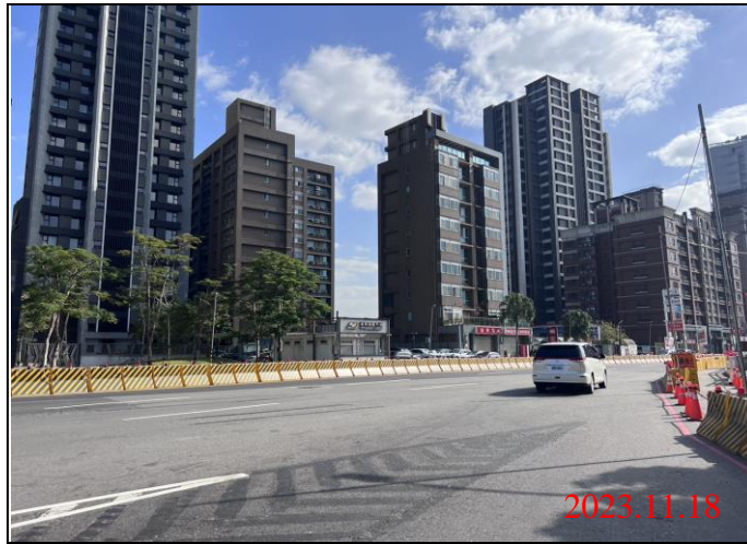
巡查日期地點：112.11.18/ Y23車站 照片說明：路面狀況