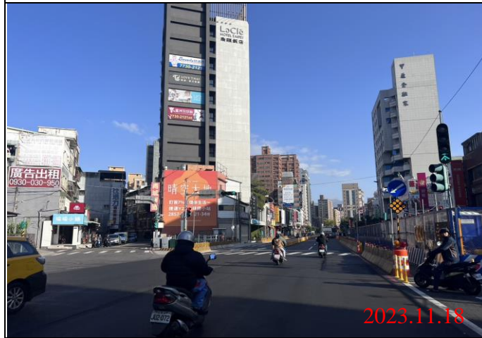
巡查日期地點：112.11.18/ Y21車站 照片說明：路面狀況