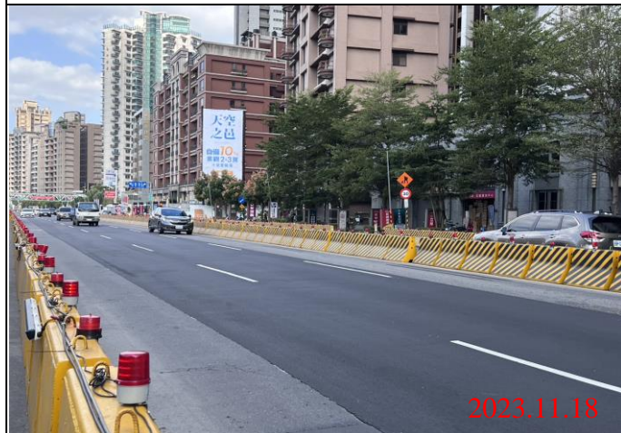
巡查日期地點：112.11.18/ Y23車站 照片說明：路面狀況