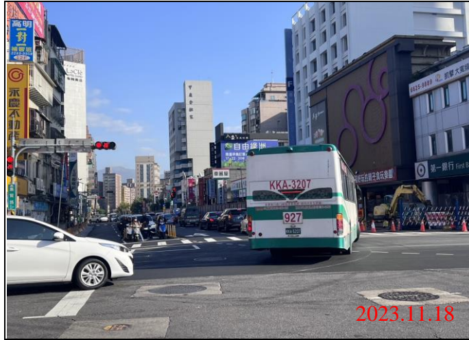
巡查日期地點：112.11.18/ Y21車站 照片說明：路面狀況