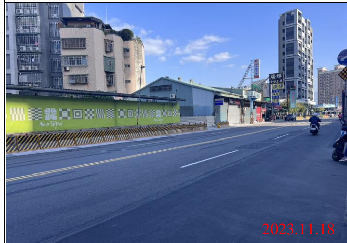
巡查日期地點：112.11.18/ Y22車站 照片說明：路面狀況