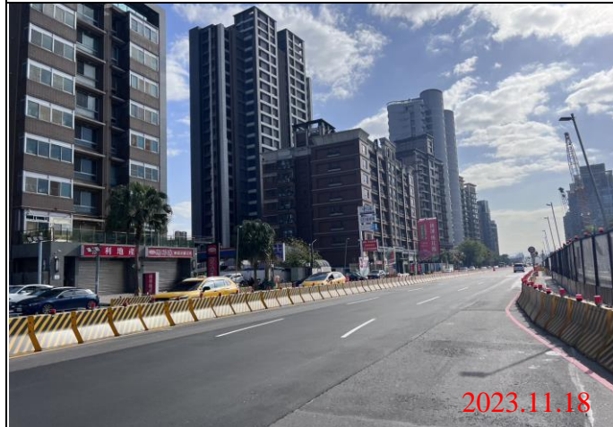
巡查日期地點：112.11.18/ Y23車站 照片說明：路面狀況