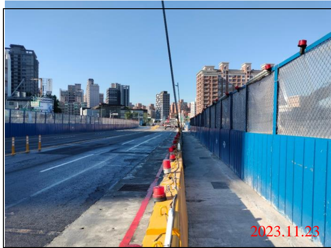
巡查日期地點：112.11.23/ Y22車站 照片說明：路面狀況