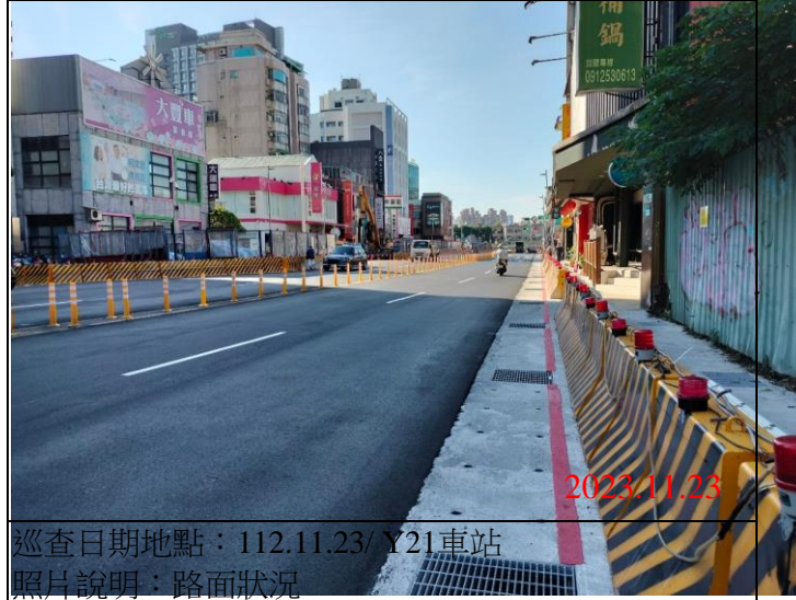
巡查日期地點：112.11.23/ Y21車站 照片說明：路面狀況