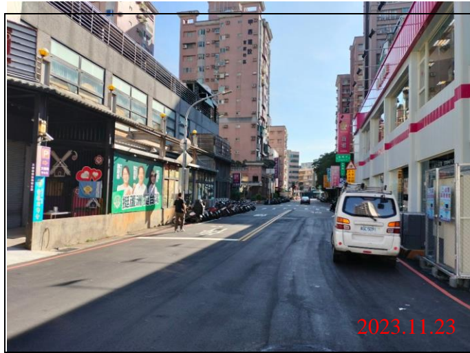
巡查日期地點：112.11.23/ Y21車站 照片說明：路面狀況