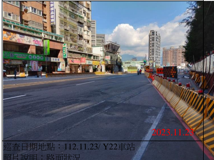
巡查日期地點：112.11.23/ Y22車站 照片說明：路面狀況