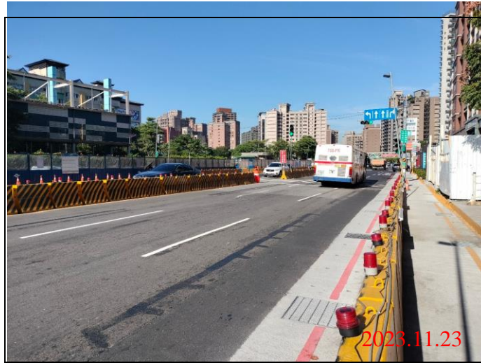
巡查日期地點：112.11.23/ Y23車站 照片說明：路面狀況