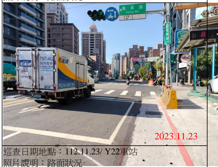
巡查日期地點：112.11.23/ Y22車站 照片說明：路面狀況