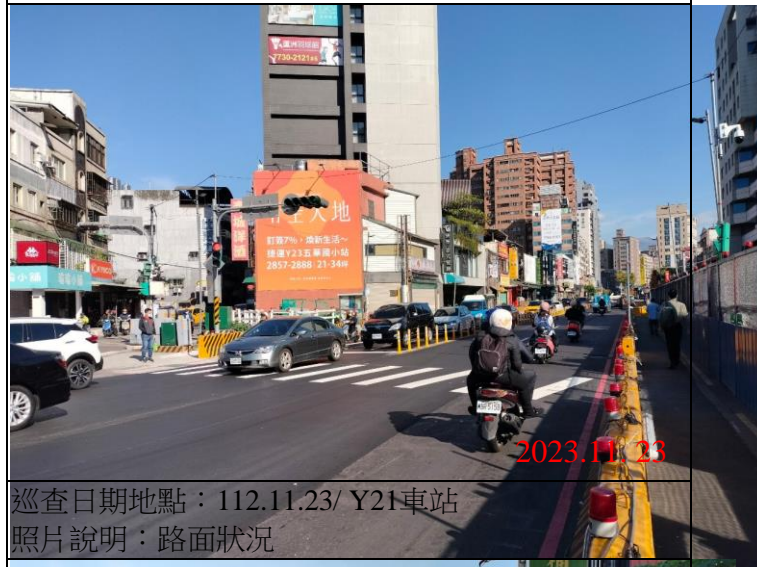
巡查日期地點：112.11.23/ Y21車站 照片說明：路面狀況