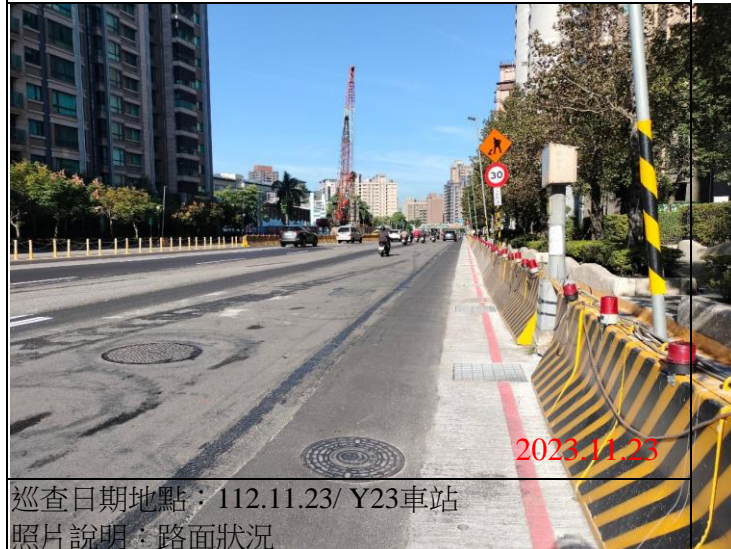
巡查日期地點：112.11.23/ Y23車站 照片說明：路面狀況