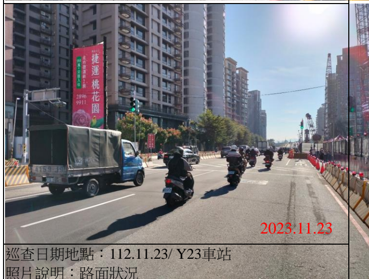
巡查日期地點：112.11.23/ Y23車站 照片說明：路面狀況