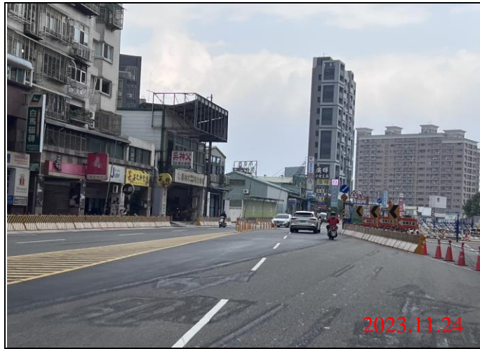
巡查日期地點：112.11.24/ Y22車站 照片說明：路面狀況