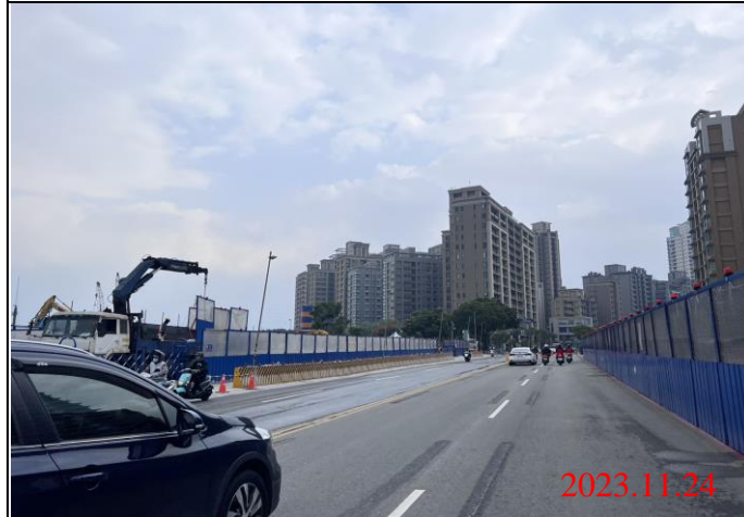
巡查日期地點：112.11.24/ Y22車站 照片說明：路面狀況