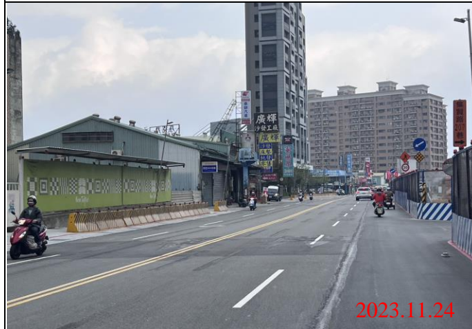
巡查日期地點：112.11.24/ Y22車站 照片說明：路面狀況