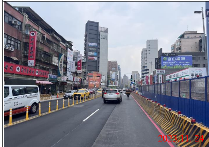
巡查日期地點：112.11.24/ Y21車站 照片說明：路面狀況