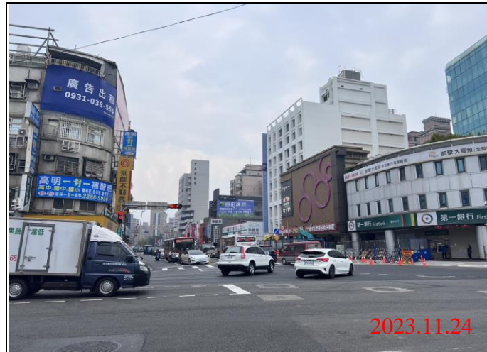
巡查日期地點：112.11.24/ Y21車站 照片說明：路面狀況