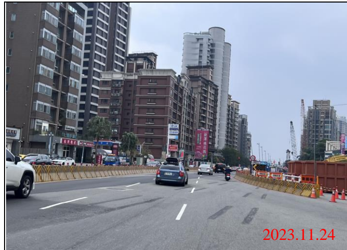
巡查日期地點：112.11.24/ Y23車站 照片說明：路面狀況