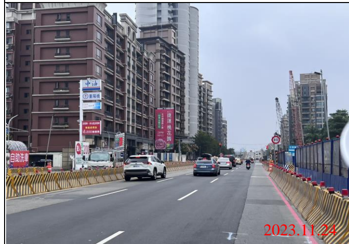
巡查日期地點：112.11.24/ Y23車站 照片說明：路面狀況