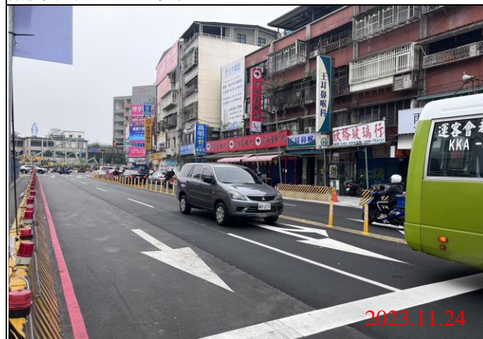
巡查日期地點：112.11.24/ Y21車站 照片說明：路面狀況