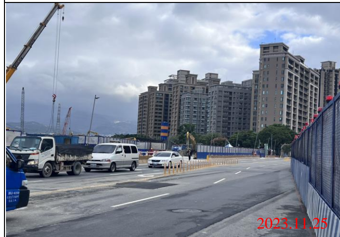
巡查日期地點：112.11.25/ Y22車站 照片說明：路面狀況