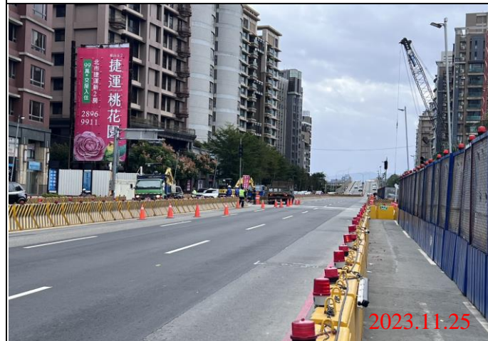
巡查日期地點：112.11.25/ Y23車站 照片說明：路面狀況