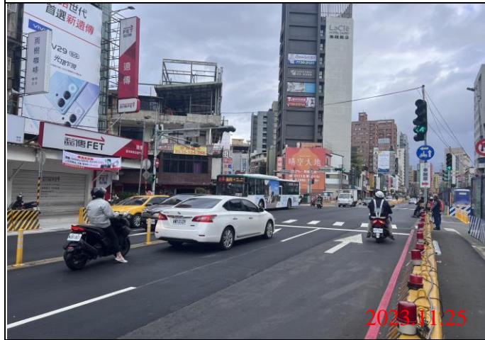
巡查日期地點：112.11.25/ Y21車站 照片說明：路面狀況