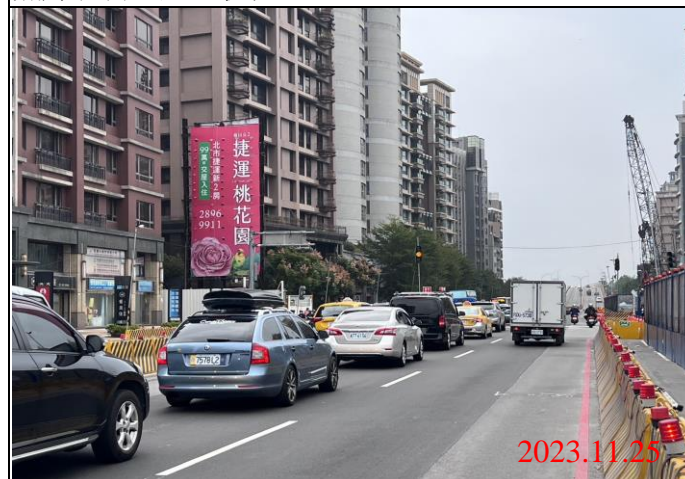
巡查日期地點：112.11.25/ Y23車站 照片說明：路面狀況