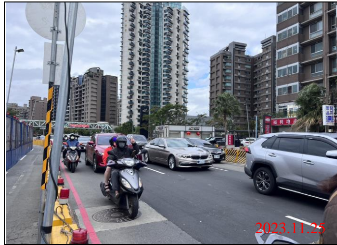
巡查日期地點：112.11.25/ Y23車站 照片說明：路面狀況