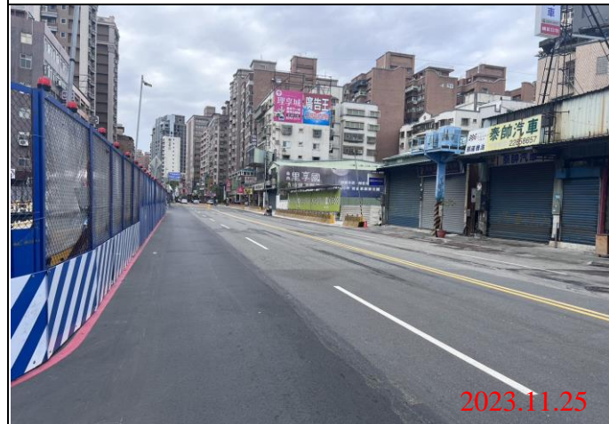
巡查日期地點：112.11.25/ Y22車站 照片說明：路面狀況