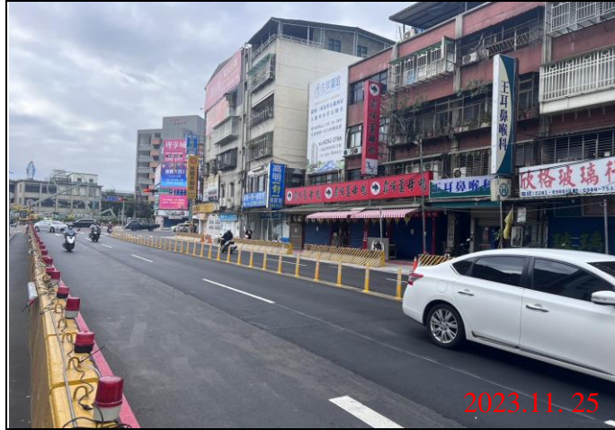
巡查日期地點：112.11.25/ Y21車站 照片說明：路面狀況