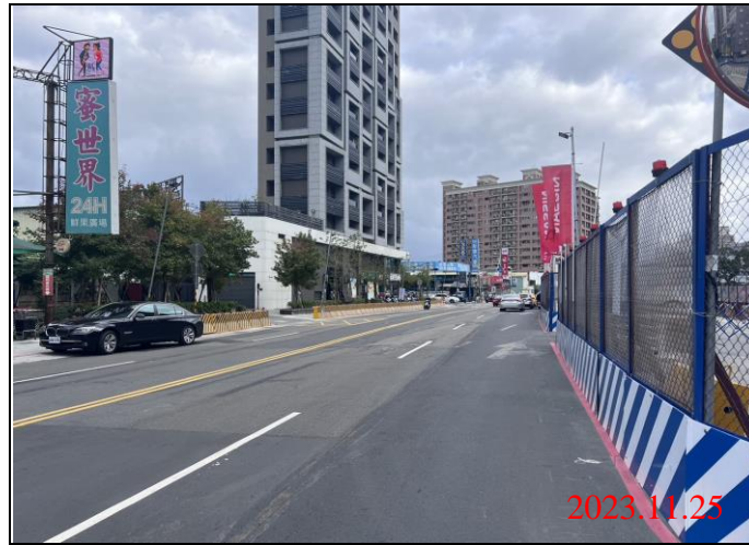
巡查日期地點：112.11.25/ Y22車站 照片說明：路面狀況