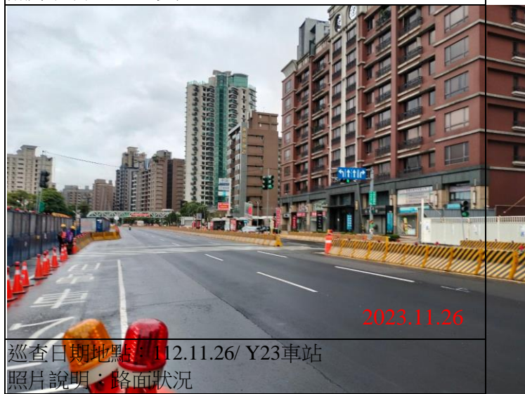
巡查日期地點：112.11.26/ Y23車站 照片說明：路面狀況