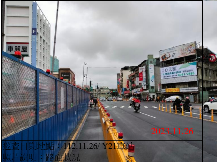
巡查日期地點：112.11.26/ Y21車站 照片說明：路面狀況