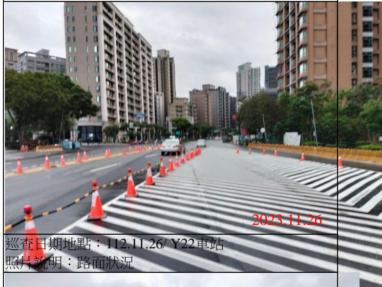
巡查日期地點：112.11.26/ Y22車站 照片說明：路面狀況