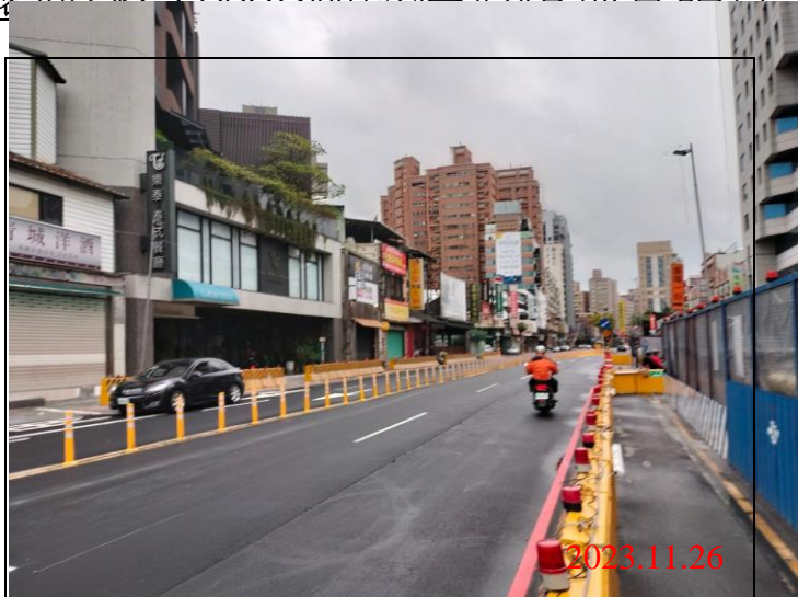
巡查日期地點：112.11.26/ Y21車站 照片說明：路面狀況