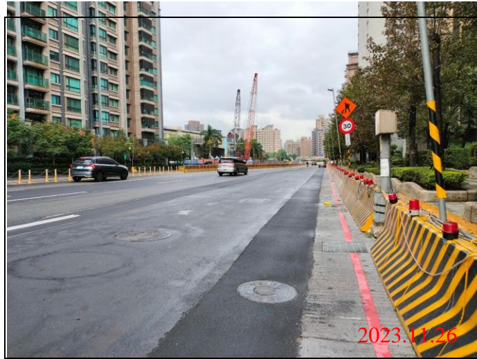
巡查日期地點：112.11.26/ Y23車站 照片說明：路面狀況