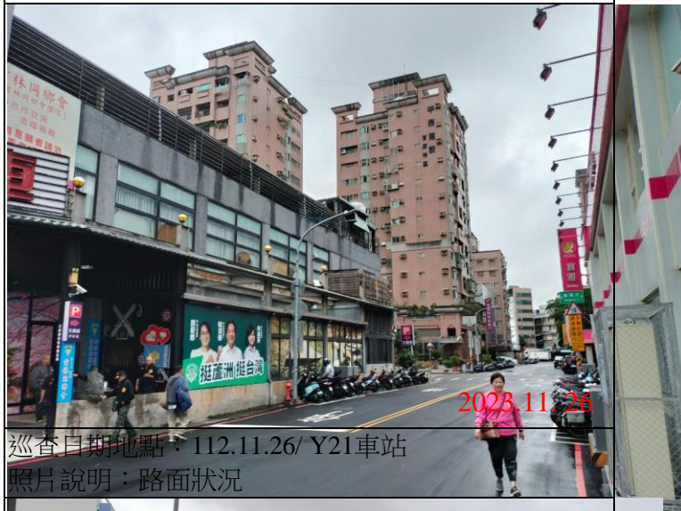
巡查日期地點：112.11.26/ Y21車站 照片說明：路面狀況