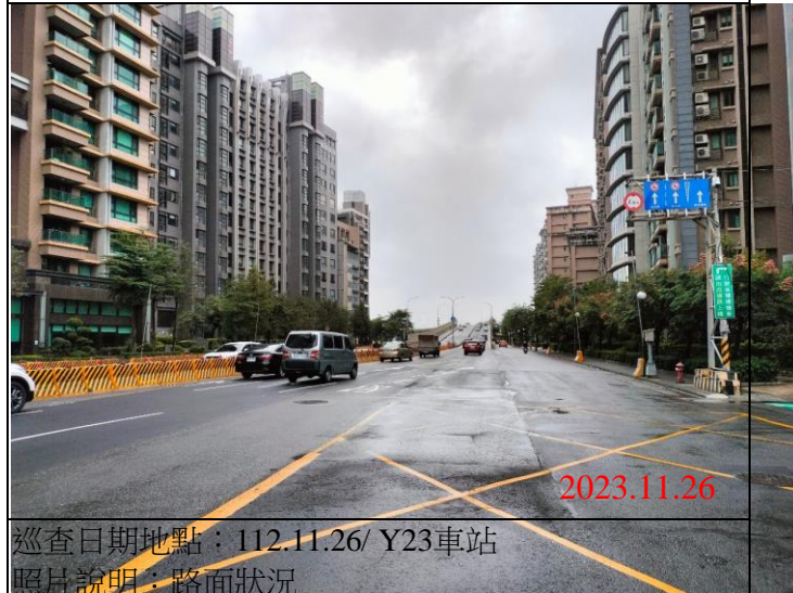
巡查日期地點：112.11.26/ Y23車站 照片說明：路面狀況