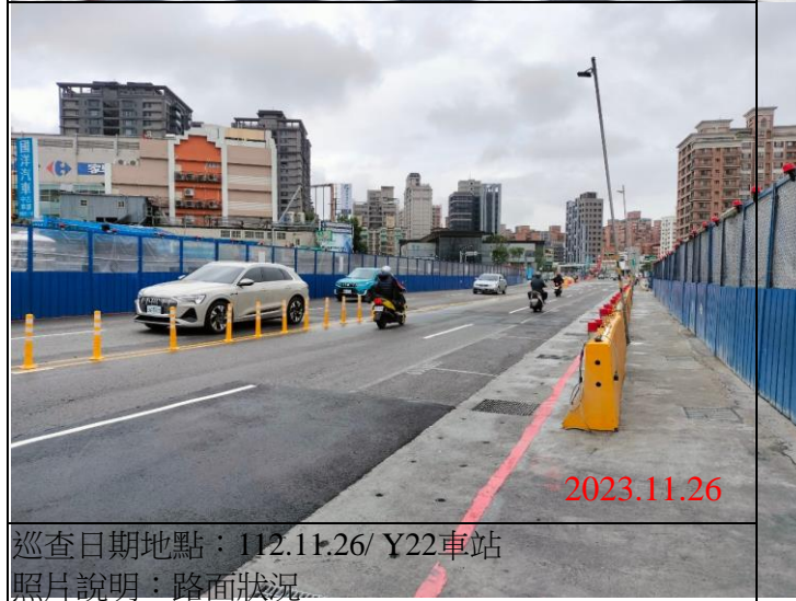
巡查日期地點：112.11.26/ Y22車站 照片說明：路面狀況