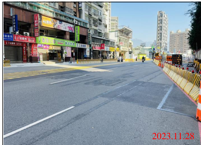
巡查日期地點：112.11.28/ Y22車站 照片說明：路面狀況