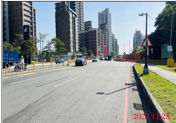
巡查日期地點：112.11.28/ Y23車站 照片說明：路面狀況