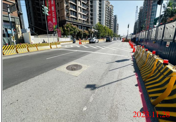
巡查日期地點：112.11.28/ Y23車站 照片說明：路面狀況