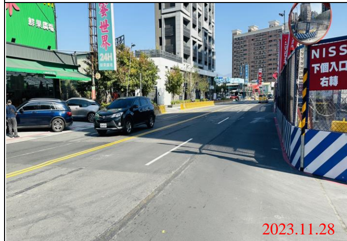
巡查日期地點：112.11.28/ Y22車站 照片說明：路面狀況