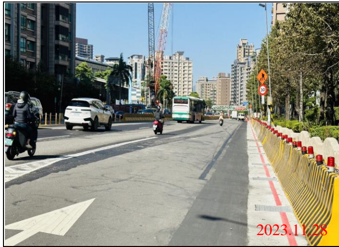
巡查日期地點：112.11.28/ Y23車站 照片說明：路面狀況