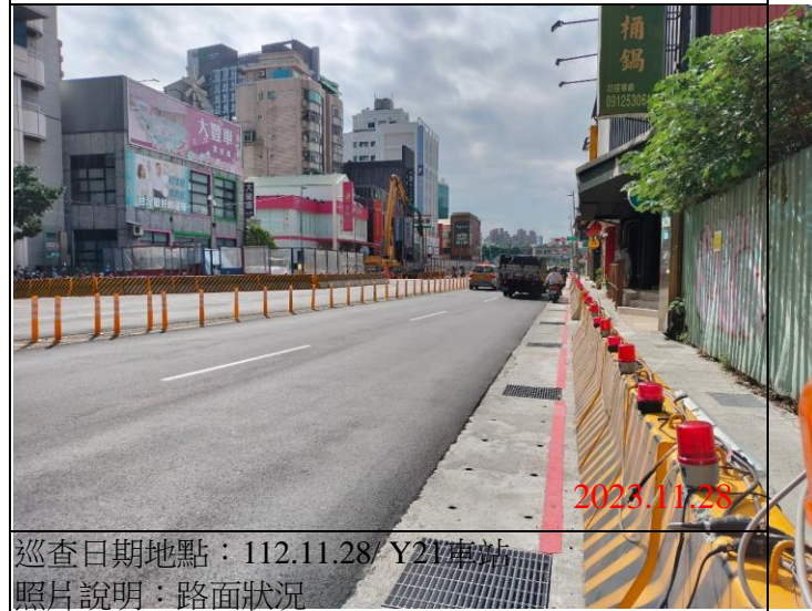
巡查日期地點：112.11.28/ Y21車站 照片說明：路面狀況