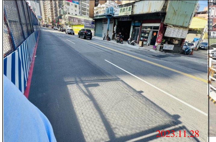
巡查日期地點：112.11.28/ Y22車站 照片說明：路面狀況