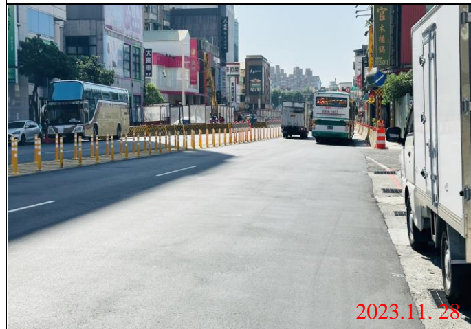
巡查日期地點：112.11.28/ Y21車站 照片說明：路面狀況